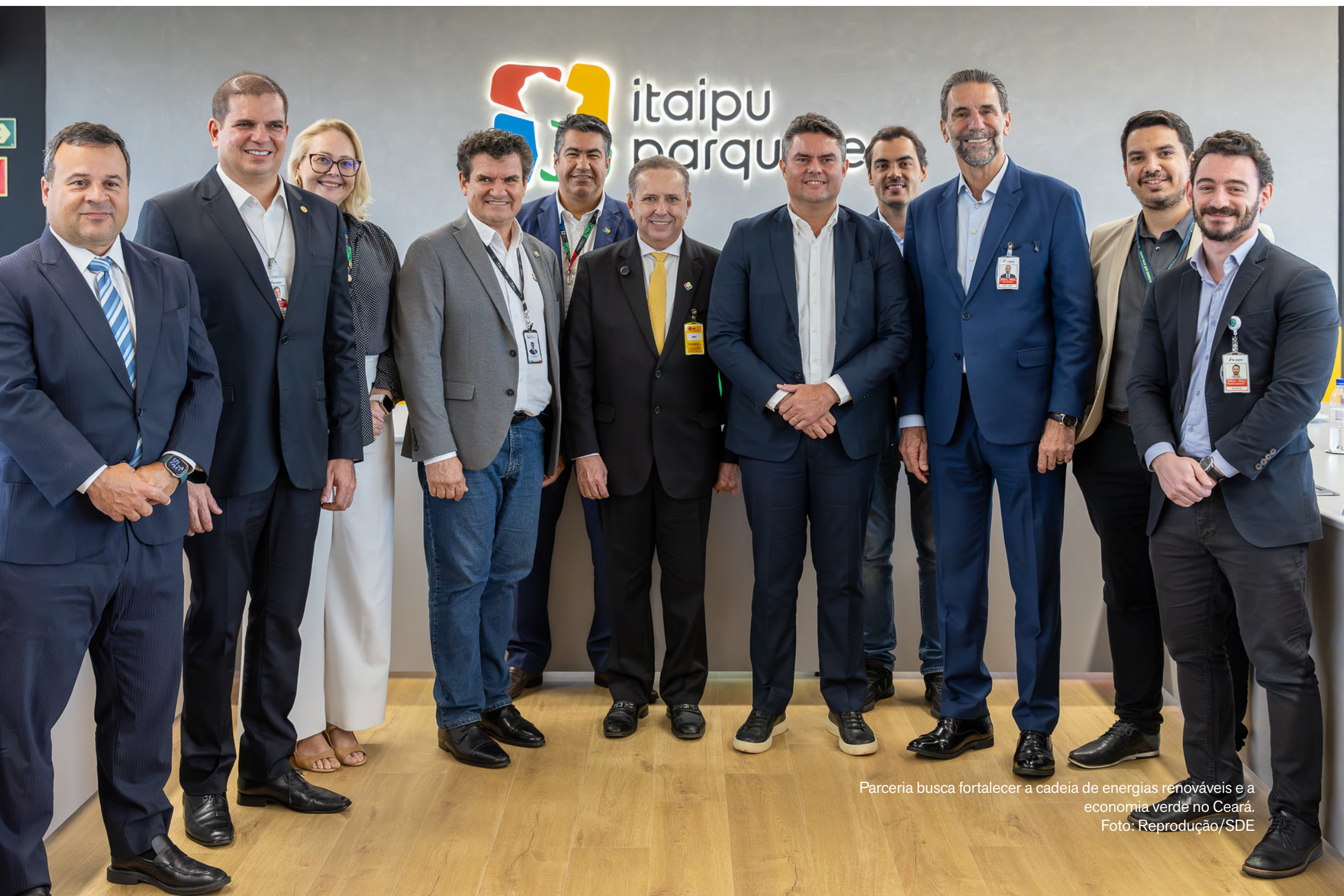
Parceria busca fortalecer a cadeia de energias renováveis e a economia verde no Ceará.