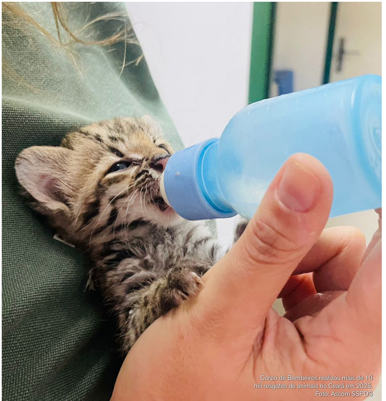
Corpo de Bombeiros realizou mais de 10 mil resgates de animais no Ceará em 2025.

Em 2025, as denúncias de maus-tratos a animais corresponderam a 21,4% das 13.282 informações recebidas pelo Disque 181 em todo o Estado. O tráfico de drogas liderou o ranking, com 4.839 denúncias, o equivalente a 36,4% do total. Na sequência, apare-