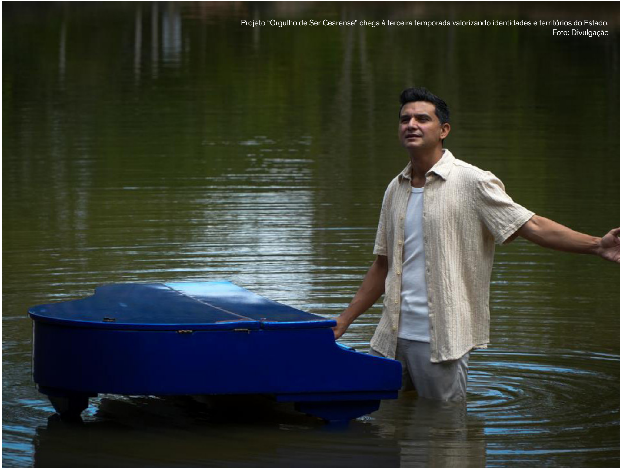
Projeto “Orgulho de Ser Cearense” chega à terceira temporada valorizando identidades e territórios do Estado.