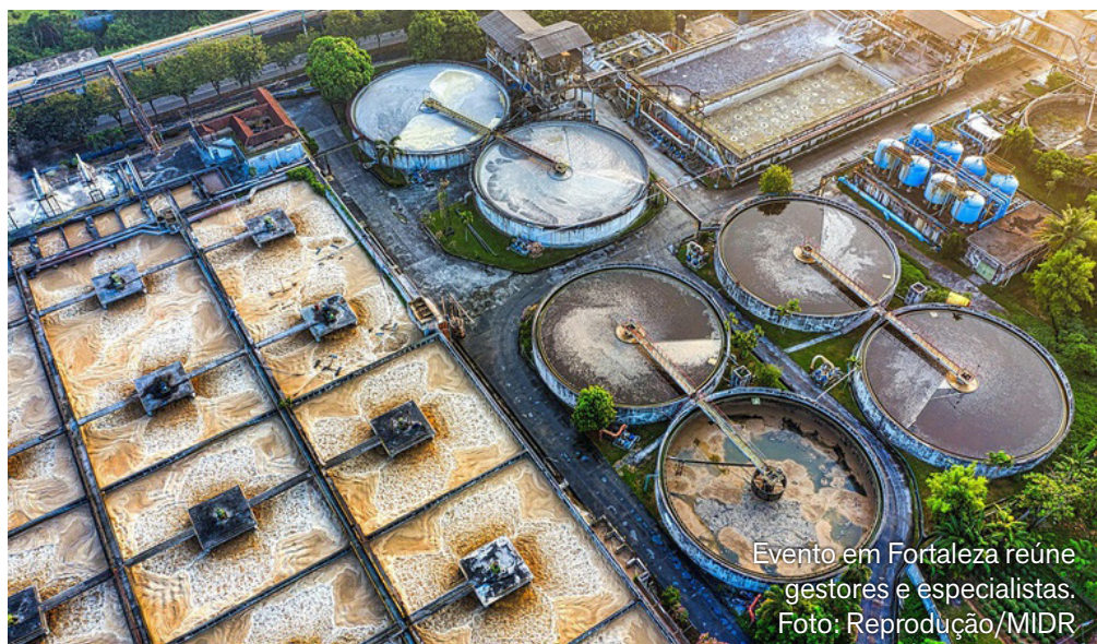
Evento em Fortaleza reúne gestores e especialistas.

Fortaleza recebe, nos dias 25 e 26 de fevereiro, um evento voltado ao debate de soluções em concessões e parcerias público-privadas (PPPs) com foco no desenvolvimento regional. A iniciativa é promovida pelo Ministério da Integração e do Desenvolvimento Regional (MIDR) e acontece no auditório da Secretaria da Fazenda do Estado do Ceará (Sefaz-CE), reunindo gestores públicos, técnicos e especialistas da área.