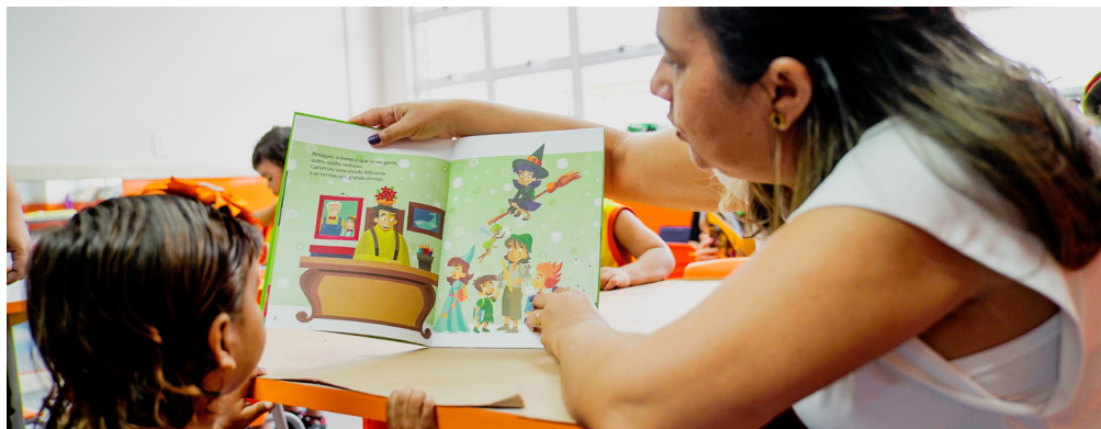
Emancipação será implantada de forma escalonada a partir de março.

Atualmente, esses CEIs funcionam vinculados a escolas patrimoniais, modelo que faz com que parte das demandas administrativas dependa da estrutura da escola de referência. Na prática, as unidades contam principalmente com coordenadores pedagógicos, responsáveis pelo acompanhamento educacional, mas sem uma equipe completa de gestão para lidar com as rotinas diárias de organização,