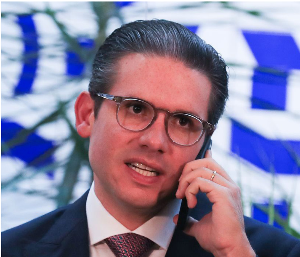
Mota anunciou envio do texto para comissão.

“Vamos ouvir todos os setores com equilíbrio e responsabilidade para entregar a melhor lei para os brasileiros. O mundo avançou, principalmente na área tecnológica, e o Brasil não pode ficar para trás”, afirmou Motta por meio de suas redes sociais.