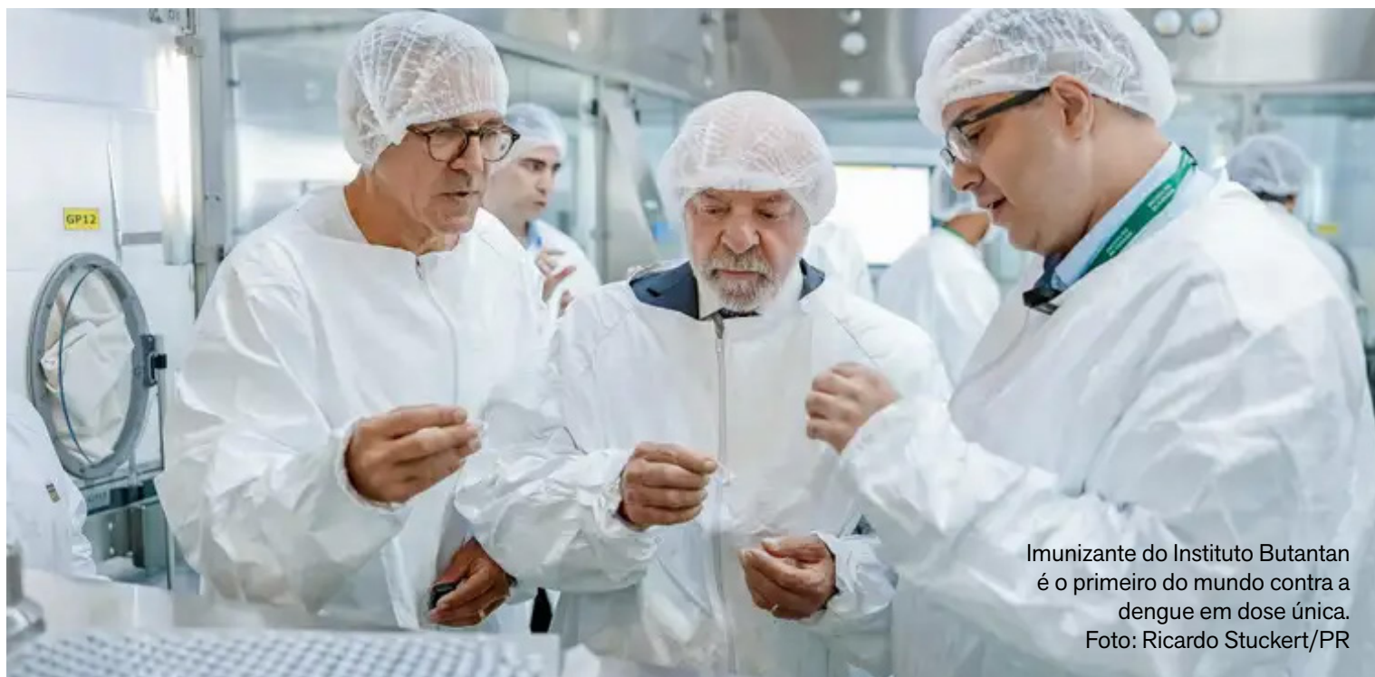
Imunizante do Instituto Butantan é o primeiro do mundo contra a dengue em dose única.

A Butantan-DV utiliza a tecnologia de vírus vivo atenuado, a mesma empregada em outras vacinas já consolidadas no Brasil, como as da febre