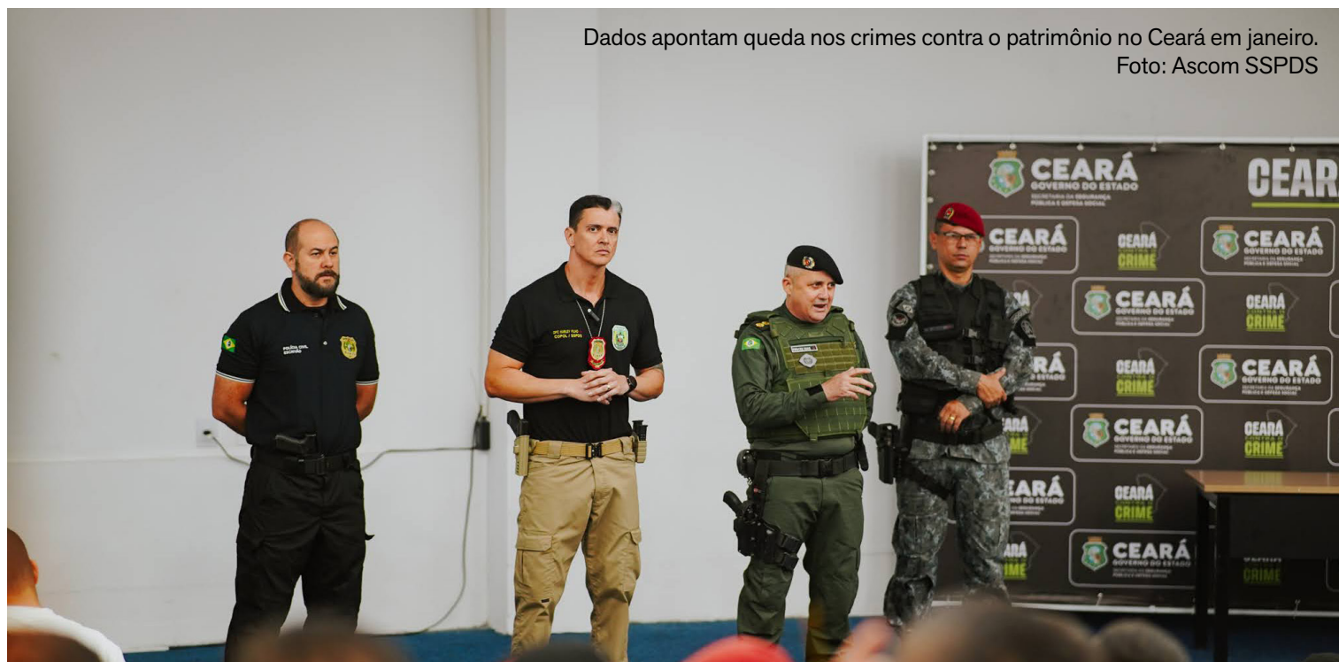
Dados apontam queda nos crimes contra o patrimônio no Ceará em janeiro.

Operação cumpre mandados de prisão, realiza abordagens e já resulta em capturas e prisões em flagrante