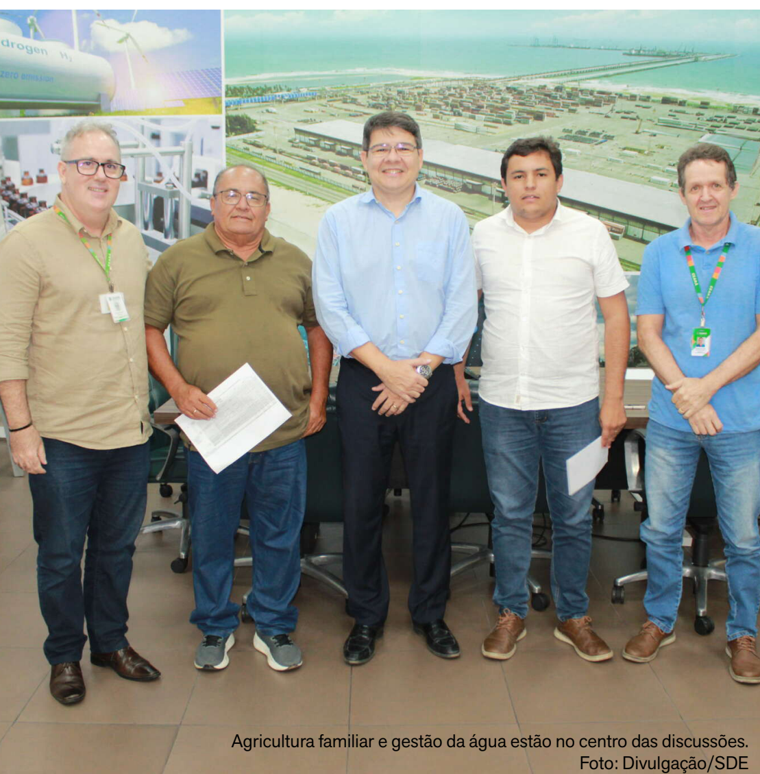
Agricultura familiar e gestão da água estão no centro das discussões.

No primeiro mês deste ano, foram registradas 1.358 ocorrências, contra 2.355 no mesmo período de 2025. Segundo o levantamento, janeiro de 2026 apresentou o menor número de registros da série histórica no estado, considerando Fortaleza, Região Metropolitana e Interior Sul.