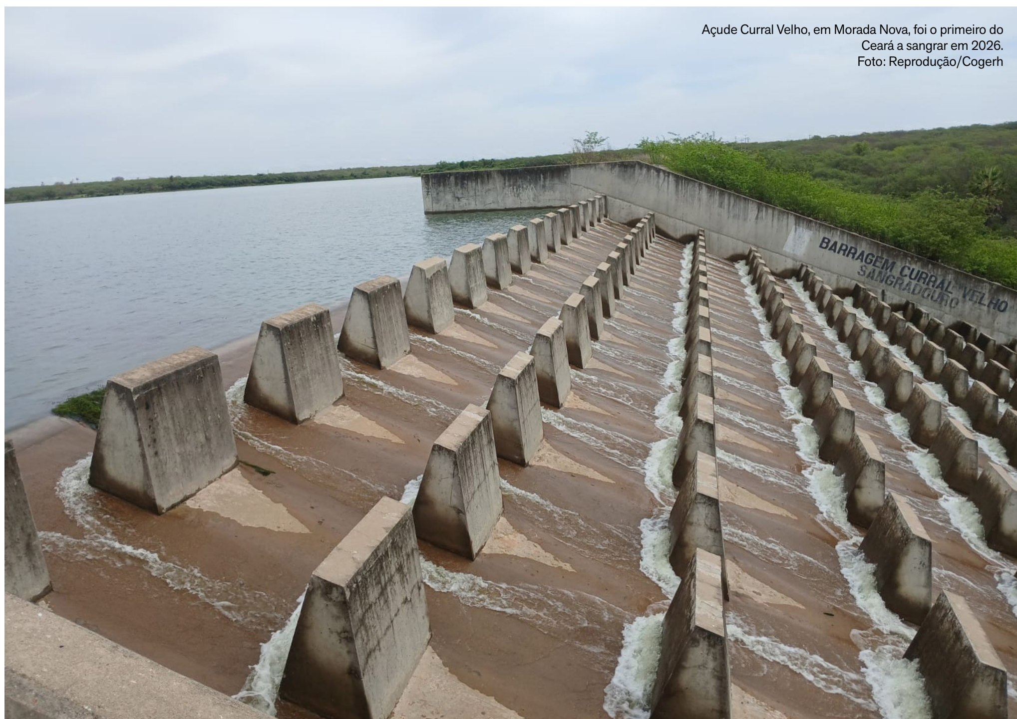
Açude Curral Velho, em Morada Nova, foi o primeiro do Ceará a sangrar em 2026.

Açude Curral Velho foi o primeiro reservatório do Estado a sangrar em 2026; volume total dos açudes cearenses segue abaixo do registrado no mesmo período do ano passado