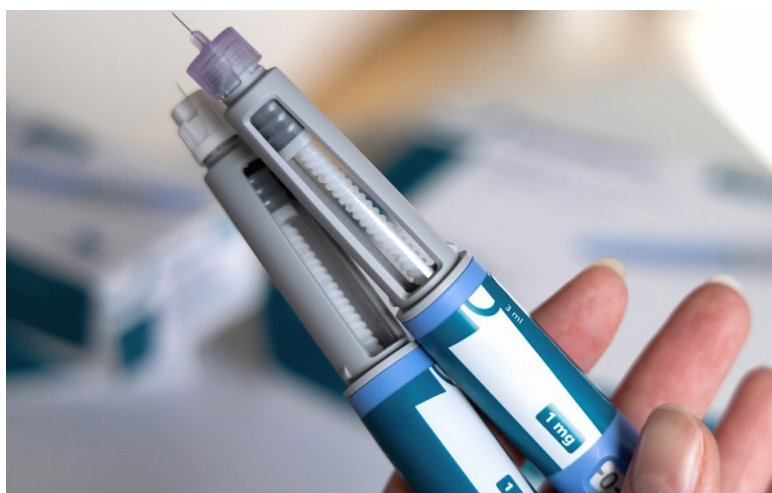
Agência reforça que medicamentos à base de GLP-1 devem ser usados apenas com prescrição.

A Agência Nacional de Vigilância Sanitária (Anvisa) emitiu, nesta segunda-feira (9), em Brasília, um alerta de farmacovigilância sobre os riscos associados ao uso inadequado de medicamentos agonistas do receptor GLP-1, popularmente conhecidos