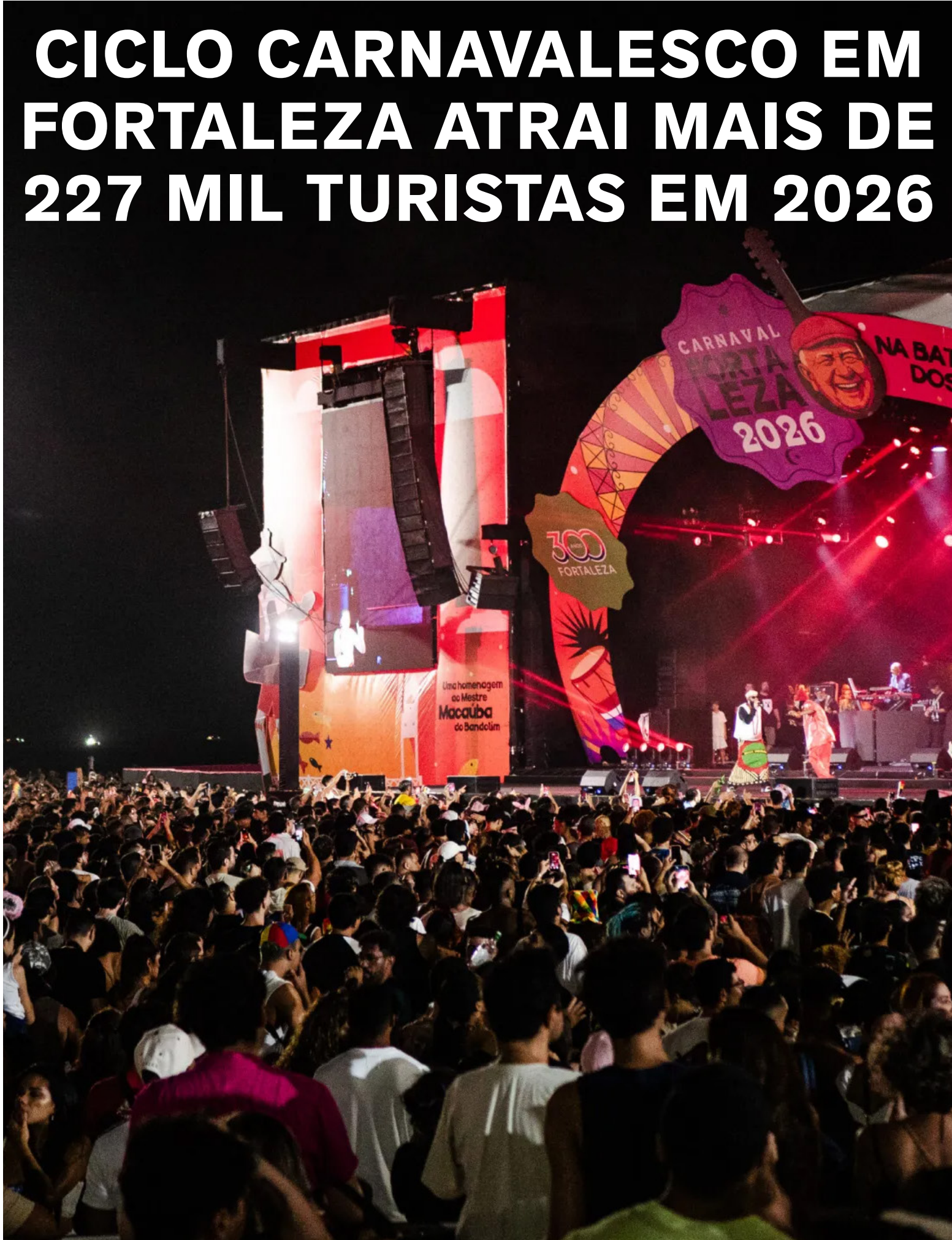
Festa descentralizada e grandes shows no aterro.

Receita total gerada pela atividade turística durante o Ciclo Carnavalesco de 2026 deve chegar a cerca de R$ 1,15 bilhão; próximo fim de semana é o último do pré-carnaval da Prefeitura de Fortaleza ECONOMIA, P. 9