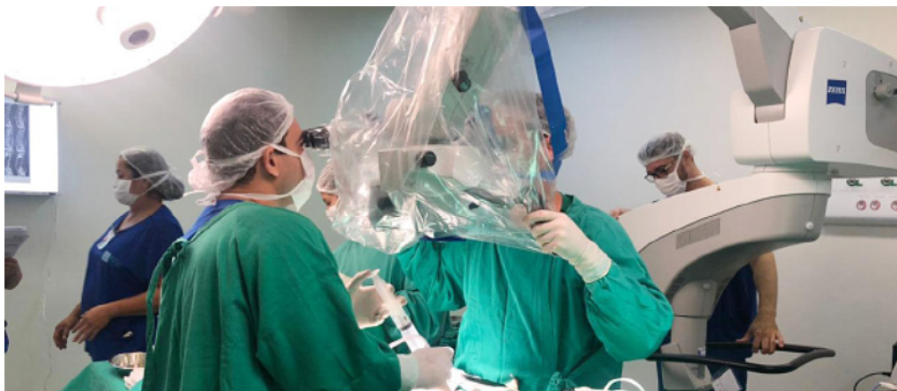
103 médicos já atuam pelo programa em áreas como Anestesiologia, Cirurgia Geral e Radiologia, atendendo diferentes municípios.

O Ministério da Saúde (MS) abriu inscrições para o segundo ciclo do Mais Médicos Especialistas, iniciativa do programa Agora Tem Especialistas, que busca ampliar o acesso ao atendimento especializado no Sistema Único de Saúde (SUS). No Ceará, há 86 vagas imediatas em serviços hospitalares e