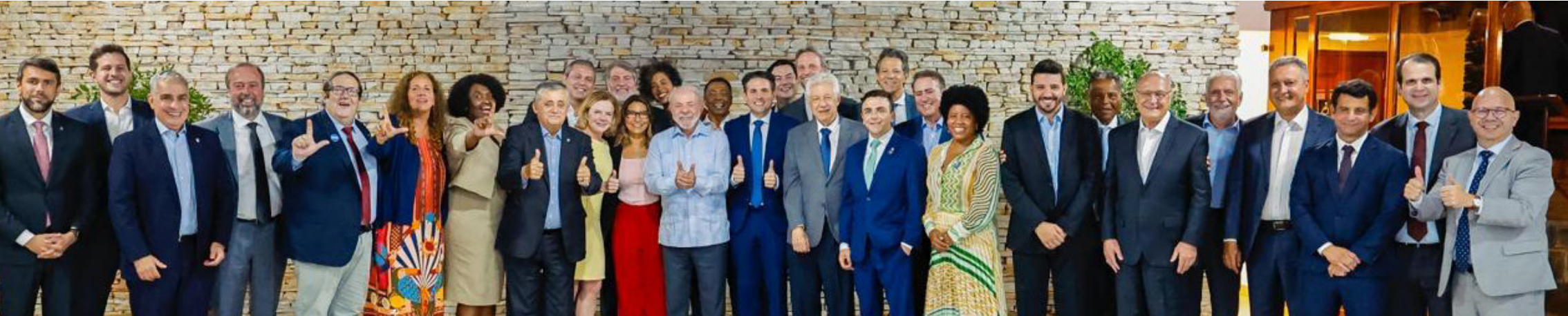
Durante a confraternização, Lula agradeceu o apoio recebido do Legislativo ao longo de 2025 e demonstrou confiança na condução das votações previstas para o próximo ano.

O presidente também fez gestos públicos de aproximação a Hugo Motta. Em determinado momento, solidariizou-se com os “momentos difíceis” enfrentados pelo comando da Câmara, lembrando que também já passou por situações semelhantes, e afirmou que sua mão está “estendida” ao deputado paraibano. O aceno ocorre meses após Motta enfrentar episódios de tensão no plenário, com ocupações forçadas da tribuna por parlamentares bolsonaristas e de esquerda, em ocasiões distintas, o que gerou debates sobre o enfraquecimento da presidência da Casa. Em resposta, Hugo Motta adotou um discurso descrito como fraterno, porém protocolar, sinalizando disposição para colaborar com o Governo Federal nesta reta final de mandato. A troca de gentilezas reforçou, entre alguns presentes, a percepção de um alinhamento político visando as eleições de 2026. “Se eu pudesse apostar, diria que Motta já escolheu seu lado. A fala do Lula para ele foi de quem já está afinado”, afirmou um parlamentar, sob condição de anonimato, ao Valor Econômico.