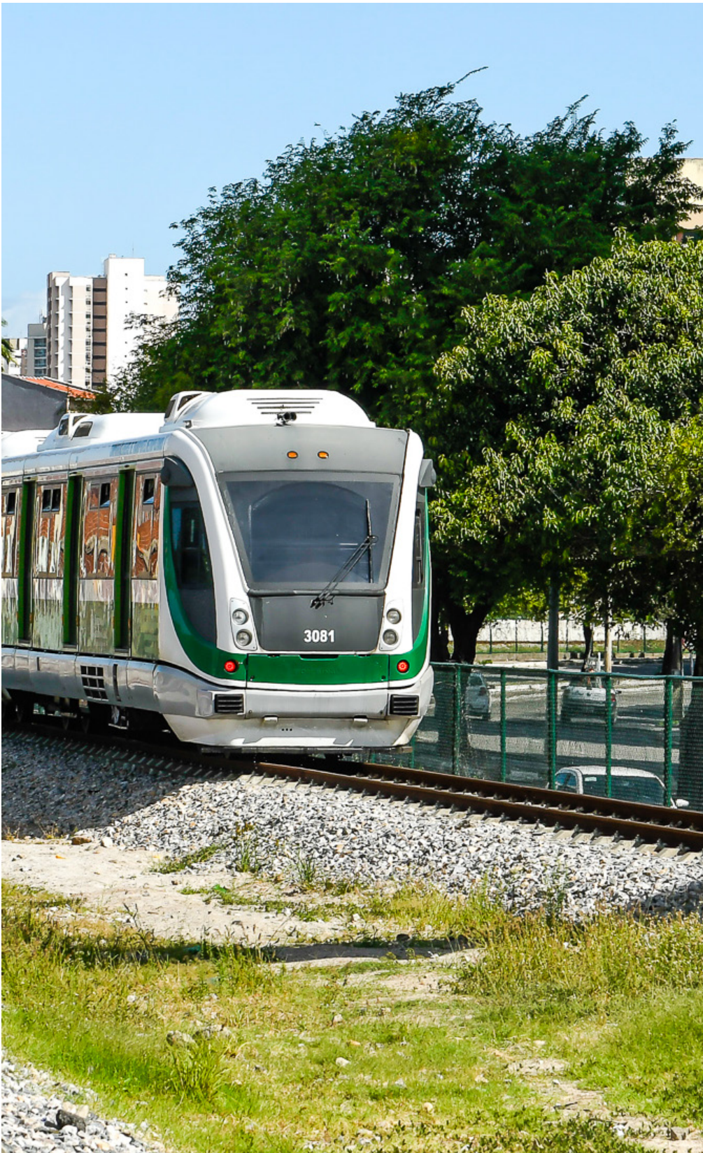
Será realizada uma viagem inaugural entre a estação Expedicionários e a nova estação Aeroporto.