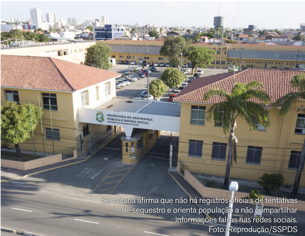
Secretaria afirma que não há registros oficiais de tentativas de sequestro e orienta população a não compartilhar informações falsas nas redes sociais.

do programa FORTaleCE, iniciativa de cooperação entre o Governo do Estado do Ceará e a Prefeitura de Fortaleza. O programa reúne intervenções em áreas estratégicas como mobilidade urbana, educação, segurança pública e moradia, com foco no desenvolvimento da Capital. Durante a solenidade desta sexta-feira, será realizada uma viagem inaugural entre a estação Expedicionários e a nova estação Aeroporto, marcando oficialmente o início da operação do ramal.