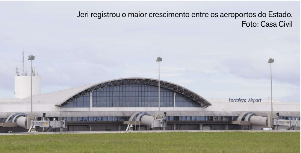
Jeri registrou o maior crescimento entre os aeroportos do Estado.

Os aeroportos do Ceará fecharam 2025 com quase 7 milhões de passageiros e confirmaram um dos melhores momentos da aviação e do turismo no Estado. Dados divulgados pela Secretaria do Turismo do Ceará (Setur) apontam que 6.928.914 pessoas passaram pelos terminais cearenses ao longo do ano, um avanço de 9,2% em relação a 2024.