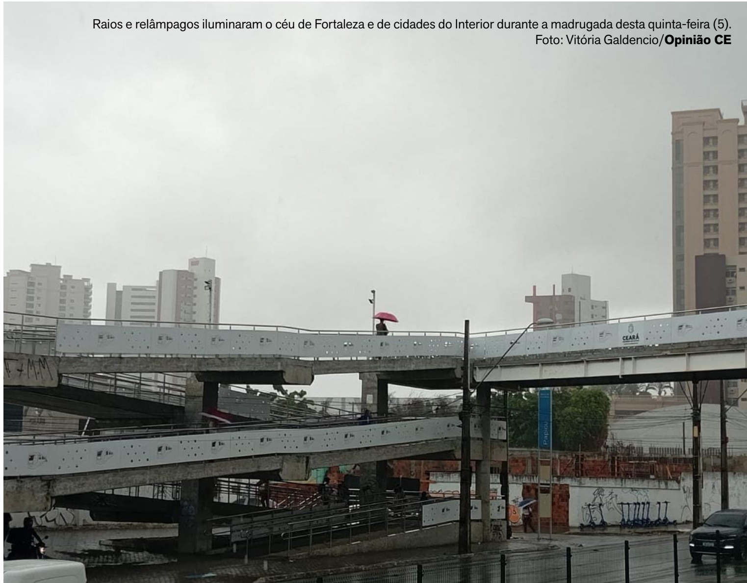
Raios e relâmpagos iluminaram o céu de Fortaleza e de cidades do Interior durante a madrugada desta quinta-feira (5).

A Funceme explica que o Ceará deve registrar variação de nebulosidade, temperaturas elevadas e aumento das condições para chuva nos próximos dias. A tendência é de precipitações mais amplas entre quinta (5) e sexta-feira (6), com possibilidade de eventos de intensidade moderada a forte em diferentes regiões do Estado. “Imagem do satélite Goes-19, captada às 8h40 (horário local), já indicava,