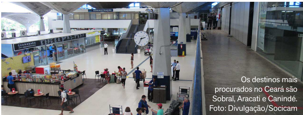
Os destinos mais procurados no Ceará são Sobral, Aracati e Canindé.

A Socicam, empresa que administra os terminais rodoviários de Fortaleza, estima que mais de 55 mil pessoas devem embarcar, da capital cearense, rumo a destinos intermunicipais e interestaduais, entre os dias 12 e 18 de fevereiro. O número representa um aumento de 24% em relação à média de movimentação. Em relação ao período carnavalesco de 2025, a expectativa é de um crescimento de 3% no total de viajantes que irão se deslocar para cidades do interior do Ceará e para outros estados. Newton Fialho, gerente da Socicam, afirma que os dias de maior movimento deverão ser a sexta-feira (13), com cerca de 9.040 passageiros, e a quarta-feira (18), com 8.944. Os dados são de acordo com as