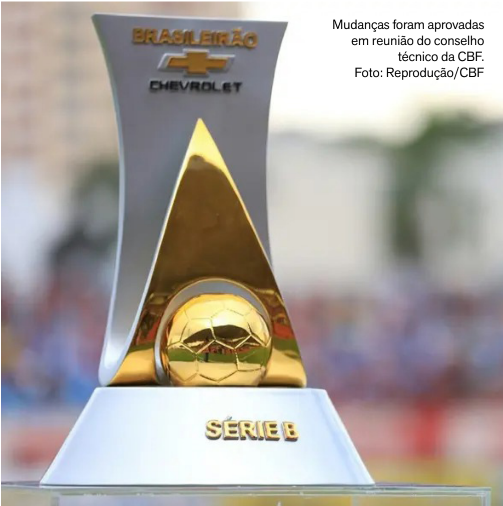
Mudanças foram aprovadas em reunião do conselho técnico da CBF.

A mudança passa a valer já na próxima edição do campeonato. A Série B de 2026 tem previsão para começar em março, logo após o encerramento dos campeonatos estaduais, inaugurando uma nova dinâmica na briga pelo acesso à Série A.