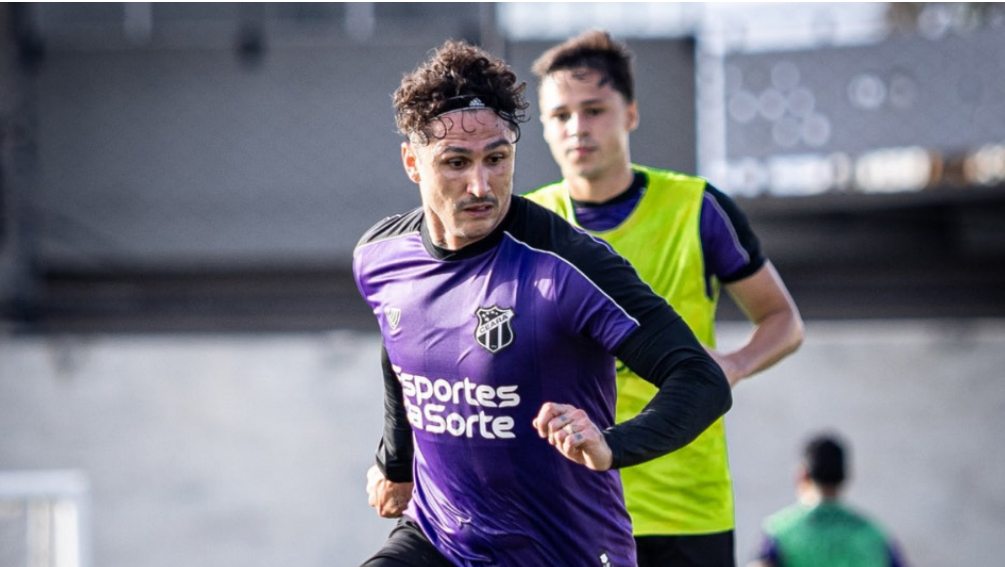
Fortaleza e Ceará se preparam para o primeiro clássico do ano.

Fortaleza e Ceará entram em campo neste domingo (8), às 18h, na Arena Castelão, em partida válida pelo Campeonato Cearense. Para assegurar maior fluidez no trânsito e segurança aos torcedores, a Autarquia Municipal de Trânsito e Cidadania (AMC) montará uma operação especial no entorno da praça esportiva, com a mobilização de 40 agentes e orientadores de tráfego.