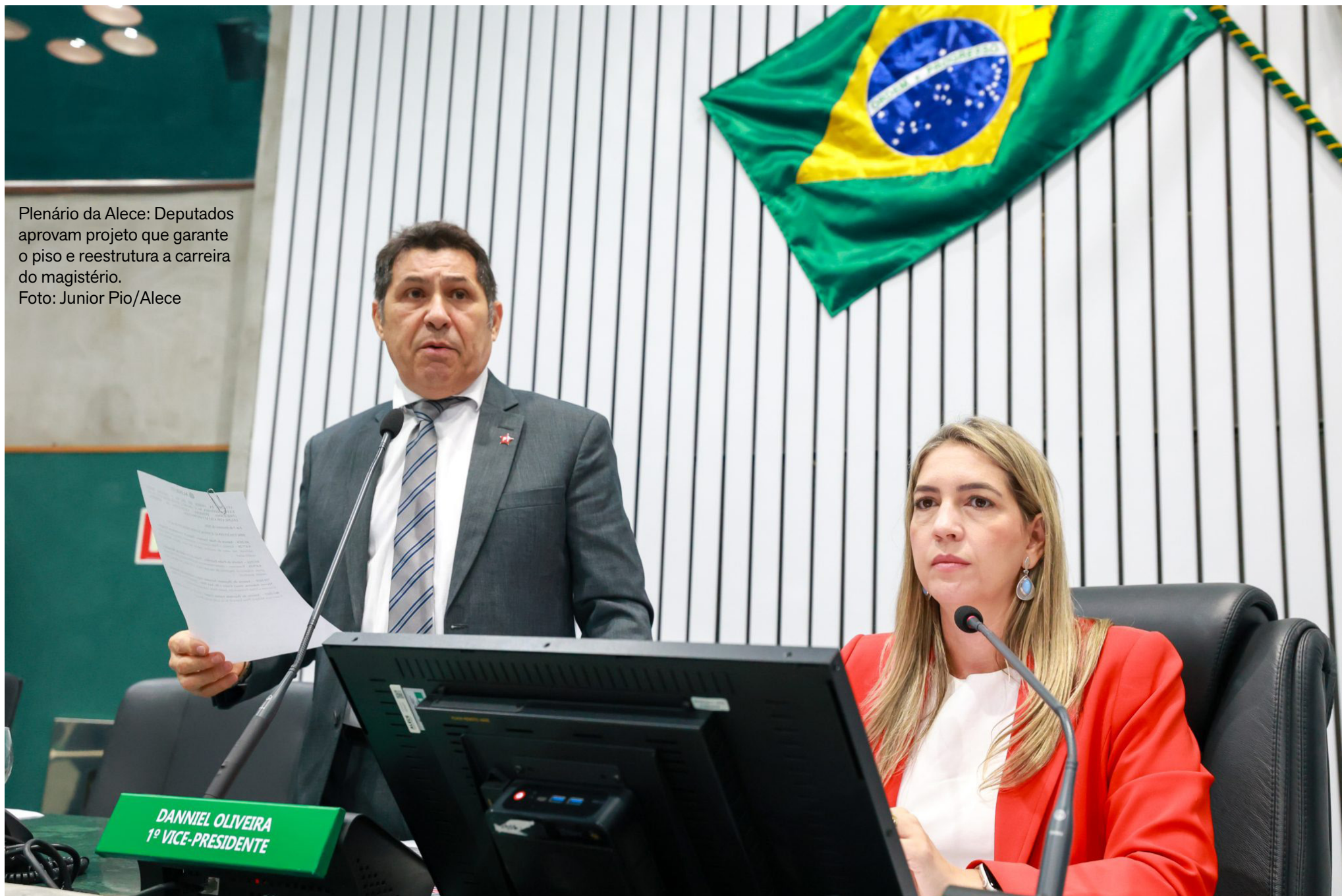
Plenário da Alece: Deputados aprovam projeto que garante o piso e reestrutura a carreira do magistério.

Por fim, Elmano informou que o Governo do Estado irá intensificar o diálogo com o Governo Federal para tentar antecipar o pagamento dos precatórios do Fundef, previstos para dezembro de 2026, para o primeiro semestre do mesmo ano. Com a aprovação na Alece, o projeto segue agora para sanção do governador, consolidando um dos principais pacotes de valorização do magistério da história recente da educação cearense.