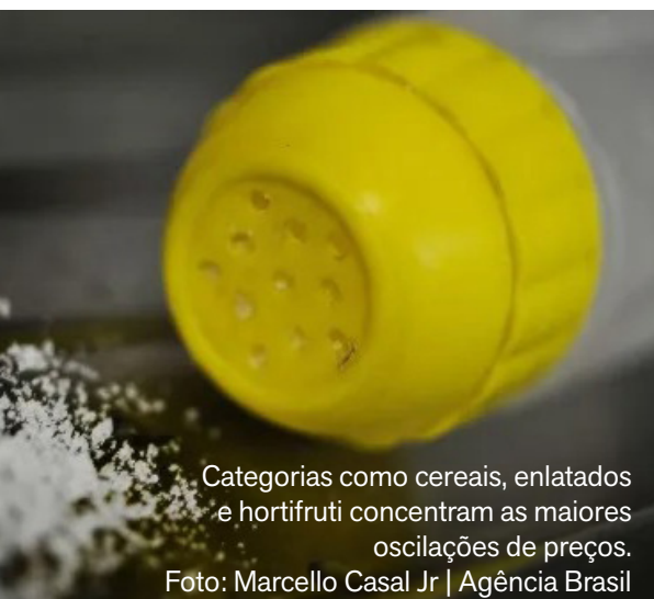
Categorias como cereais, enlatados e hortifruti concentram as maiores oscilações de preços.

A primeira pesquisa de preços de 2026 realizada pelo Departamento Municipal de Proteção e Defesa dos Direitos do Consumidor (Procon Fortaleza) nos supermercados da capital revelou diferenças expressivas entre os valores praticados para produtos básicos. O levantamento, divulgado nesta quinta-feira (5), identificou variação de até 596% entre itens analisados, com destaque para o preço do sal de 1 kg, encontrado a R$ 0,99 em bairros como Siqueira e Mondubim, enquanto chegou a R$ 6,89 em estabelecimentos da Aldeota.