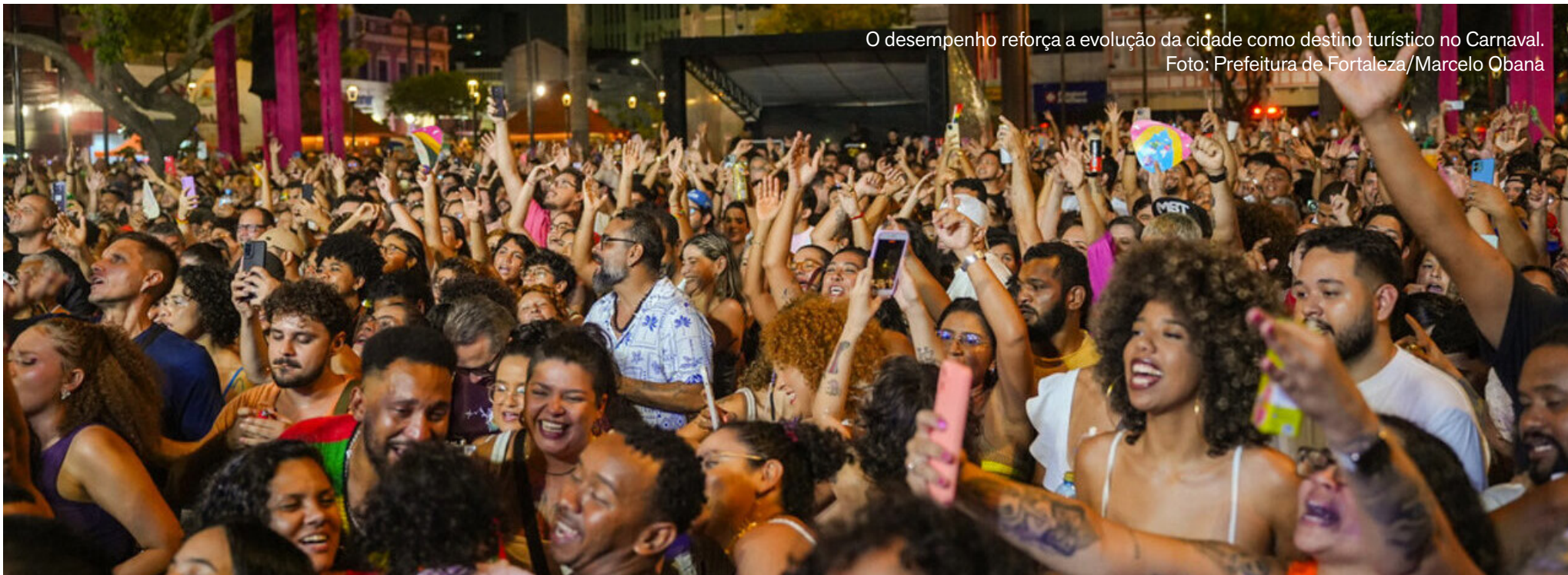
O desempenho reforça a evolução da cidade como destino turístico no Carnaval.

da cidade como destino turístico no Carnaval. Levantamento recente da plataforma de buscas de viagens Kayak indica Fortaleza como o sétimo destino mais procurado pelos viajantes para o feriado prolongado. Entre os principais atrativos citados estão o clima favorável, as praias urbanas e a ampla oferta de eventos ao longo do ciclo carnavalesco.