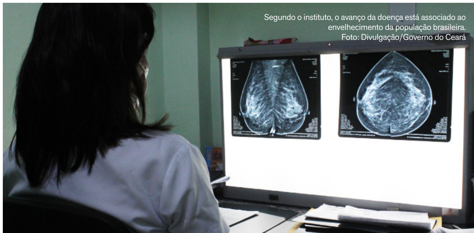
Segundo o instituto, o avanço da doença está associado ao envelhecimento da população brasileira.

O estudo aponta ainda que a incidência dos tipos de câncer varia conforme a região. O câncer de colo do útero apresenta maior ocorrência no Norte e no Nordeste, assim como o