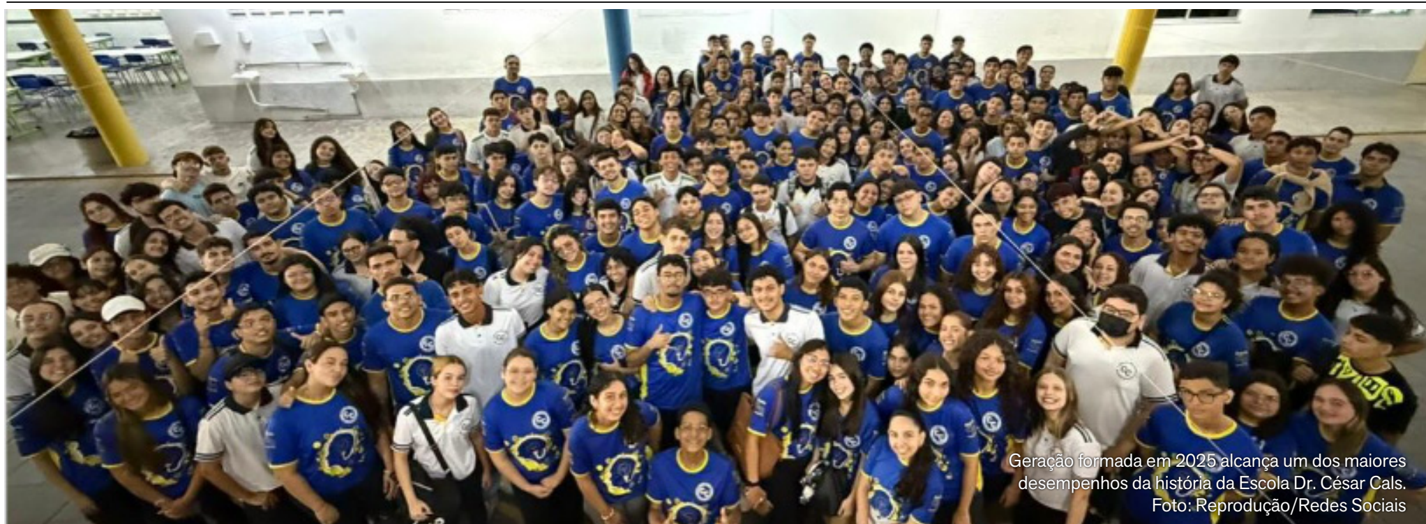
Geração formada em 2025 alcança um dos maiores desempenhos da história da Escola Dr. César Cals.