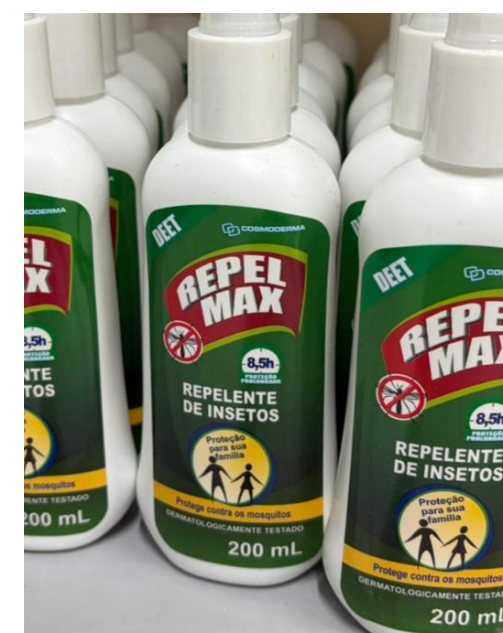
Cada gestante recebe dois frascos de repelente por mês como medida de prevenção às arboviroses.

Também é importante observar o tempo de reaplicação indicado na embalagem e, em caso de dúvidas, buscar orientação junto aos profissionais da unidade de saúde.