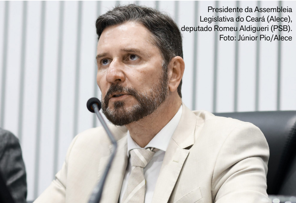
Presidente da Assembleia Legislativa do Ceará (Alece), deputado Romeu Aldigueri (PSB).

O presidente da Assembleia Legislativa do Ceará (Alece), deputado Romeu Aldigueri (PSB), avaliou que o atual cenário apontado pelas pesquisas eleitorais ainda está em fase de acomodação e tende a sofrer mudanças até a consolidação do período eleitoral. Ao comentar pesquisas divulgadas recentemente em âmbito nacional, o parlamentar afirmou que os dados indicam vantagem do campo governista em diferentes projeções, resultado que, segundo ele, já vinha sendo percebido por lideranças políticas. Aldigueri ressaltou ainda que novas pesquisas devem ser publicadas nos próximos meses, o que permitirá uma análise mais consistente do quadro eleitoral.