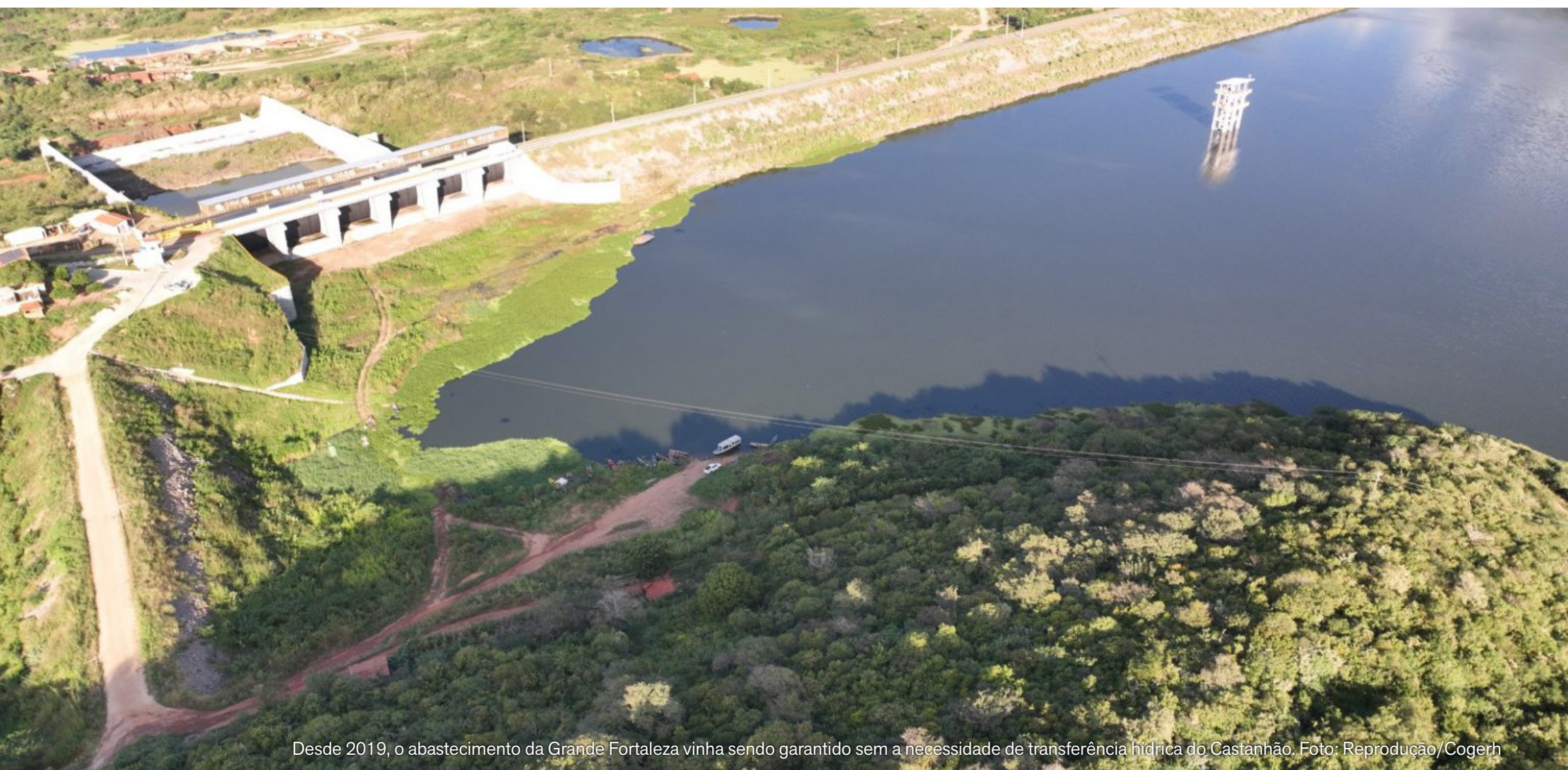
Desde 2019, o abastecimento da Grande Fortaleza vinha sendo garantido sem a necessidade de transferência hídrica do Castanhão.

Região Metropolitana inicia 2026 com redução de 43,8% no índice de mortes violentas