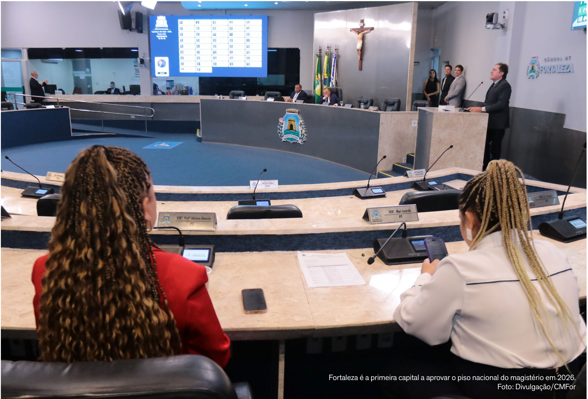
Fortaleza é a primeira capital a aprovar o piso nacional do magistério em 2026.