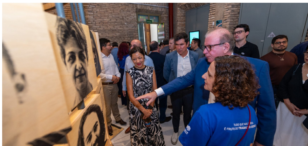
Mostra utiliza vídeos, jogos e recursos audiovisuais para debater passado, presente e futuro das profissões.

Desenvolvida pelo Sesi Lab, museu de arte, ciência e tecnologia vinculado ao Departamento Nacional do Sesi, a exposição propõe uma abordagem não linear sobre o passado, o presente e o futuro das ocupações profissionais. O percurso reúne vídeos, jogos, intervenções audiovisuais e experiências interativas que estimulam o visitante a pensar sobre educação, inovação, competências e adaptação em um cenário marcado por rápidas transformações tecnológicas.