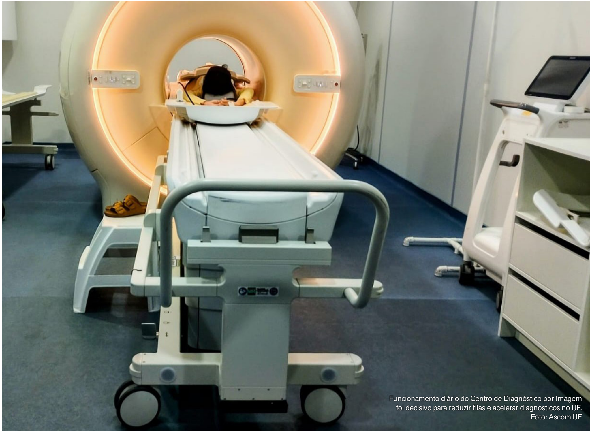
Funcionamento diário do Centro de Diagnóstico por Imagem foi decisivo para reduzir filas e acelerar diagnósticos no IJF.