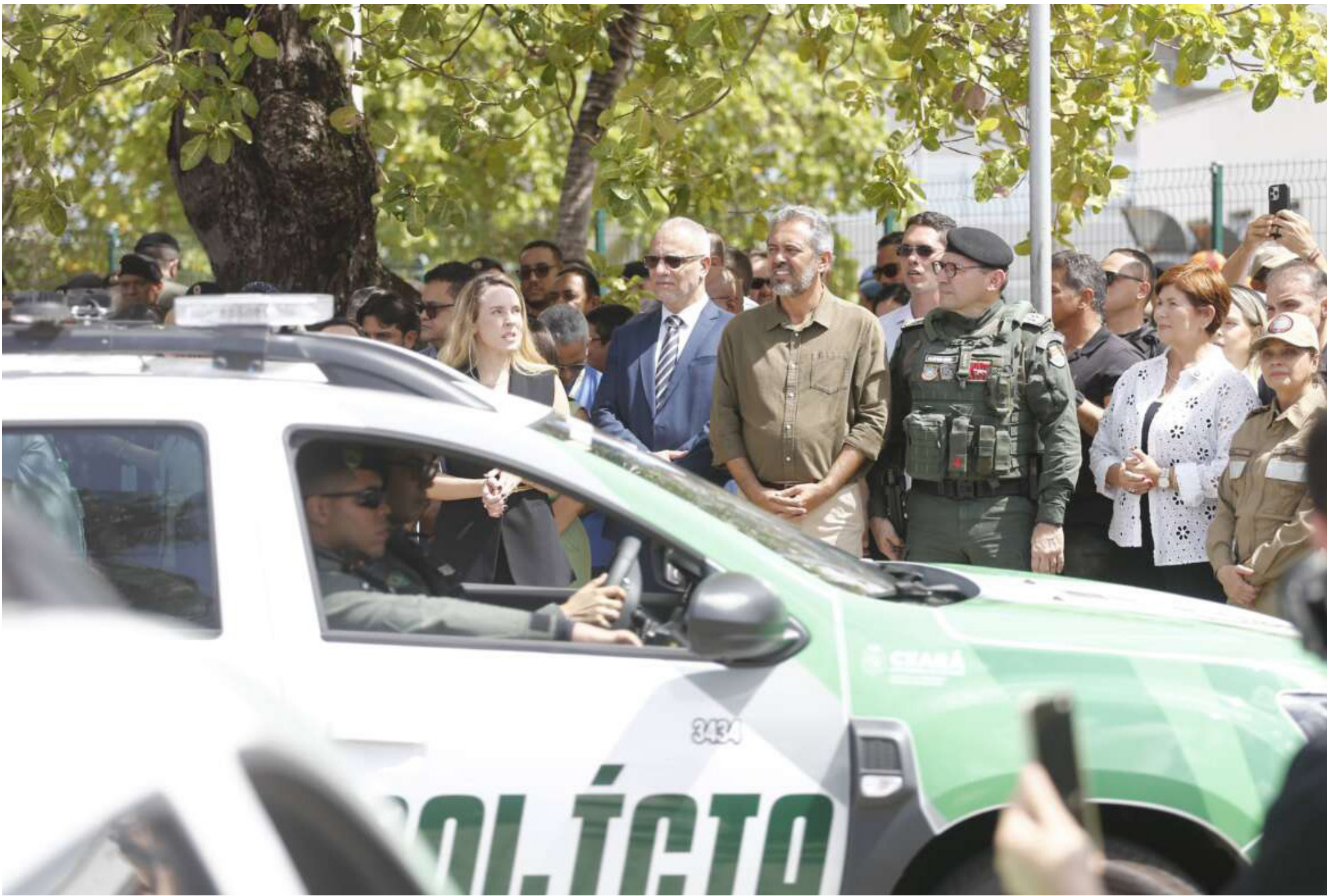
Profissionais das forças de segurança são reconhecidos por resultados no combate à violência no Ceará.

Cerimônia do Misp 2025 reconheceu profissionais e destacou queda de homicídios, avanço nas prisões e integração entre corporações