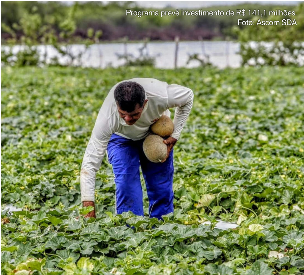
Programa prevê investimento de R$ 141,1 milhões.

No Ceará, o programa tem papel estratégico na segurança econômica de milhares de famílias do campo, especialmente em períodos de instabilidade climática, reforçando a parceria entre União, Estado, municípios e produtores rurais.