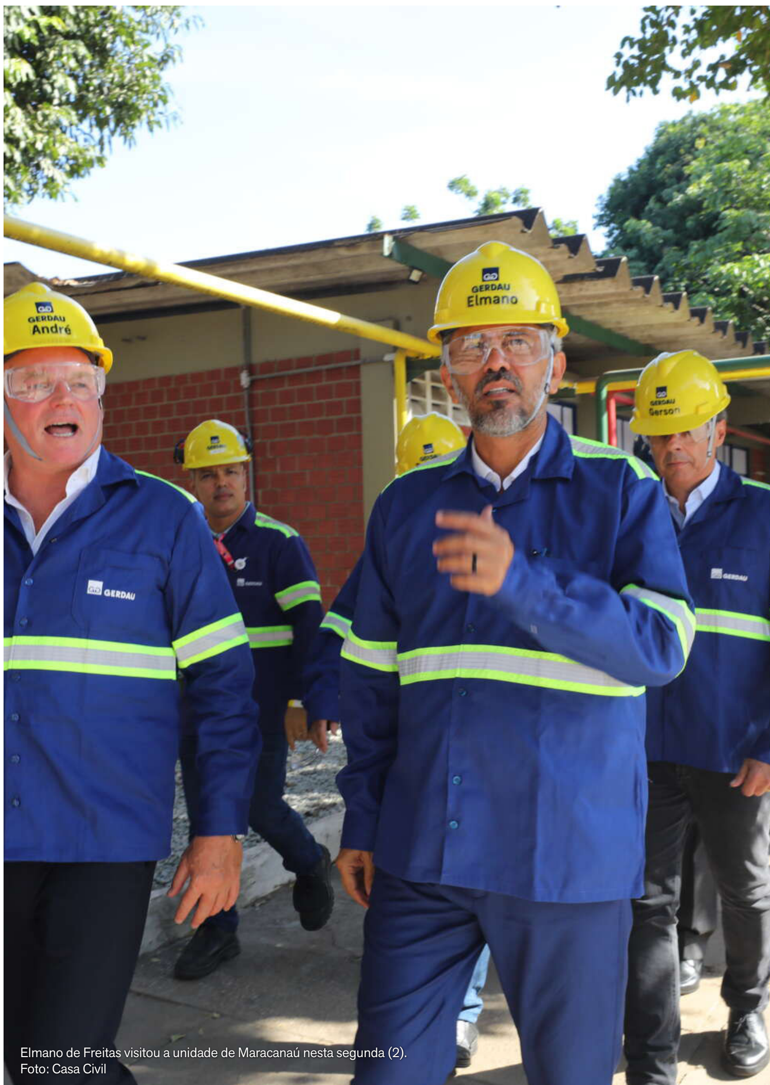
Elmano de Freitas visitou a unidade de Maracanaú nesta segunda (2).

Ao lado do prefeito de Maracanaú, Roberto Pessoa, o governador visitou os últimos ajustes da reforma das instalações do Grupo Gerdau