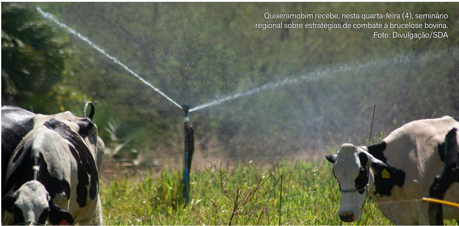
Quixeramobim recebe, nesta quarta-feira (4), seminário regional sobre estratégias de combate à brucelose bovina.

Iniciativa busca alinhar políticas públicas à realidade do produtor rural e fortalecer a sanidade da pecuária no Interior