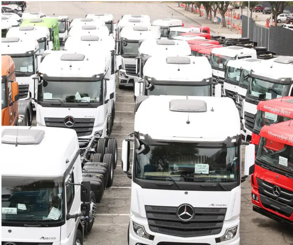
Iniciativa apoia a aquisição de veículos novos menos poluentes.

ambiente de negócios no Estado”, disse. Como completou o titular da pasta, os portugueses já representam a segunda nacionalidade que mais chega a Fortaleza. Com a ampliação para 12 voos semanais, o número tende a crescer ainda mais, de acordo com Bismarck.