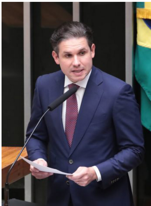
Presidente da Casa defende agenda voltada à nova economia, com foco em tecnologia.

O presidente da Câmara dos Deputados, Hugo Motta (Republicanos-PB), afirmou, nesta segunda-feira (2), que o Congresso Nacional vai aprofundar, ao longo de 2026, as discussões sobre a relação entre trabalhadores de aplicativos e plataformas digitais. A declaração foi feita durante a abertura do ano legislativo, em sessão solene que marcou o início dos trabalhos no Parlamento. Segundo Motta, o tema é estratégico para preparar o país para uma nova dinâmica econômica, baseada em tecnologia, inovação e investimentos sustentáveis. “Vamos aprofundar as discussões sobre a relação entre trabalhadores de aplicativos e plataformas digitais, buscando conciliar produtividade, direitos e desenvolvimento. Essa tarefa é indispensável para preparar o Brasil para uma nova economia”, afirmou.