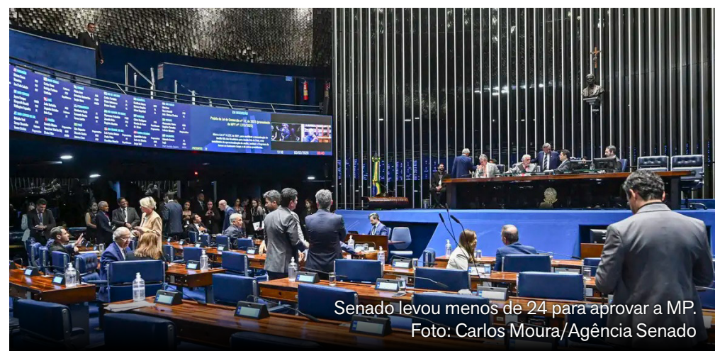
Senado levou menos de 24 para aprovar a MP.

Segundo o Ministério do Desenvolvimento, Assistência Social, Família e Combate à Fome (MDS), o Gás do Povo deve estar em pleno funcionamento em março, quando pouco mais 15 milhões de famílias serão beneficiadas. O programa pretende combater a pobreza energética, definida como a dificuldade