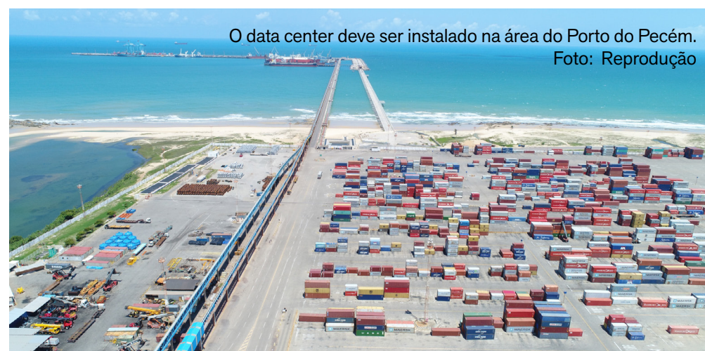
O data center deve ser instalado na área do Porto do Pecém.

Atualmente, o Ceará já lidera o Nordeste em número de data centers e abriga estruturas estratégicas ligadas à conectividade internacional, como cabos submarinos. A meta do Governo do Estado, segundo Elmano, é avançar ainda mais nesse posicionamento e consolidar o território cearense como referência nacional e latino-americana