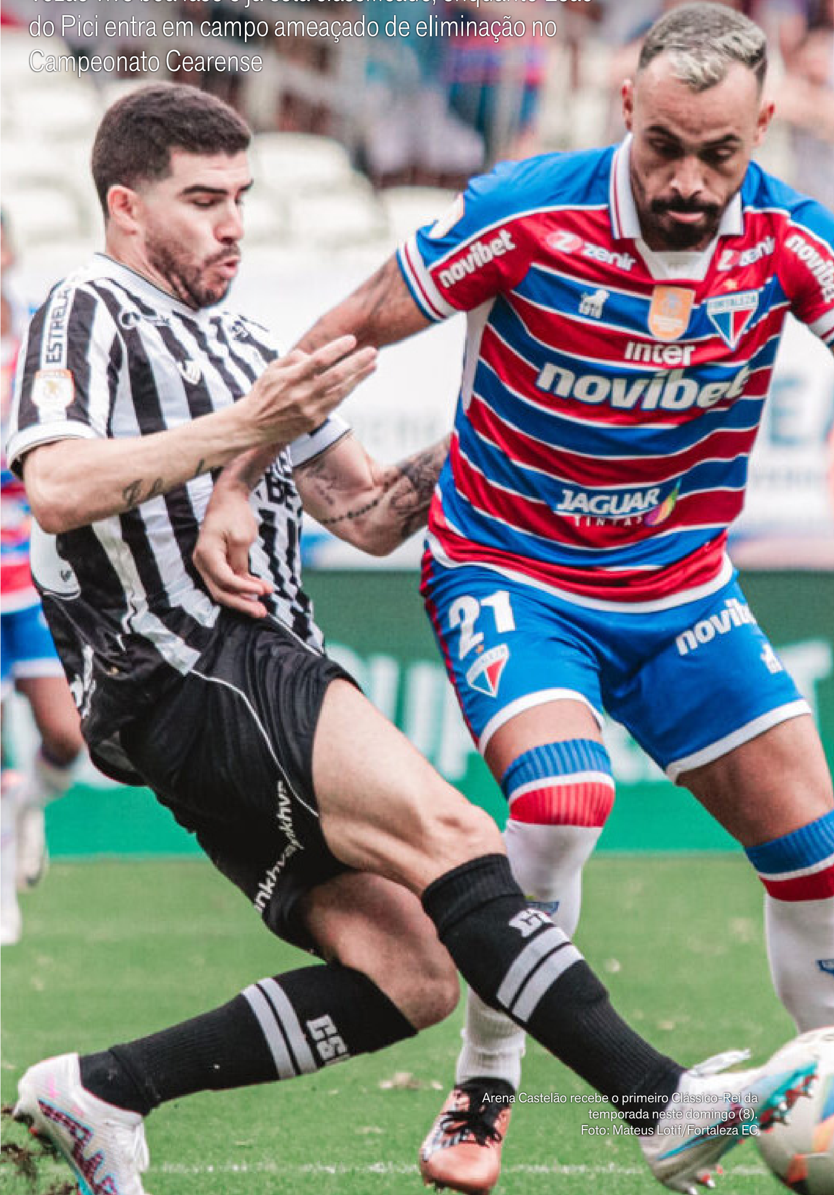
Arena Castelão recebe o primeiro Clássico-Rei da temporada neste domingo (8).

Fortaleza entra pressionado no clássico e corre risco de ficar fora das semifinais do Estadual.