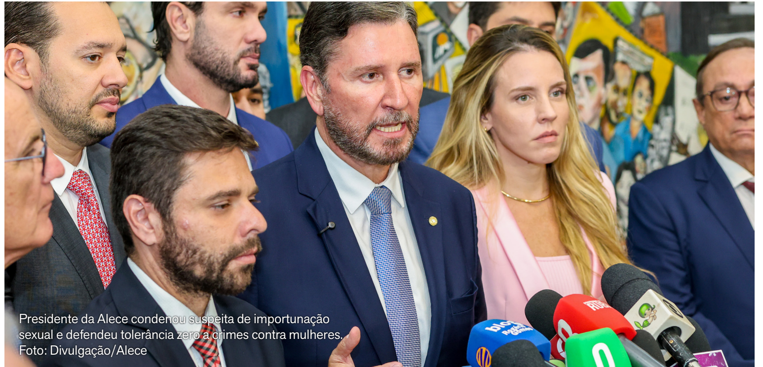
Presidente da Alece condenou suspeita de importunação sexual e defendeu tolerância zero a crimes contra mulheres.

Ainda durante a abertura dos trabalhos legislativos, Romeu Aldigueri também reforçou o apoio do Partido Socialista Brasileiro (PSB) à reeleição do senador Cid Gomes em 2026. Segundo ele, Cid é o nome defendido