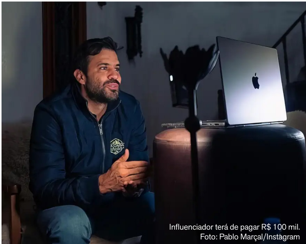
Influenciador terá de pagar R$ 100 mil.

O influenciador digital e ex-candidato à Prefeitura de São Paulo Pablo Marçal foi condenado pela Justiça ao pagamento de R$ 100 mil de indenização por danos morais ao ministro-chefe da Secretaria-Geral da Presidência da República, Guilherme Boulos (PSOL). A decisão se refere à disseminação de informações falsas durante a campanha eleitoral de 2024, quando os dois disputavam o comando da capital paulista.