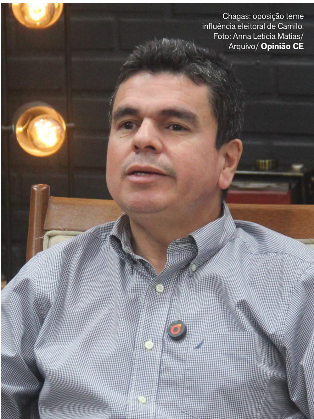
Chagas: oposição teme influência eleitoral de Camilo.

O chefe da Casa Civil foi enfático ao afirmar que a prioridade do governo é o enfrentamento direto às facções criminosas, com valorização das forças policiais. “Enquanto tem gente que faz promoção de facção, o Governo do Estado faz promoção de polícia. É a polícia que nós temos que valorizar e enfrentar as facções”, completou.