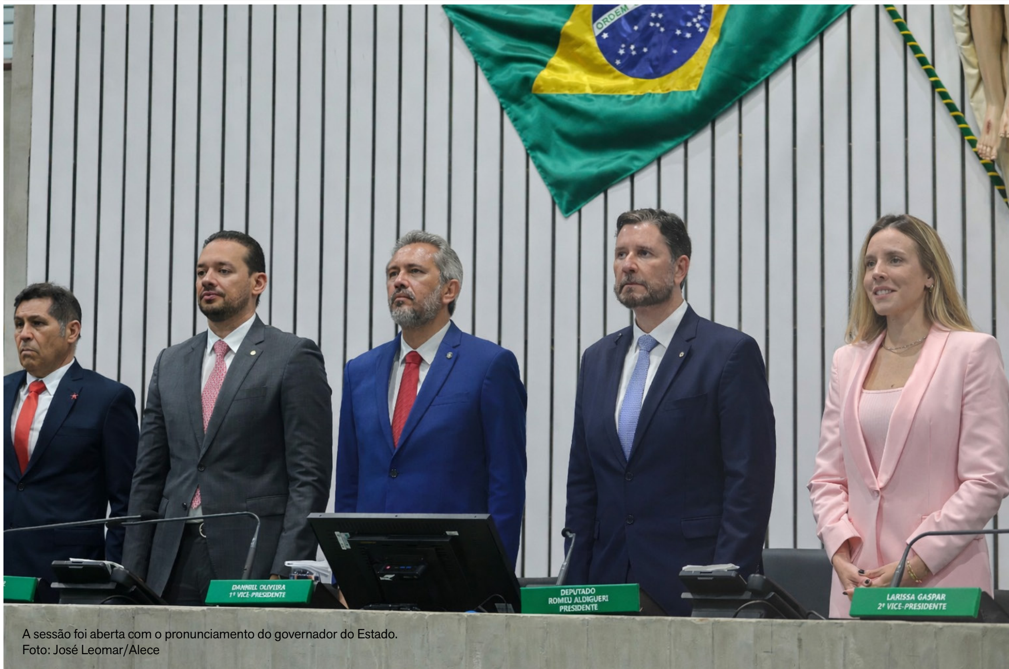
A sessão foi aberta com o pronunciamento do governador do Estado.