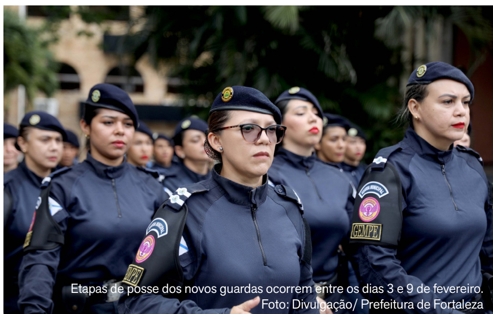
Etapas de posse dos novos guardas ocorrem entre os dias 3 e 9 de fevereiro.

A Prefeitura de Fortaleza, por meio da Secretaria Municipal da Segurança Cidadã (Sesec), convocou os 260 candidatos nomeados em concurso público para o cargo de guarda municipal para as etapas formais de posse, que acontecem entre os dias 3 e 9 de fevereiro. O cronograma inclui assinatura do termo de posse, retirada de uniformes, ambientação funcional, treinamento para a cerimônia e a solenidade oficial, que marca o ingresso dos novos servidores na Guarda Municipal de Fortaleza. A assinatura do termo de posse e a retirada dos uniformes ocorrerão na terça-feira (3), na sede da Sesec, no horário das 9h às 11h. Nesta etapa, não será permitida a entrada de convidados, sendo a atividade restrita aos candidatos convoca-