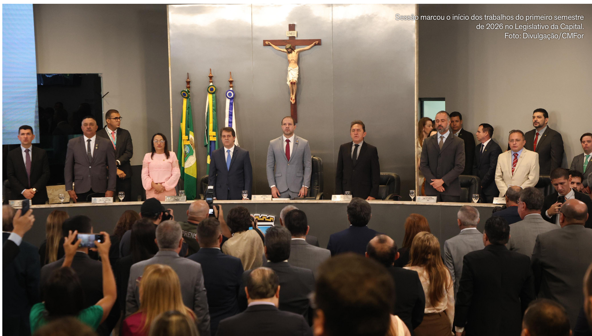
Sessão marcou o início dos trabalhos do primeiro semestre de 2026 no Legislativo da Capital.

Ferramenta será apresentada no Innova Câmara e vai funcionar como observatório com indicadores sociais, urbanos e demográficos da capital