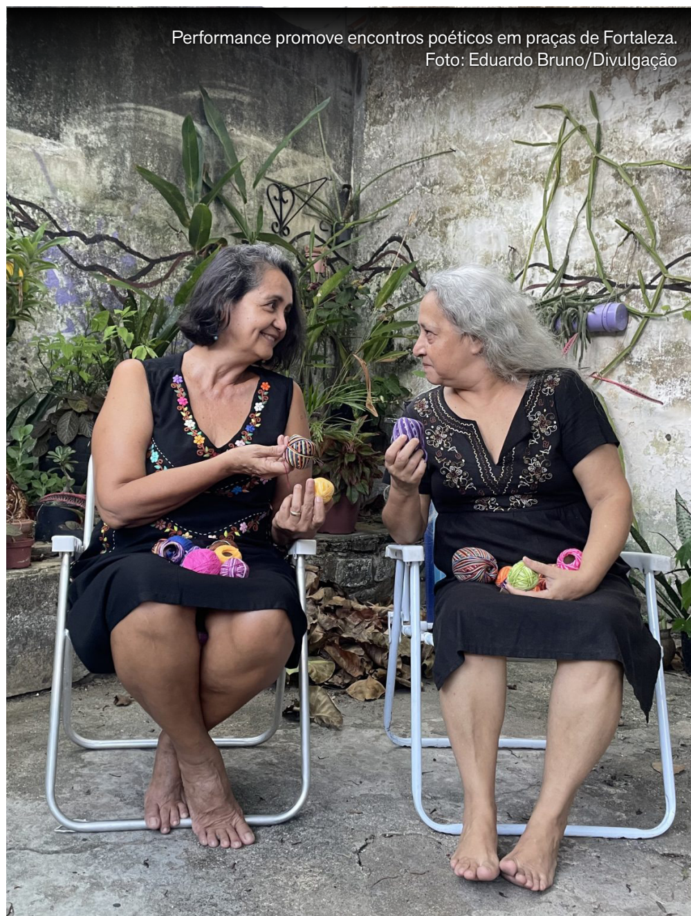
Performance promove encontros poéticos em praças de Fortaleza.

Durante as ações, será bordado coletivamente um tecido de seis metros de algodão cru, no qual imagens, palavras e relatos emergem da interação entre as artistas e as pessoas participantes. A performance ocupará quatro espaços públicos da cidade: Praça Padre Elvis Marcelino, no Montese (4/2, às 16h); Praça da Gentilândia, no Benfica (5/2, às 16h); Praça José Bonifácio, no Centro (6/2, às 16h); e