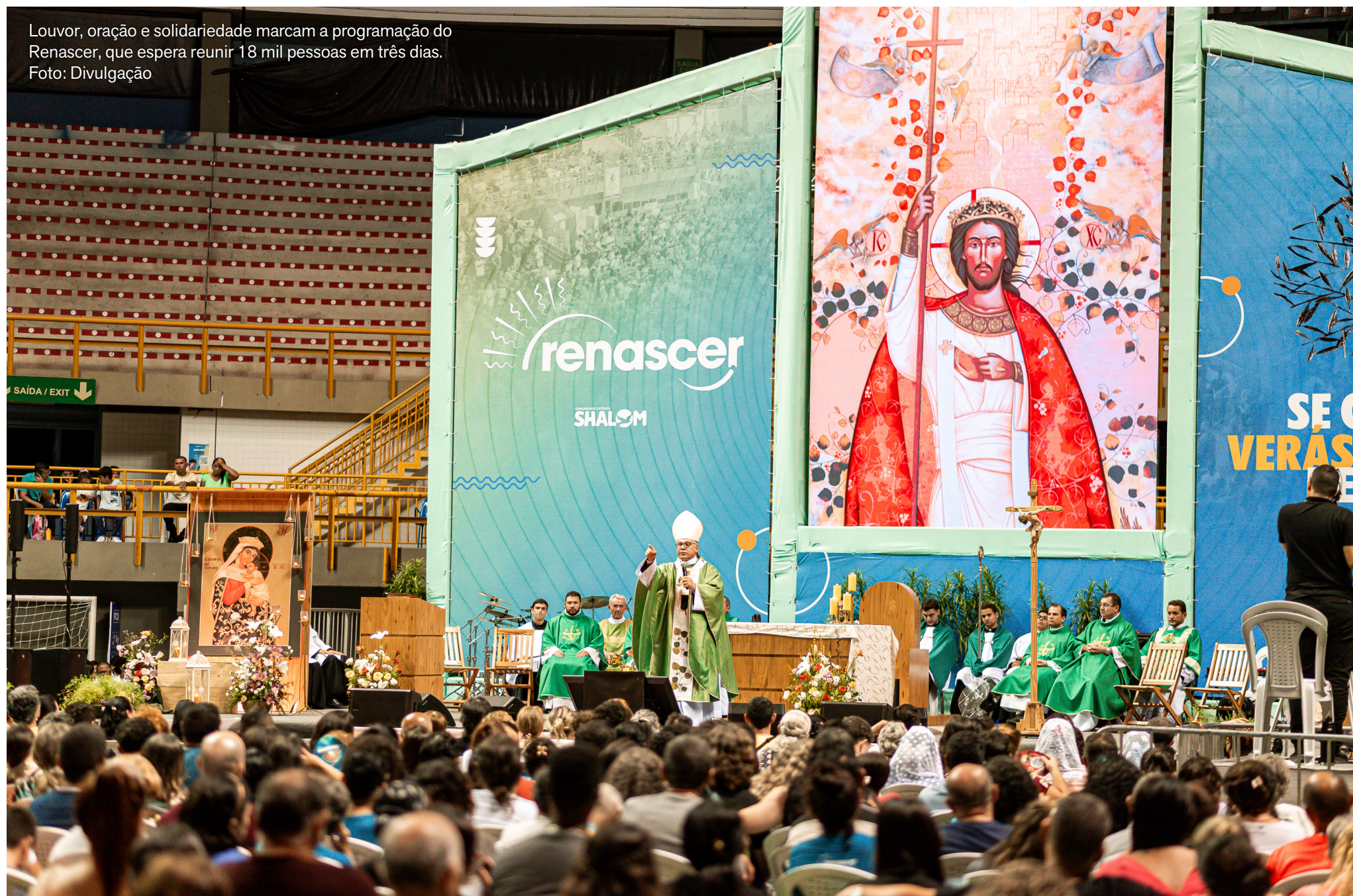
Louvor, oração e solidariedade marcam a programação do Renascer, que espera reunir 18 mil pessoas em três dias.