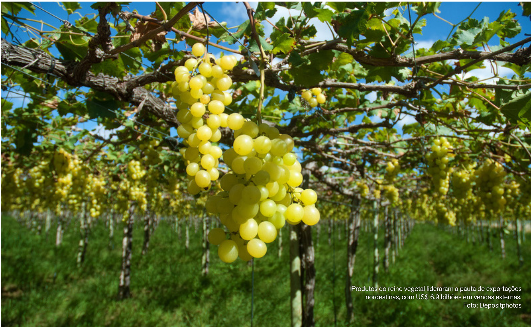
Produtos do reino vegetal lideraram a pauta de exportações nordestinas, com US$ 6,9 bilhões em vendas externas.

Vendas externas somaram US$ 24,8 bilhões, enquanto importações recuaram 5%; dados são do Data Nordeste, plataforma da Sudene