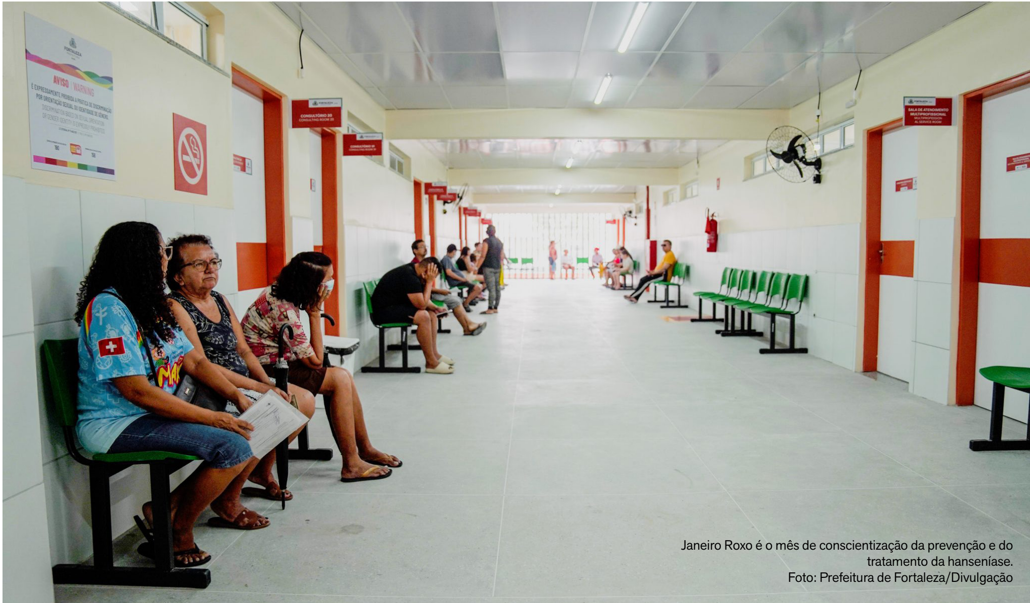
Janeiro Roxo é o mês de conscientização da prevenção e do tratamento da hanseníase.

O encaminhamento para exames laboratoriais é realizado após consulta médica na unidade de saúde. Identificados sinais como manchas, lesões ou alteração de sensibilidade, o profissional direciona o paciente para a coleta, garantindo o diagnóstico e o início rápido do tratamento.