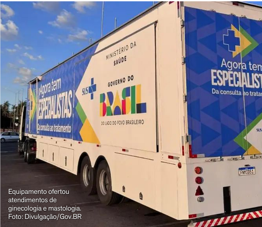
Equipamento ofertou atendimentos de ginecologia e mastologia.

CENÁRIO ELEITORAL Ronaldo Caiado e Ratinho Júnior já figuram em levantamentos sobre a sucessão presidencial de 2026. A movimentação reforça o reposicionamento do PSD como um dos principais polos de articulação do campo oposicionista e antecipa a disputa interna pela liderança de um projeto nacional para 2026.