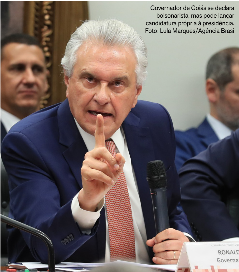
Governador de Goiás se declara bolsonarista, mas pode lançar candidatura própria à presidência.

O governador de Goiás, Ronaldo Caiado, oficializou, nesta terça-feira (27), sua saída do União Brasil para se filiar ao PSD, em um movimento com claro viés nacional e mirando as eleições presidenciais de 2026. A decisão foi anunciada ao lado dos governadores Ratinho Júnior (Paraná) e Eduardo Leite (Rio Grande do Sul), ambos também citados como possíveis pré-candidatos ao Palácio do Planalto. Durante o ato, Caiado afirmou que o grupo busca construir um projeto comum para o país, deixando claro que apenas um nome será escolhido para disputar a Presidência, com apoio dos demais. “Aquele que for escolhido levará essa bandeira de um projeto de esperança, de resgate daquilo que o povo espera: caráter, determinação, honra, coragem, moral e também independência intelectual para governar esse país”, declarou. “O que sair daqui candidato terá o apoio dos demais”, completou. Eduardo Leite destacou que a articulação não está baseada em projetos individuais, mas em uma agenda nacional. Segundo ele, não é necessário que todos pensem igual, mas que tenham como prioridade “pensar o Brasil”. Já Ratinho Júnior reforçou o discurso de mudança e afirmou que o país precisa de um novo caminho. “É preciso fazer um novo país”, resumiu o