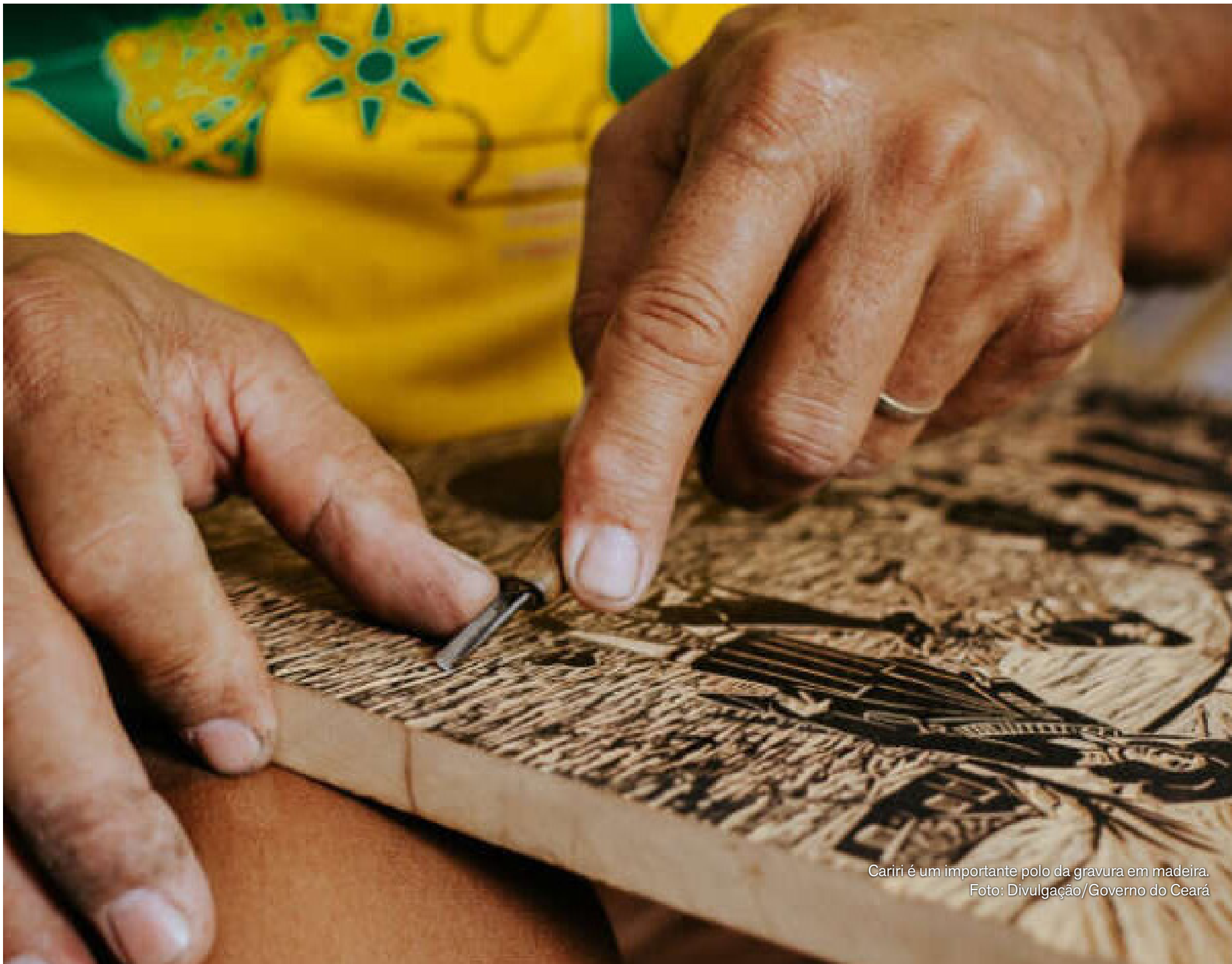
Cariri é um importante polo da gravura em madeira.