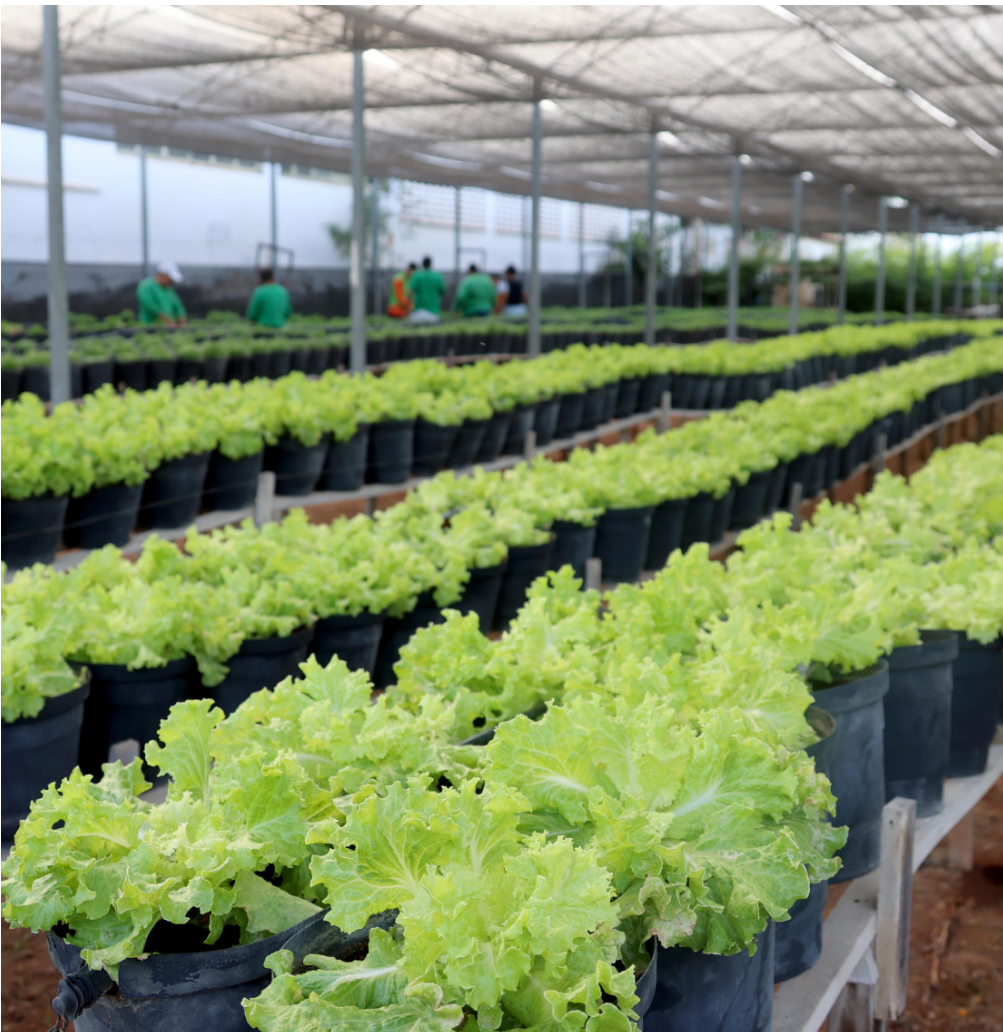
Colheitas atendem população vulnerável da cidade.

Atualmente, o Hortas Sociais conta com seis unidades em funcionamento em diferentes regiões de Fortaleza, facilitando o acesso da população atendida. As colheitas seguem até o dia 5 de fevereiro, reforçando o abastecimento de alimentos saudáveis para famílias fortalezenses em situação de maior vulnerabilidade.