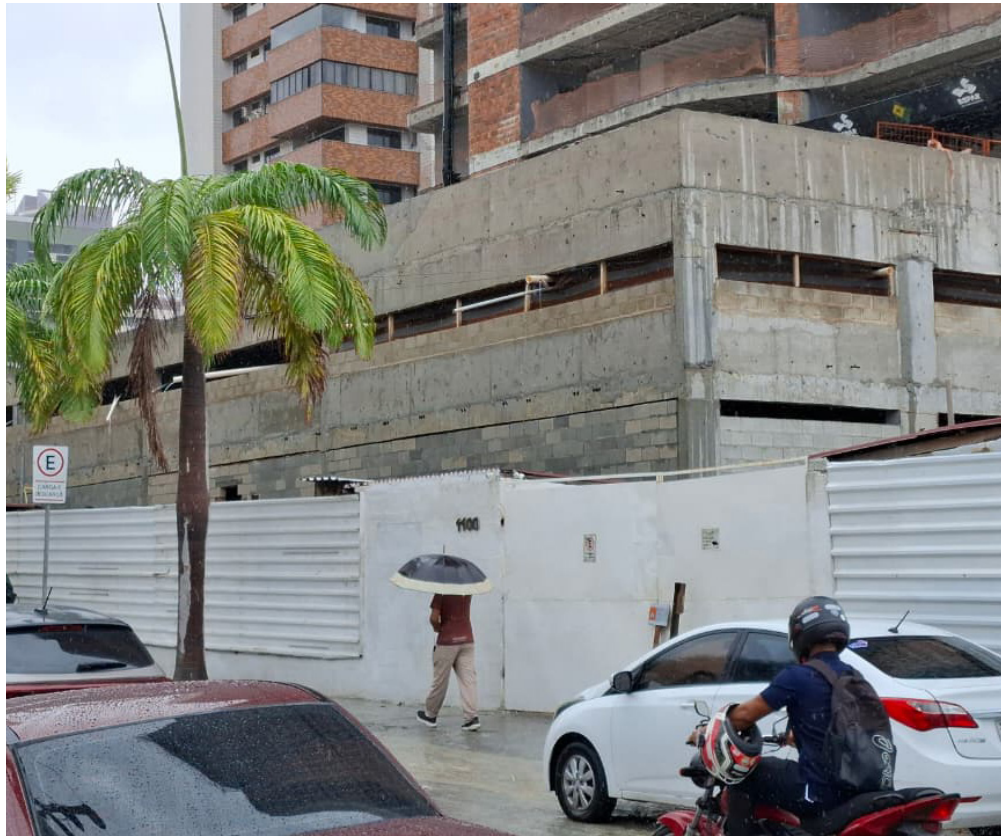
Segundo dia de chuva em Fortaleza voltou a registrar problemas nas ruas.

Ainda pela manhã, o carro foi retirado do local com o auxílio de um reboque. Equipes técnicas da Cagece foram deslocadas até a rua José Hipólito para conter o vazamento e realizar os reparos necessários no trecho afetado. A previsão é de que os serviços sejam