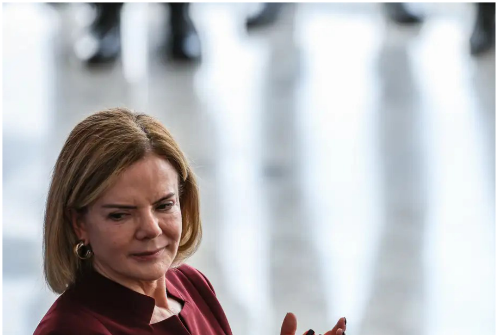
A expectativa é a aprovação ainda no primeiro semestre de 2026.

O modelo possibilita que o cliente, ao optar por um imóvel com valor ligeiramente superior, tenha redução na conta de energia e eliminação do custo com gás.