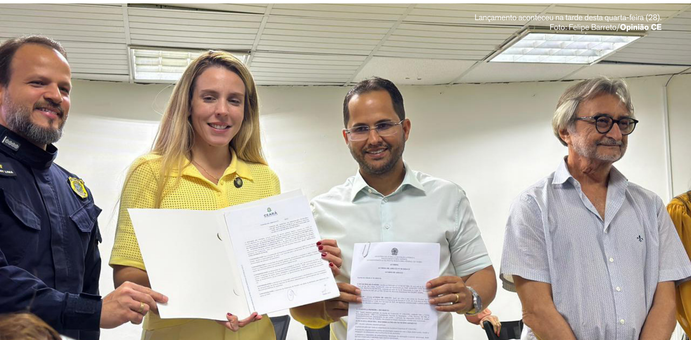
Lançamento aconteceu na tarde desta quarta-feira (28).

Bicicletar evita emissão de 517 toneladas de CO 2 e consolida uso da bicicleta em Fortaleza CEARÁ, P. 3