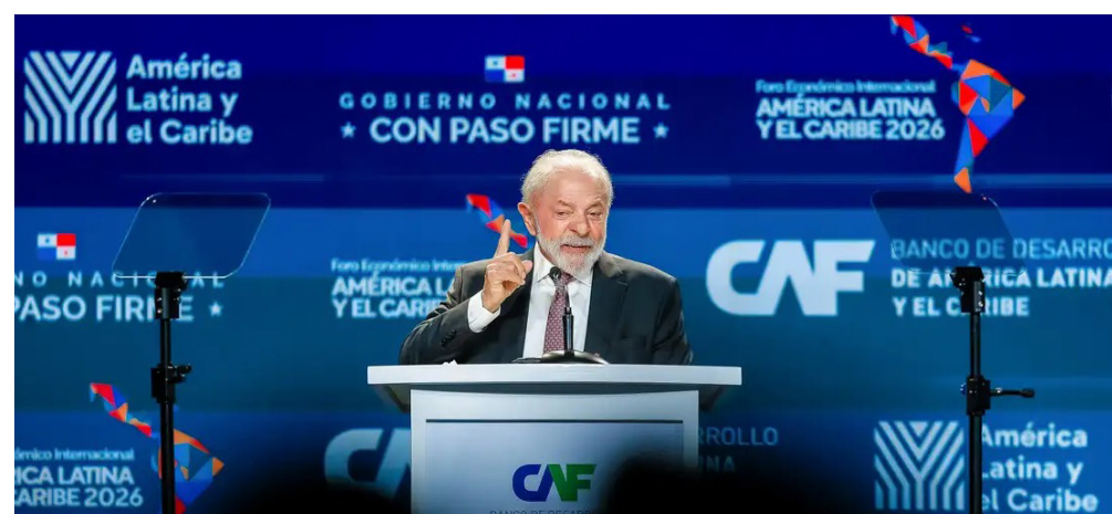
Presidente citou ativos que tornam a região mundialmente relevante.

Segundo Lula, falta às lideranças regionais convicção sobre os benefícios de adoção de um projeto mais autônomo de inserção internacional. Nesse sentido, sugeriu que os países da região levem em consideração as riquezas inexploradas que poderão garantir uma inserção competitiva na ordem global.