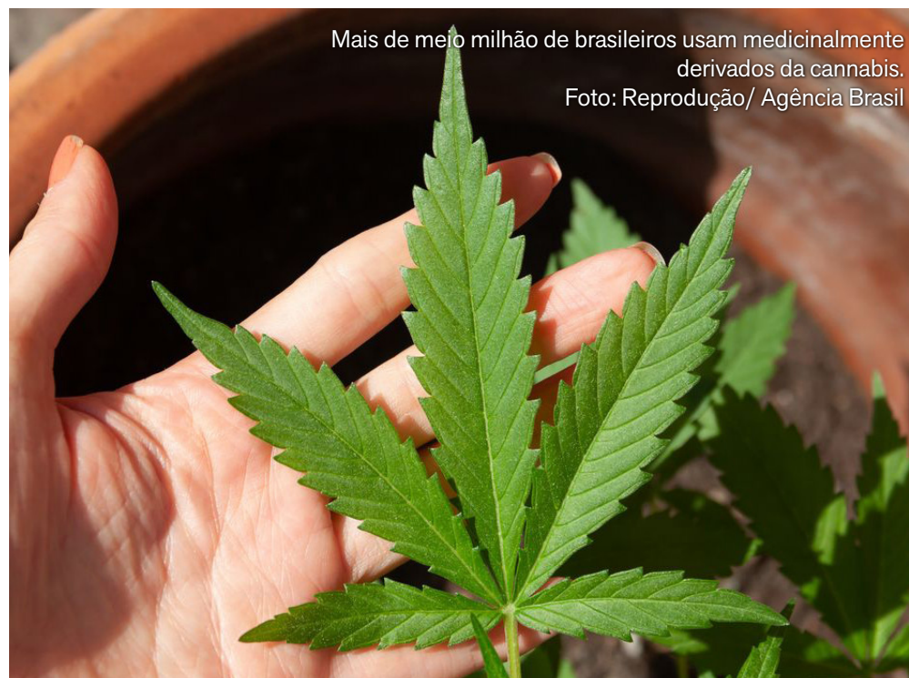
Mais de meio milhão de brasileiros usam medicinalmente derivados da cannabis.

“No Brasil, a evolução do uso desses produtos tem sido registrada principalmente pelo aumento de importações individuais. Entre 2015 e 2025, ou seja, nos últimos 10 anos, foram mais