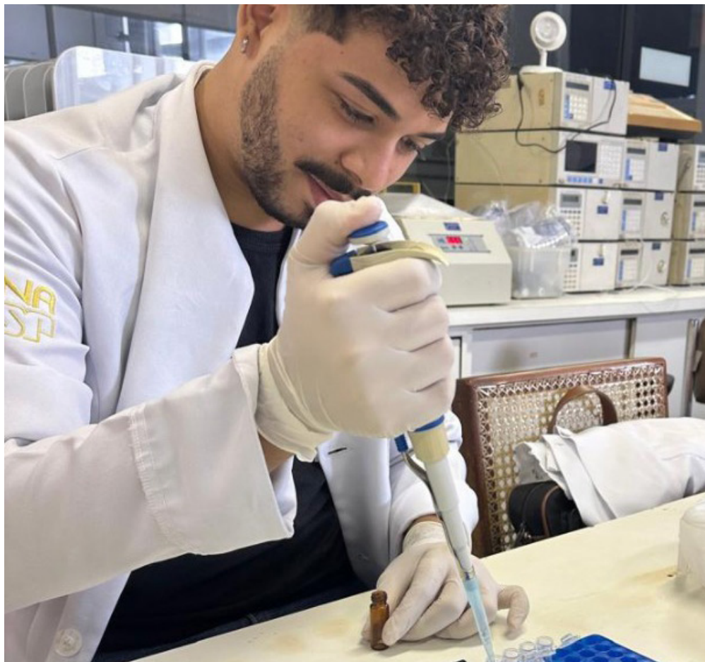
Do total de estudantes do Curso de Medicina da Uece participantes, 93,2% obtiveram desempenho igual ou acima do esperado.

Além de medir a qualidade da formação médica, o exame também contribui para o aprimoramento dos cursos e dos processos de seleção para residência médica. Os resultados poderão ser utilizados no Exame Nacional de Residência (Enare), além de fortalecer o Sistema Único de Saúde (SUS) e ampliar a transparência por meio de um modelo nacional padronizado.