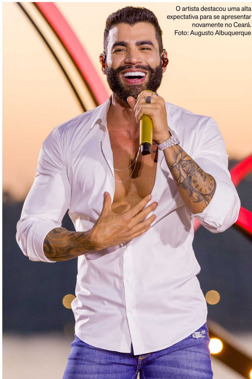
O artista destacou uma alta expectativa para se apresentar novamente no Ceará.

“São muitas lembranças, mas uma das mais marcantes é, com certeza, a da gravação do DVD “O Embaixador in Cariri”, que fizemos em 2019, na Expocrato. Foram mais de cinco horas de show e uma noite histórica”.