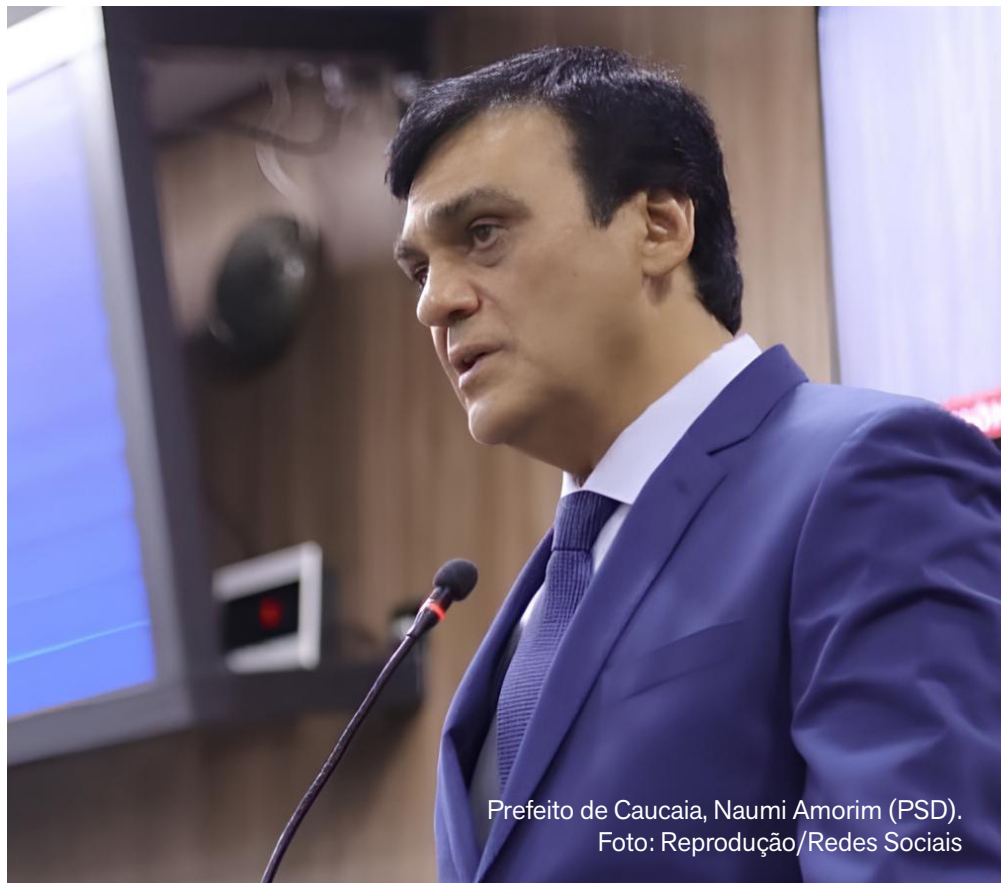
Prefeito de Caucaia, Naumi Amorim (PSD).

“Possíveis eventos promovidos pela iniciativa privada poderão ocorrer de forma independente, desde que respeitada a legislação vigente e as normas de segurança”, destacou.