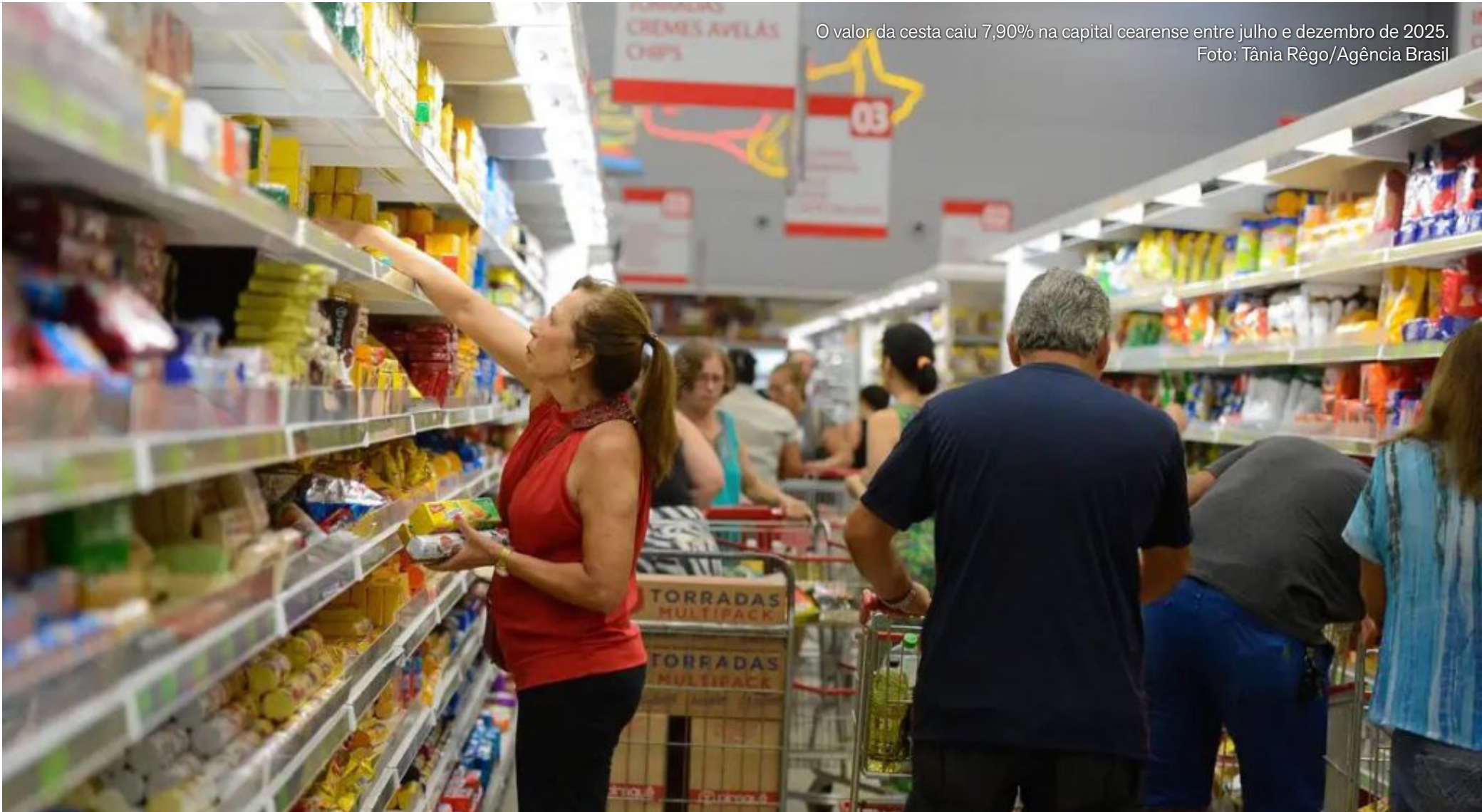
O valor da cesta caiu 7,90% na capital cearense entre julho e dezembro de 2025.

Cirilo Pimenta lança candidatura de José Guimarães ao Senado em Quixeramobim POLÍTICA, P. 7