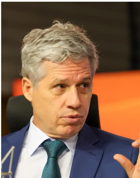
Ministro Paulo Teixeira afirma que produtores familiares terão acesso facilitado ao mercado europeu.

O acordo de livre comércio firmado entre o Mercosul e a União Europeia (UE) deve representar um salto histórico para a agricultura familiar brasileira, com impactos diretos sobre a produção de café, frutas e lácteos. A avaliação é do ministro do Desenvolvimento Agrário e Agricultura Familiar, Paulo Teixeira, que afirmou que o setor será um dos principais beneficiados com a abertura do mercado europeu. “A agricultura familiar vai bombar com esse acordo”, afirmou o ministro durante participação, nesta terça-feira (20), no programa Bom Dia, Ministro, produzido pela Empresa Brasil de Comunicação (EBC). Segundo ele, a produção de café no Brasil é majoritariamente realizada por agricultores familiares, que agora poderão exportar o produto já processado para a Europa sem a incidência de taxas. “A agricultura familiar vai ganhar muito com esse acordo. Eles poderão vender o café que tiver já processado