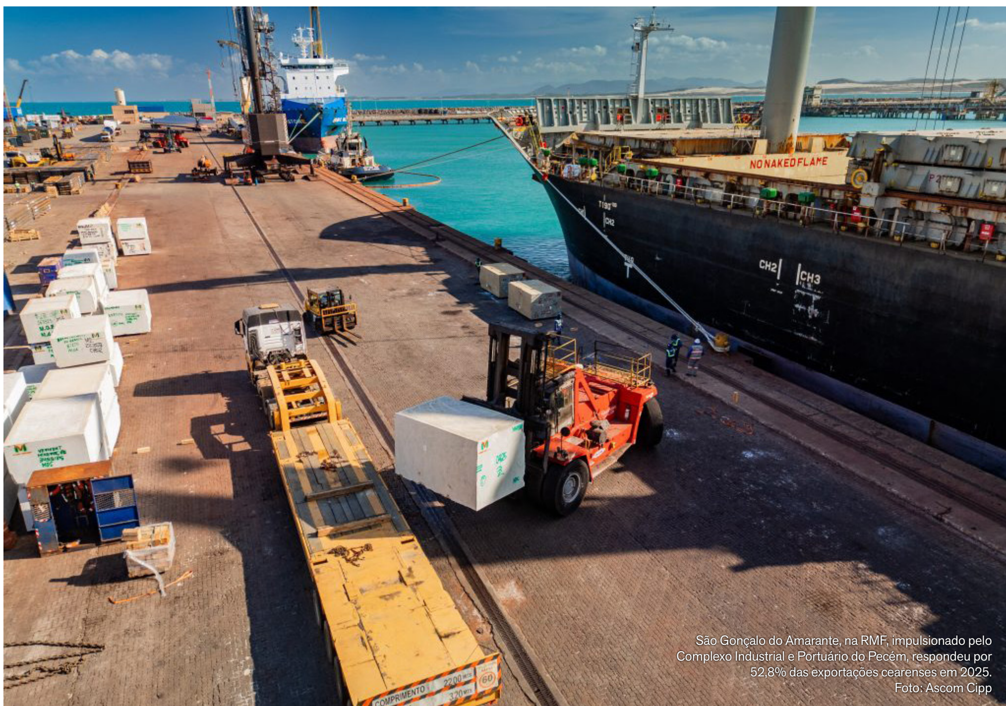
São Gonçalo do Amarante, na RMF, impulsionado pelo Complexo Industrial e Portuário do Pecém, respondeu por 52,8% das exportações cearenses em 2025.

Negócios com a UE cresceram 72% em 2025, atingindo US$ 447,1 milhões, e colocam o bloco como principal destino das exportações cearenses