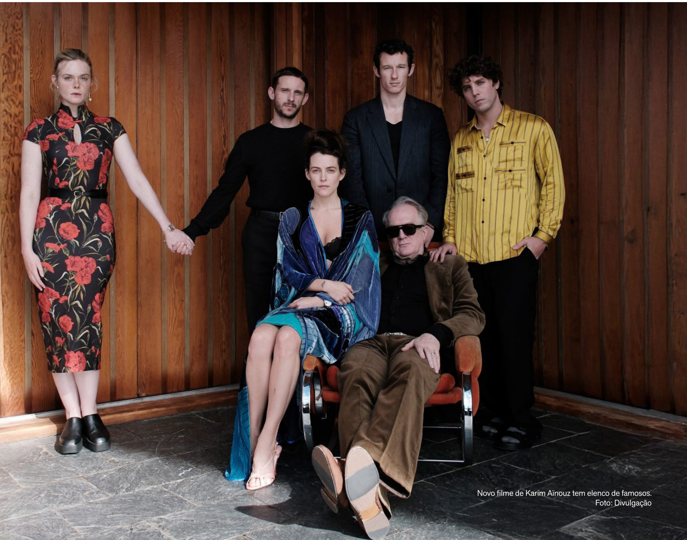
Novo filme de Karim Aïnouz tem elenco de famosos.

Além de Aïnouz, o Brasil também está representado na disputa principal com Josephine, dirigido por Beth de Araújo, e em outras mostras da Berlinale. O júri da 76ª edição do festival será presidido pelo cineasta alemão Wim Wenders.