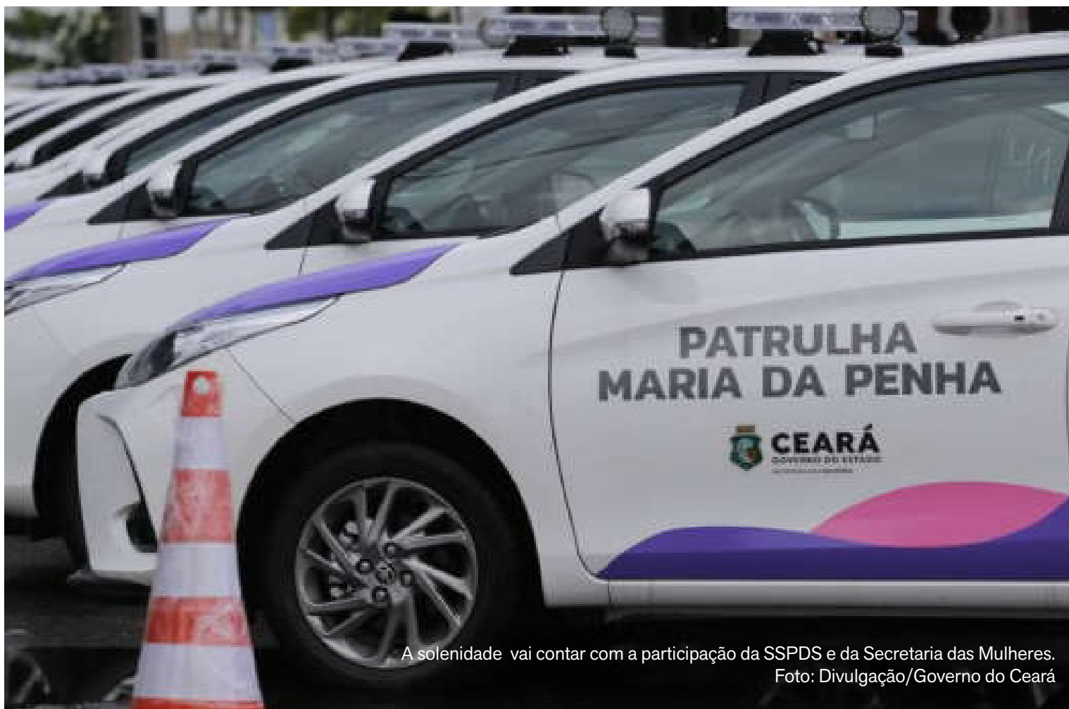
A solenidade vai contar com a participação da SSPDS e da Secretaria das Mulheres.

O Governo do Ceará vai entregar, nesta quarta-feira (21), 29 viaturas da Patrulha Maria da Penha, equipe especializada no combate à violência contra as mulheres. Na ocasião, no Palácio da Abolição, também serão entregues kits Athena, que contêm acessórios voltados ao atendimento especializado às mulheres em situação de violência.