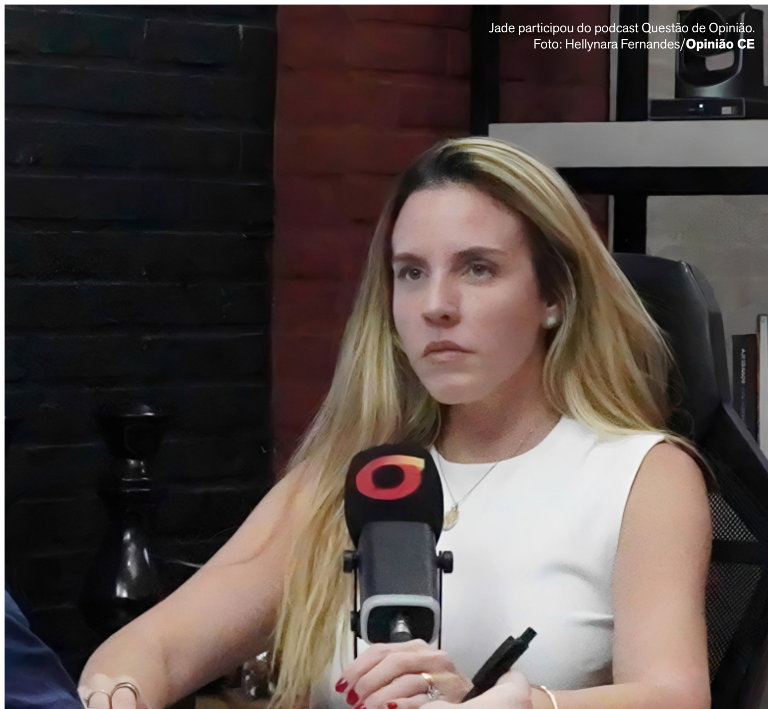
Jade participou do podcast Questão de Opinião .

Pela primeira vez, a vice-governadora afirmou publicamente que esse último tema seria uma prioridade em eventual mandato legislativo. Segundo ela, o Brasil enfrenta atualmente uma “epidemia” de violência sexual contra mulheres, crianças e adolescentes. “A gente não pode deixar que a impuni-