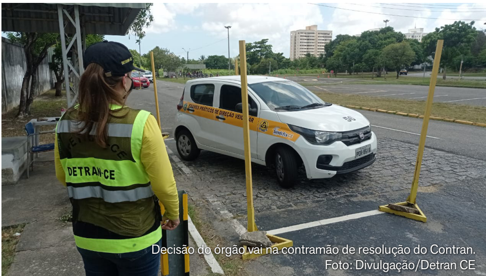
Decisão do órgão vai na contramão de resolução do Contran.

O Departamento Estadual de Trânsito do Ceará (Detran-CE) decidiu manter a baliza como etapa obrigatória na prova prática para a obtenção da Carteira Nacional de Habilitação (CNH). Em âmbito nacional, ao menos cinco estados já aderiram à resolução do Conselho Nacional de Trânsito (Contran), publicada em dezembro de 2025, que prevê a retirada da manobra do exame.