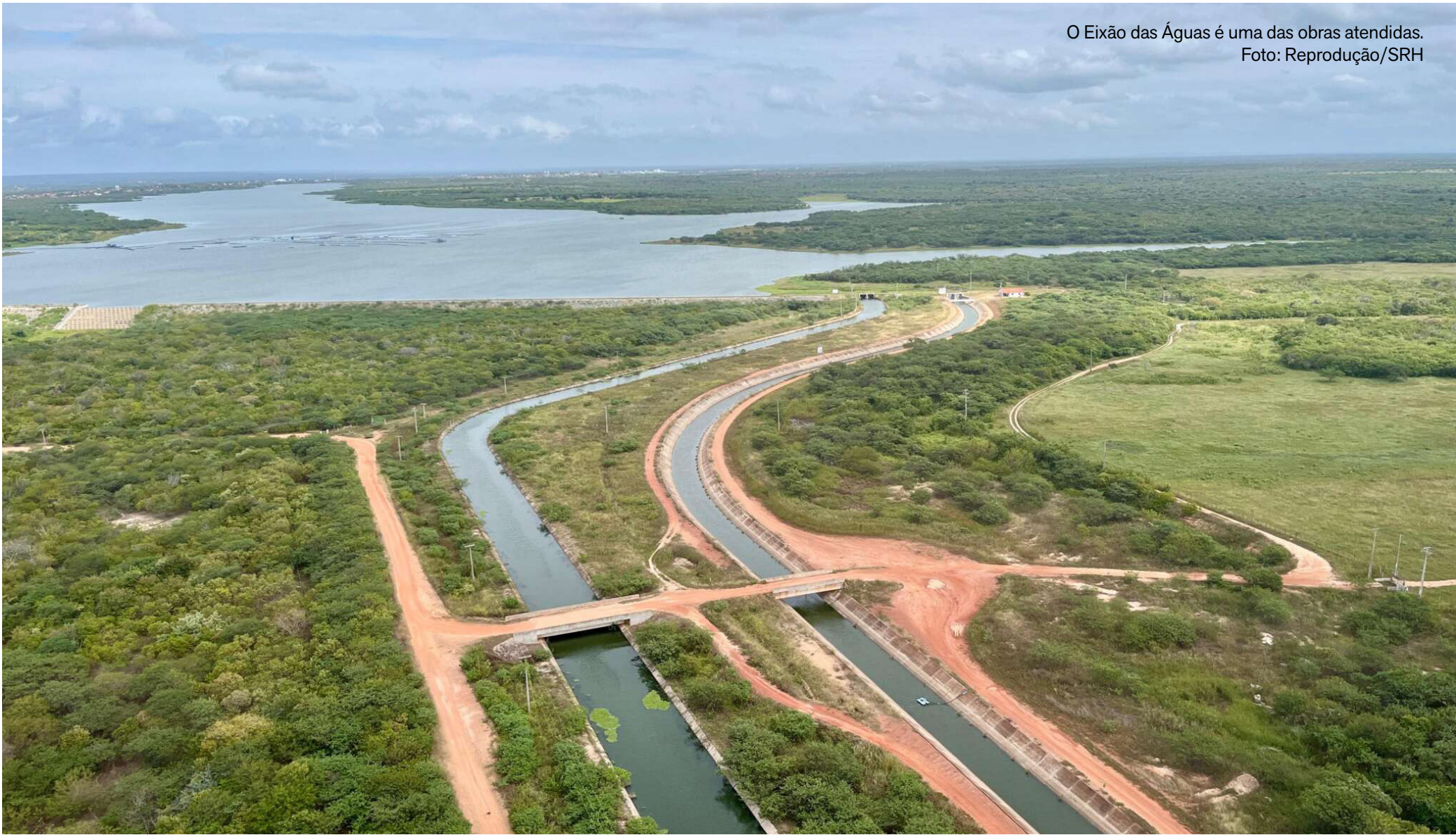
O Eixão das Águas é uma das obras atendidas.

Fiec entrega Selo ESG-Fiec a quatro empresas cearenses ECONOMIA, P. 10