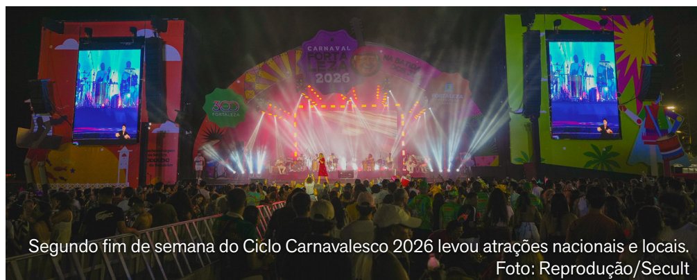
Segundo fim de semana do Ciclo Carnavalesco 2026 levou atrações nacionais e locais.

Fortaleza manteve o clima de festa no segundo fim de semana do Pré-Carnaval 2026. Entre a sexta-feira (23) e o domingo (25), o Ciclo Carnavalesco reuniu cerca de 60 mil pessoas em 15 palcos espalhados por oito Regionais