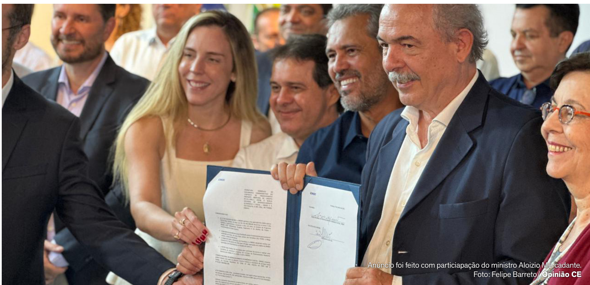
Anúncio foi feito com participação do ministro Aloizio Mercadante.

Recursos envolvem Estado, município e iniciativa privada, com impacto direto em infraestrutura urbana, abastecimento de água e inovação tecnológica