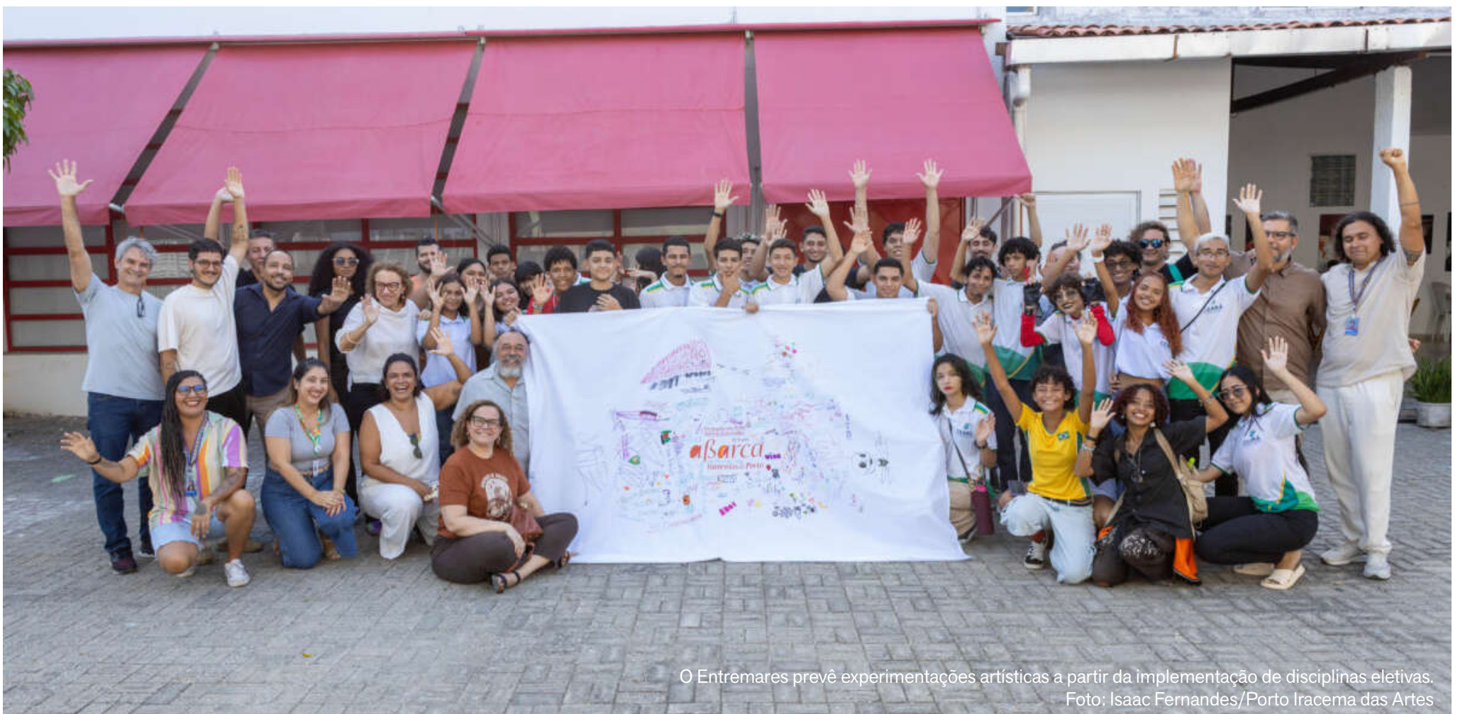
O Entremares prevê experimentações artísticas a partir da implementação de disciplinas eletivas.

O Entremares está alinhado ao operador poético de 2026 da Porto Iracema das Artes, intitulado “Poéticas de Formação Artística”, que propõe aprofundar o debate sobre o papel crítico da arte e sua força na construção de pertencimento, consciência social e autonomia cultural. A proposta reafirma a escola de arte como porta de inclusão e de acesso às sensibilidades contemporâneas, fortalecendo a formação integral de jovens da rede pública. Criada em 2013, a Porto Iracema das Artes desenvolve processos formativos nas áreas de Música, Dança, Artes Visuais, Cinema e Teatro, com cursos básicos, técnicos e laboratórios de criação, todos gratuitos, voltados especialmente para jovens de 15 a 29 anos da rede pública de ensino.