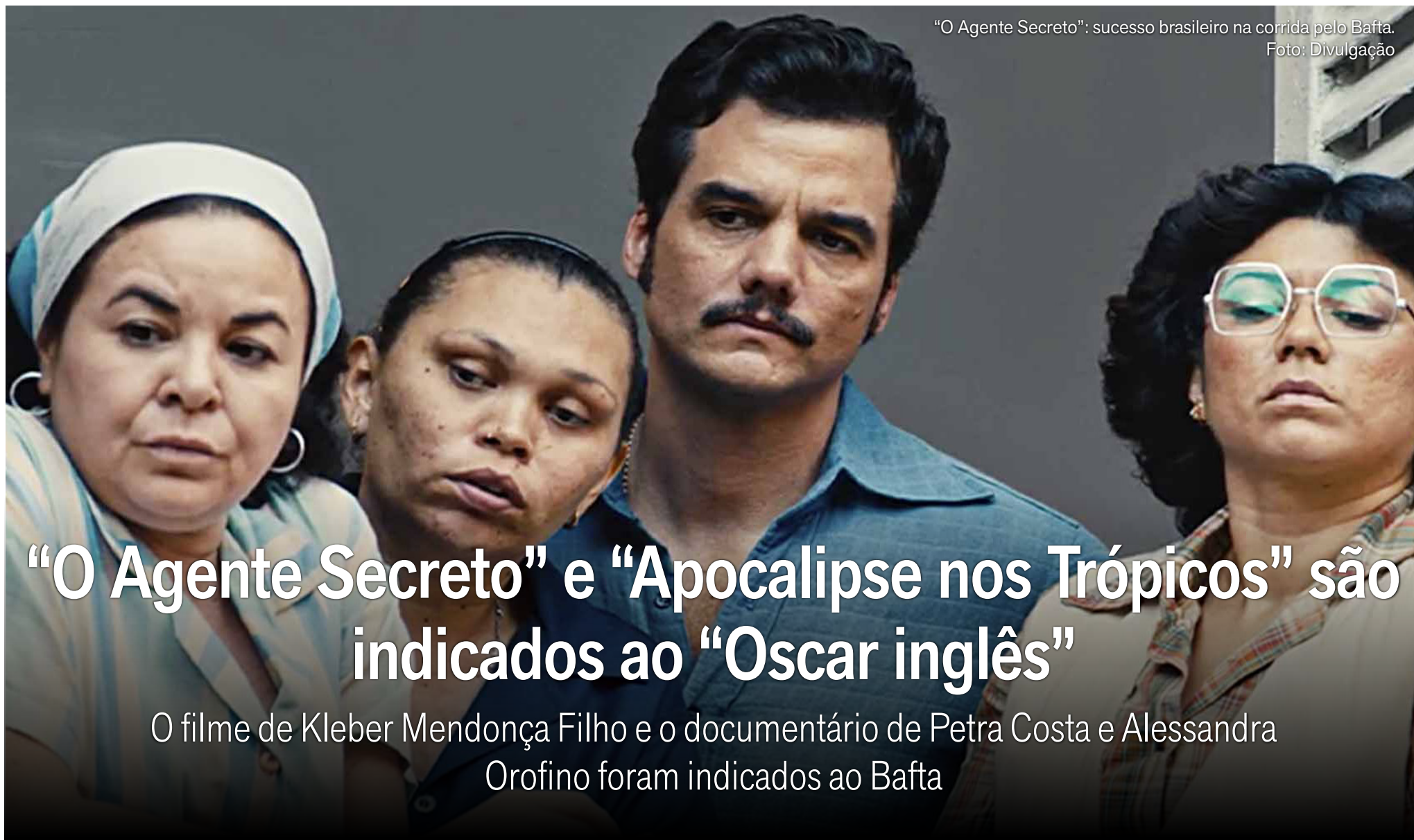
“O Agente Secreto”: sucesso brasileiro na corrida pelo Bafta.