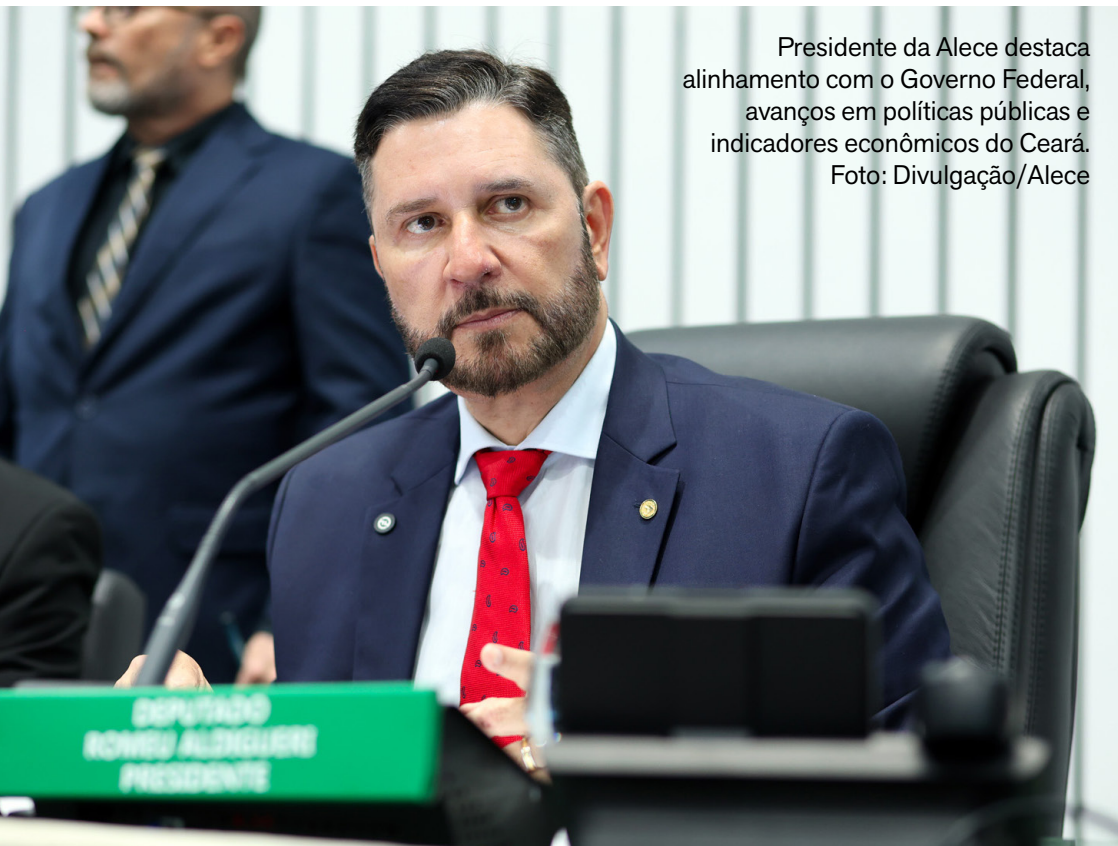
Presidente da Alece destaca alinhamento com o Governo Federal, avanços em políticas públicas e indicadores econômicos do Ceará.

O presidente da Assembleia Legislativa do Ceará (Alece), Romeu Aldigueri (PSB), saiu em defesa do Governo de Elmano de Freitas (PT) durante evento realizado, nesta terça-feira (27), no Palácio da Abolição. Ao discursar no pânque, o chefe do Legislativo estadual exaltou conquistas do grupo governista e afirmou que a atual gestão representa “o lado certo da história”. Segundo Aldigueri, o alinhamento político entre o Governo do Ceará e o Governo Federal tem sido decisivo para os resultados alcançados. “Há três anos, fizemos uma defesa da importância da união, do pacto federativo, a importância de Lula, Camilo e Elmano. Hoje, presenciamos isso a cada dia”, afirmou.