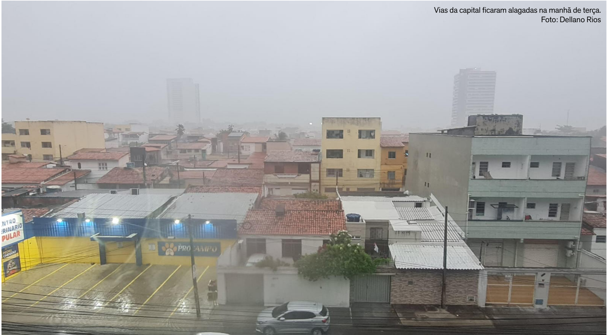
Vias da capital ficaram alagadas na manhã de terça.

As chuvas estão associadas a efeitos locais e a áreas de instabilidade ligadas à atuação de um Vórtice Ciclônico de Altos Níveis (VCAN). O afastamento gradual desse sistema deve contribuir para a diminuição dos volumes de chuva nos próximos dias. Além disso, a Zona de Convergência Intertropical (ZCIT) encontra-se mais ao sul, favorecendo o aumento da nebulosidade sobre o oceano Atlântico e áreas próximas ao litoral cearense.