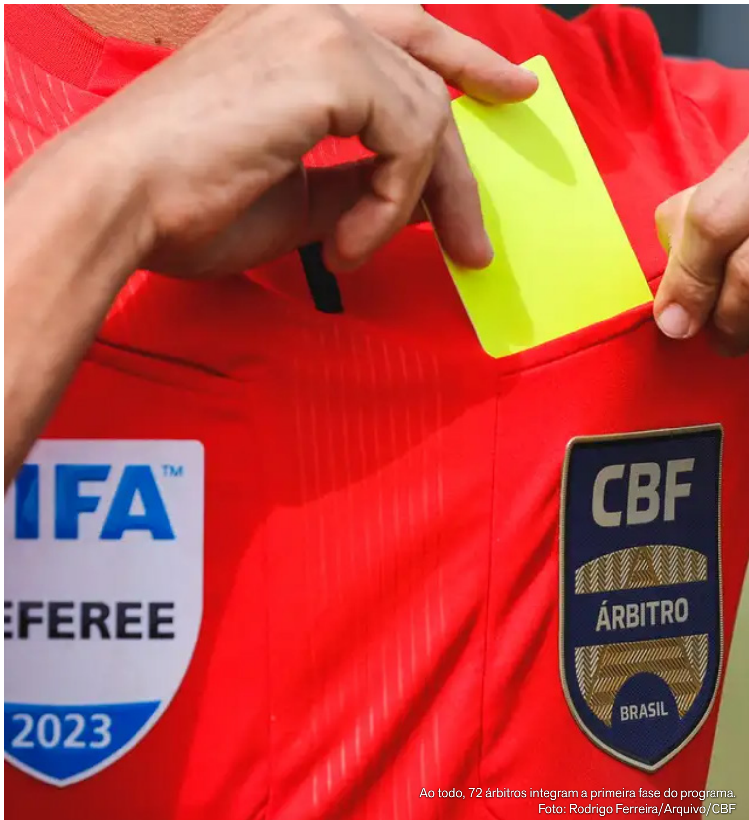
Ao todo, 72 árbitros integram a primeira fase do programa.

Além da remuneração fixa, os árbitros profissionalizados serão submetidos a avaliações sistemáticas