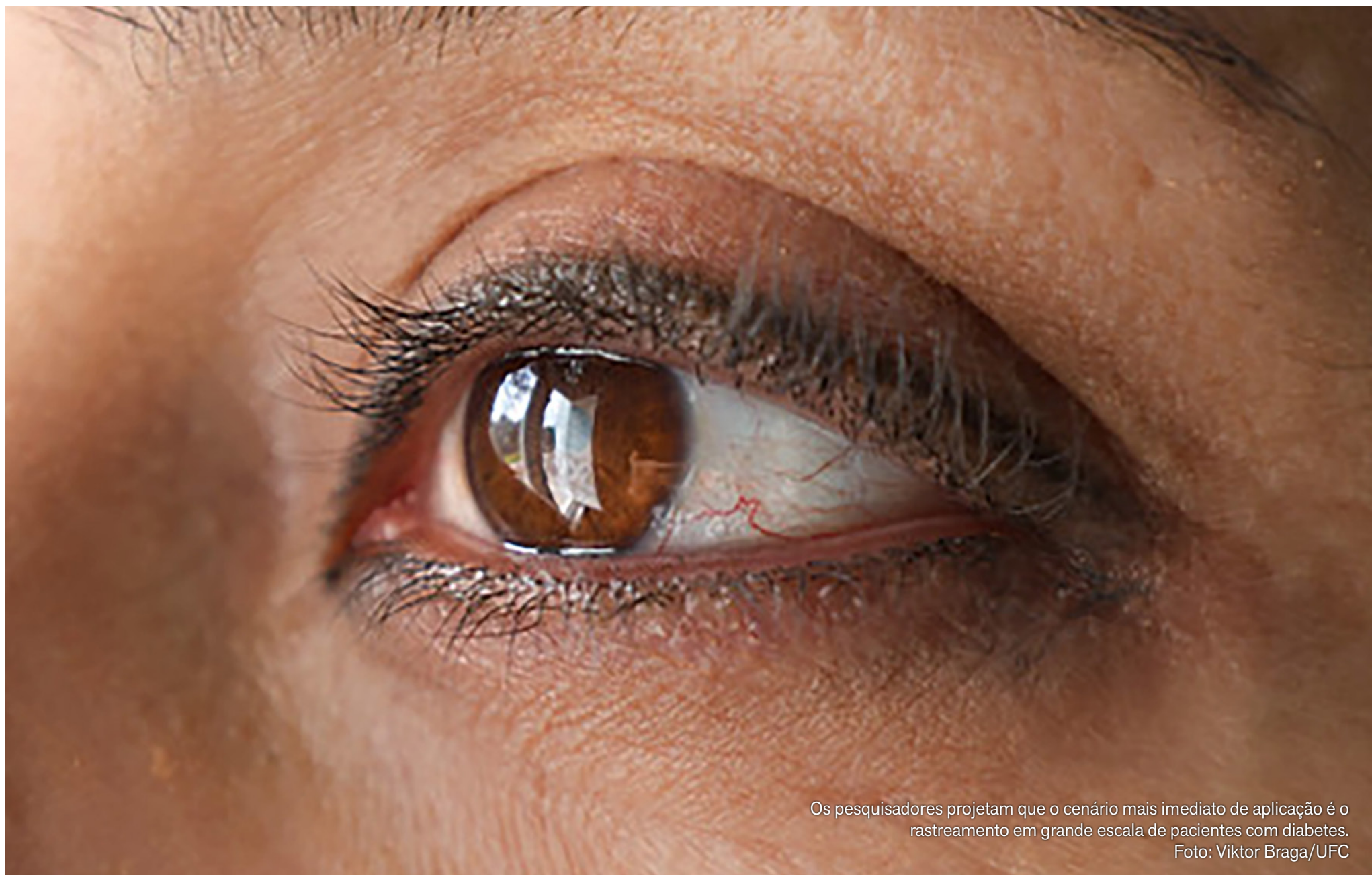
Os pesquisadores projetam que o cenário mais imediato de aplicação é o rastreamento em grande escala de pacientes com diabetes.

Algoritmo criado no Ceará detecta sinais iniciais da retinopatia diabética com alta precisão e baixo custo computacional