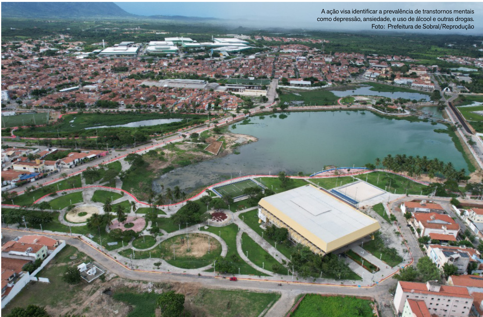
A ação visa identificar a prevalência de transtornos mentais como depressão, ansiedade, e uso de álcool e outras drogas.