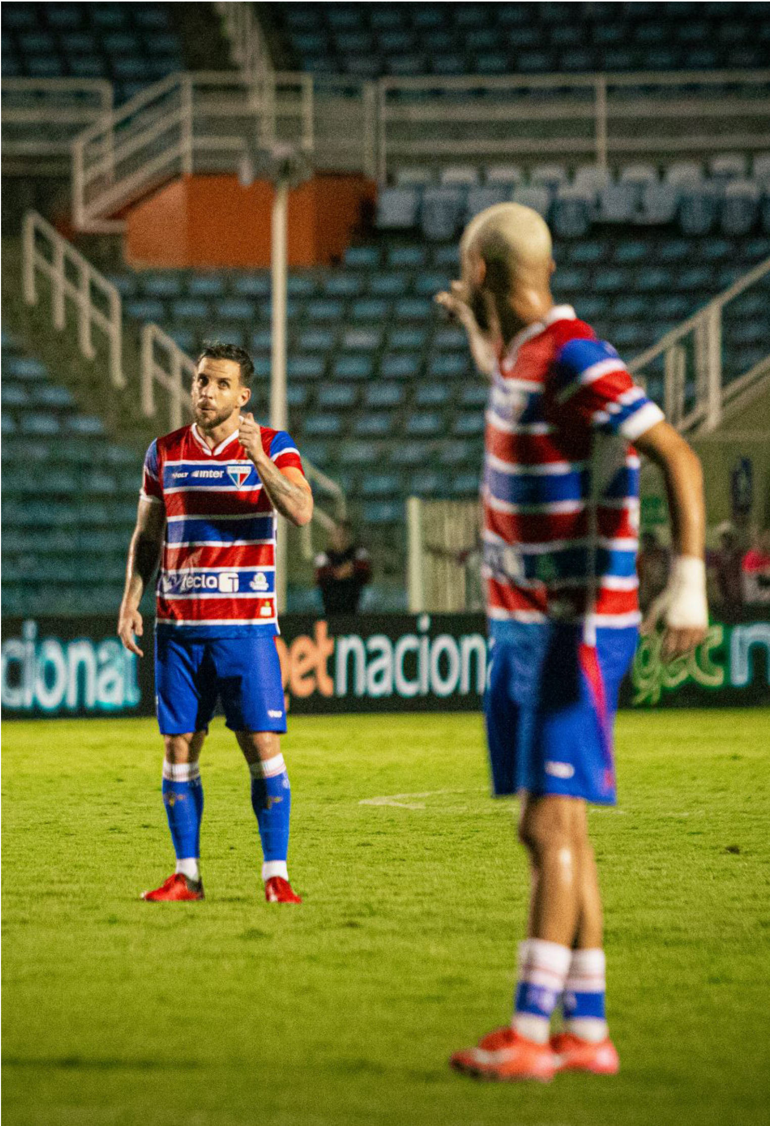
O Leão do Pici entra em campo pressionado após um início abaixo do esperado.