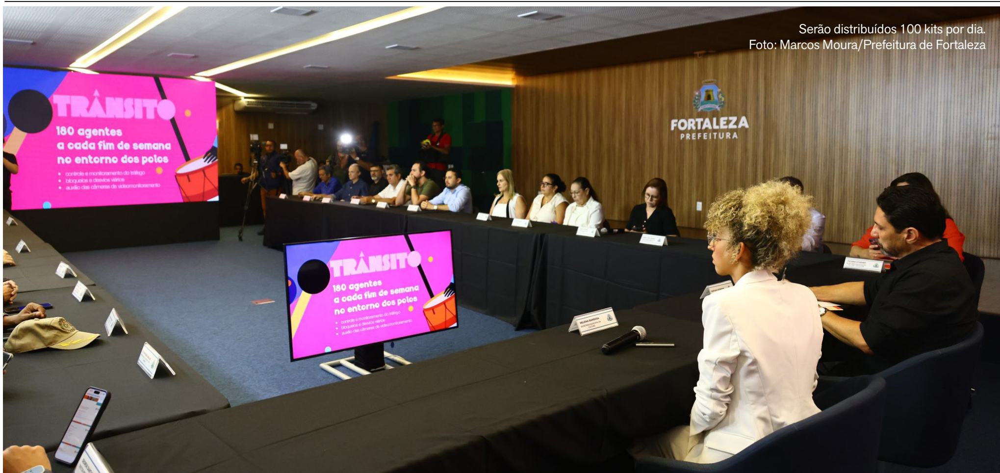
Serão distribuídos 100 kits por dia.