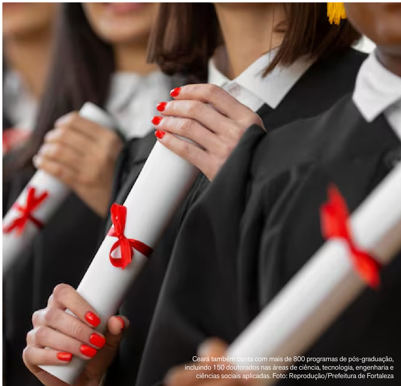
Ceará também conta com mais de 800 programas de pós-graduação, incluindo 150 doutorados nas áreas de ciência, tecnologia, engenharia e ciências sociais aplicadas.

Segundo o Banco Mundial, políticas como o programa Ceará Conectado têm papel central na redução das desigualdades digitais. Atualmente, a iniciativa atende 136 dos 184 municípios cearen-