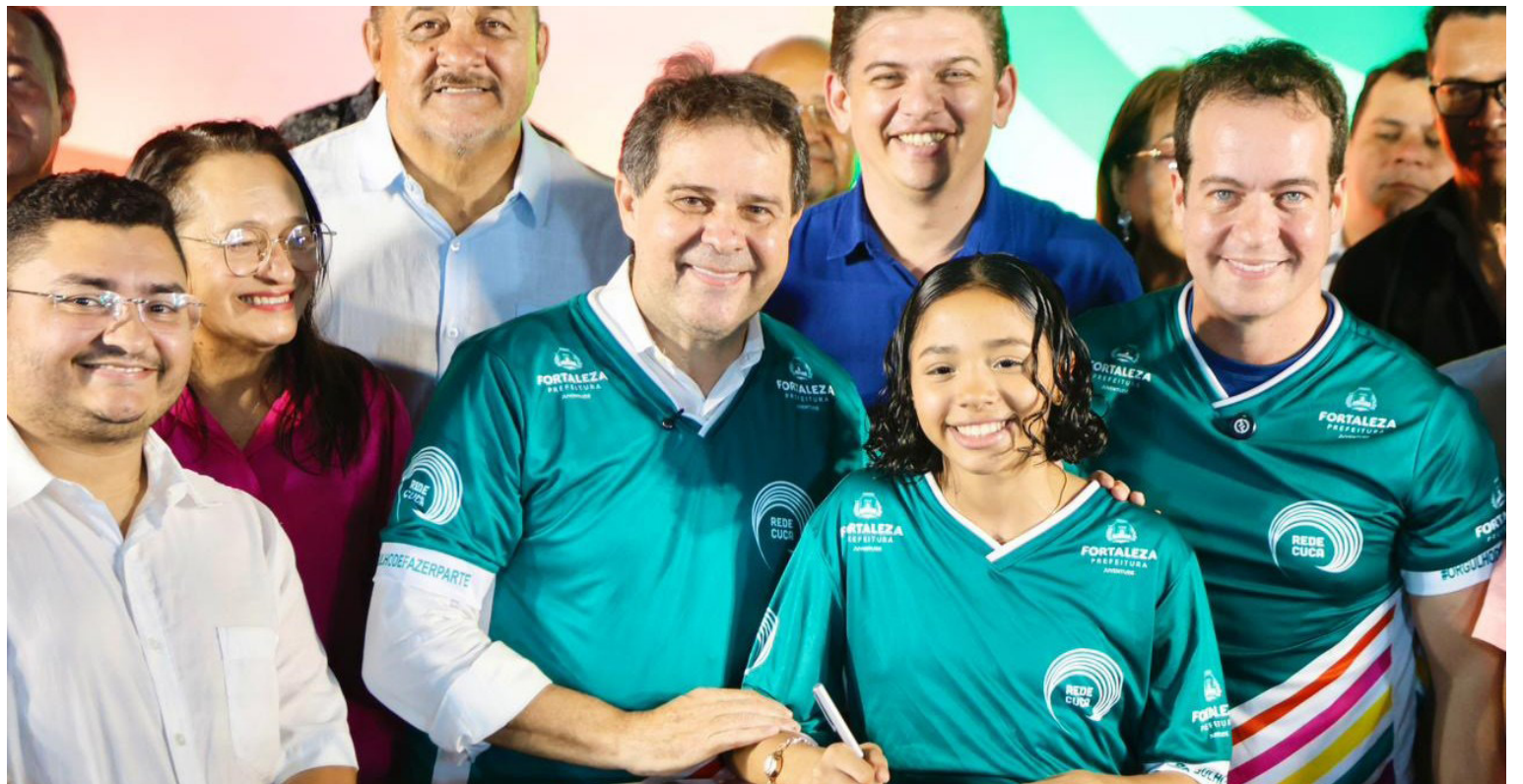
A intervenção no equipamento, conforme a Prefeitura, vai contemplar melhorias estruturais e de acessibilidade.

Na mesma ocasião, o prefeito também anunciou a retomada da