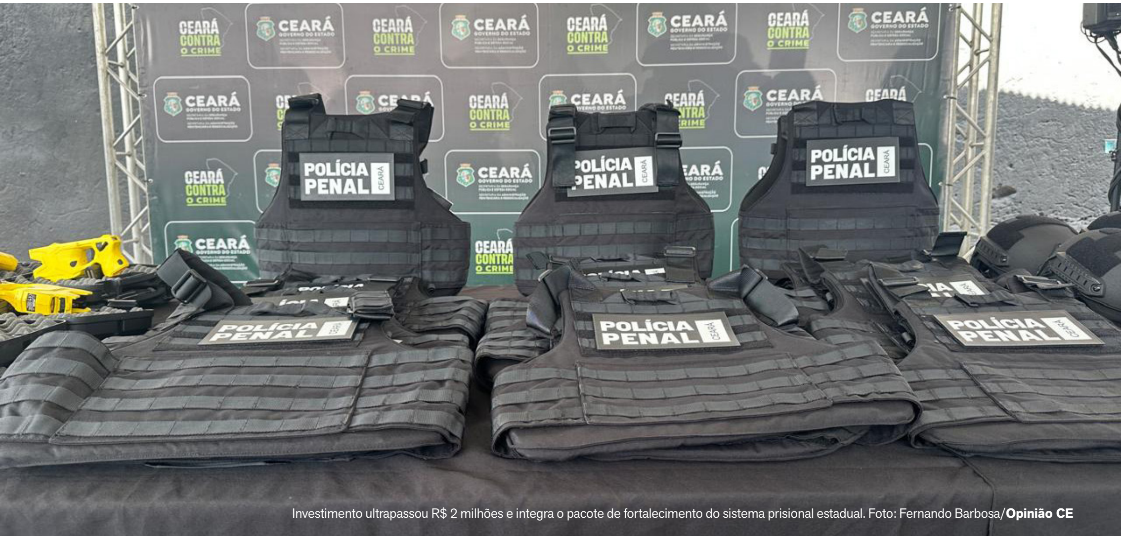
Investimento ultrapassou R$ 2 milhões e integra o pacote de fortalecimento do sistema prisional estadual.

Evandro anuncia reforma de todos os Cucas e autoriza início das obras no Cuca Mondubim CEARÁ, P. 5