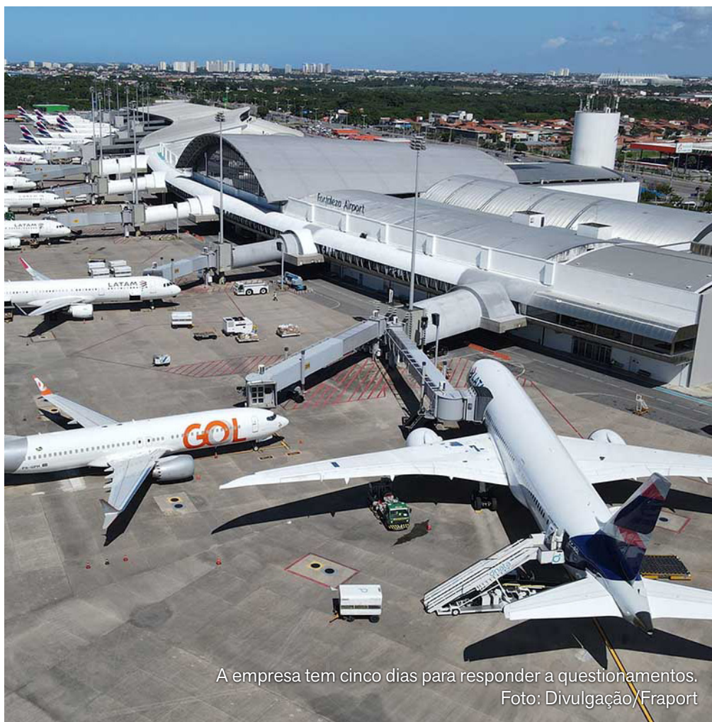
A empresa tem cinco dias para responder a questionamentos.

não proporcionamos condições para a população ser bem atendida pela nossa rede”, afirmou. Atualmente, Fortaleza conta com 134 postos de saúde, seis Unidades de Pronto Atendimento (UPAs), quatro policlínicas, 16 Centros de Atenção Psicossocial (CAPS) e 11 hospitais.