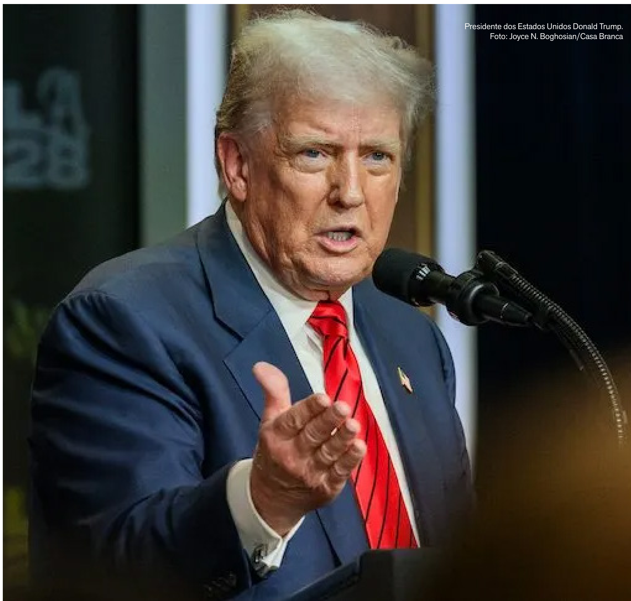
Presidente dos Estados Unidos Donald Trump.

A informação foi divulgada, inicialmente, na rede de TV estadunidense Fox News, e, posteriormente, pela porta-voz da Casa Branca, Karoline Leavitt