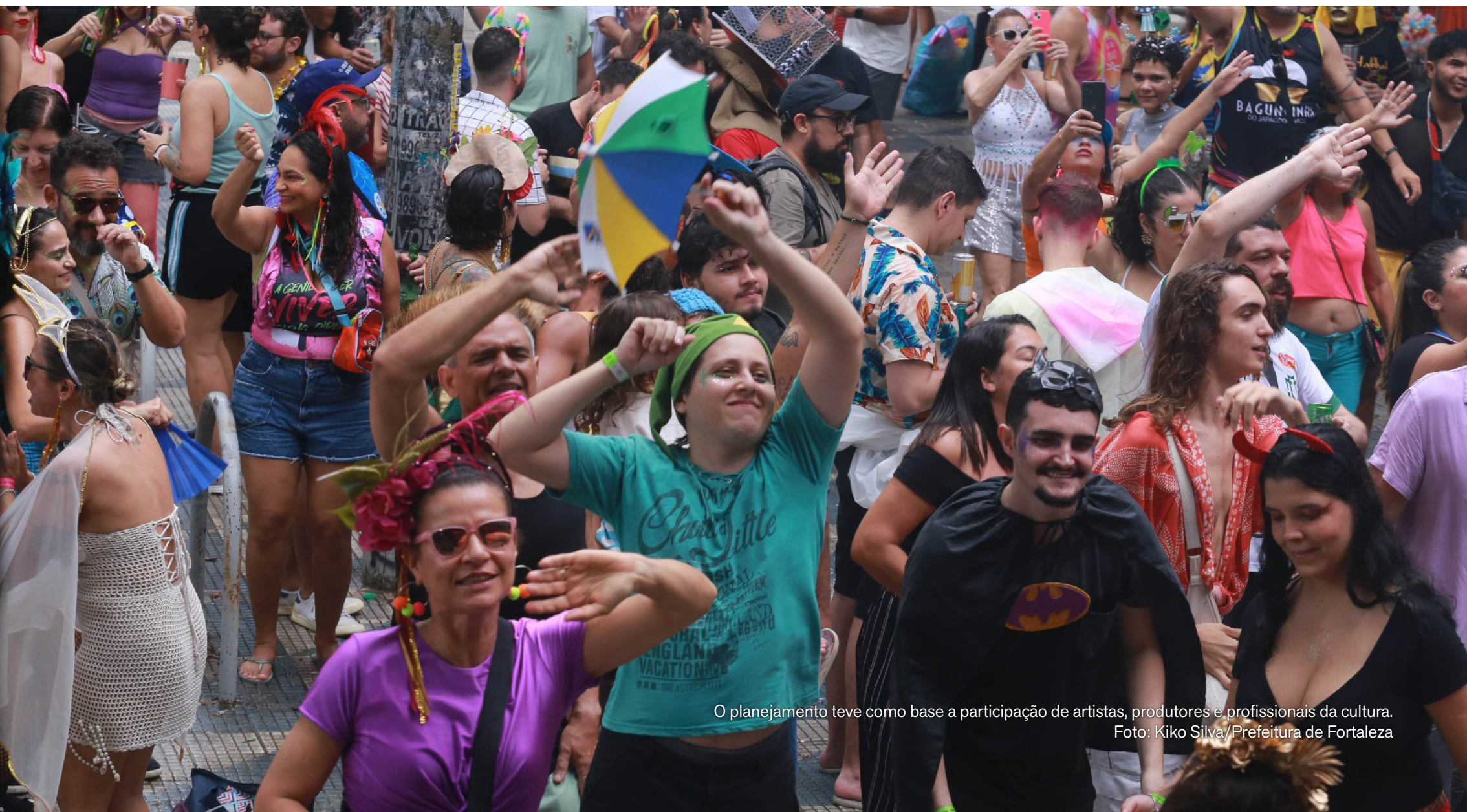
O planejamento teve como base a participação de artistas, produtores e profissionais da cultura.