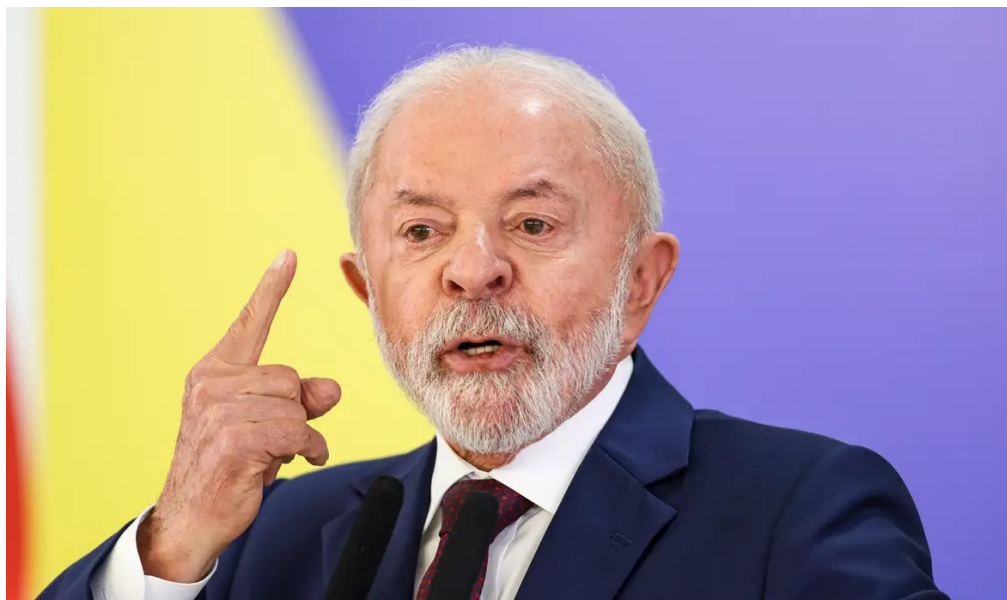
Despacho no Diário Oficial determina atuação de ministérios, AGU, CGU e Aneel.

O presidente Lula (PT) determinou que autoridades do Executivo federal e do setor elétrico adotem “medidas cabíveis e necessárias à plena garantia da prestação adequada, contínua e eficiente do serviço público de distribuição de energia elétrica” à população da região metropolitana de São Paulo. A determinação consta em despacho publicado no Diário Oficial da União (DOU) desta segunda-feira (12).