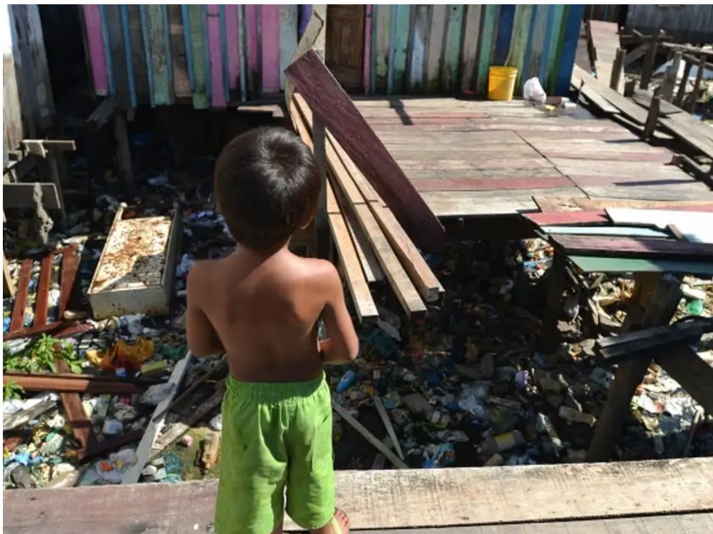
O ritmo da ascensão social entre 2022 e 2024 foi 74% mais acelerado do que o observado entre 2003 e 2014.