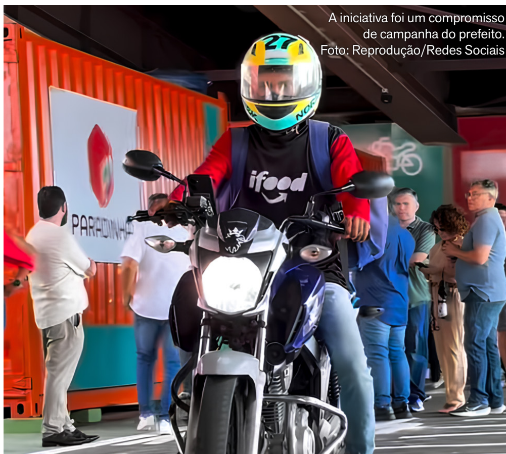
A iniciativa foi um compromisso de campanha do prefeito.

A AMC efetuou toda a sinalização viária no local, que conta com uma sala multiuso destinada para orientações aos motoristas relacionadas