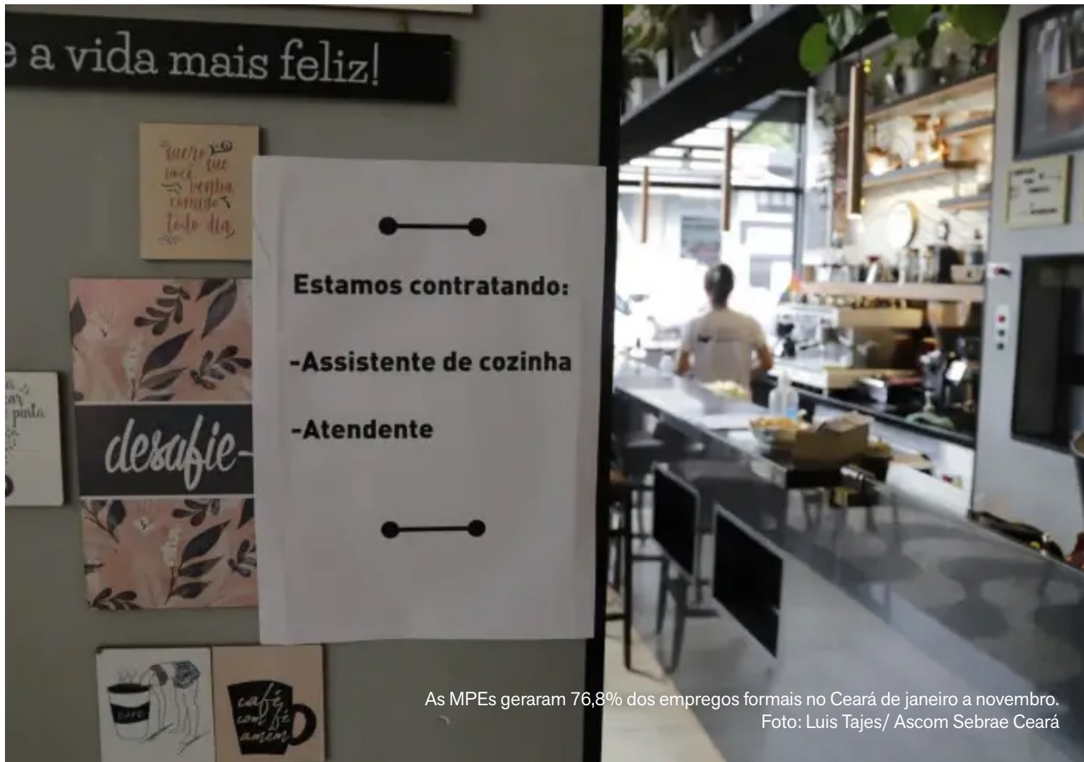
As MPEs geraram 76,8% dos empregos formais no Ceará de janeiro a novembro.

O comércio e os serviços concentraram a maior parte das admissões em novembro. Esses dois setores somaram 2.201 e 1.444 contratações, respectivamente. O resultado reforça o peso das MPEs na dinâmica do mercado de trabalho estadual.