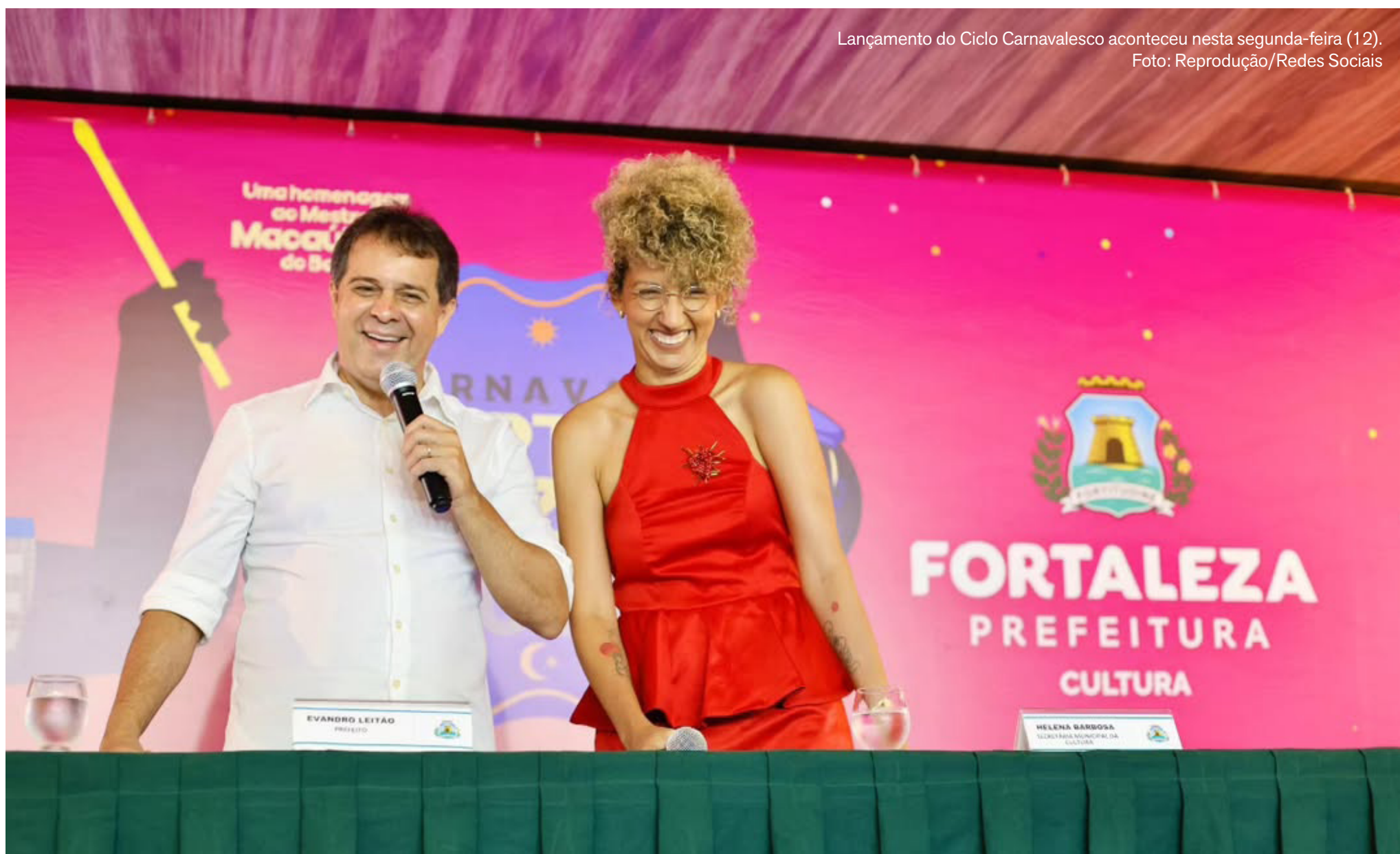
Lançamento do Ciclo Carnavalesco aconteceu nesta segunda-feira (12).

Gestão aposta em palcos nos bairros, escuta ativa e circulação cultural para ampliar acesso, fortalecer territórios e qualificar a experiência da população