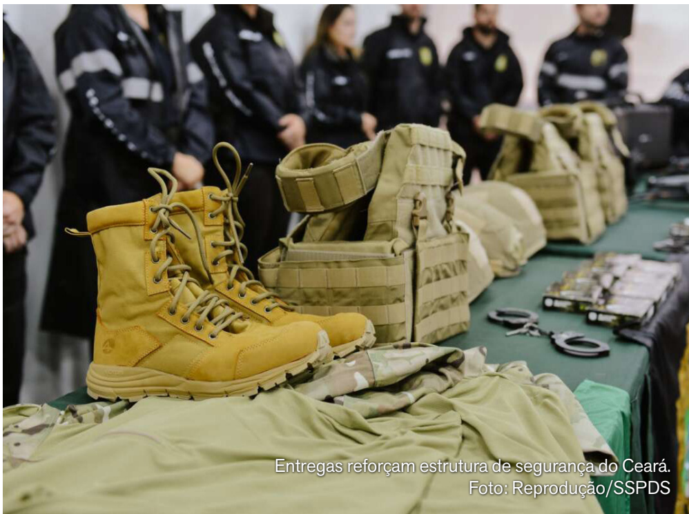
Entregas reforçam estrutura de segurança do Ceará.

O investimento total supera R$ 3 milhões, com recursos do Fundo Nacional de Segurança Pública (FNSP). Entre os itens entregues estão uniformes e coletes balísticos (plates) destinados à Coordenadoria de Operações e Recursos Especiais (Core), além de jaquetas, alge-