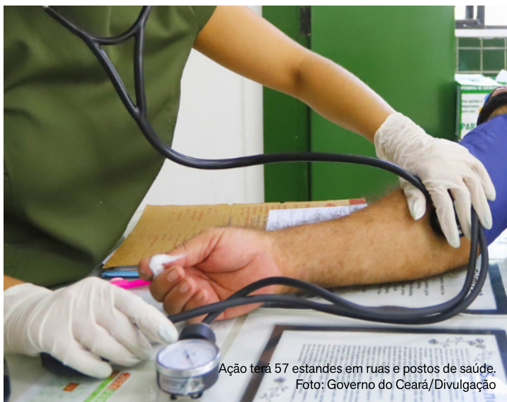
Ação terá 57 stands em ruas e postos de saúde.

Com a nova entrega, o total de equipamentos repassados pelo Governo do Ceará às forças de segurança desde 2023 saltou de 34 mil para 42.472 itens. O reforço também alcança o efetivo, com a nomeação e formação de mais de 3 mil profissionais, sendo 1.945 destinados à Polícia Militar do Ceará (PMCE) e 428 à Polícia Civil. Além disso, estão abertas 2.124 vagas em concursos públicos, com expectativa de novo avanço no fortalecimento das corporações.