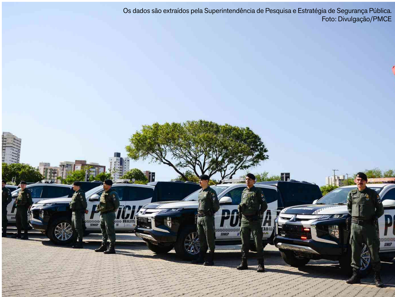
Os dados são extraídos pela Superintendência de Pesquisa e Estratégia de Segurança Pública.

As prisões e apreensões por interação a organizações criminosas somaram 2.541 registros em 2025. Todas as regiões do Estado apresentaram crescimento nesse indicador. Na Capital, o número de capturas chegou a 836, representando aumento de 153,3% em comparação com 2024, quando houve 330 registros. Na Região Metropolitana de Fortaleza (RMF), o crescimento foi de 75,1%, com 942 prisões em 2025, frente a 538 no ano anterior. No Interior Norte, o total chegou a 439 prisões e apreensões, alta de 74,9% em relação a 2024, quando foram registradas 251 ações. Já no Interior Sul, o crescimento alcançou 82,4%, com 321 capturas entre janeiro e dezembro de 2025, contra 176 no período anterior.