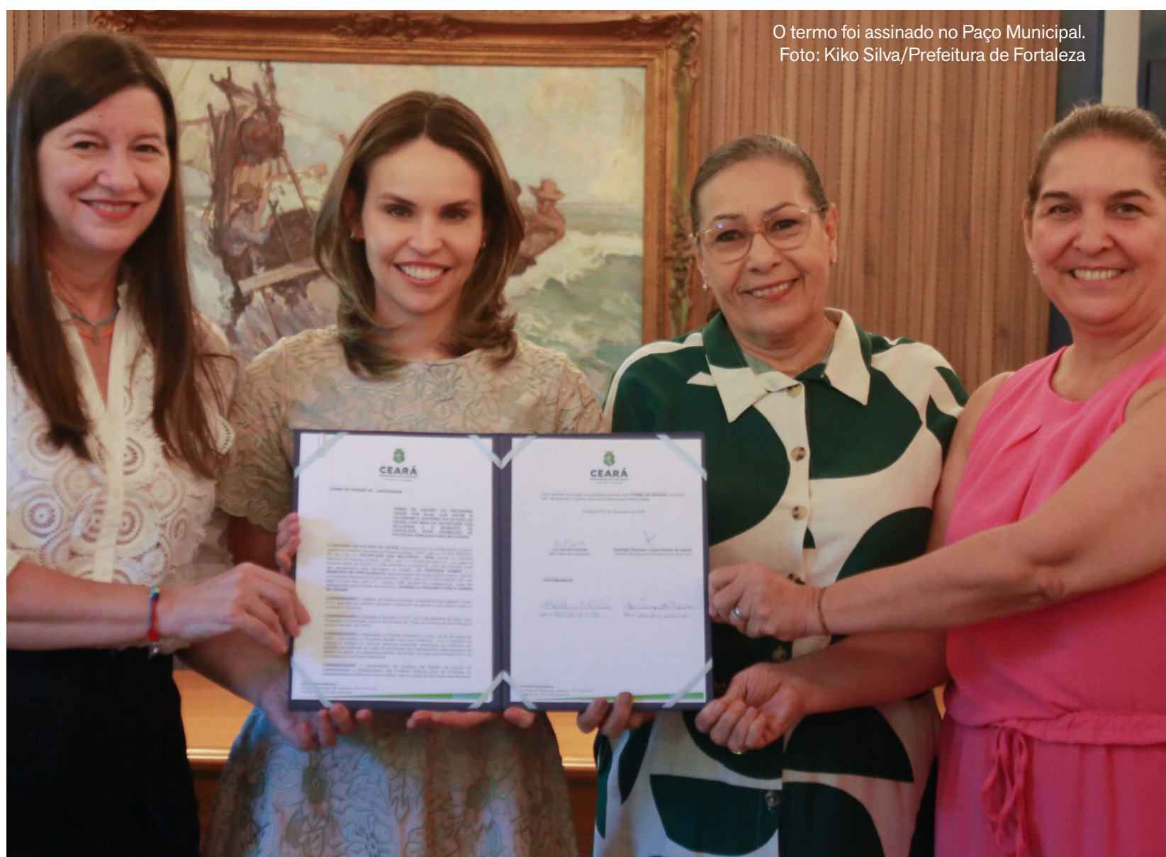
O termo foi assinado no Paço Municipal.