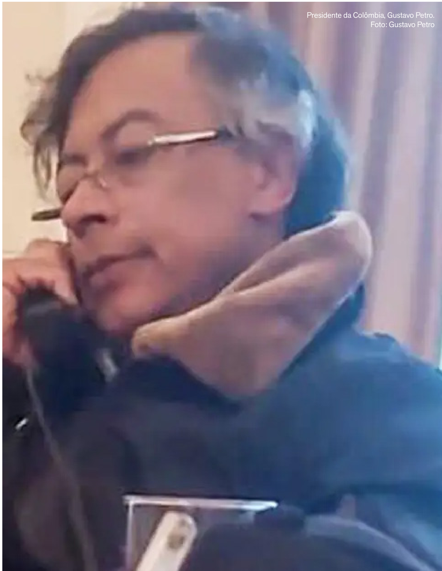
Presidente da Colômbia, Gustavo Petro. Foto: Gustavo Petro

O telefonema ocorre após um período de forte tensão diplomática. Depois da operação militar que sequestrou Nicolás Maduro na Venezuela, Donald