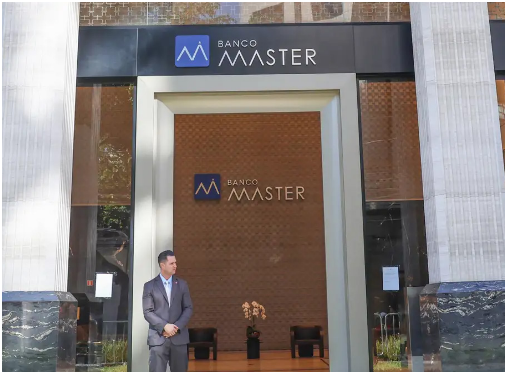
A instituição financeira teve as atividades encerradas oficialmente pelo Banco Central no mesmo dia em que a Polícia Federal deflagrou a Operação Compliance Zero.