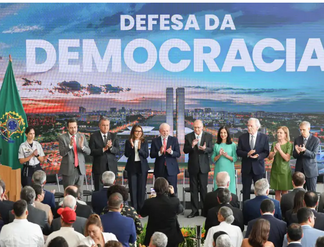
Projeto aprovado pelo Congresso beneficiava condenados pelos ataques às sedes dos Três Poderes.

O presidente Lula (PT) vetou integralmente, na manhã desta quinta-feira (8), o Projeto de Lei da Dosimetria, que promovia a redução de penas dos condenados por participação nos atos criminosos do 8 de Janeiro. A proposta havia sido aprovada pelo Congresso Nacional em dezembro do ano passado.