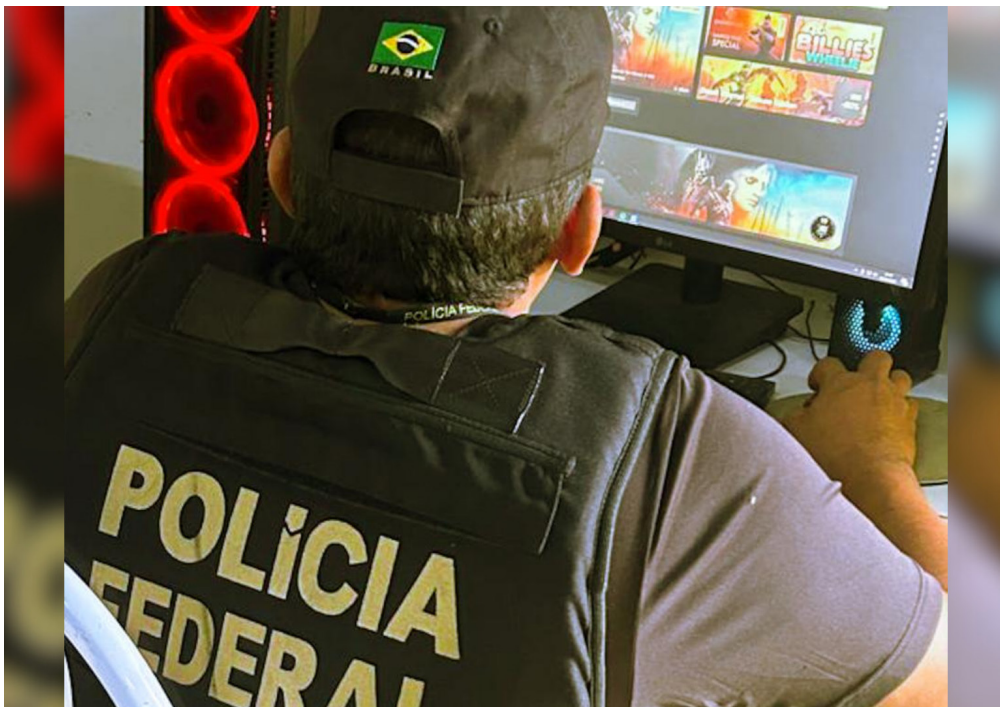
Operação Propositum Sine Filtrum apura indícios de pagamentos ilegais.

Conforme as investigações, teriam ocorrido transferências bancárias e pagamentos via PIX para diversas pessoas, incluindo menores de idade, visando assegurar a presença em atividades de campanha. As apurações apontam que valores teriam sido oferecidos de forma reiterada, sobretudo a jovens, para participação em eventos políticos. Mensagens analisadas pelos investigadores indicam, ainda, orientações para a concessão de “incentivos” aos participantes.