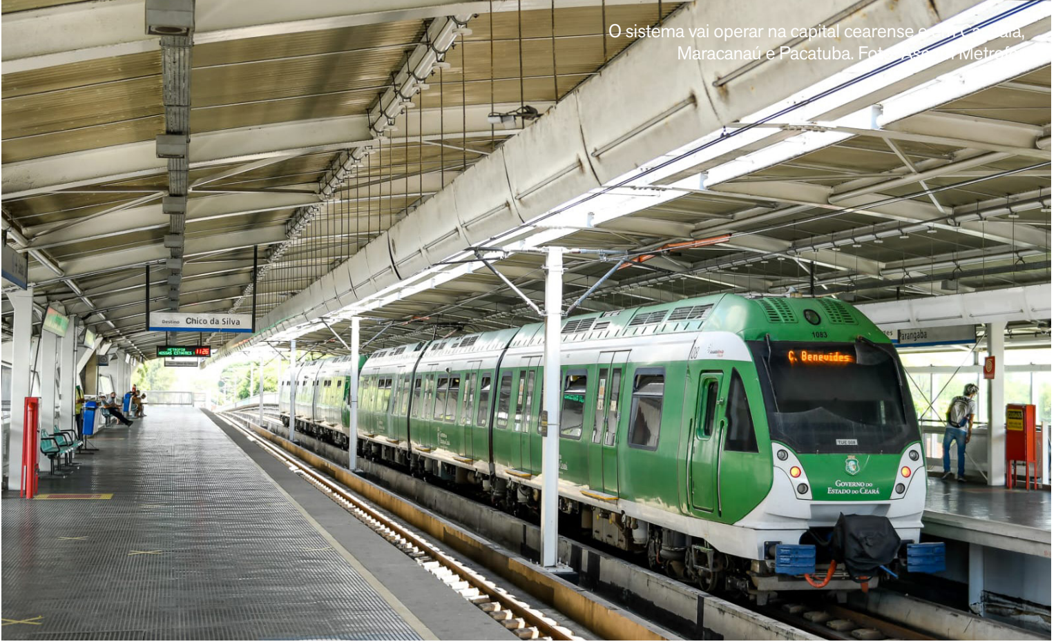
O sistema vai operar na capital cearense e em Caucaia, Maracanaú e Pacatuba.

Detalhes como data, hora, local e circunstâncias da ocorrência dão robustez às informações, o que é importante para a formalização junto às autoridades policiais. Ao longo do tempo, esses registros formam um banco de dados estratégico que subsidia po-