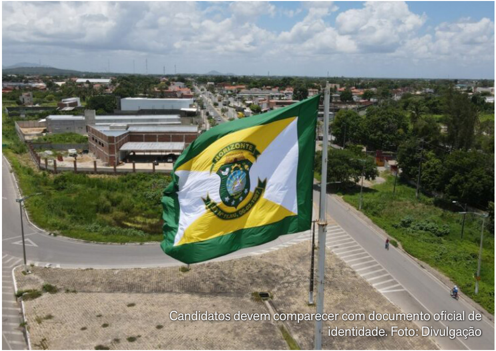
Candidatos devem comparecer com documento oficial de identidade.

Neste mês de janeiro, a Metrofor e a SEM farão início a uma campanha de divulgação nas redes sociais, nas estações, nos trens e na imprensa. O objetivo é garantir que todos os usuários conheçam o canal e saibam como utilizá-lo. As peças de comunicação destacam o número do WhatsApp e o QR Code de acesso direto.