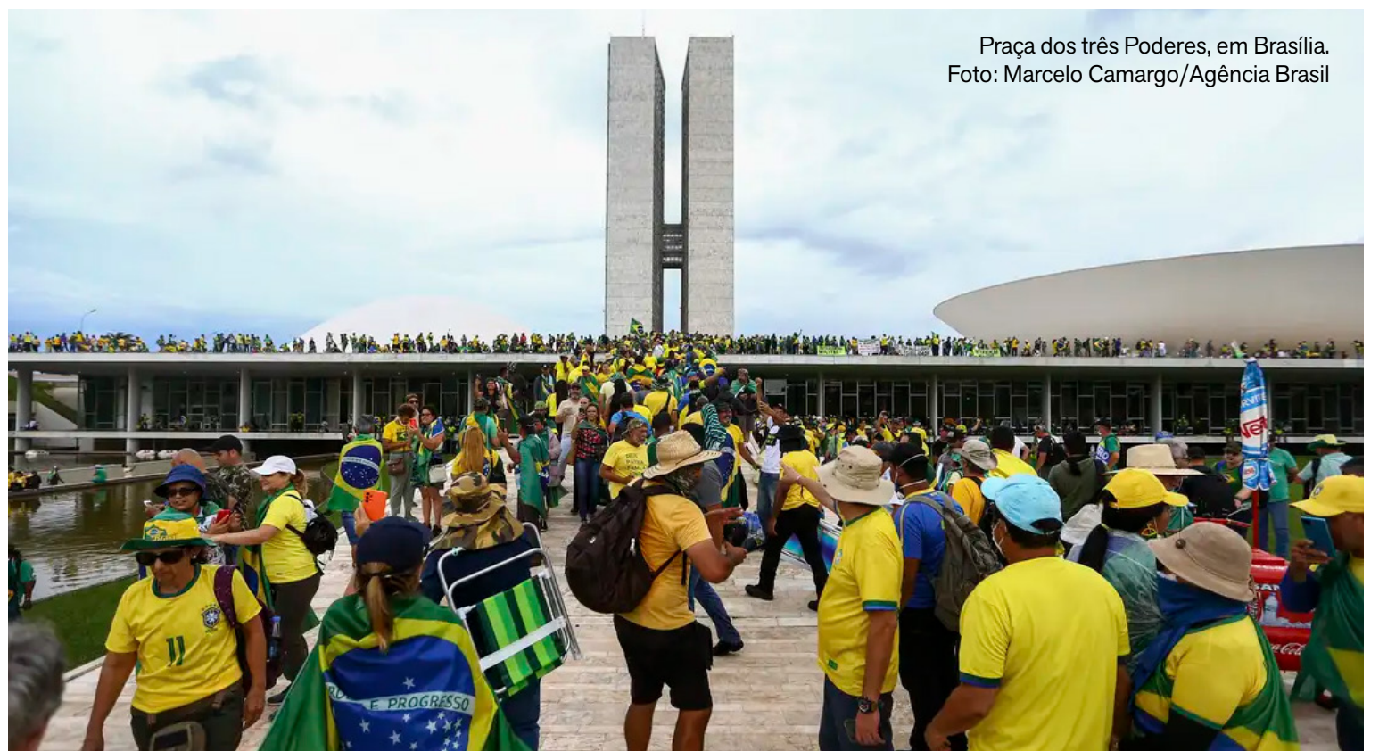
Praça dos três Poderes, em Brasília.

A partir de 2025, o Supremo Tribunal Federal (STF) começou a análise da denúncia da Procuradoria-Geral da República (PGR). Foram denunciadas