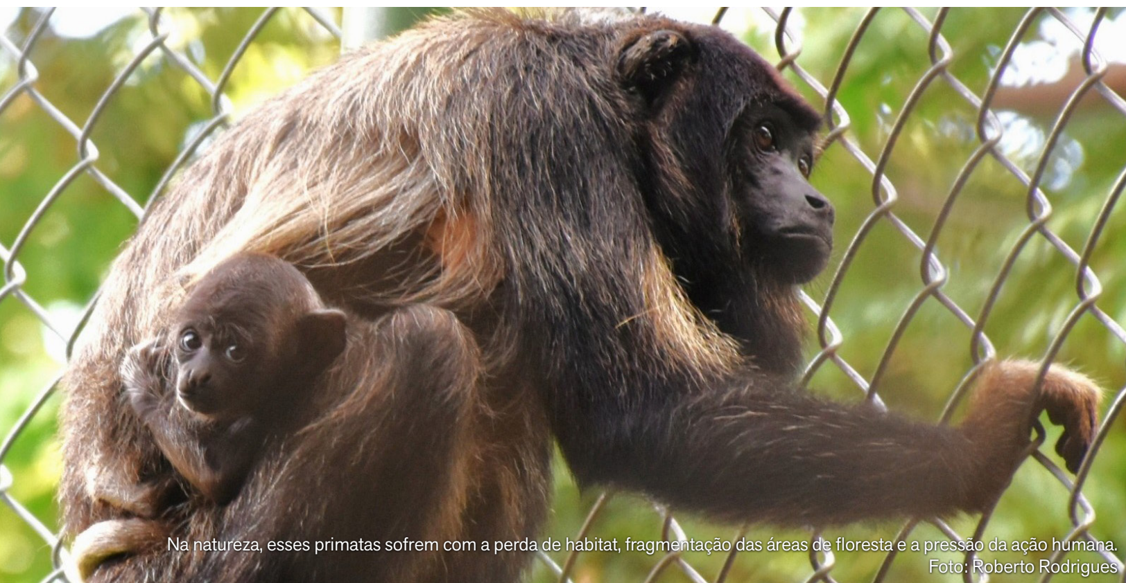
Na natureza, esses primatas sofrem com a perda de habitat, fragmentação das áreas de floresta e a pressão da ação humana.

Com um mês de vida completado nesta quarta-feira (7), o filhote de guariba-da-Caatinga é resultado do único casal da espécie mantido em zoológicos no mundo