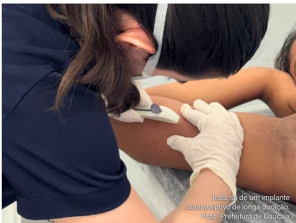
Trata-se de um implante contraceptivo de longa duração.

A Prefeitura de Caucaia, por meio da Secretaria Municipal de Saúde, iniciou, no fim de dezembro de 2025, o processo de inserção do Implanon na rede municipal de saúde. A ação começou na unidade modelo Antônio Jander Pereira Machado, no bairro Araturi, e representa um avanço na ampliação do acesso aos métodos contraceptivos no município. A implantação do procedimento ocorrerá de forma gradual nas seis unidades modelo de Caucaia, seguindo cronograma definido pela Assessoria Técnica das Linhas de Cuidado Materno Infantil. A organização do fluxo tem como objetivo assegurar segurança, qualidade e efetividade na oferta do método, além de possibilitar a expansão progressiva do atendimento à população.