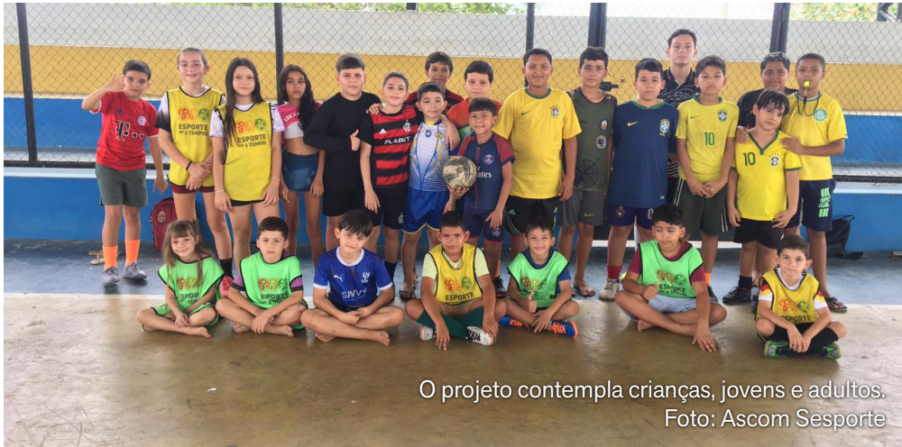
O projeto contempla crianças, jovens e adultos.

O acesso às vagas ocorre diretamente nos núcleos instalados em cada região. A atualização cadastral ou a inscrição inicial deve ser feita presencialmente com o professor responsável pela tur-