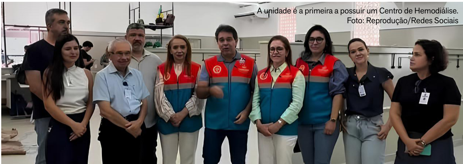
A unidade é a primeira a possuir um Centro de Hemodiálise.

Em vídeo divulgado nas suas redes, o prefeito mostra uma visita que realizou à Santa Casa. “É mais um serviço da Prefeitura Municipal de Fortaleza para atender de forma humanizada a