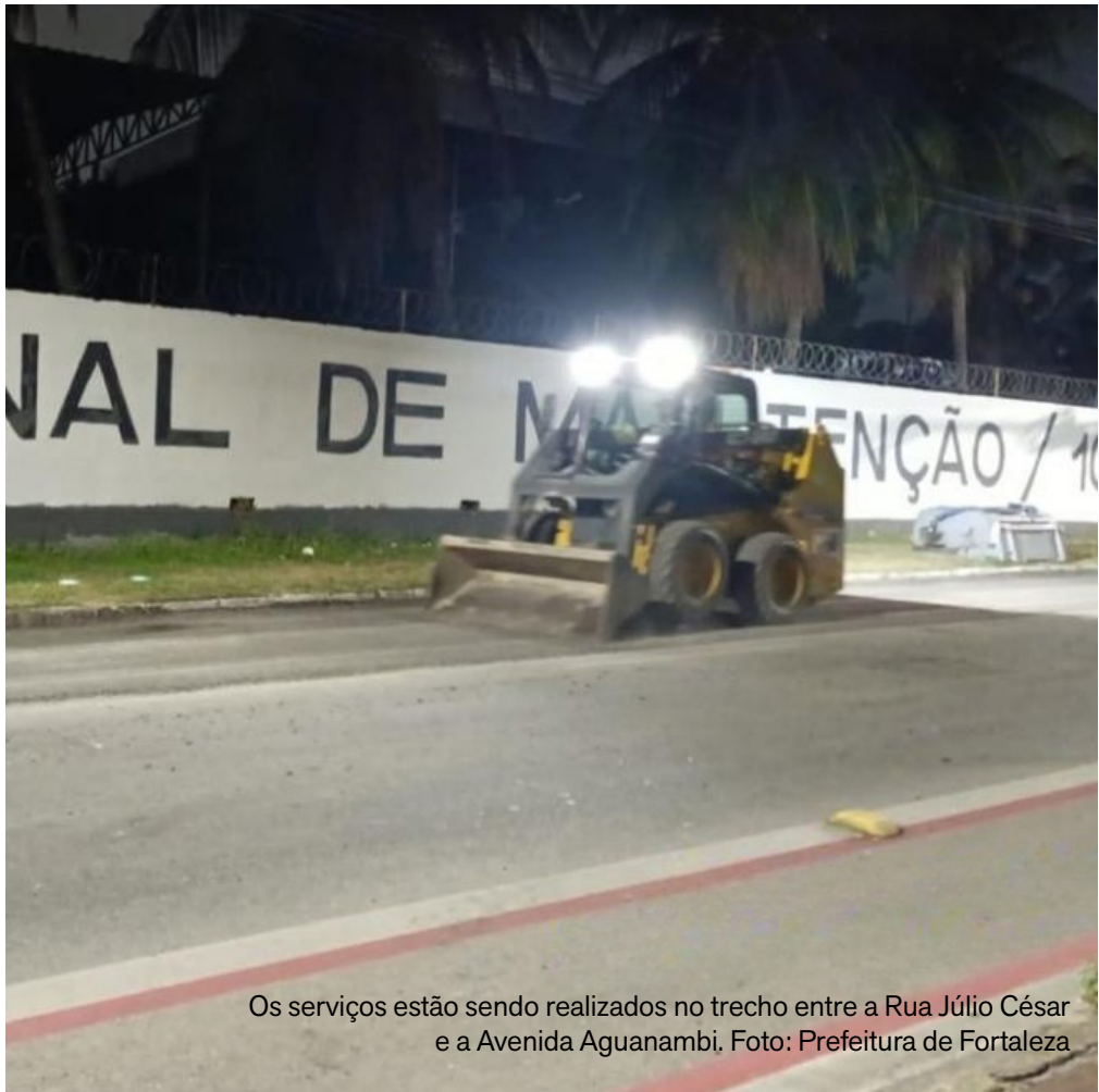
Os serviços estão sendo realizados no trecho entre a Rua Júlio César e a Avenida Aguanambi.

Com a prorrogação da ampliação temporária, a Prefeitura busca aumentar a cobertura vacinal e ampliar a proteção contra doenças associadas ao HPV, reforçando as ações de prevenção e cuidado com a saúde da população jovem de Fortaleza.