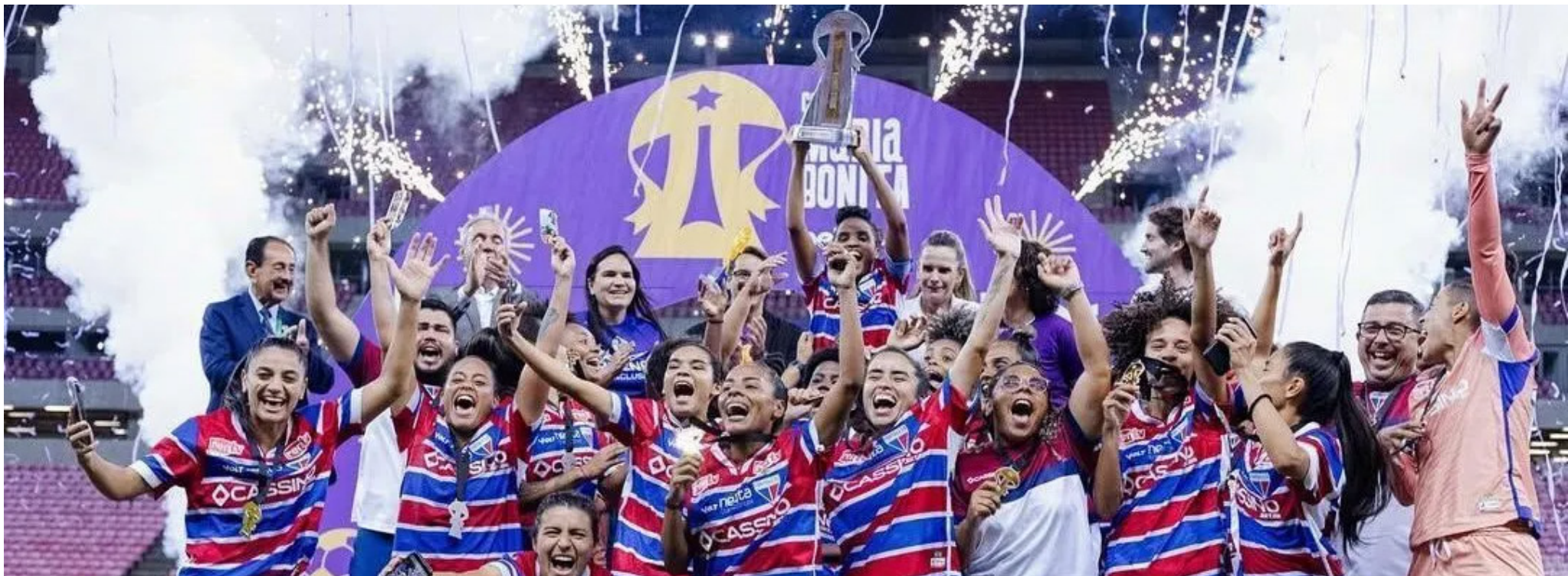
Fortaleza foi campeão da 1ª edição da Copa Maria Bonita.

A iniciativa cearense é voltada à formação de novas atletas