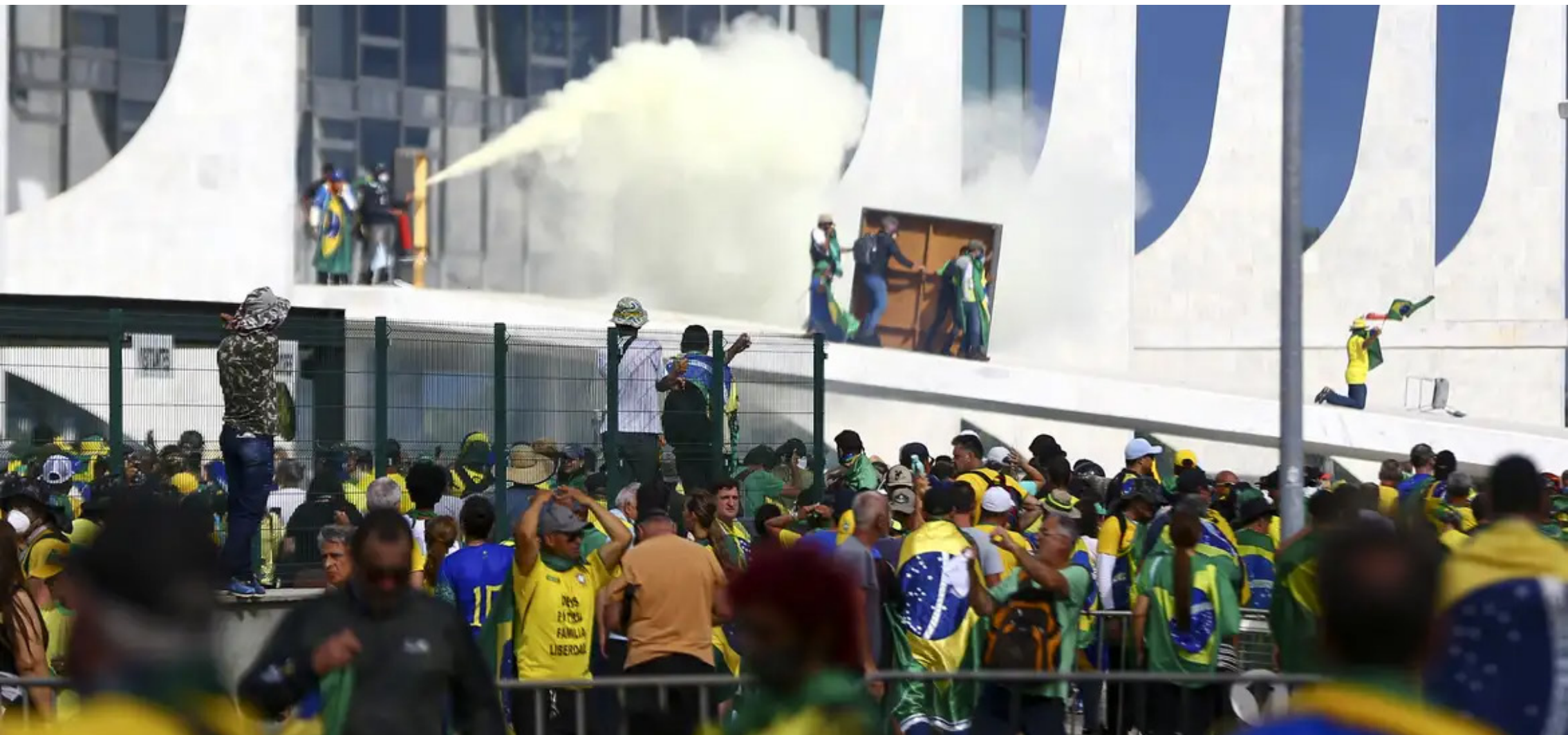
Praça dos três Poderes, em Brasília.

Nesta quinta (8), manifestantes vão às ruas de cidades de todo o Brasil para defender o Estado Democrático de Direito. Em entrevista ao Opinião CE , doutor em Direito Constitucional analisou o legado do julgamento da trama golpista POLÍTICA, P. 7