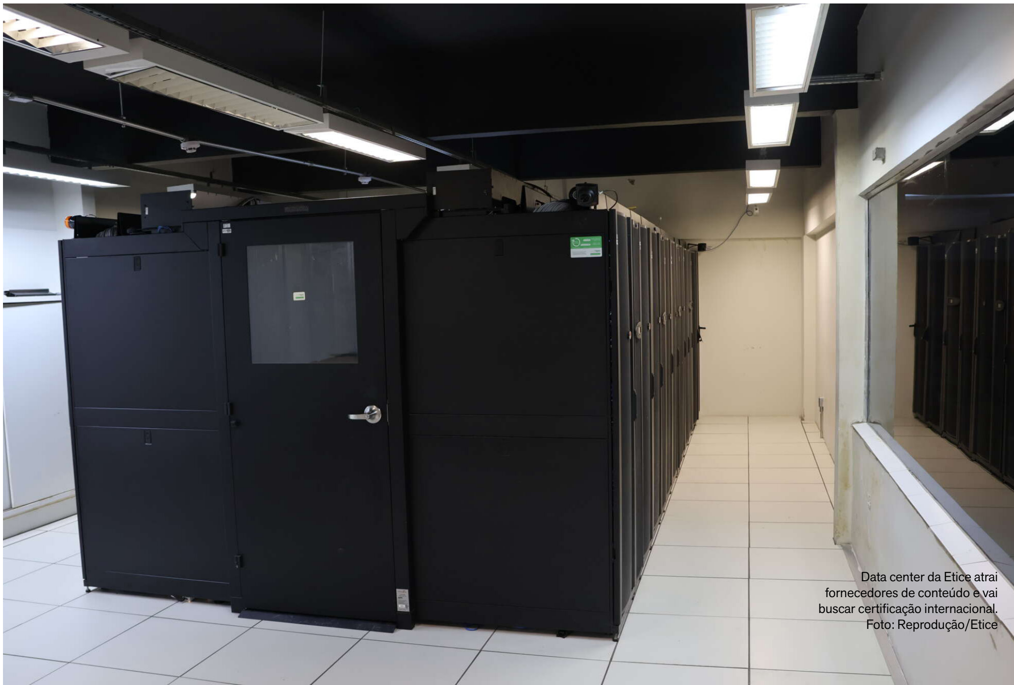
Data center da Etice atraindo fornecedores de conteúdo e vai buscar certificação internacional.

O data center da Etice abriga não apenas a troca de tráfego de dados, mas também equipamentos essenciais à operação do Cinturão Digital, uma das maiores redes públicas de fibra óptica do Brasil, com 139 municípios interligados ao longo de 5.921 km, conectando órgãos públicos e serviços essenciais. Além disso, o Observatório Nacional escolheu essa infraestrutura para instalar um relógio atômico de césio, equipamento que estabelece a referência primária de tempo no Brasil, com precisão superior à do GPS e funcionamento independente de satélites estrangeiros – fator que amplia a segurança de aplicações financeiras, redes 5G, transações comerciais e sistemas críticos.