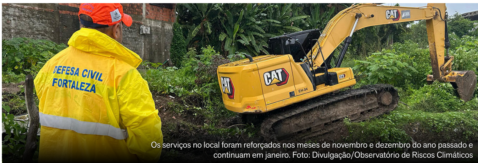
Os serviços no local foram reforçados nos meses de novembro e dezembro do ano passado e continuam em janeiro.

A Prefeitura de Fortaleza intensificou as ações de prevenção contra alagamentos com a limpeza de açudes, lagoas, canais e bueiros da cidade e anunciou o uso do Observatório de Riscos Climáticos como ferramenta de apoio durante a próxima quadra chuvosa. A iniciativa envolve a Defesa Civil e as secretarias municipais da Infraestrutura, da Conservação e das Regionais. A quadra chuvosa no Ceará acontece de fevereiro a maio.