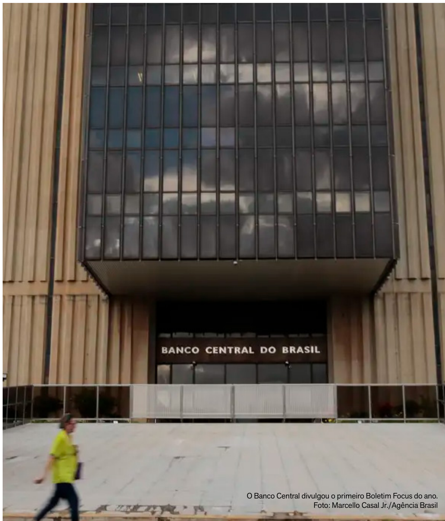
O Banco Central divulgou o primeiro Boletim Focus do ano.

A meta de inflação é definida pelo Conselho Monetário Nacional (CMN) e, para 2025, está fixada em 3%.