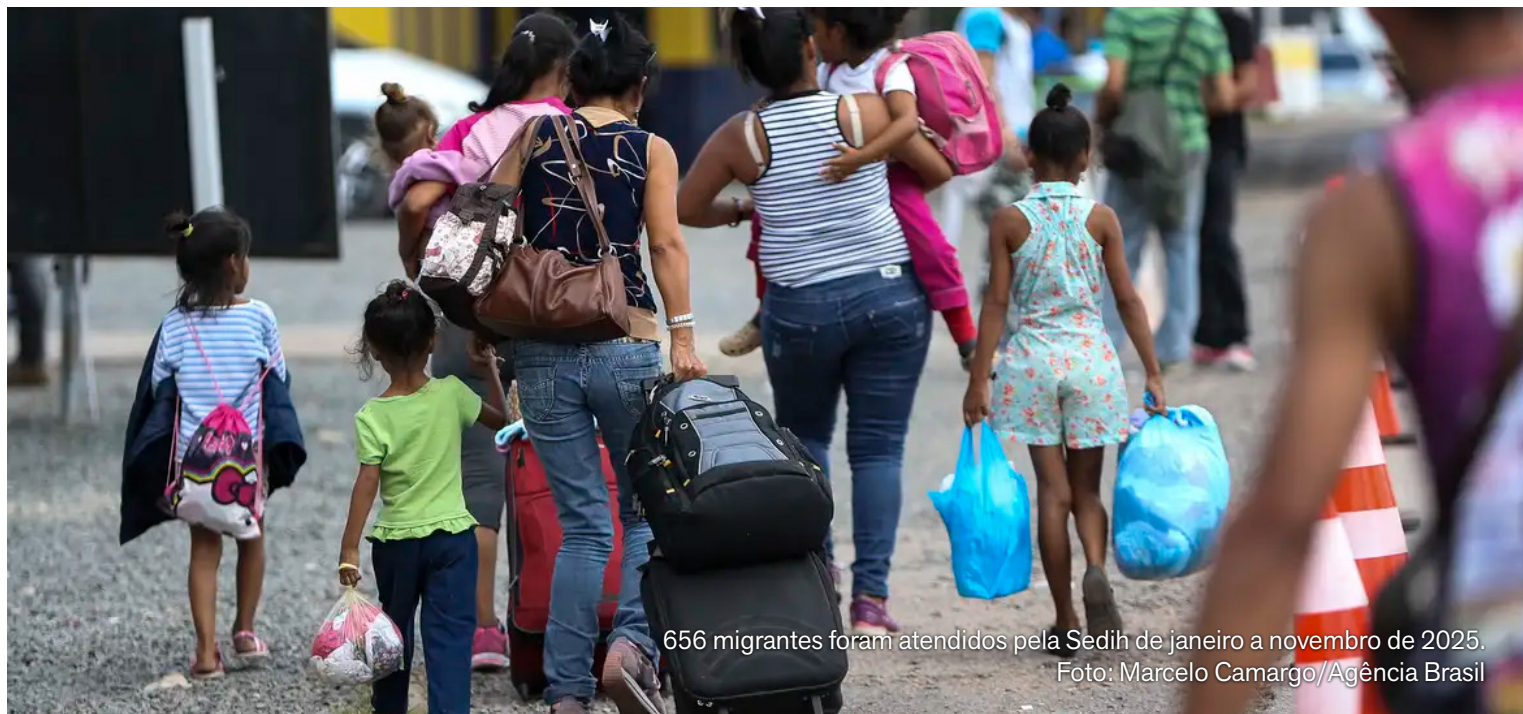
656 migrantes foram atendidos pela Sedih de janeiro a novembro de 2025.

A Sedih destacou que o Ceará possui “uma política pública estruturada e permanente voltada ao acolhimento, à proteção e à garantia de direitos de migrantes e refugiados”. Por meio da Política Estadual para Migrantes, Refugiados e Apátridas e do Enfrentamento ao Tráfico de Pessoas, instituída em 2025, são garantidas ações como: atendimento humanizado; acompanhamento por equipe multidisciplinar; orientação para regularização migratória; encaminhamentos para acesso às políticas de assistência social, saúde, educação e trabalho. As ações