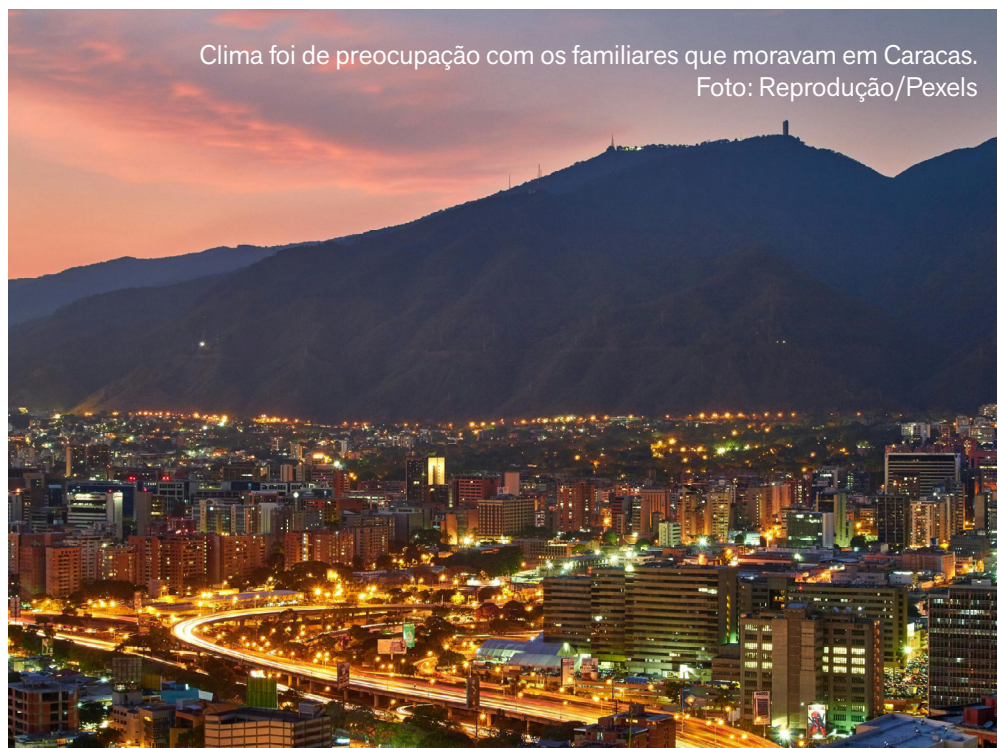
Clima foi de preocupação com os familiares que moravam em Caracas.

Após o ocorrido na madrugada de sábado, o clima foi de tensão e preocupação com os familiares que moravam em Caracas, local onde houve o atentado. A entrevistada conta que ficou em constante comunicação. “Hubo bastante miedo porque lo vivieron de cerca” – “Havia muito medo, porque eles vivenciaram tudo em primeira mão”, relatou. Durante o fim de semana, a sensação era de calma. As lojas permaneceram fechadas e as pessoas ficaram dentro de casa.