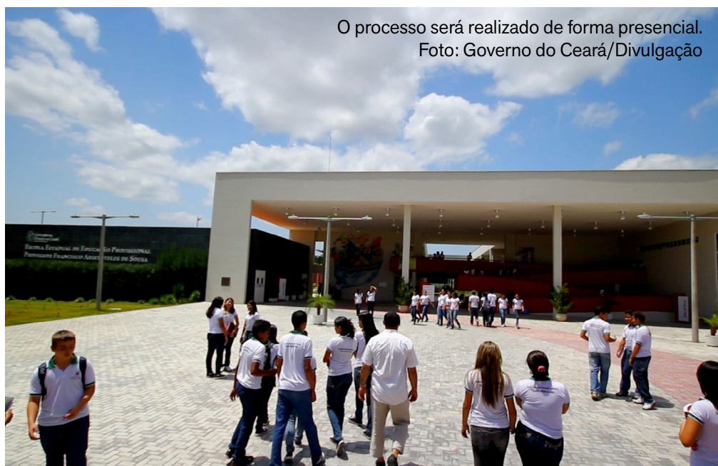
O processo será realizado de forma presencial.

A Secretaria da Educação do Ceará (Seduc) inicia, nesta terça-feira (6), o período de matrículas para o ano letivo de 2026 nas escolas regulares da rede pública estadual localizadas no interior do Estado. O processo é voltado, inicialmente, para estudantes novatos e oriundos das redes municipais de ensino. As matrículas serão realizadas de forma presencial, diretamente na secretaria da escola escolhida. O início das aulas está previsto para o dia 4 de fevereiro de 2026.