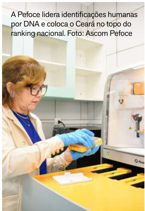
A Pefoce lidera identificações humanas por DNA e coloca o Ceará no topo do ranking nacional.

A Perícia Forense do Estado do Ceará (Pefoce) alcançou o maior número de identificações humanas do País, em valores absolutos, no campo de pessoas desaparecidas por meio do banco de perfis genéticos. O dado integra levantamento divulgado em novembro pela Rede Integrada de Bancos de Perfis Genéticos (RIBPG).