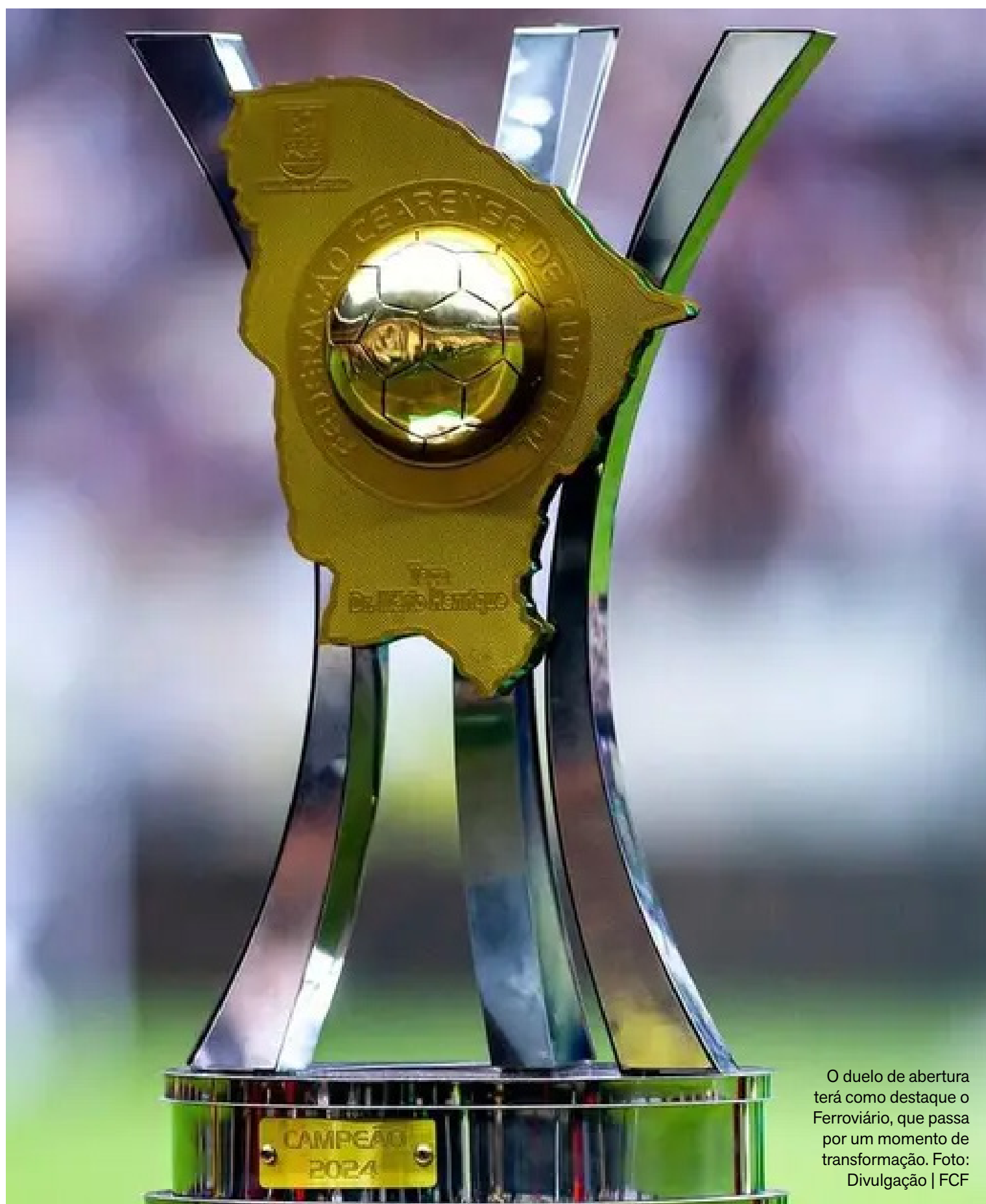
O duelo de abertura terá como destaque o Ferroviário, que passa por um momento de transformação.

O encontro entre os semifinalistas abre a temporada para os times cearenses em um campeonato que se especula acessível para os times de divisões menores