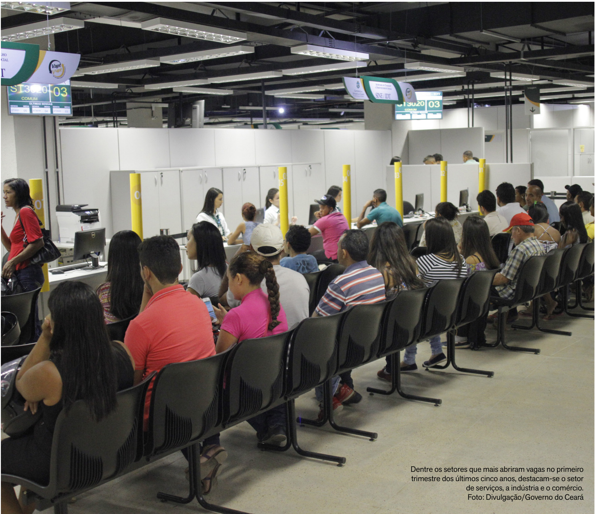
Dentre os setores que mais abriram vagas no primeiro trimestre dos últimos cinco anos, destacam-se o setor de serviços, a indústria e o comércio.

FELIPE BARRETO FELIPE.BARRETO@OPINIAOCE.COM.BR