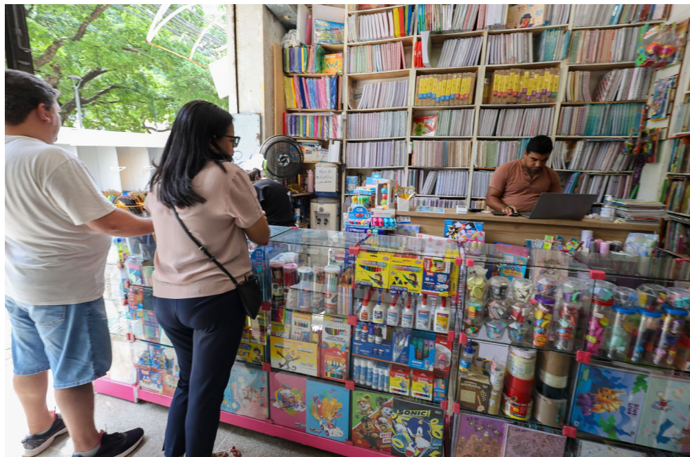
Janeiro é marcado pela busca por itens do material escolar.

Segundo Valéria Cavalcante, as escolas particulares não podem exigir a compra de itens de uso coletivo, como papel higiênico, giz ou bolas, nem impor marcas específicas ou locais determinados para a aquisição dos materiais. A lista deve se restringir a