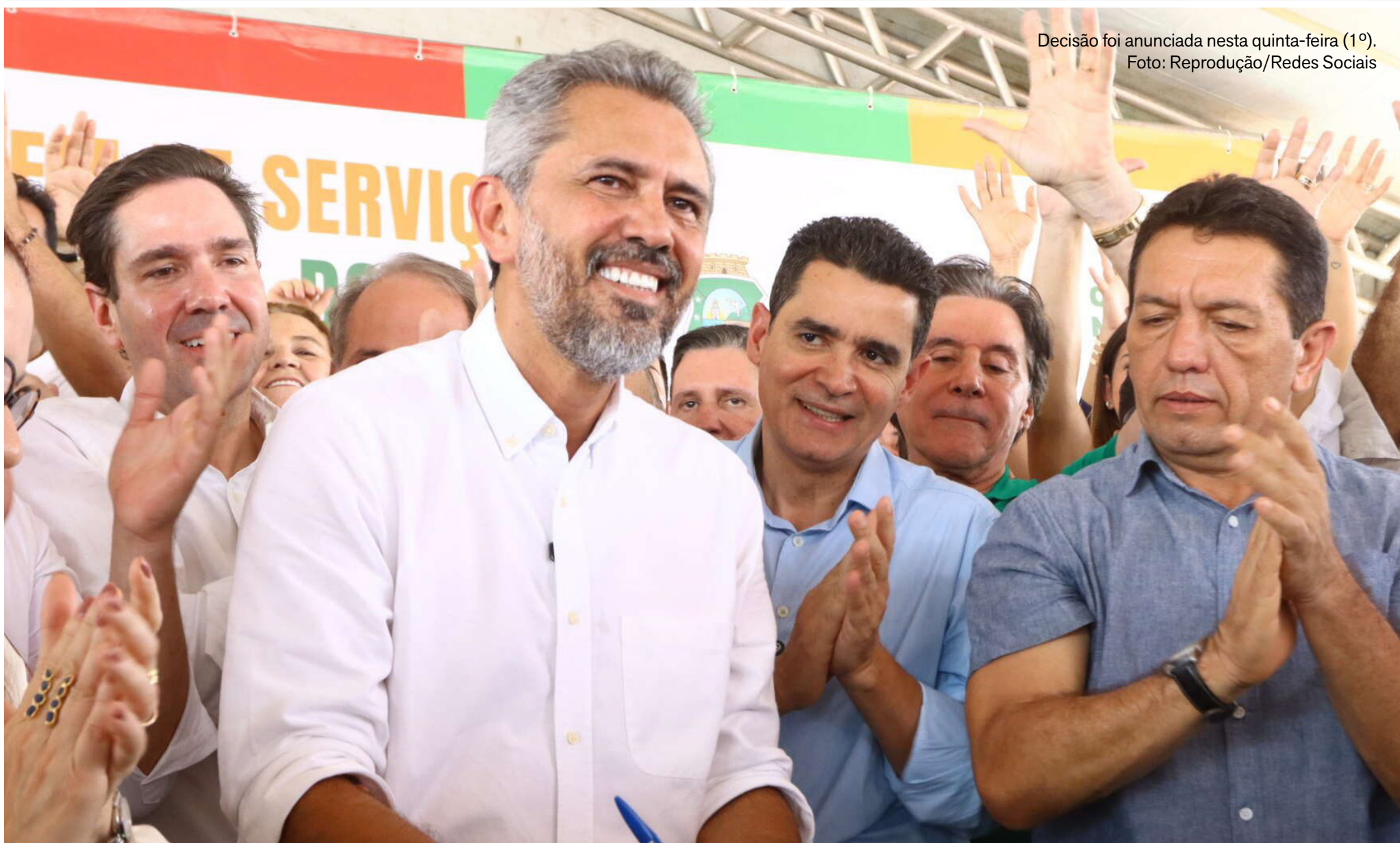
Decisão foi anunciada nesta quinta-feira (1º).