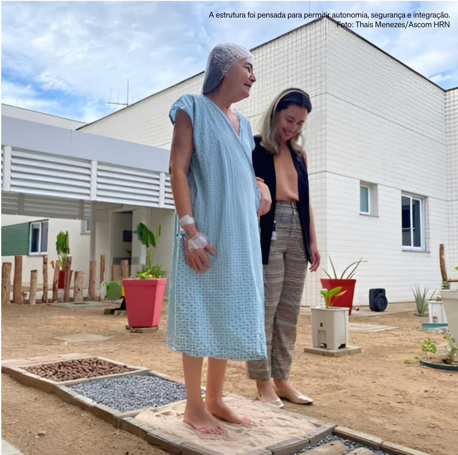
A estrutura foi pensada para permitir autonomia, segurança e integração.

Inaugurado em dezembro do ano passado, o jardim sensorial do HRN possui caminhos amplos, antiderrapantes e adaptados para cadeiras de rodas e andadores, garantindo circulação com autonomia e