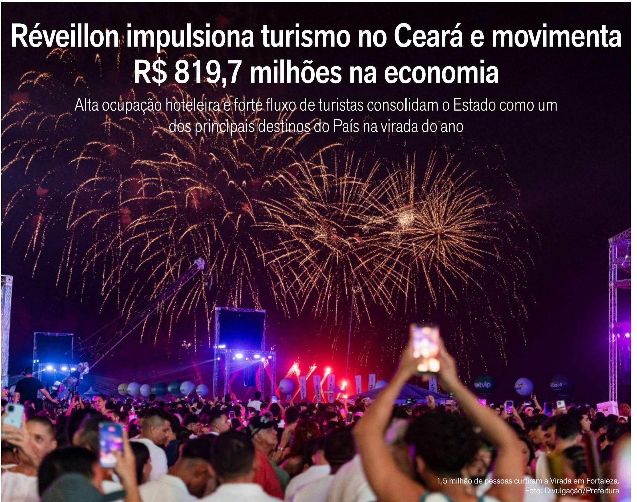
1,5 milhão de pessoas curtiram a Virada em Fortaleza.

Alta ocupação hoteleira e forte fluxo de turistas consolidam o Estado como um dos principais destinos do País na virada do ano