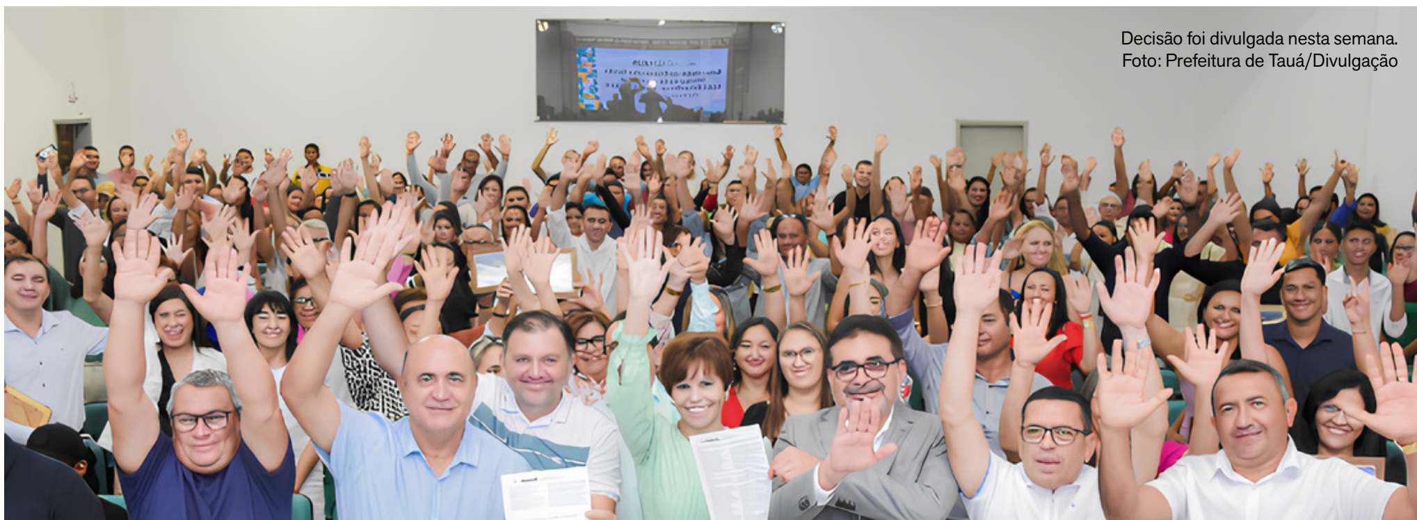
Decisão foi divulgada nesta semana.

Iniciativa fortalece políticas de bem-estar escolar e amplia ações de prevenção à violência na rede pública de ensino