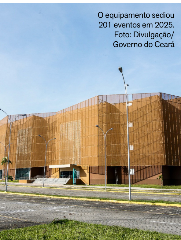
O equipamento sediou 201 eventos em 2025.

O Centro de Eventos do Ceará, em Fortaleza, encerrou 2025 com o melhor desempenho de sua história e consolidou o protagonismo do Estado no segmento de eventos, feiras e congressos no Brasil. Ao longo do ano, o equipamento sediou 201 eventos - número recorde desde a inauguração - e recebeu mais de 1 milhão de visitantes, impulsionando o turismo, a economia e a cadeia produtiva associada ao setor.