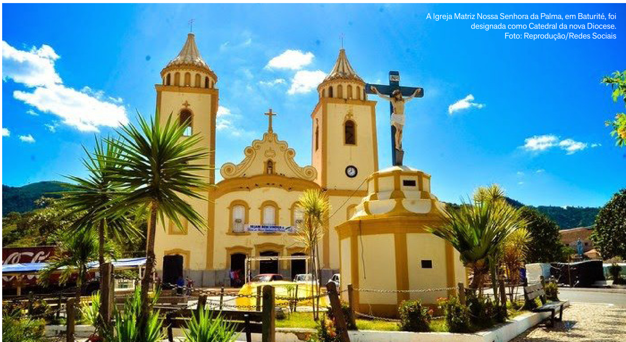
A Igreja Matriz Nossa Senhora da Palma, em Baturité, foi designada como Catedral da nova Diocese.

O território diocesano contempla os municípios de Acarape, Aracoiaba, Aratuba, Barreira, Baturité, Canindé, Caridade, Guaramiranga, Mulungu, Pacoti, Ocara, Palmácia, Paramoti e Redenção. A inclusão de Canindé, em especial, confere à Diocese uma dimensão pastoral estratégica, considerando o fluxo contínuo de romeiros atraídos pelo Santuário de São Francisco das Chagas ao longo de todo o ano. Reconhecido nacionalmente, o Santuário recebe milhões de fiéis em grandes romarias e celebrações, exigindo uma dinâmica pastoral intensa, com acompanhamento permanente das comunidades, dos peregrinos e das atividades religiosas. A integração à Diocese de Baturité busca garantir maior proximidade administrativa e pastoral, fortalecendo a atuação da Igreja junto aos fiéis da região.