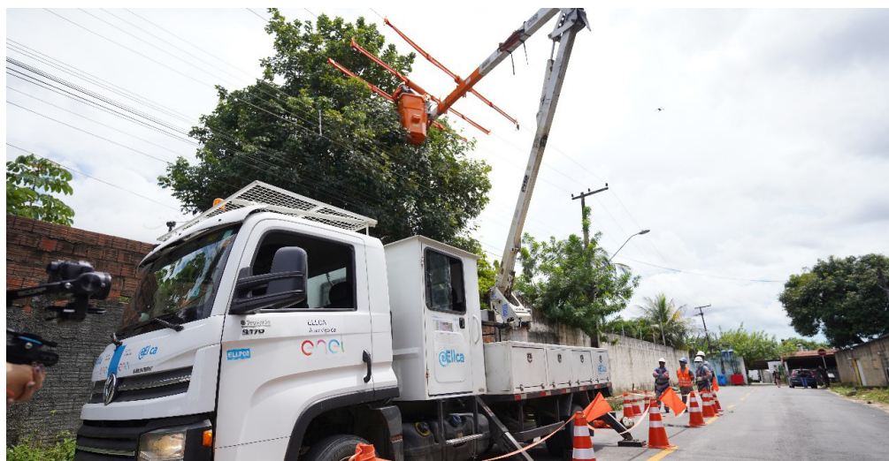
Agência deu sinal verde para 17 distribuidoras em 2025.

A Agência Nacional de Energia Elétrica (Aneel) encerrou o ano de 2025 com aval para a renovação contratual de 17 distribuidoras de energia elétrica em todo o País, segundo nota divulgada pela própria agência. Apesar do avanço, dois processos permanecem pendentes: os das concessões da Enel no Ceará e da Enel Distribuição em São Paulo. No caso cearense, o impasse ganhou força no início deste mês, quando o diretor da Aneel Fernando Mosna, relator do processo de renovação da concessão da Enel Ceará, votou pela não recomendação da antecipação da prorrogação contratual ao Ministério de Minas e Energia (MME). A decisão foi fundamentada no descumprimento do critério de eficiência relacionado à continuidade do fornecimento de energia, um dos principais indicadores avaliados pela agência reguladora.