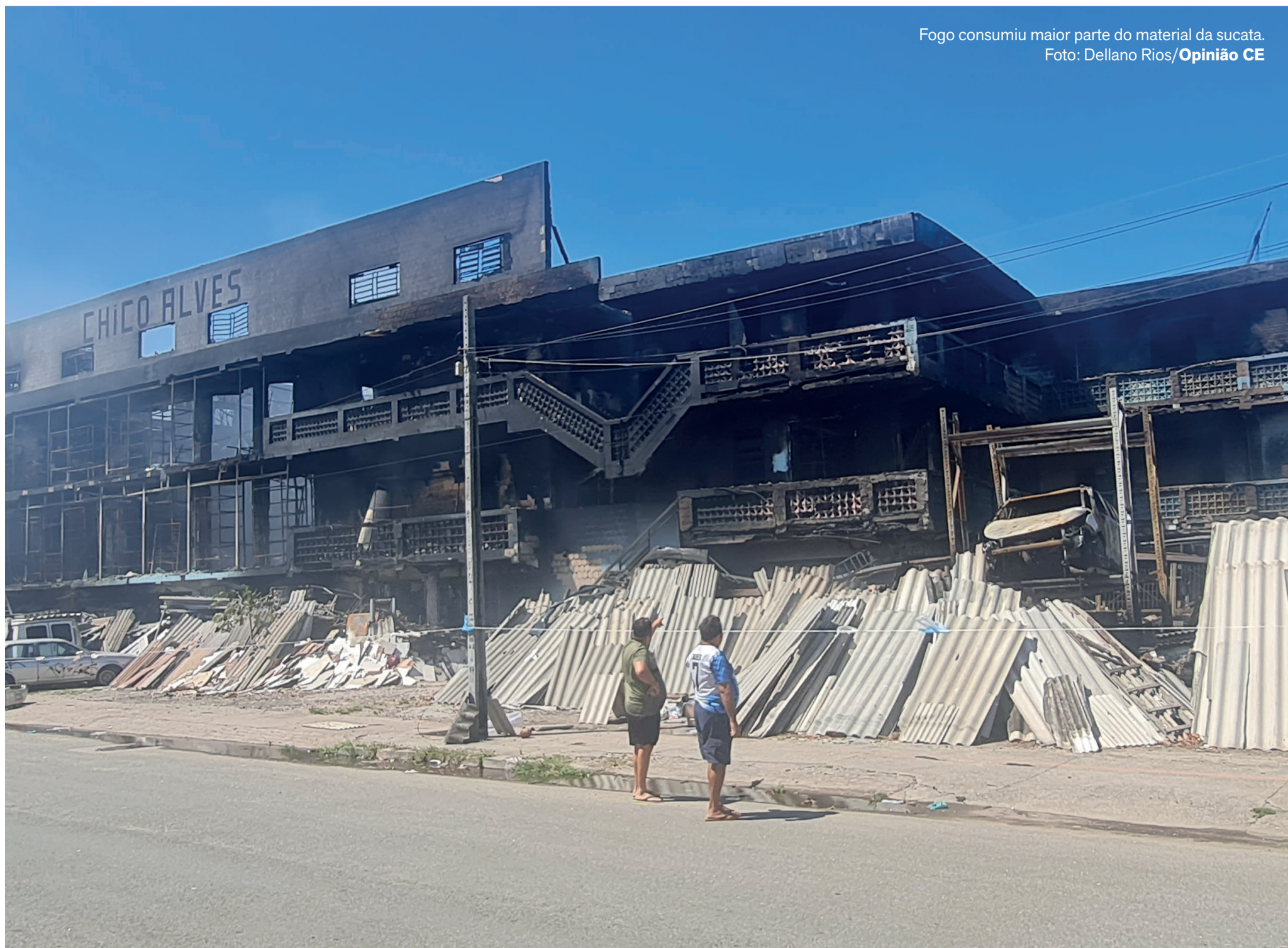
Fogo consumiu maior parte do material da sucata.

Em operação desde o começo da década de 1970, o estabelecimento chama a atenção por suas dimensões; local já foi cenário até de produções audiovisuais