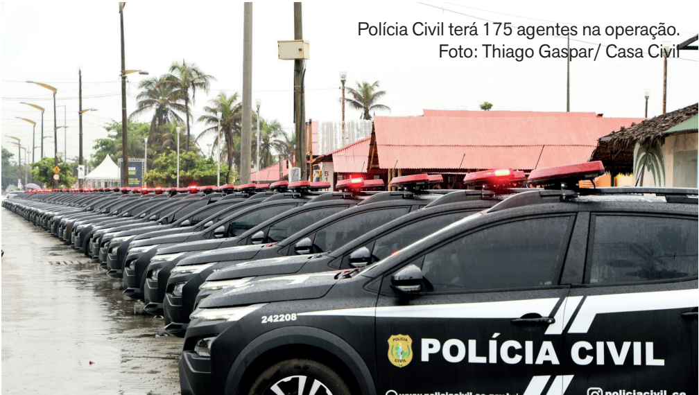
Polícia Civil terá 175 agentes na operação.

As Forças de Segurança do Ceará terão a atuação reforçada durante o Réveillon 2026 em Fortaleza, que neste ano contará com polos de programação no Aterro da Praia de Iracema, em Messejana e no Conjunto Ceará.