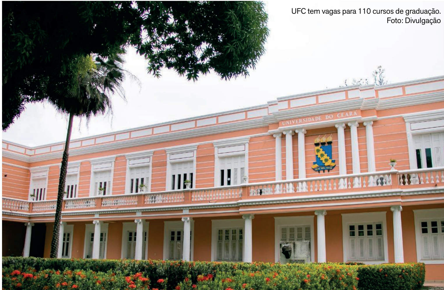
UFC tem vagas para 110 cursos de graduação.

Embora mantenha a mesma estrutura de 2025, o edital do Sisu 2026 apresenta ajustes voltados à ampliação da transparência, da segurança jurídica e à melhor ocupação das vagas públicas. Uma das principais novidades é a ampliação do uso das notas do Exame Nacional do Ensino Médio (Enem). A partir de 2026, o Sisu considerará os resultados das três últimas edições do exame — 2023, 2024