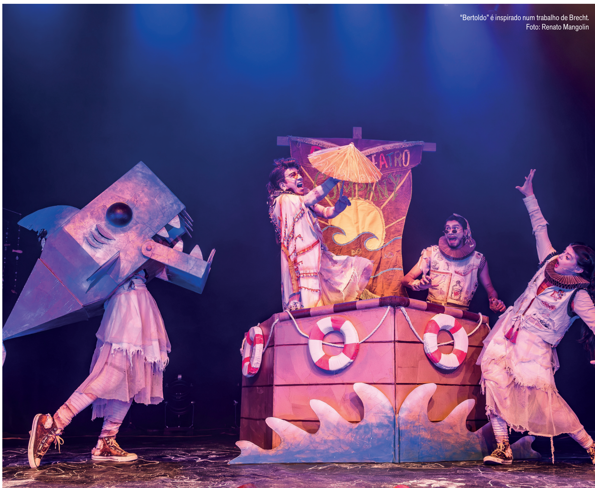
“Bertoldo” é inspirado num trabalho de Brecht.

Espetáculo gratuito da companhia amazonense Buia Teatro fica em cartaz até 4 de janeiro, com sessões de sexta a domingo