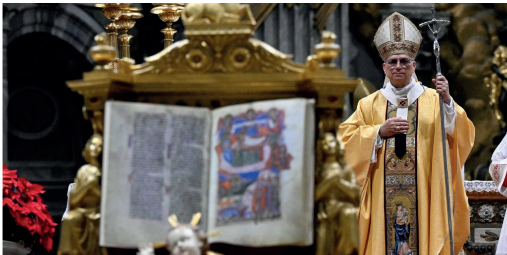
Papa Leão XIV durante a Santa Missa de Natal.

O papa Leão XIV criticou as condições enfrentadas pelos palestinos na Faixa de Gaza durante o sermão de Natal desta quinta-feira (25), na Basílica de São Pedro, no Vaticano. Em um discurso considerado mais direto do que o habitual para a data, o pontífice fez referência às famílias que vivem em tendas expostas ao frio, à chuva e ao vento após semanas de conflito.