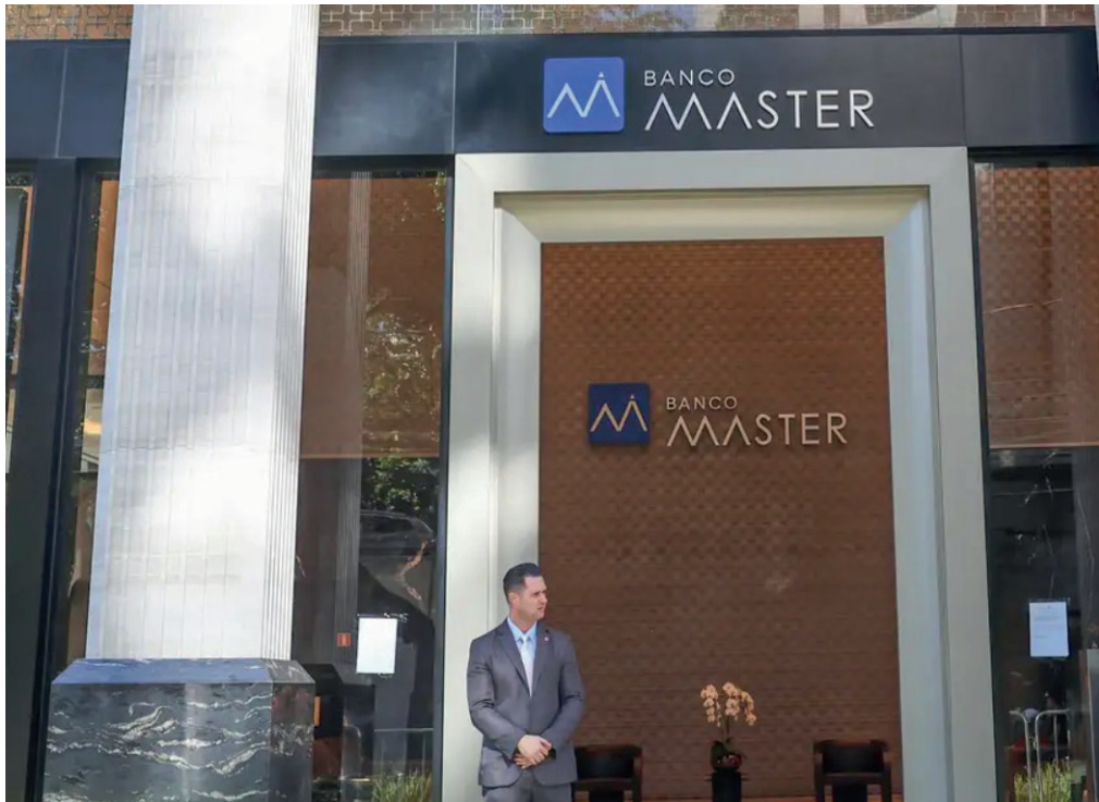
Master é alvo de investigação de fraudes financeiras.