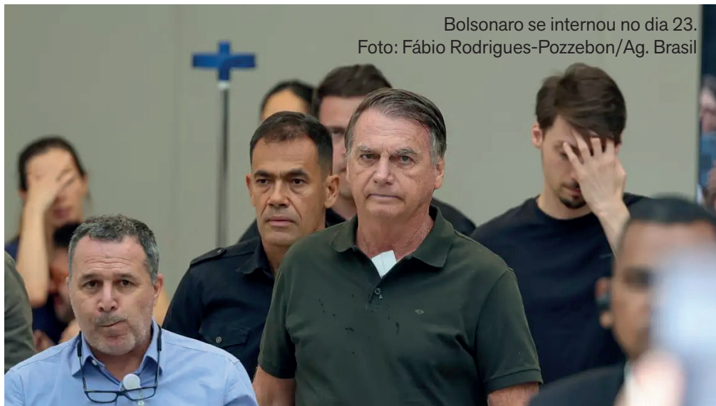
Bolsonaro se internou no dia 23.

A equipe médica informou que a cirurgia do ex-presidente Jair Bolsonaro foi concluída com sucesso nesta quinta-feira (25), no hospital DF Star, em Brasília. O procedimento terminou às 12h55, após cerca de três horas de duração, e transcorreu sem intercorrências.