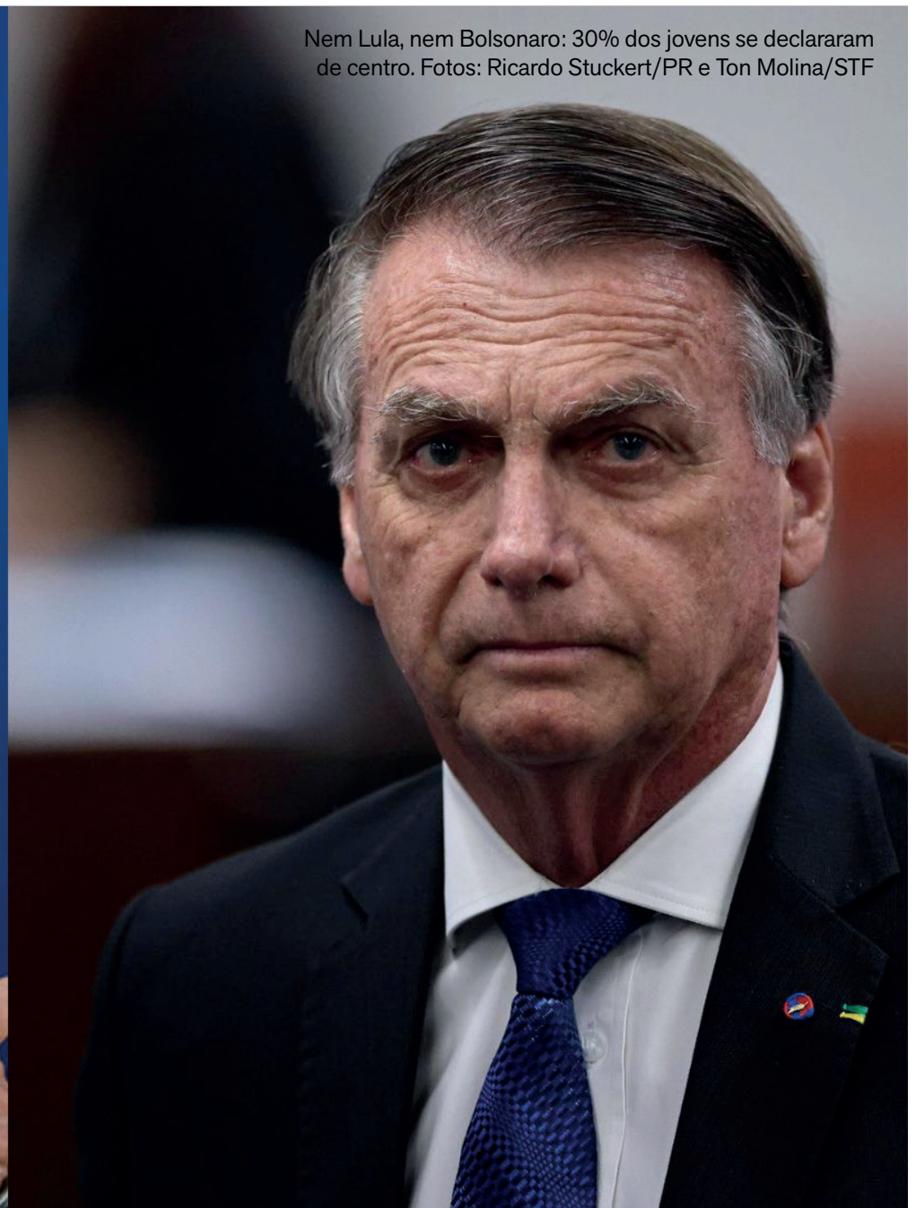
Nem Lula, nem Bolsonaro: 30% dos jovens se declararam de centro.

A pesquisa do Instituto Datafolha, divulgada na quarta-feira (24), indica que 35% dos brasileiros se consideram de direita, enquanto 22% apoiam a esquerda. Outros 17% se posicionam ao centro, 11% à centro-direita e 7% à centro-esquerda. Já 8% não souberam se identificar em nenhum posicionamento político.