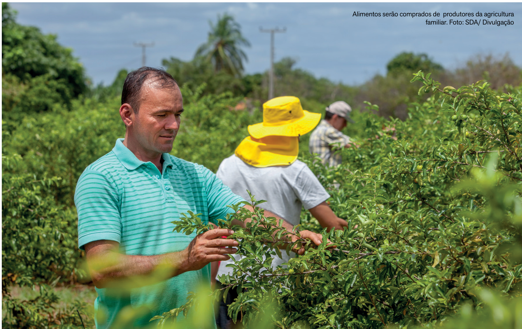
Alimentos serão comprados de produtores da agricultura familiar.

Recursos do Programa de Aquisição de Alimentos vão beneficiar famílias em situação de insegurança alimentar e fortalecer a agricultura familiar no Estado