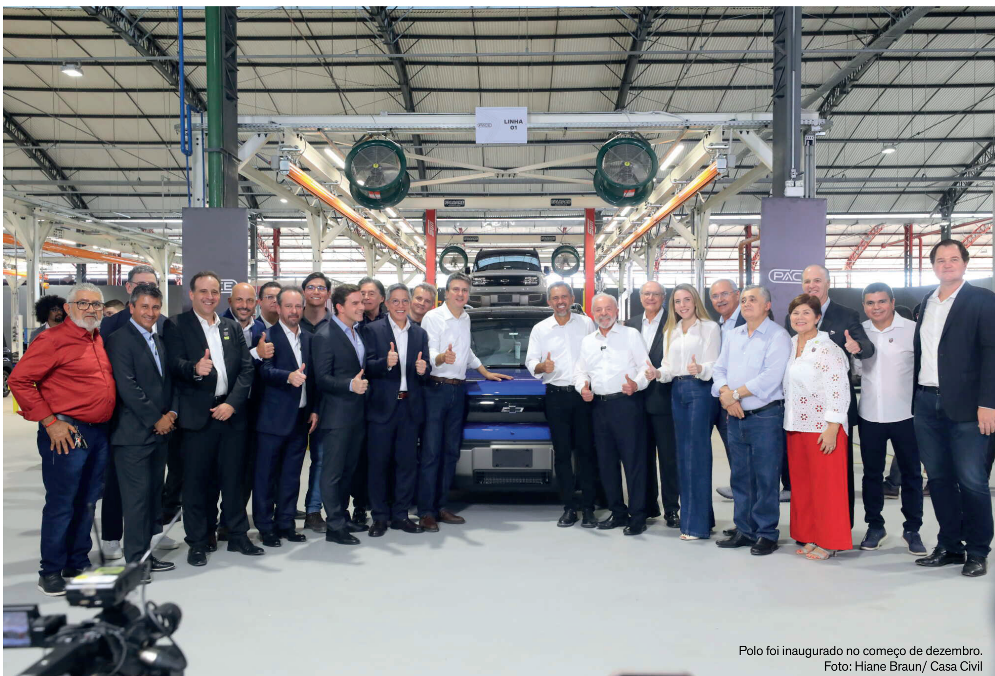
Polo foi inaugurado no começo de dezembro.

Chevrolet Spark EUV começa a ser fabricado no início de 2026 em Horizonte, enquanto o Captiva EV tem produção prevista para março ou abril