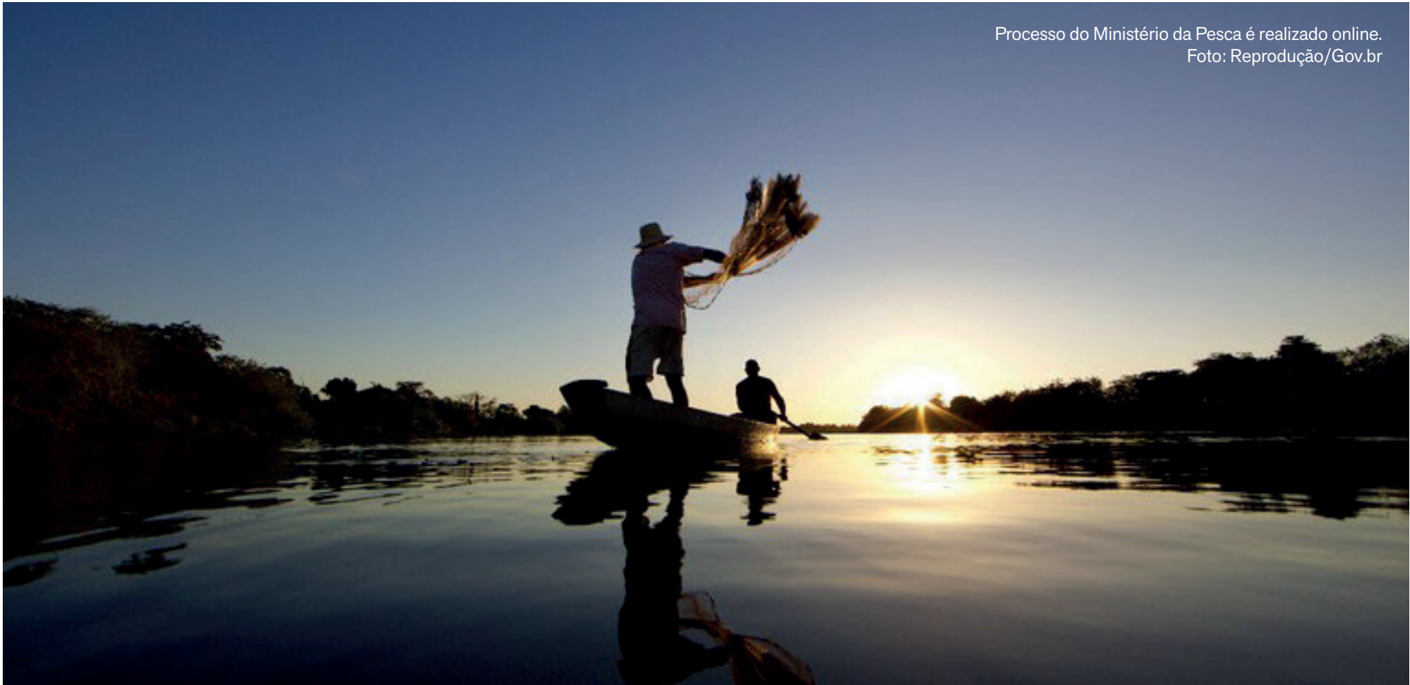
Processo do Ministério da Pesca é realizado online.

Processo é necessário para ter acesso ao seguro-defeso; medida de controle foi adotada em outubro, após constatação de possíveis irregularidades