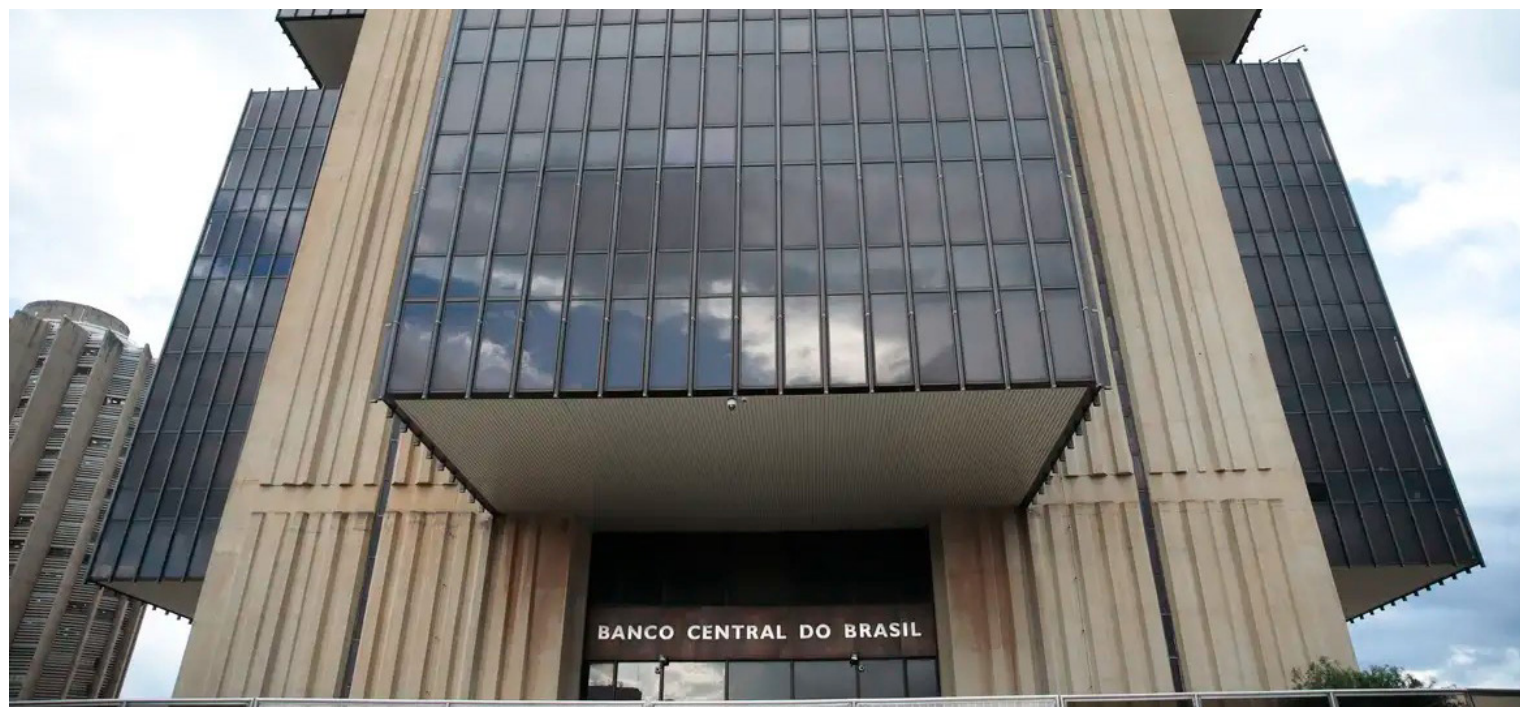
BC pediu que Toffoli explicasse acareação do Banco Master.

Assinam a nota a Associação Brasileira de Bancos (ABBC), a Associação Nacional das Instituições de Crédito (Acrefi), a Federação Brasileira de Bancos (Febraban) e a Zetta, entidade que representa empresas do setor financeiro e de meios de pagamento. Juntas, as associações representam mais de 100 instituições, cerca de