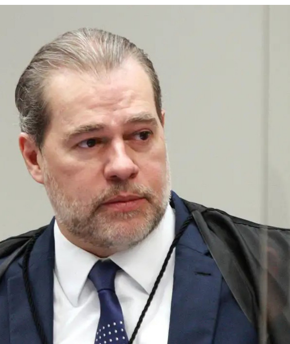
Toffoli quer ouvir diretor de fiscalização do BC.

De acordo com as investigações, as fraudes podem chegar a R$ 17 bilhões. (Agência Brasil)