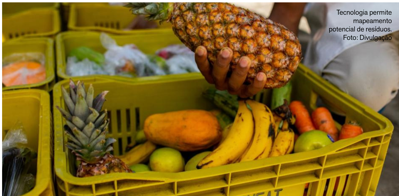
Tecnologia permite mapeamento potencial de resíduos.

No Ceará, a startup trabalha com redes como o G Barbosa (Cencosud) e o Sam's Club (Carrefour), contribuindo para a estruturação da gestão de resíduos alimentares no Estado. Ao todo, foram recuperados 151.910 quilos de alimentos, fortalecendo também o Índice de Desperdício Evitável (IDE), métrica desenvolvida pela empresa para medir a eficiência de reaproveitamento das lojas. Os resultados sinalizam o potencial do varejo cearense para reduzir custos, ao mesmo tempo em que amplia o impacto social e a sustentabilidade ambiental.