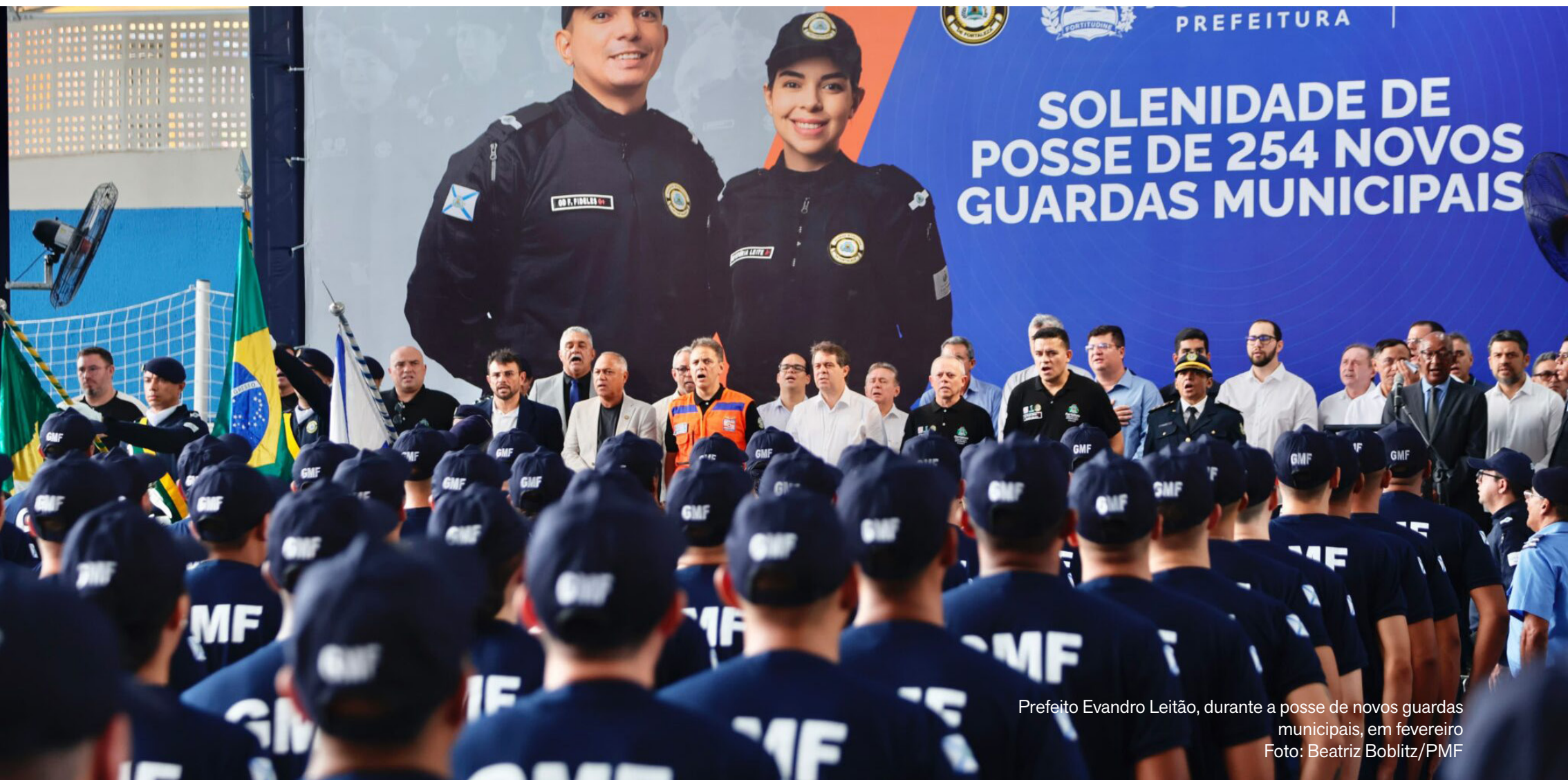
Prefeito Evandro Leitão, durante a posse de novos guardas municipais, em fevereiro

Promoções integram plano de investimentos na GMF, que inclui o Pacto pela Segurança Cidadã, pelotões nas regionais e novos equipamentos