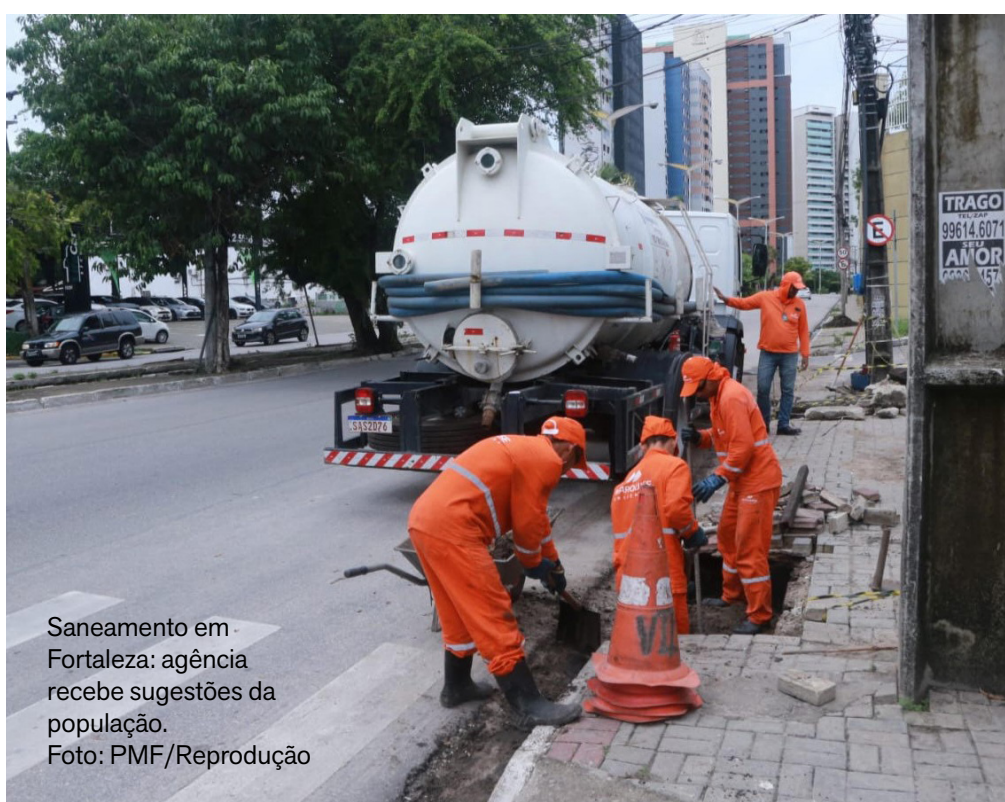
Saneamento em Fortaleza: agência recebe sugestões da população.

A Agência de Regulação, Fiscalização e Controle dos Serviços Públicos de Saneamento Ambiental de Fortaleza (ACFor) abriu, no dia 23 de dezembro de 2025, uma consulta pública para ouvir a população sobre a Agenda Regulatória da Agência para os anos de 2026 e 2027.