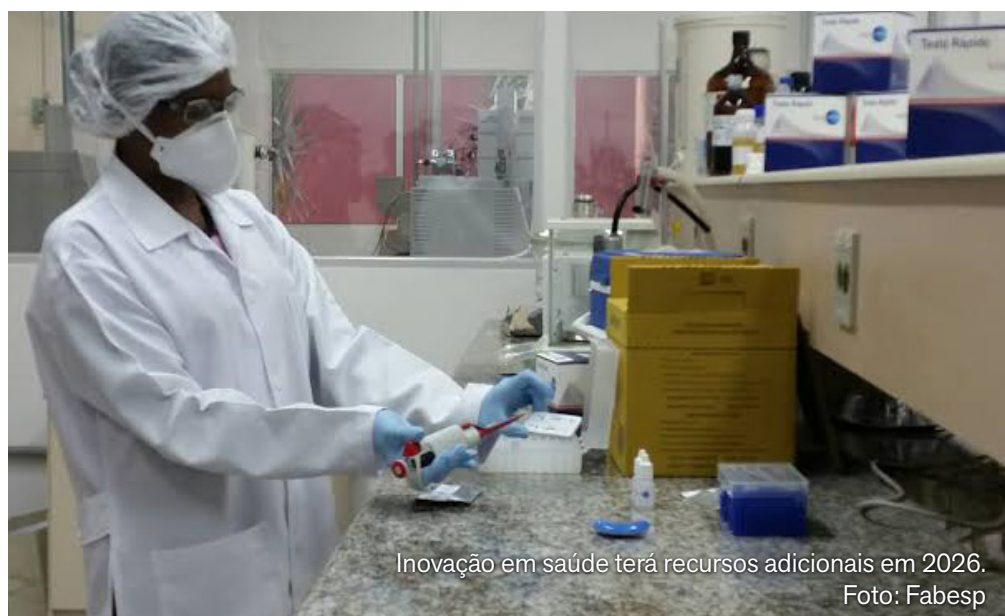
Inovação em saúde terá recursos adicionais em 2026.

O presidente Luiz Inácio Lula da Silva sancionou, na última terça-feira (23), a lei que autoriza a abertura de crédito suplementar de R$ 14,4 bilhões para operações oficiais de crédito e para diversos órgãos do Poder Executivo federal. Com foco no financiamento de projetos de inovação e no desenvolvimento tecnológico de empresas, a maior parte do valor — R$ 14,1 bilhões — será destinada ao Fundo Nacional de Desenvolvimento Científico e Tecnológico (FNDTC). Outras áreas também serão beneficiadas, como saúde, segurança pública e obras de infraestrutura viária. Os recursos que viabilizaram a abertura do crédito têm origem, principalmente, na incorporação do superávit finan-