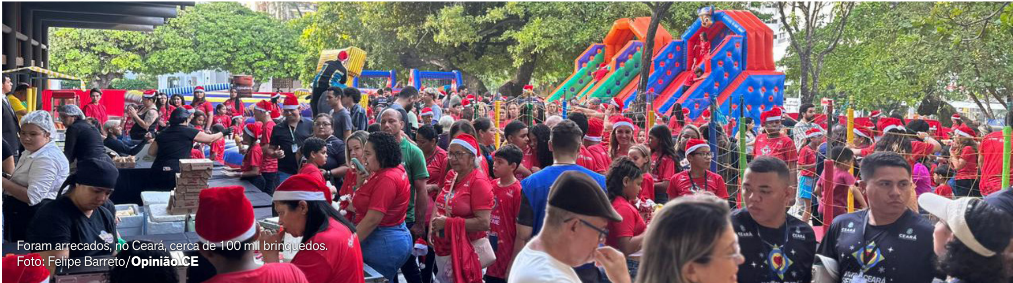
Foram arrecadados, no Ceará, cerca de 100 mil brinquedos.

Evento marca o terceiro ano da ação solidária do Governo do Estado e beneficia cerca de 500 crianças em situação de vulnerabilidade social