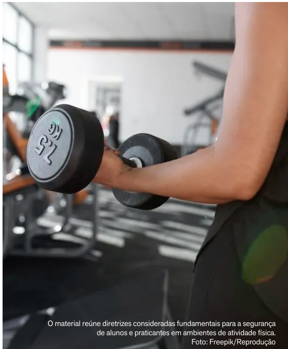
O material reúne diretrizes consideradas fundamentais para a segurança de alunos e praticantes em ambientes de atividade física.

Segundo o conselho, a avaliação pré-participação é um dos pontos centrais do documento. A orientação é que academias realizem uma análise criteriosa do histórico de saúde dos alunos, com estratificação de risco, identificando possíveis condições cardiovasculares ou outros fatores que possam aumentar a probabilidade de eventos graves durante o exercício.