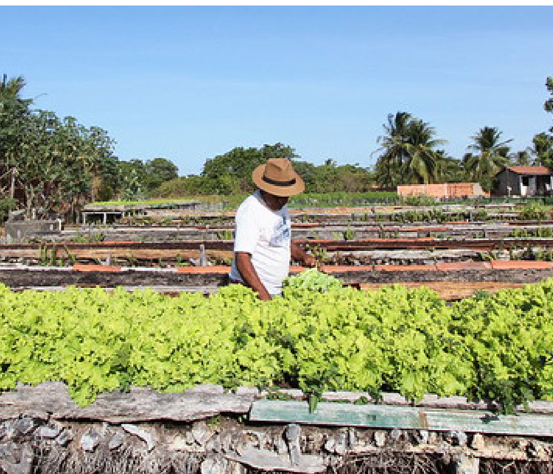
O agronegócio foi um dos principais setores para alavancar os resultados no período.

Conforme Amílcar Silveira, o desempenho do agronegócio brasileiro cria um ambiente favorável para a expansão no Ceará