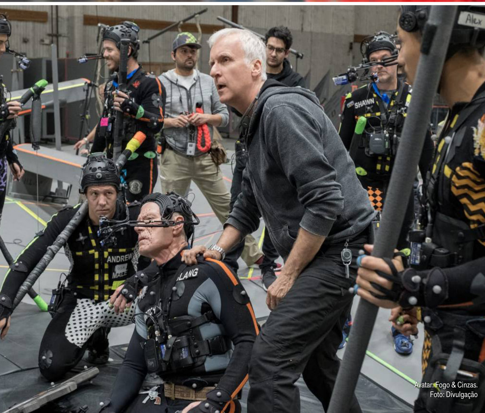
Avatar: Fogo & Cinzas.

No lançamento do terceiro “Avatar”, James Cameron conversou com votantes do Globo de Ouro em conferência virtual e defendeu sua obra, que já está em cartaz nos cinemas de todo o mundo