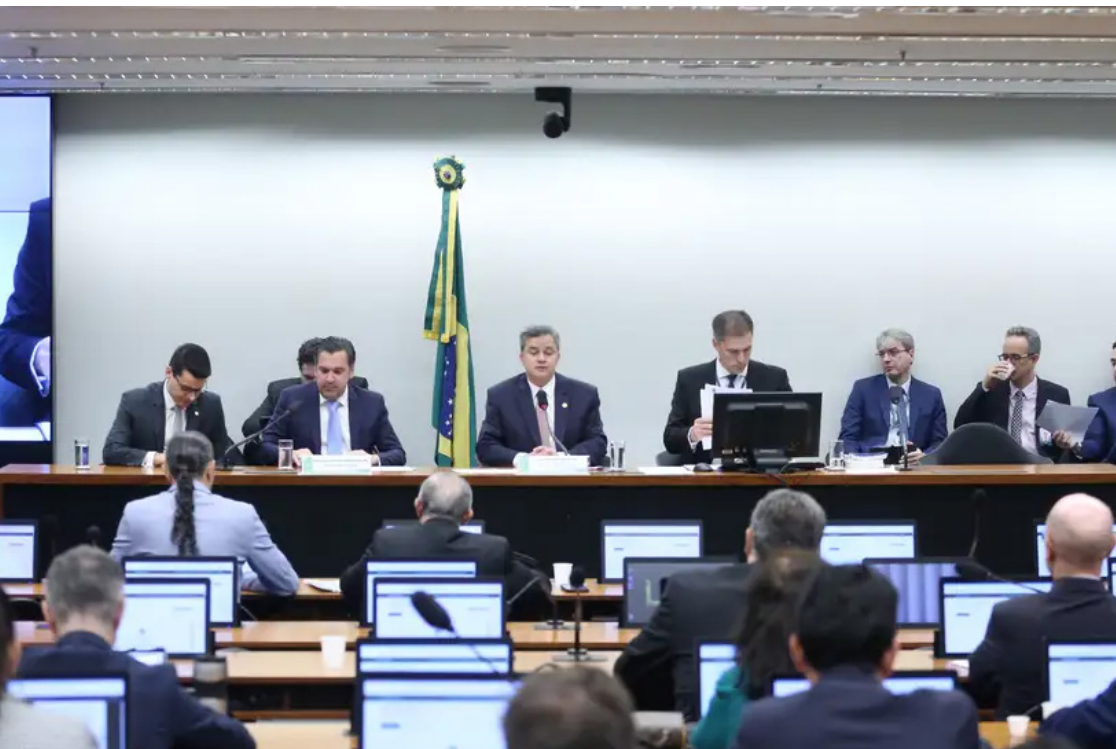
O texto aprovado também estabelece um piso mínimo de R$ 83 bilhões para investimentos públicos.

O Orçamento aprovado prevê, portanto, recursos destinados a estimular investimentos, manter políticas públicas e equilibrar as contas do governo, enquanto garante aos parlamentares espaço para definir aplicações específicas por meio das emendas. A proposta segue agora para sanção do presidente Luiz Inácio Lula da Silva (PT).