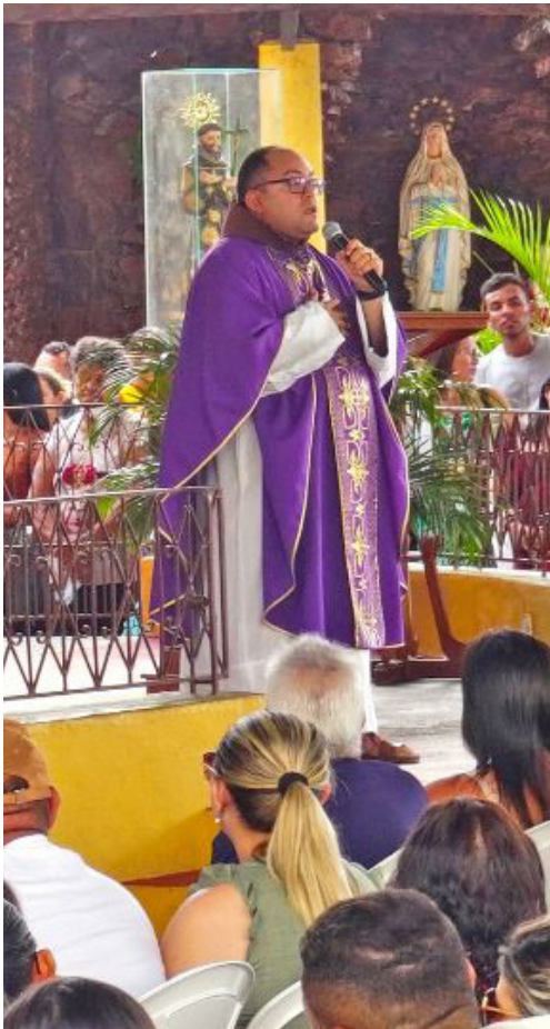
Entre os principais destaques está a Romaria do Natal, realizada entre os dias 21 e 23 de dezembro.

- 11h – Igreja Matriz de Nossa Senhora das Dores