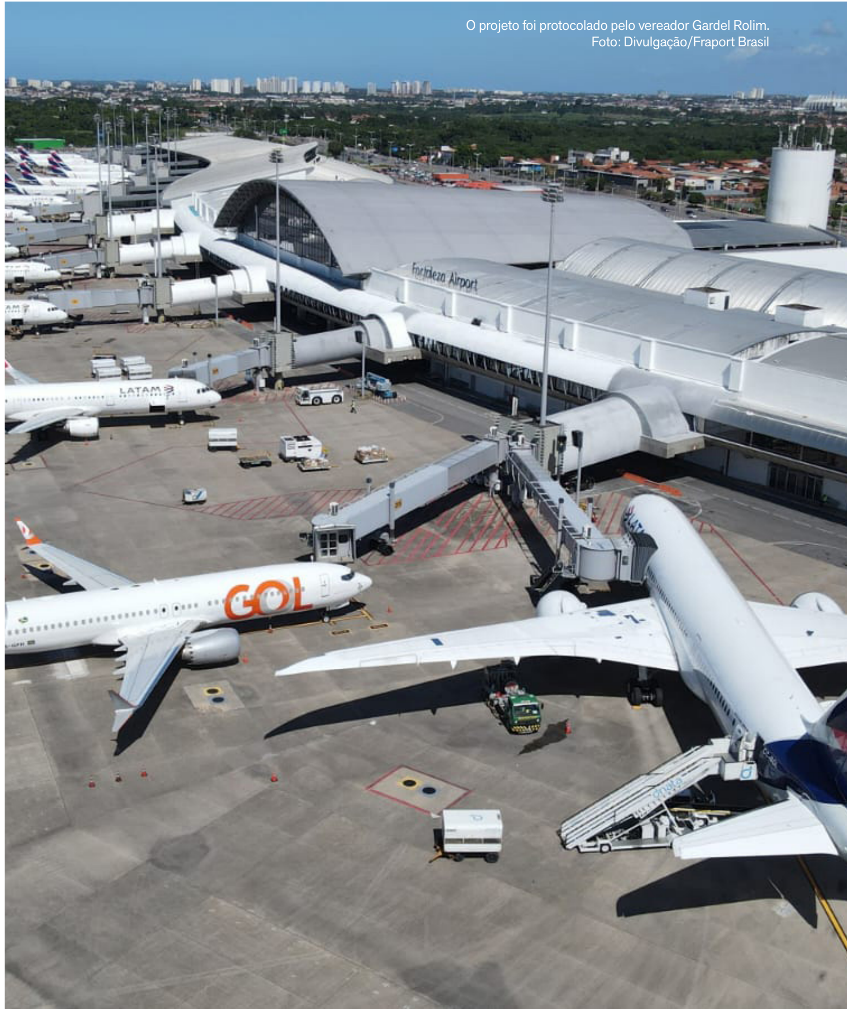
O projeto foi protocolado pelo vereador Gardel Rolim.

Tributadas sem nenhum benefício fiscal – ou seja, pagamento do tributo integralmente – estão os imóveis