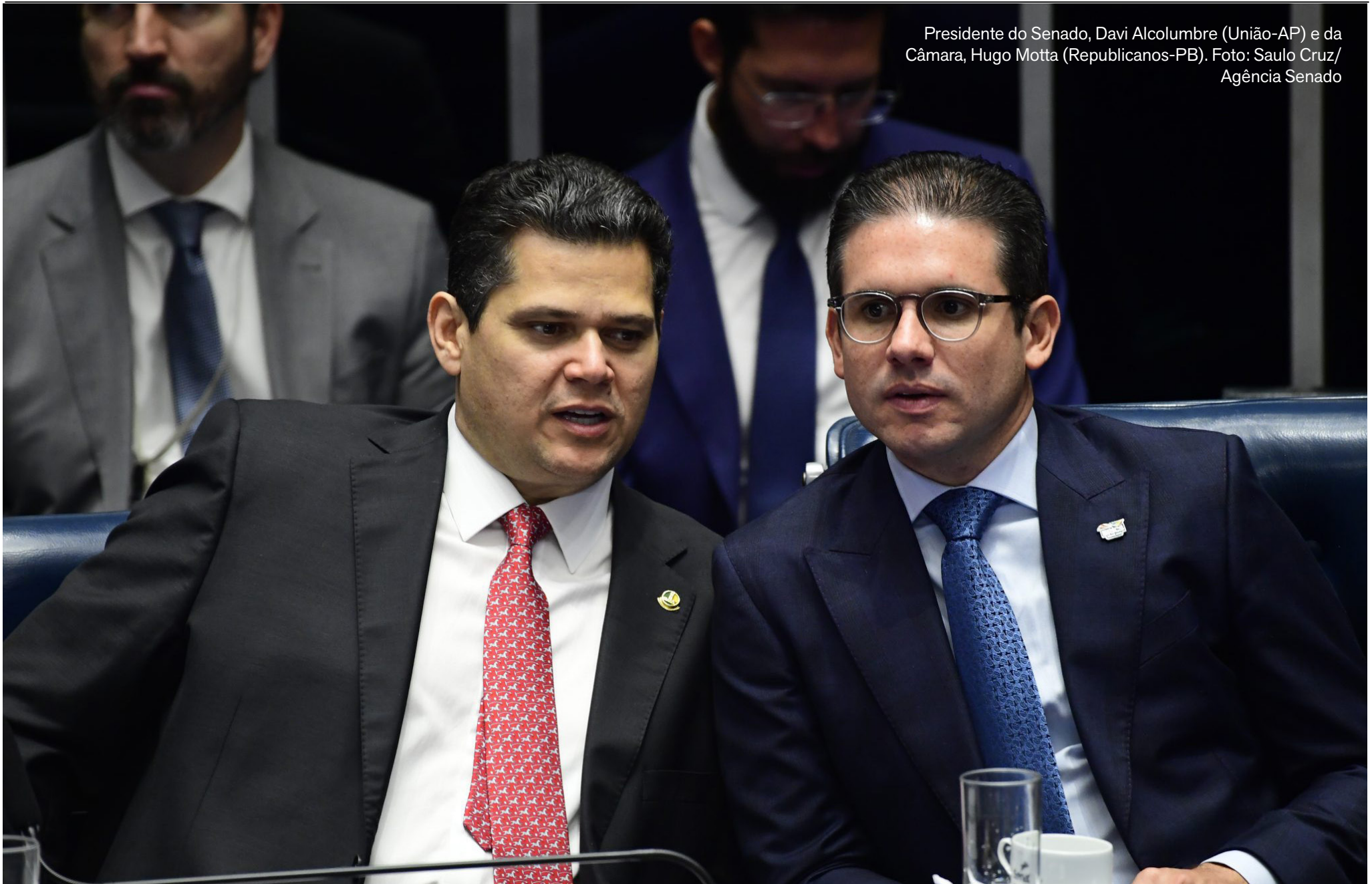
Presidente do Senado, Davi Alcolumbre (União-AP) e da Câmara, Hugo Motta (Republicanos-PB).