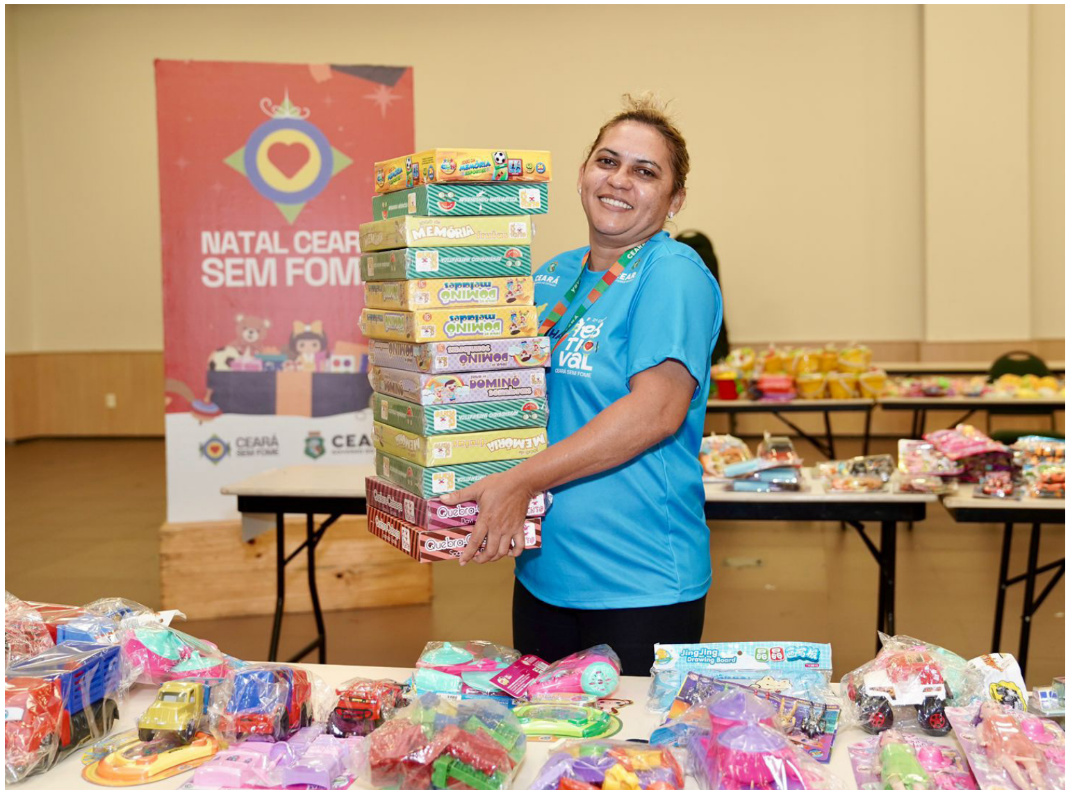
Não serão aceitos brinquedos usados, quebrados ou que façam apologia à violência.

A entrega dos presentes ocorrerá no dia 22 de dezembro, durante a Ceia Natalina das Cozinhas Ceará Sem Fome, realizada simultaneamente em mais de 1.300 cozinhas espalhadas pelos 184 municípios cearenses.