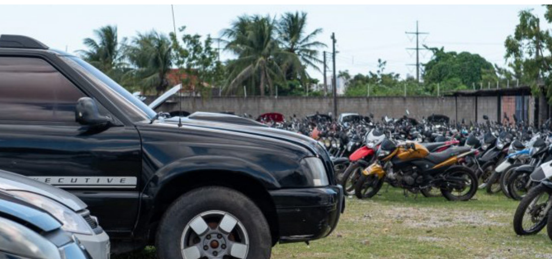
O Detran informa que o arrematante receberá o veículo adquirido sem qualquer débito anterior ao leilão.

O Departamento Estadual de Trânsito (Detran) fará um leilão virtual de 10 a 16 deste mês, em Fortaleza. A iniciativa reunirá 2.916 itens, entre sucatas, automóveis e motocicletas, com ofertas iniciais a partir de 50 reais.