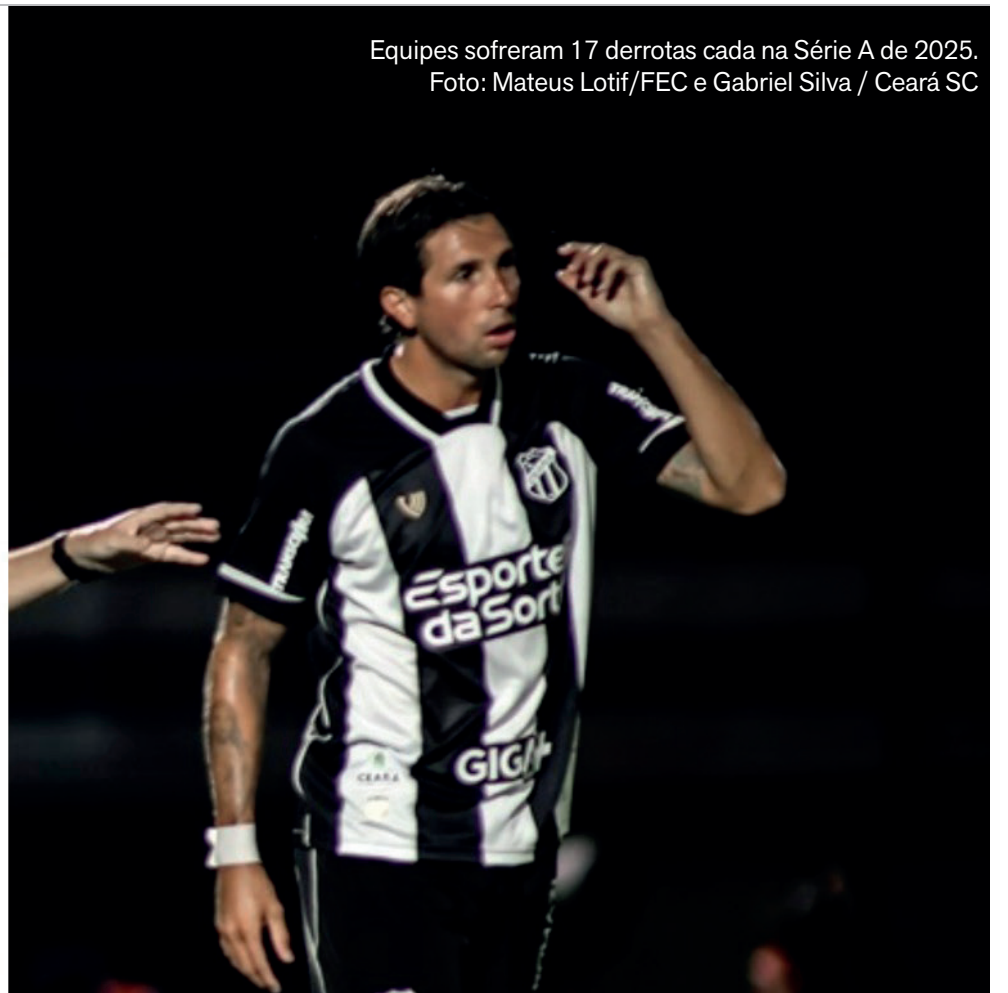
Equipes sofreram 17 derrotas cada na Série A de 2025.

Ceará e Fortaleza estão rebaixados para a Série B do Campeonato Brasileiro de 2026. Na tarde deste domingo, 7 de dezembro de 2025, os dois representantes cearenses foram derrotados na 38ª e última rodada da Série A. O Fortaleza perdeu por 4 a 2 para o Botafogo, no estádio Nilton Santos, no Rio de Janeiro. Já o Ceará foi superado por 3 a 1 pelo Palmeiras, no Castelão, em Fortaleza. Ambos terminaram com 43 pontos, ocupando a 18ª e a 17ª posições, respectivamente.