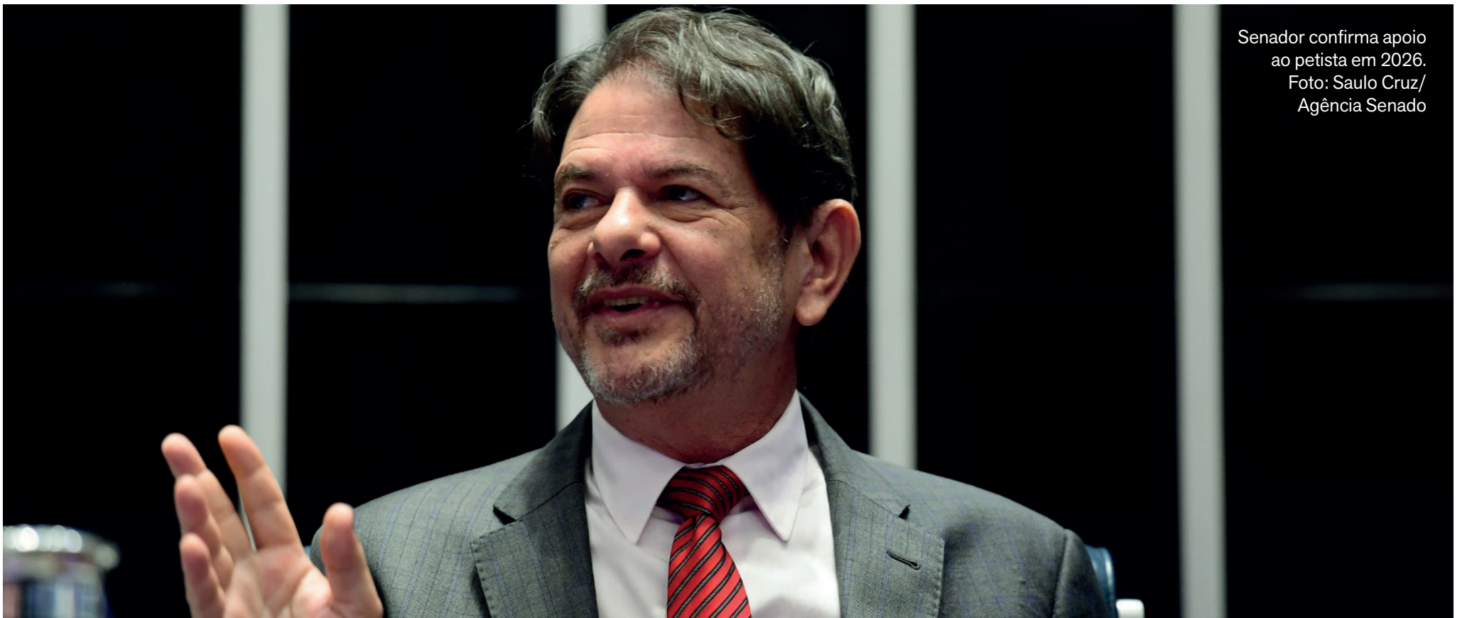
Senador confirma apoio ao petista em 2026.

Senador ressaltou que possui um “compromisso pessoal” com o governador para as próximas eleições; Ciro, irmão de Cid, pode ser o candidato da direita