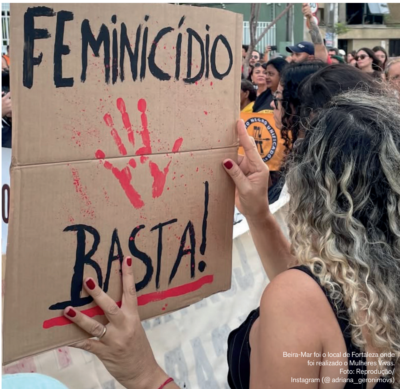
Beira-Mar foi o local de Fortaleza onde foi realizado o Mulheres Vivas.

O Brasil já contabiliza, em 2025, mais de 1.180 casos de feminicídios; em Fortaleza, o protesto aconteceu na Av. Beira-Mar