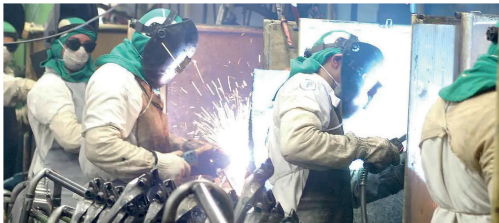
Crescimento do PIB Industrial, em um ano, recuou de 3% para 1,8%.