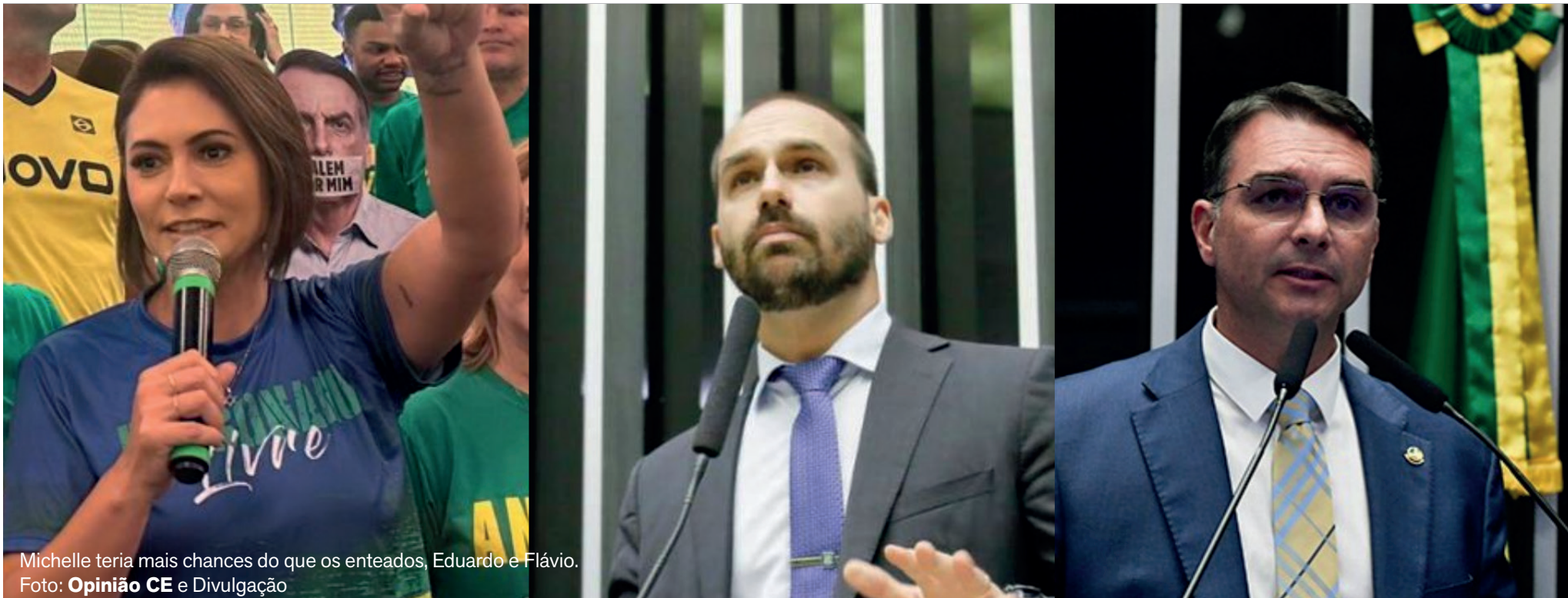
Michelle teria mais chances do que os enteados, Eduardo e Flávio.

Pesquisa divulgada neste sábado (6) traz filhos e esposa do ex-presidente Jair Bolsonaro pontuando menos do que Ratinho Jr. e Tarcísio de Freitas