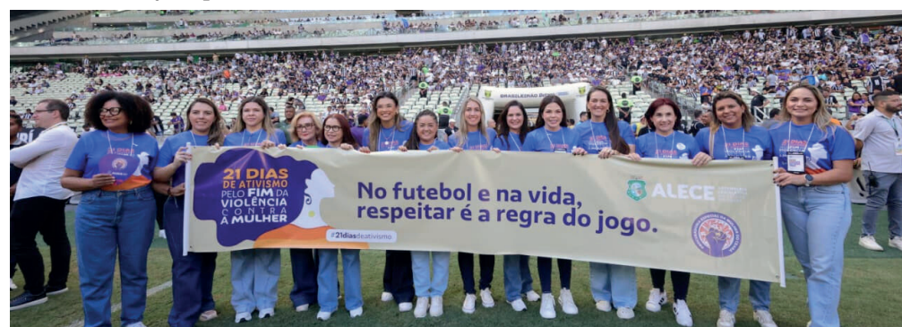
Campanha ocupou o gramado da Arena Castelão.

grande presença masculina. “São eles os principais sujeitos a serem impactados com essa transformação cultural”, disse.