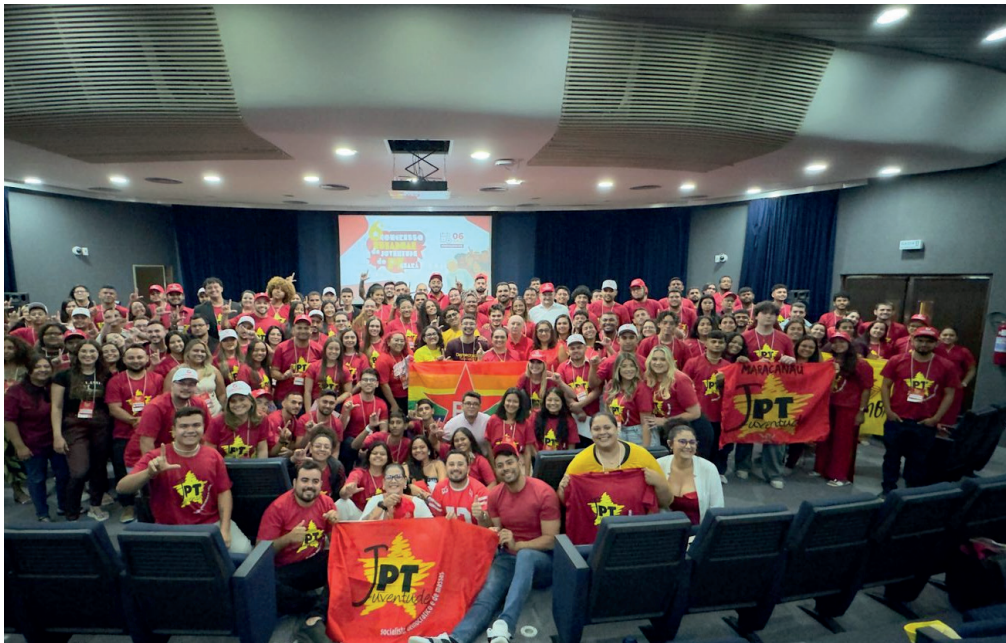
As três correntes jovens do partido firmaram apoio a José Guimarães.

A Juventude do PT Ceará garantiu apoio à pré-candidatura do deputado federal José Guimarães para o Senado. Jovens das três vertentes internas do partido – o Campo de Esquerda, liderado pela deputada federal Luizianne Lins; o Campo Popular, de Camilo Santana; e o Campo Democrático, de Guimarães – assinaram moção de apoio à sua candidatura.