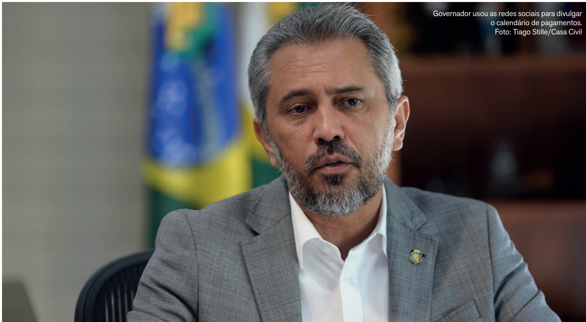
Governador usou as redes sociais para divulgar o calendário de pagamentos.

Segunda parcela do 13º cai na conta dos servidores no dia 20; antes da virada, no dia 31, o Governo do Ceará pagará o salário de dezembro