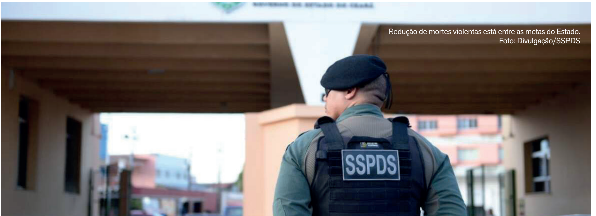
Redução de mortes violentas está entre as metas do Estado.

Em Fortaleza, a redução foi ainda maior: 8,5%; levantamento inclui homicídios, feminicídios, latrocínios e lesões corporais seguidas de morte