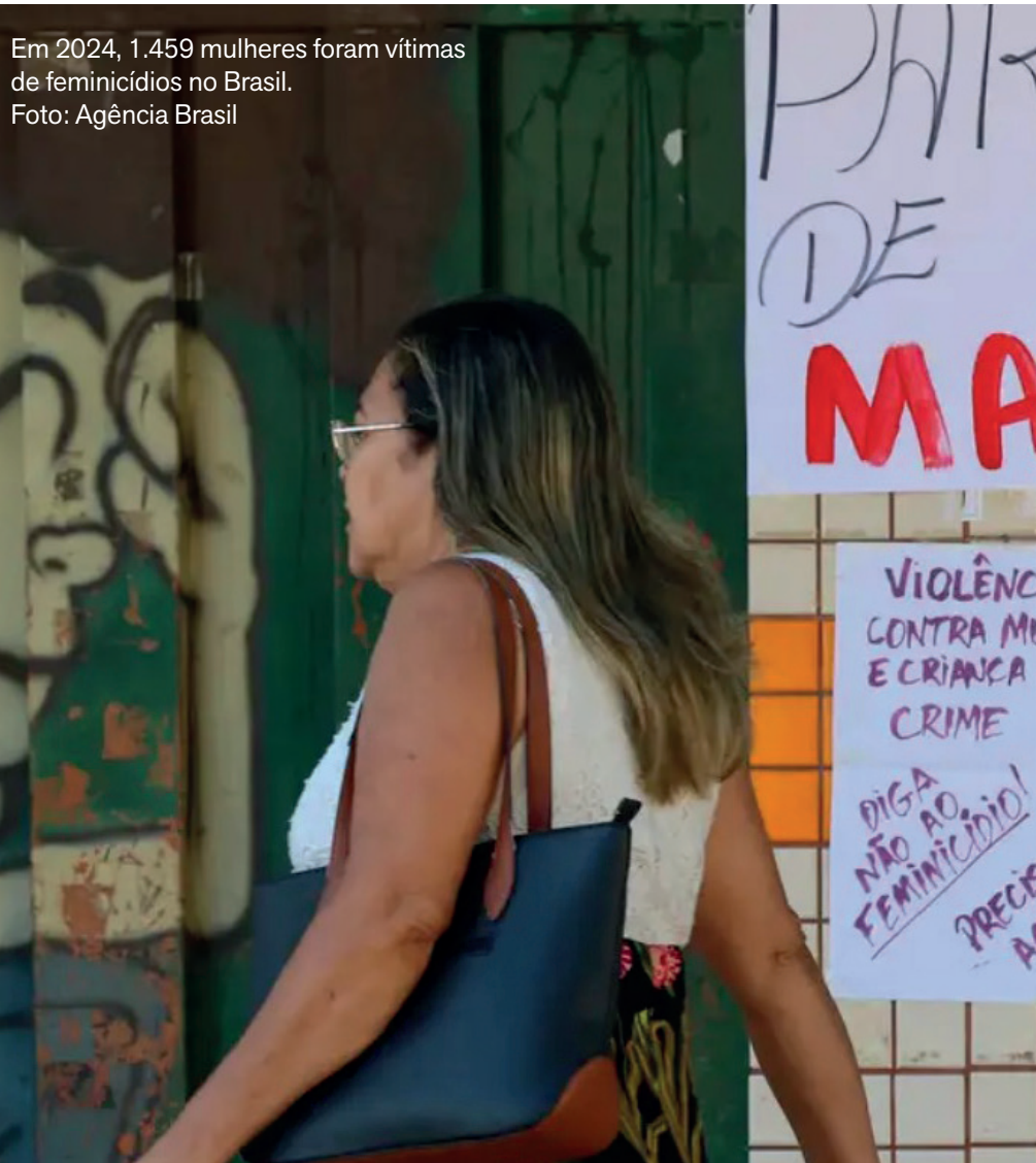
Em 2024, 1.459 mulheres foram vítimas de feminicídios no Brasil.

Outro caso que gerou revolta foi o assassinato de duas funcionárias do Centro Federal de Educação Tecnológica (Cefet), no Rio de Janeiro, baleadas por um servidor da instituição, que se matou em seguida.