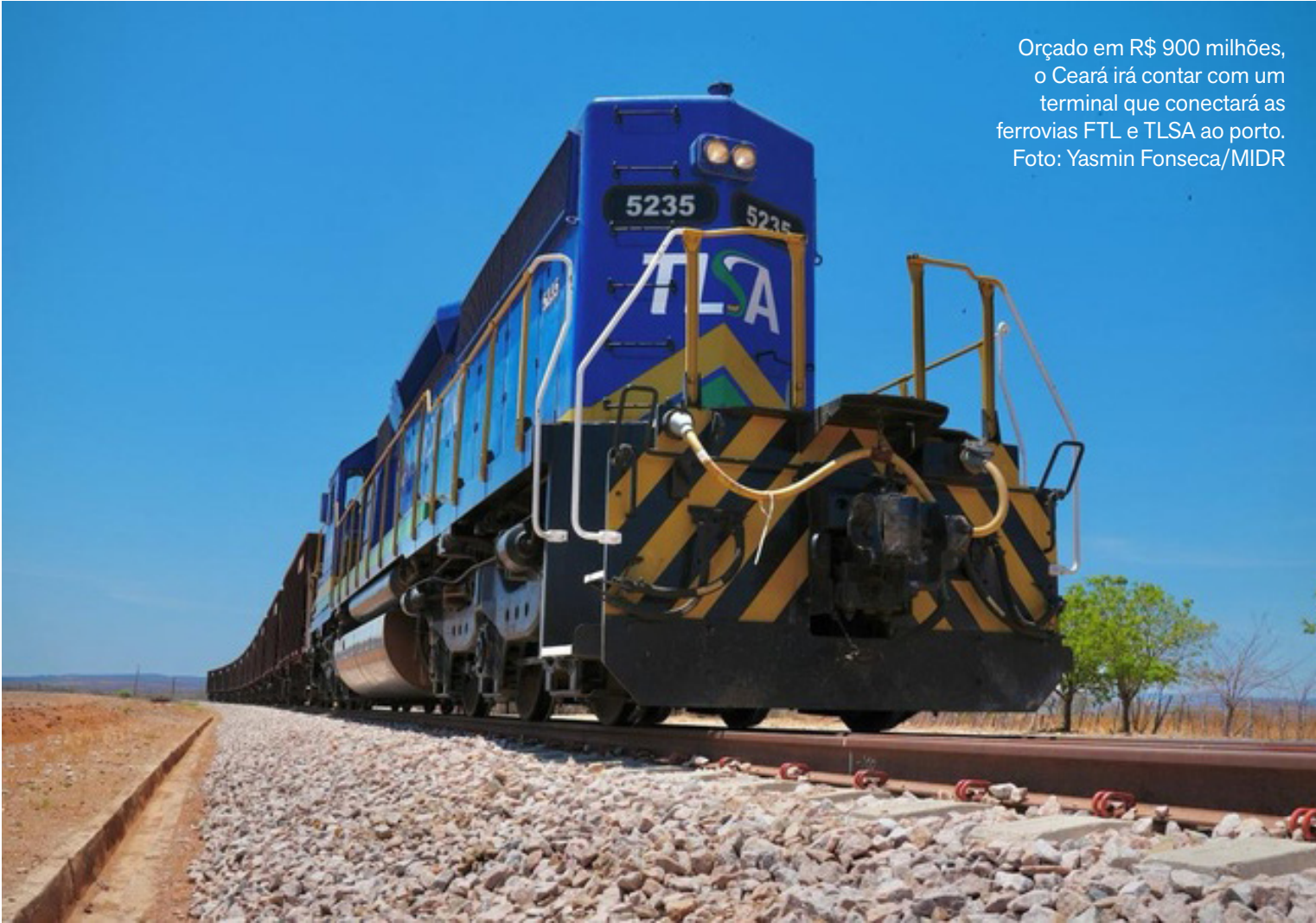
Orçado em R$ 900 milhões, o Ceará irá contar com um terminal que conectará as ferrovias FTL e TLSA ao porto.

Para acelerar o escoamento da produção nordestina, a TLSA estuda a