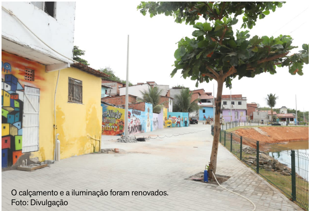
O calçamento e a iluminação foram renovados.

Além de outras obras de urbanização que levam mais qualidade de vida à população. Também houve o ordenamento de 50 moradias irregulares e a concessão de aluguel social para as famílias envolvidas, por meio da Defesa Civil.