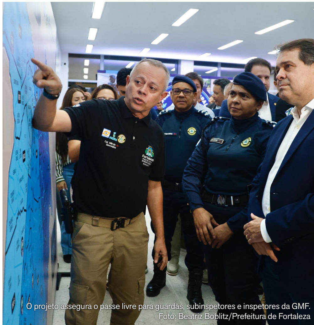
O projeto assegura o passe livre para guardas, subinspetores e inspetores da GMF.

Conforme a gestão municipal, as despesas decorrentes da medida correrão por conta das dotações orçamentárias da Secretaria Municipal da Conservação e Serviços Públicos (SCSP), com recursos do tesouro municipal.