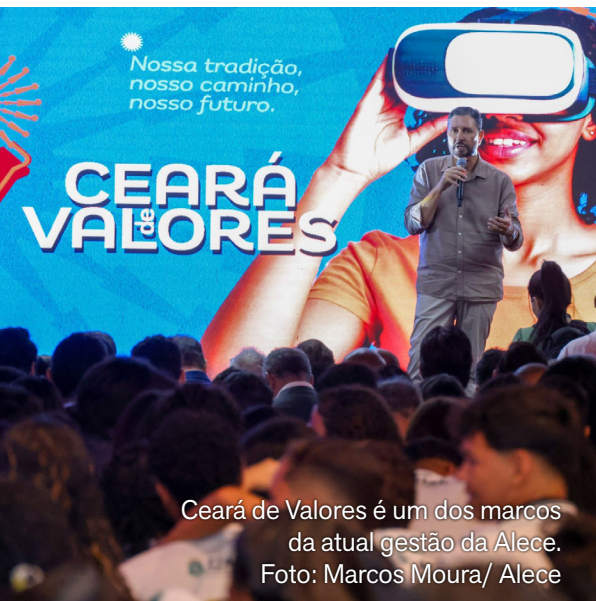
Ceará de Valores é um dos marcos da atual gestão da Alece.

A campanha será veiculada em rádio, televisão, internet, mídia exterior e imprensa, com apoio de influenciadores e comunicadores. A ação integra as comemorações pelos 190 anos da Assembleia Legislativa do Ceará e está inserida na estratégia da atual gestão de ampliar o alcance das atividades do Legislativo junto à sociedade.