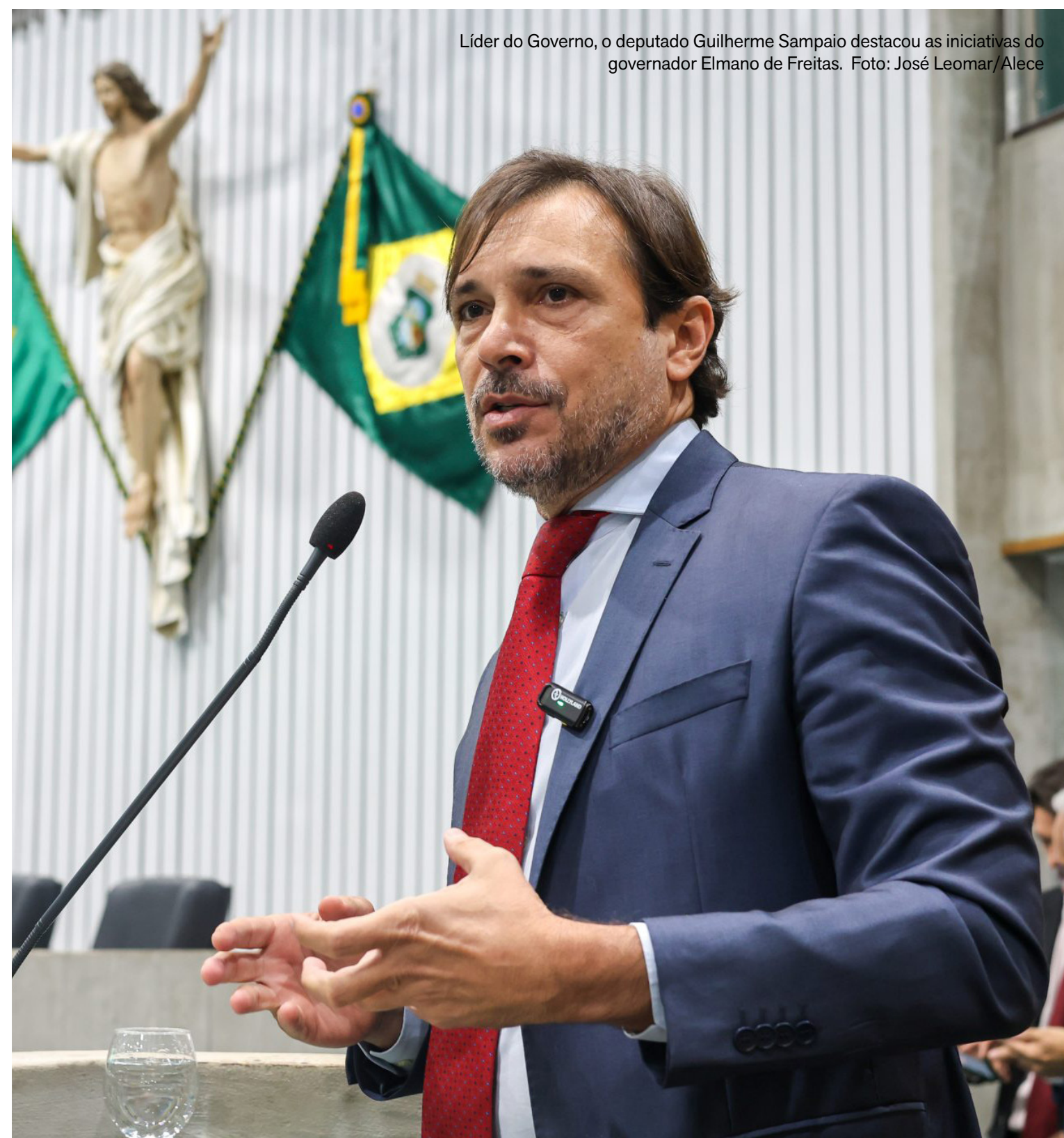
Líder do Governo, o deputado Guilherme Sampaio destacou as iniciativas do governador Elmano de Freitas.

Outra medida aprovada autoriza o Poder Executivo a contratar operação de crédito com o Banco Nacional de Desenvolvimento Econômico e Social (BNDES) de até R$ 2 bilhões, a serem destinados ao financiamento de despesas de capital e demais investimentos na área da educação, saúde e segurança pública. “Isso permitirá recursos para investimentos, como os hospitais regionais, as escolas em tempo integral, estradas, rodovias, infraestrutura