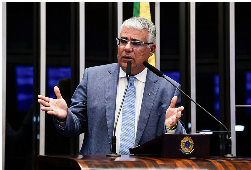
Senador Eduardo Girão (Novo-CE).

“Temos condições de romper com a velha prática politiqueira, as barganhas e os conchavos. Não dá mais para voltar atrás e apoiar quem já teve oportunidade e deixou o fisiologismo e o crime ‘dar as cartas’.