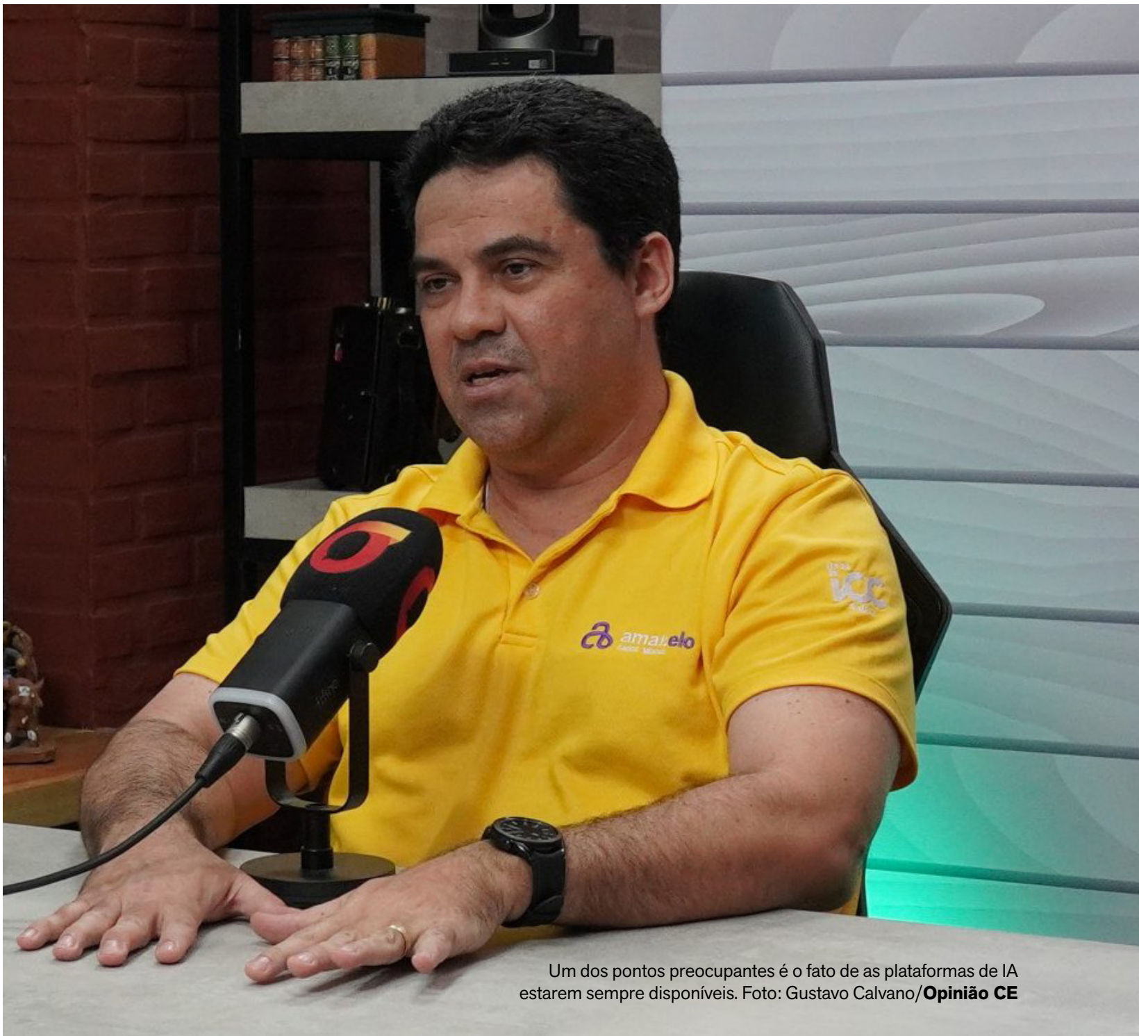
Um dos pontos preocupantes é o fato de as plataformas de IA estarem sempre disponíveis.

Conforme CEO da startup cearense Amar.elo, o uso de ferramentas como o ChatGPT para fins terapêuticos ainda carece de validação científica