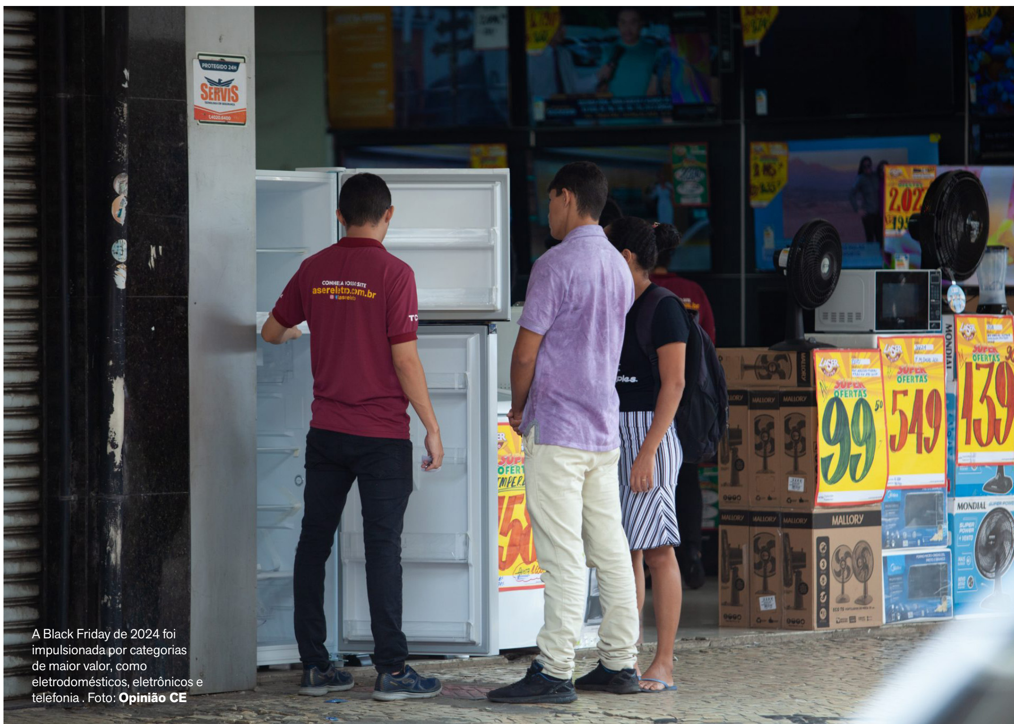
A Black Friday de 2024 foi impulsionada por categorias de maior valor, como eletrodomésticos, eletrônicos e telefonia.

Projeções reforçam avanço consistente do e-commerce no País. O avanço também aparece no volume de pedidos, com expectativa de cerca de 16 milhões de compras e crescimento próximo de 5%