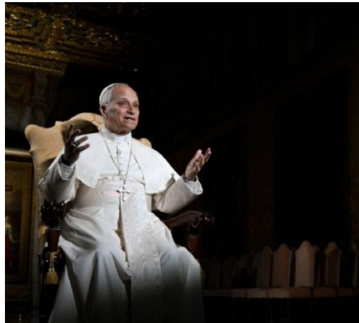
“A Igreja não tem partido político”, alertou o Papa durante uma conexão virtual com cerca de 15 mil jovens.