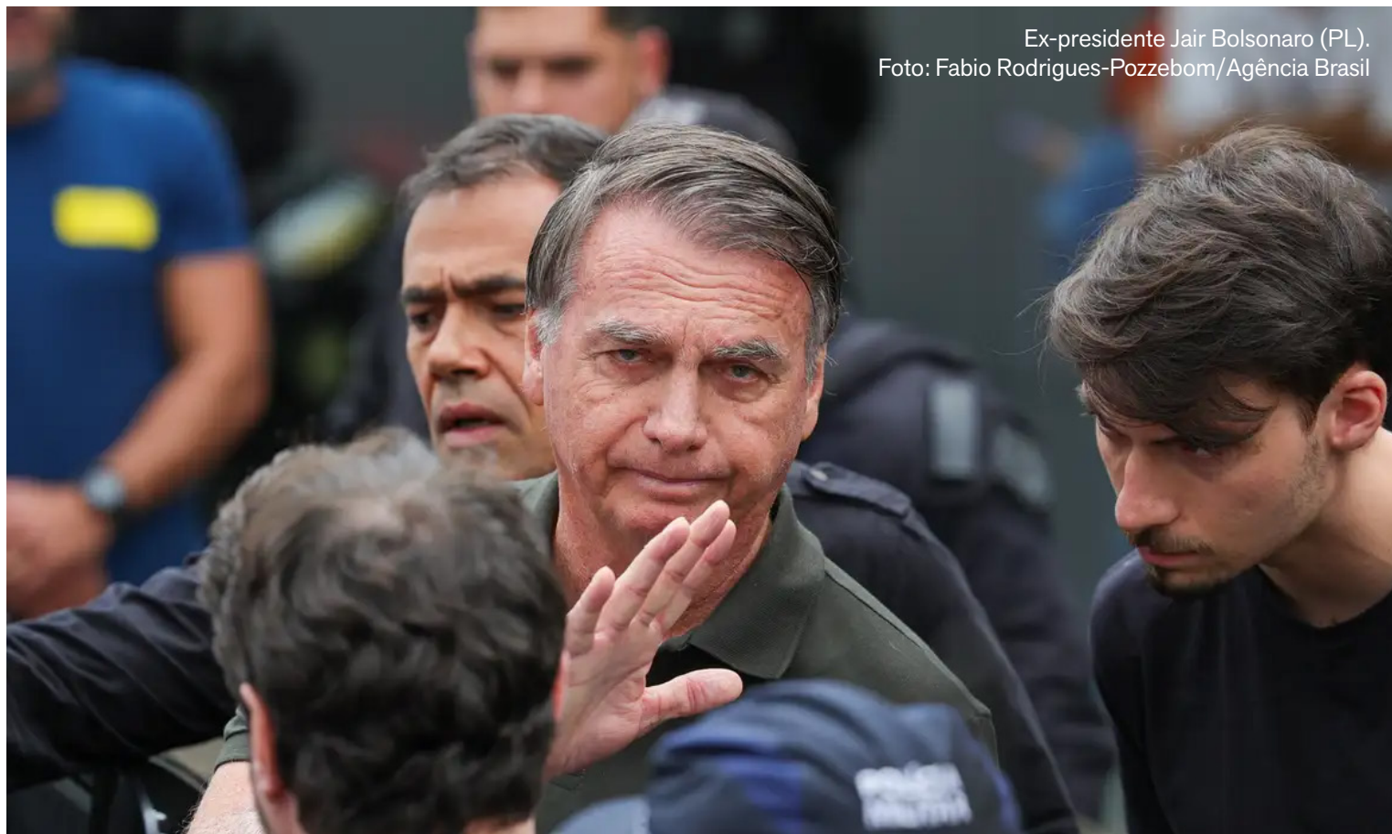
Ex-presidente Jair Bolsonaro (PL).

Bolsonaro já estava detido preventivamente, desde o último sábado (22), por risco iminente de fuga. O ex-presidente tentou violar a tornozeleira eletrônica com um ferro de solda. A decisão foi referendada por unanimidade pela Primeira Turma do STF.