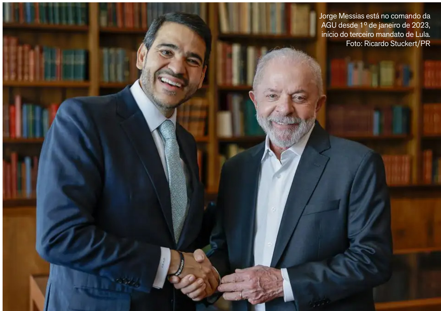
Jorge Messias está no comando da AGU desde 1º de janeiro de 2023, início do terceiro mandato de Lula.

O ex-presidente do Senado Rodrigo Pacheco (PSD/MG) era o favorito de Alcolumbre para a vaga deixada por Barroso no STF. O estopim do descontentamento teria sido uma reunião entre Lula e Pacheco, na última semana, em que o presidente da República tentou convencer o senador a aceitar a candidatura ao governo de Minas Gerais, viabilizando a indicação de Jorge Messias.