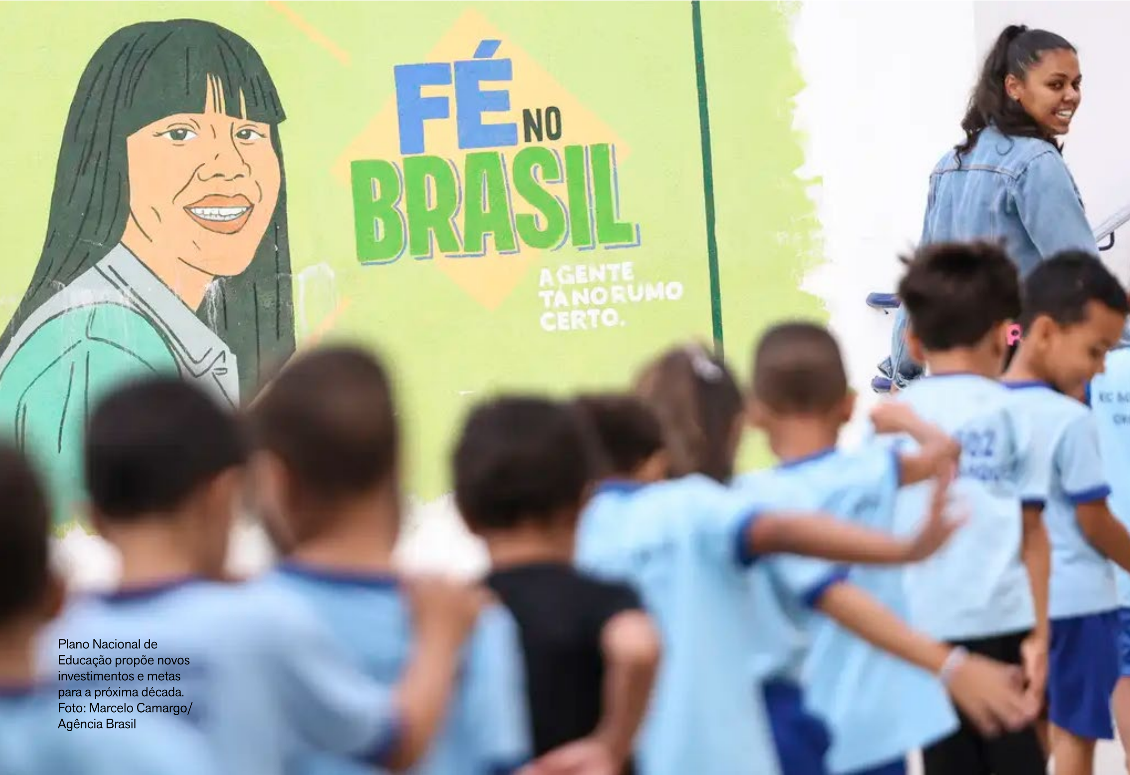
Plano Nacional de Educação propõe novos investimentos e metas para a próxima década.