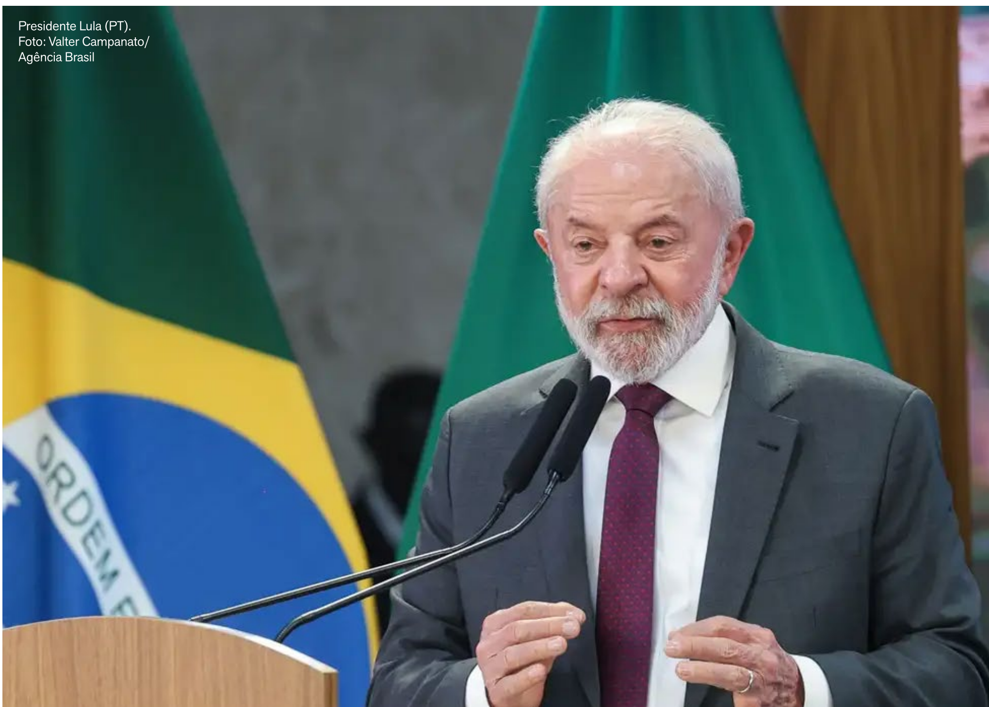
Presidente Lula (PT).

O encontro será o primeiro entre representantes dos dois países após a conversa por videoconferência entre Lula e Trump