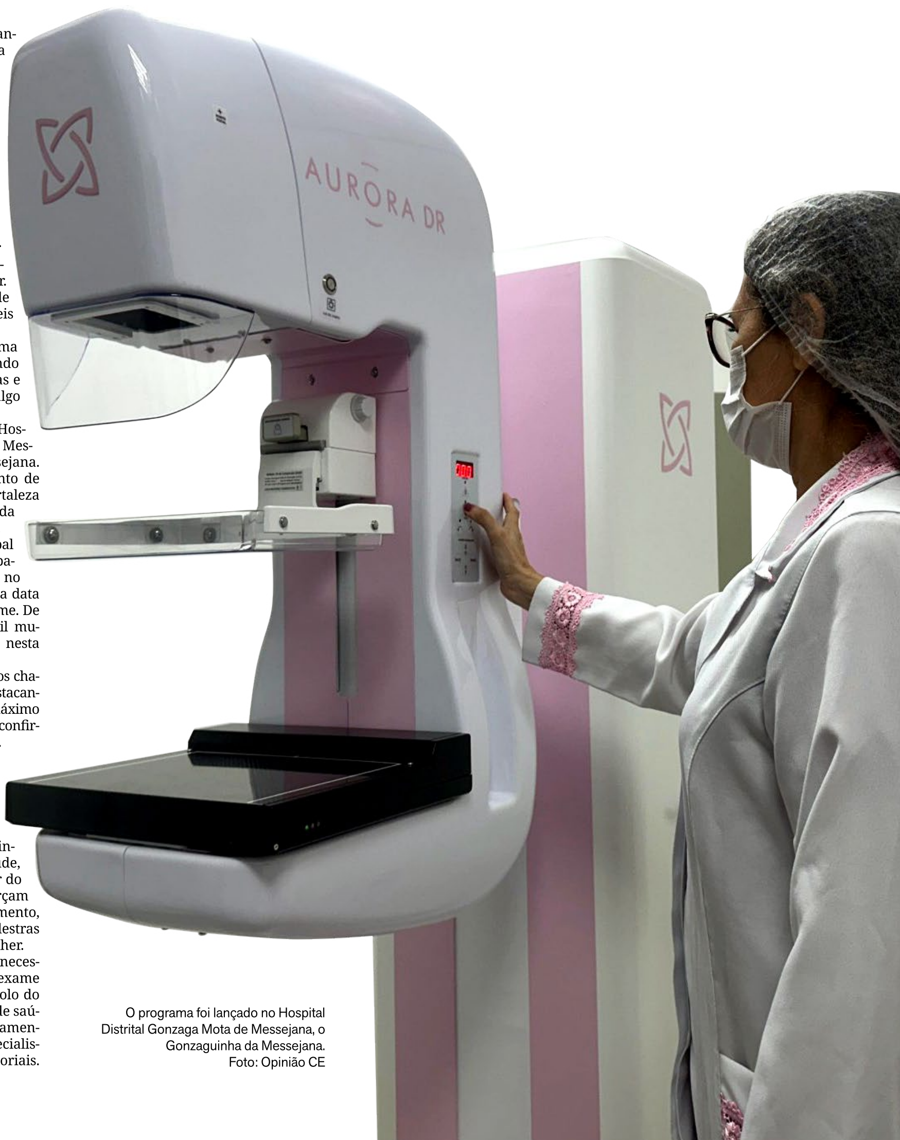
O programa foi lançado no Hospital Distrital Gonzaga Mota de Messejana, o Gonzaguinha da Messejana.

Em Fortaleza, pacientes que necessitem realizar mamografia ou exame de rastreamento do câncer do colo do útero devem se dirigir ao posto de saúde, para realizar seu acompanhamento e encaminhamento para especialistas, exames de imagem e laboratoriais.