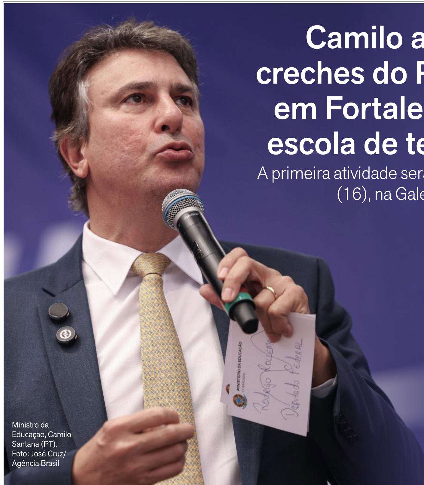
Ministro da Educação, Camilo Santana (PT).

A primeira atividade será às 15h desta quinta-feira (16), na Galeria do Palácio da Abolição