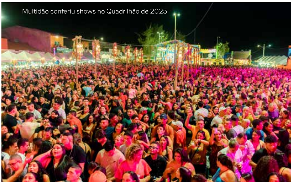
Multidão conferiu shows no Quadrilhão de 2025

A programação cultural da cidade também ganhou destaque com a Feira de Artesanato da Praia do Maceió, que reuniu, em média, 750 pessoas por edição ao longo do primeiro semestre de 2025. A iniciativa fortaleceu a valorização do artesanato local, promoveu a geração de renda e estimulou o intercâmbio cultural entre moradores e visitantes