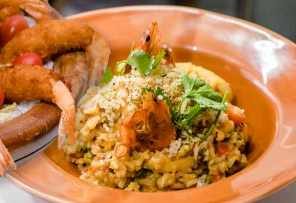
Vila do Maceió é palco de festival gastronômico

Além disso, os eventos também têm sido uma válvula muito forte para a economia camocinense. “Tivemos articulação com o Governo do Ceará e estamos fazendo parceria com o Sindieventos [Sindicato das Empresas Organizadoras de Eventos e Afins do Estado do Ceará] para captar e promover eventos”, afirmou a titular do Turismo.