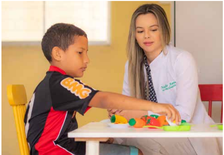
Política de inclusão educacional registrou 4 mil atendimentos

Inaugurado em 2022, o Centro Especializado de Atendimento e Desenvolvimento Inclusivo (CEADI) é um projeto do Plano Municipal de Educação que visa garantir atendimento multidisciplinar qualificado a estudantes da educação especial matriculados na rede municipal.