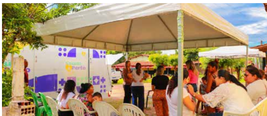
Política pública municipal leva atendimento para zona rural