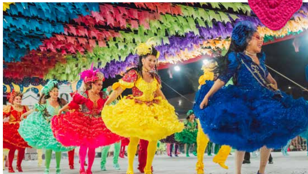
Tradição junina é valorizada no município

“Ninguém faz sem dar a mão. Nossa proposta foi organizar juridicamente para fazer esse trabalho e, em seguida, iremos unir com a Secretaria de Turismo e o Sebrae”, disse.