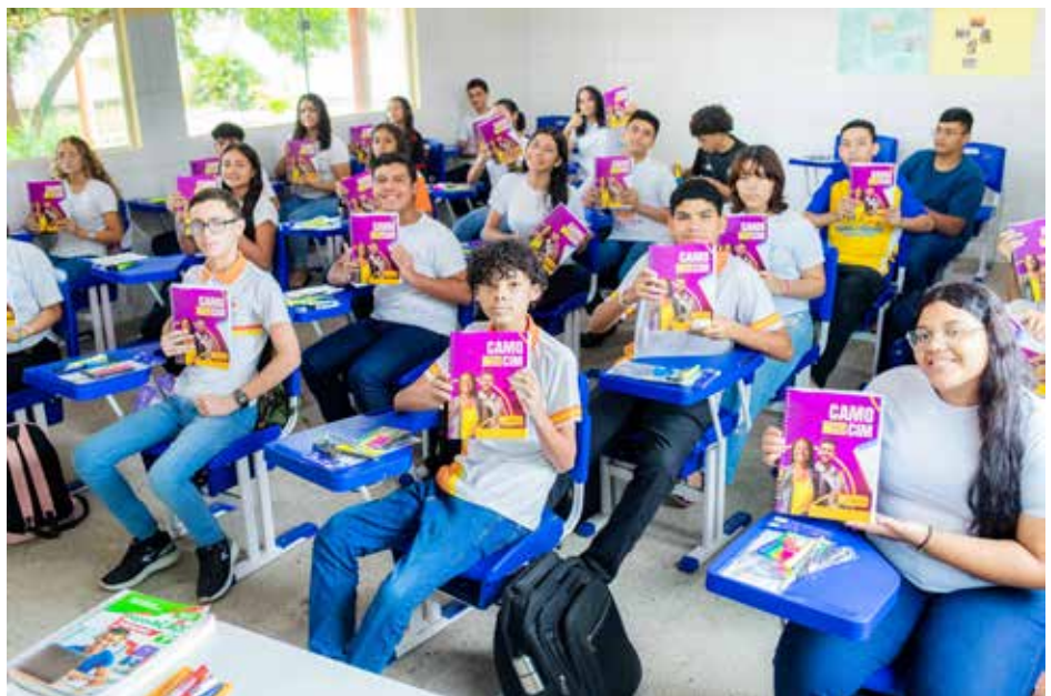
10 mil kits escolares foram entregues aos alunos da rede municipal