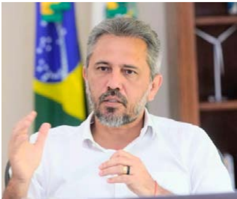
Governador Elmano de Freitas.

Elmano, na ocasião, também destacou o empenho da senadora Augusta Brito (PT) e do ministro da Educação, Camilo Santana (PT), para que o sonho de um campus da UVA na Serra da Ibiapaba se tornasse realidade.