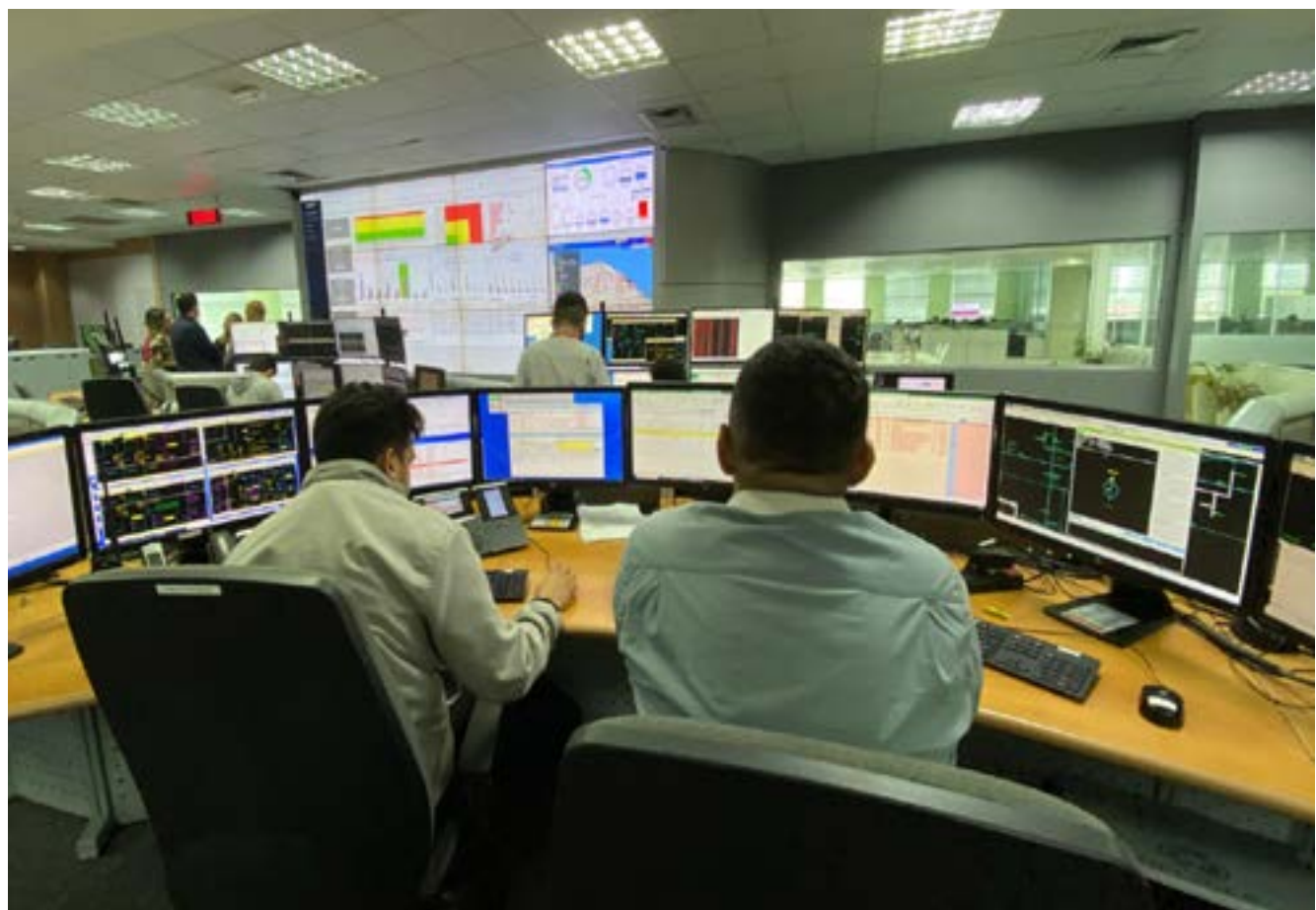
A distribuidora montou um comitê estratégico, em parceria com o TRE-CE, que permitirá o monitoramento e no gerenciamento das demandas durante a realização da votação.

Em parceria com a Climatempo, a Enel Distribuição Ceará também está acompanhando, por meio de boletins meteorológicos, as previsões