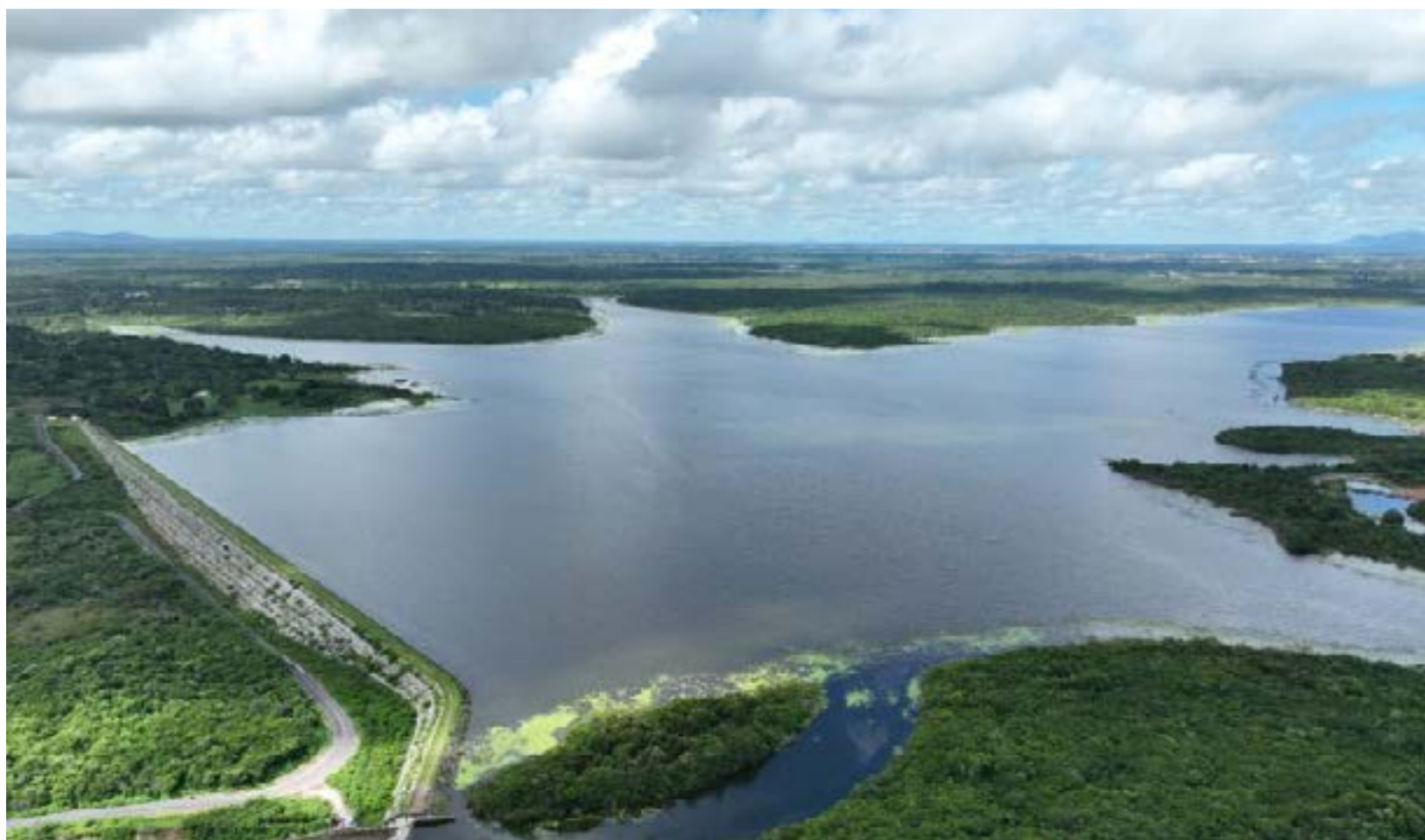
Fatores como altas temperaturas, baixa umidade relativa do ar e poucas precipitações, comuns em outubro, têm impacto direto no volume dos reservatórios.

“O acompanhamento dos níveis dos reservatórios pela