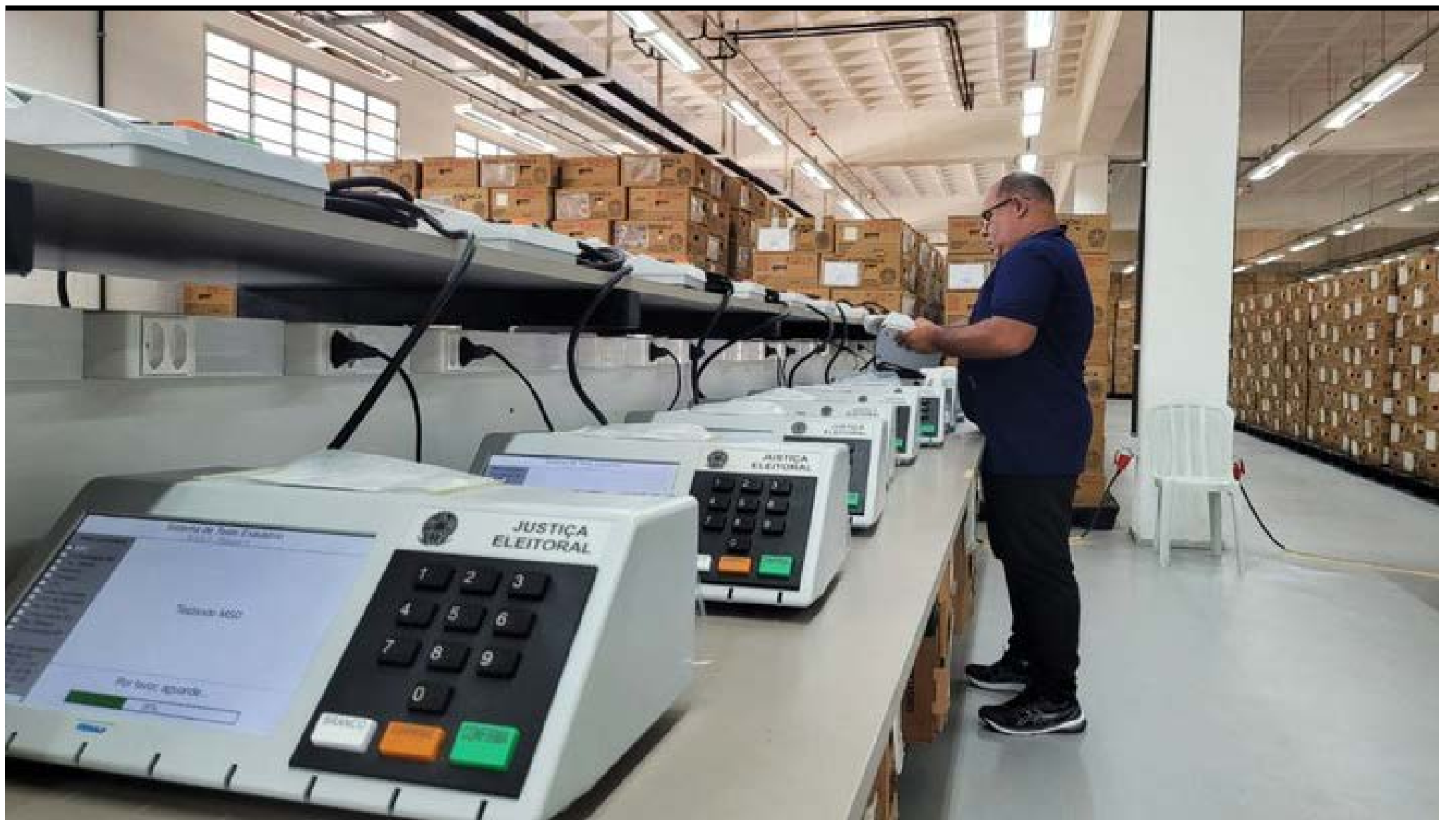
Existem 5.419 seções inseridas nos 670 locais de votação em Fortaleza.