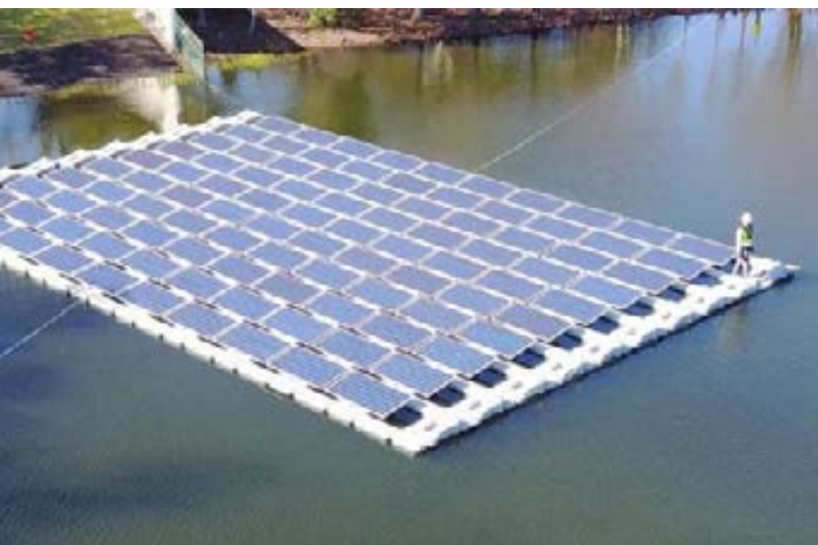
Um dos projetos que estão sendo analisados é a geração de energia em plantas flutuantes.