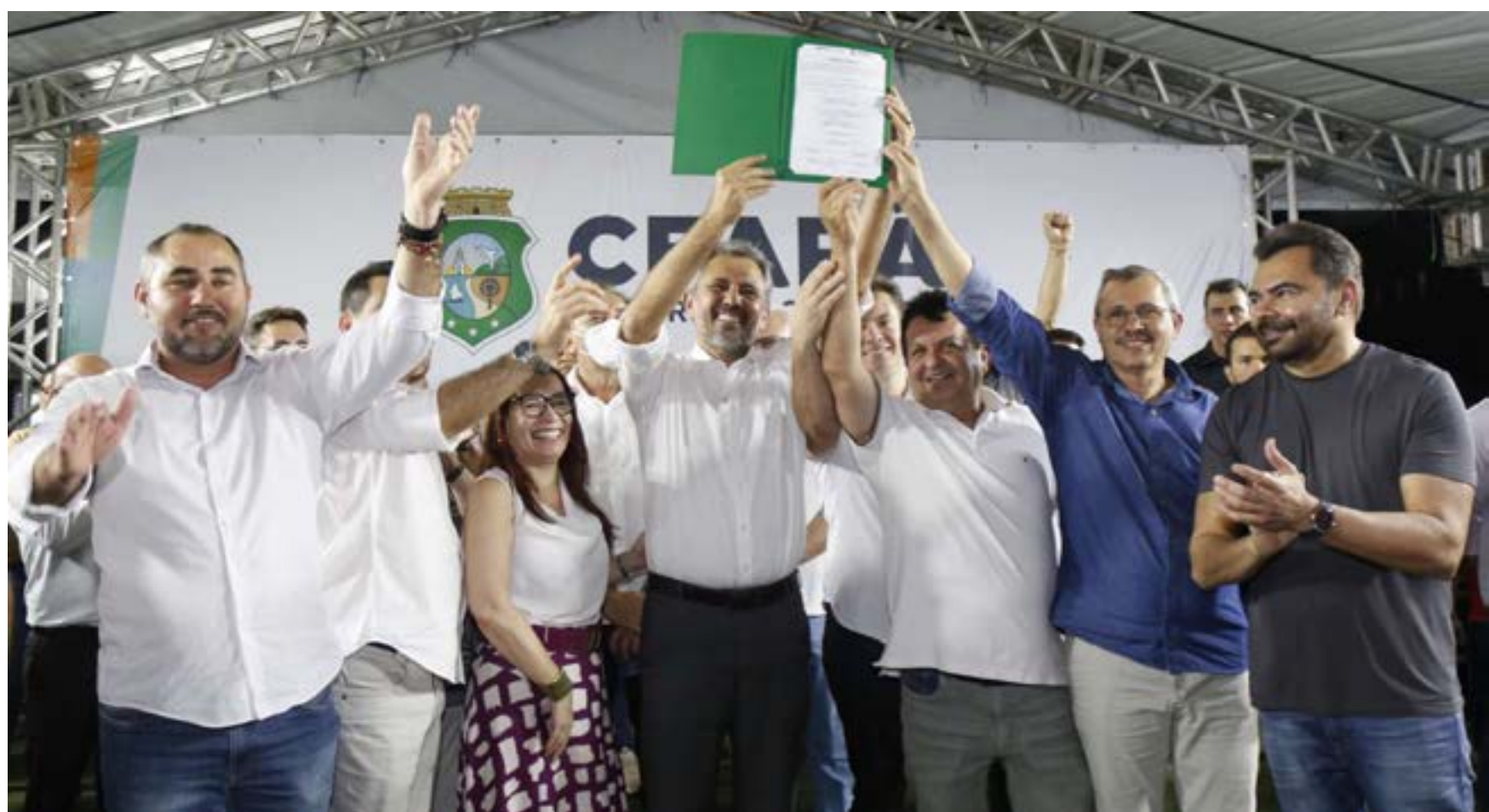
Hospital Regional de Cratéus atenderá quase 292 mil pessoas de 11 municípios do Estado.

O térreo será destinado à urgência e emergência e contará