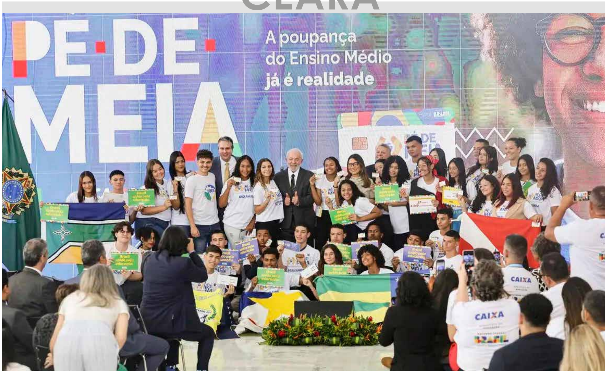
Pagamento segue a data de nascimento dos alunos.