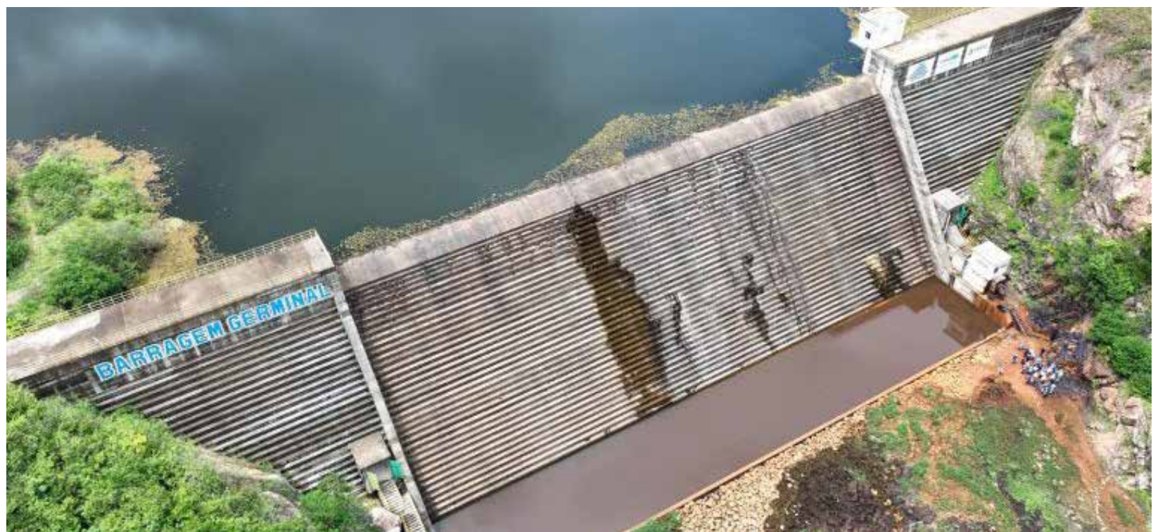
Açude Germinal, em Palmácia, foi o primeiro a verter em 2024.

Além disso, até às 16h desta segunda-feira (25), o Estado tinha 25 açudes sangrando e outros 11 acima dos 90% de capacidade. Os reservatórios vertendo são: Missi; Itapajé; Batalhão; Frios; Jerimum; Diamantino II; São Domingos; Sobral; Quandú; Acaraú Mirim; Arrebita; Caldeirões; Cauhipe; Forquilha; Gerardo Atimbone; Germinal; Itaúna; Patos; Santa Maria de Aracatiçu; Santo Antônio de Aracatiçu; São Pedro Timbaúba; São Vicente; Tucunduba; Tijuquinha; e Gangorra. Em igual período do ano passado, o Ceará