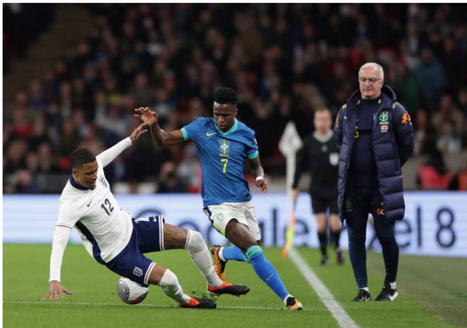
Dorival Júnior prega 'pés no chão': "Vamos passo a passo".

Após vitória diante da Inglaterra, Dorival Junior pediu para o torcedor manter "os pés no chão". "Confio demais nesses garotos, nessa equipe. Espero que com o tempo voltemos a atuar como protagonistas. Que possamos resgatar a confiança. Não é culpa de ninguém o que