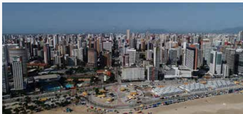
Orla da Avenida Beira-Mar é muito procurada pelos visitantes.