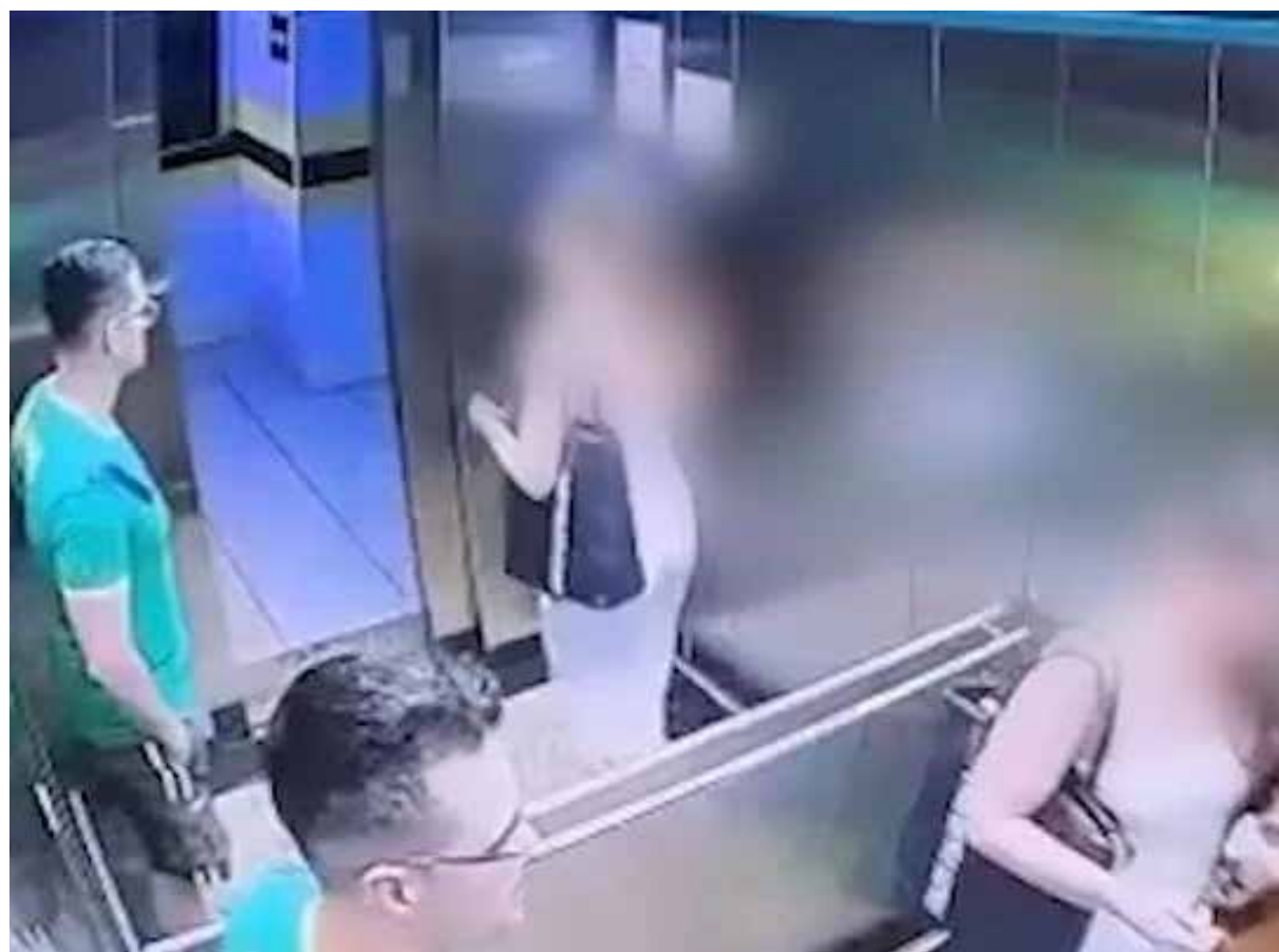
O caso aconteceu em fevereiro e ganhou repercussão neste mês.