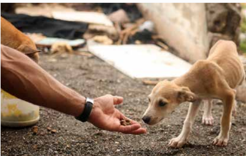
O evento é aberto ao público.

Acontece nesta terça-feira (26), a partir das 16h, no auditório da Ordem dos Advogados do Brasil (OAB) - Subseção Juazeiro Norte, o Seminário da Proteção e Bem-Estar Animal - Edição Cariri, com realização da Secretaria da Proteção Animal (Sepa) em parceria com o Instituto Centro de Ensino Tecnológico (Centec). O evento é aberto ao público e tem como objetivo promover a conscientização e discutir questões relacionadas à proteção dos animais. O momento conta com a participação de especialistas, autoridades locais, organizações não governamentais e membros da co-