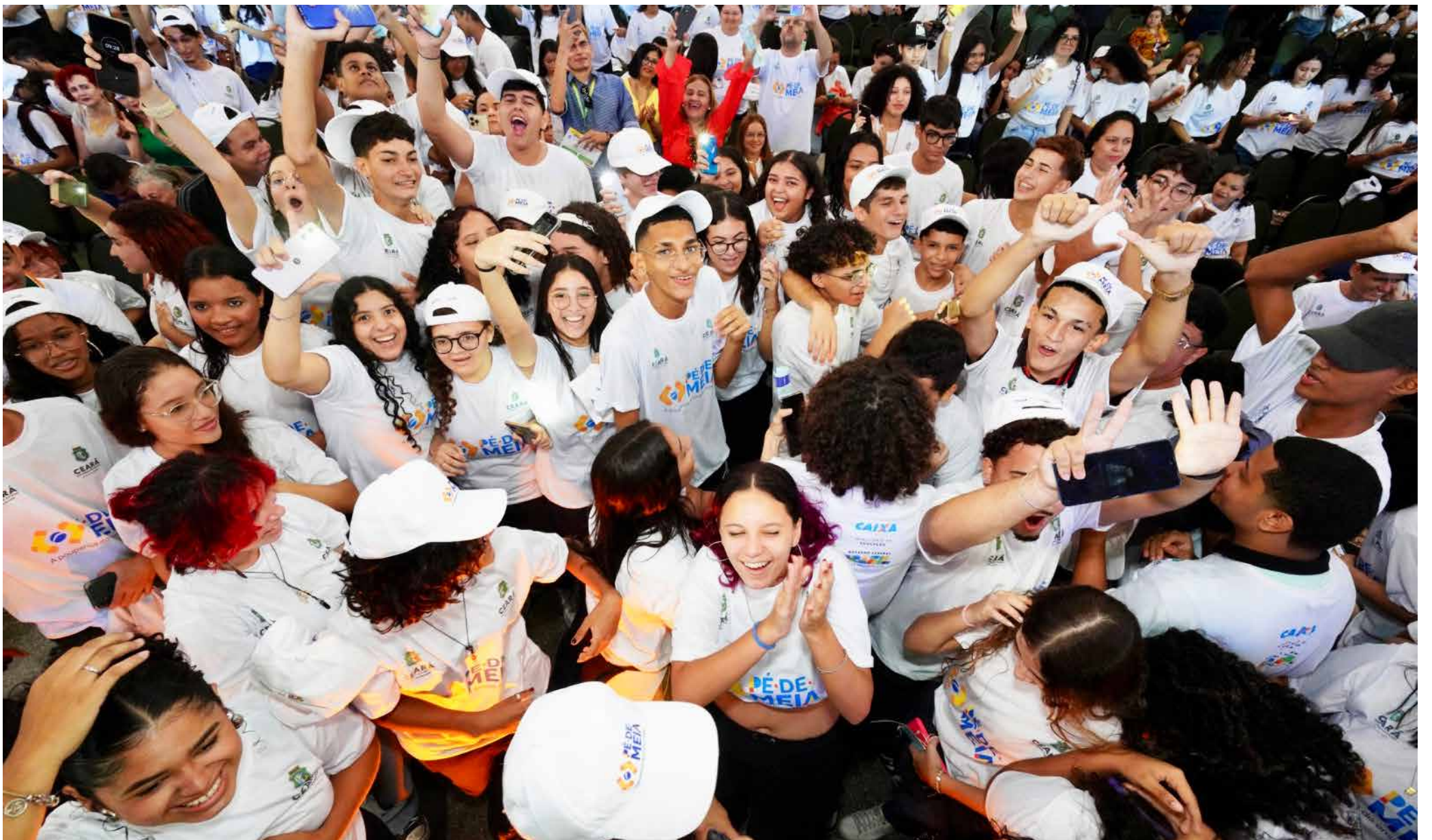
Estudantes comemoram adesão do Estado ao programa federal, em março.