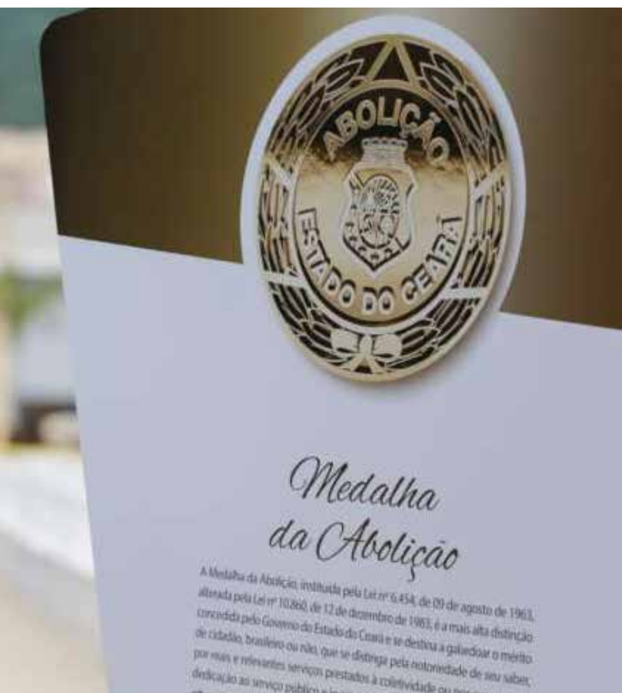
A data de entrega da comenda não foi informada.

Por fim, a Congregação Franciscana de Canindé é uma marca da religiosidade cearense e um importante pilar do turismo religioso no Estado. A Medalha da Abolição visa celebrar o movimento franciscano que chega a terras cearenses por volta de 1758, quando os frades franciscanos e terciários franciscanos (da Terceira Ordem) realizaram as “ Santas Missões ” franciscanas.