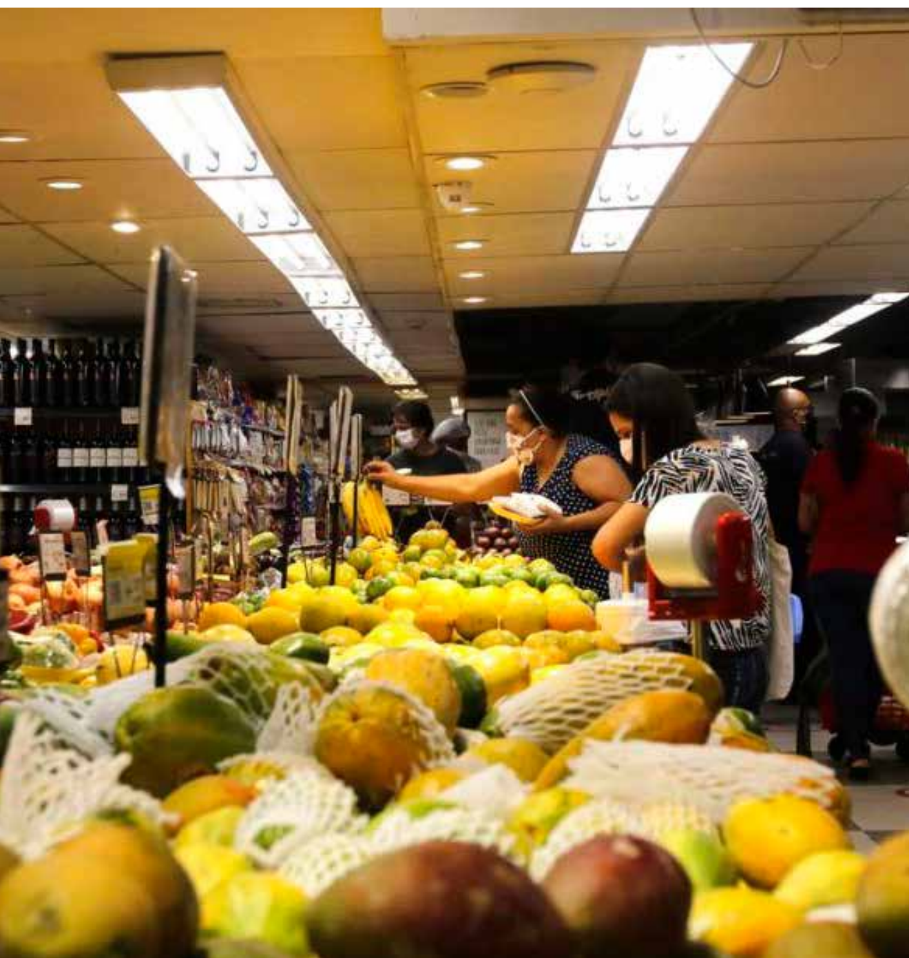
Um dos pontos positivos do atual sistema tributário brasileiro é o imposto zero para produtos hortifrutigranjeiros (saladas, verduras, raízes, tubérculos, frutas, leite, ovo), considerados mais saudáveis.

O ex-secretário Nacional de Segurança Alimentar e Nutricional de 2013 a 2016 e membro do Instituto Fome Zero, Arnaldo Anacleto, avaliou como “escandaloso” o trecho sobre alimentos do substitutivo da Proposta de Emenda à Constituição (PEC 45/2019) apresentado pelo deputado federal Aguinaldo Ribeiro (PP-PB)