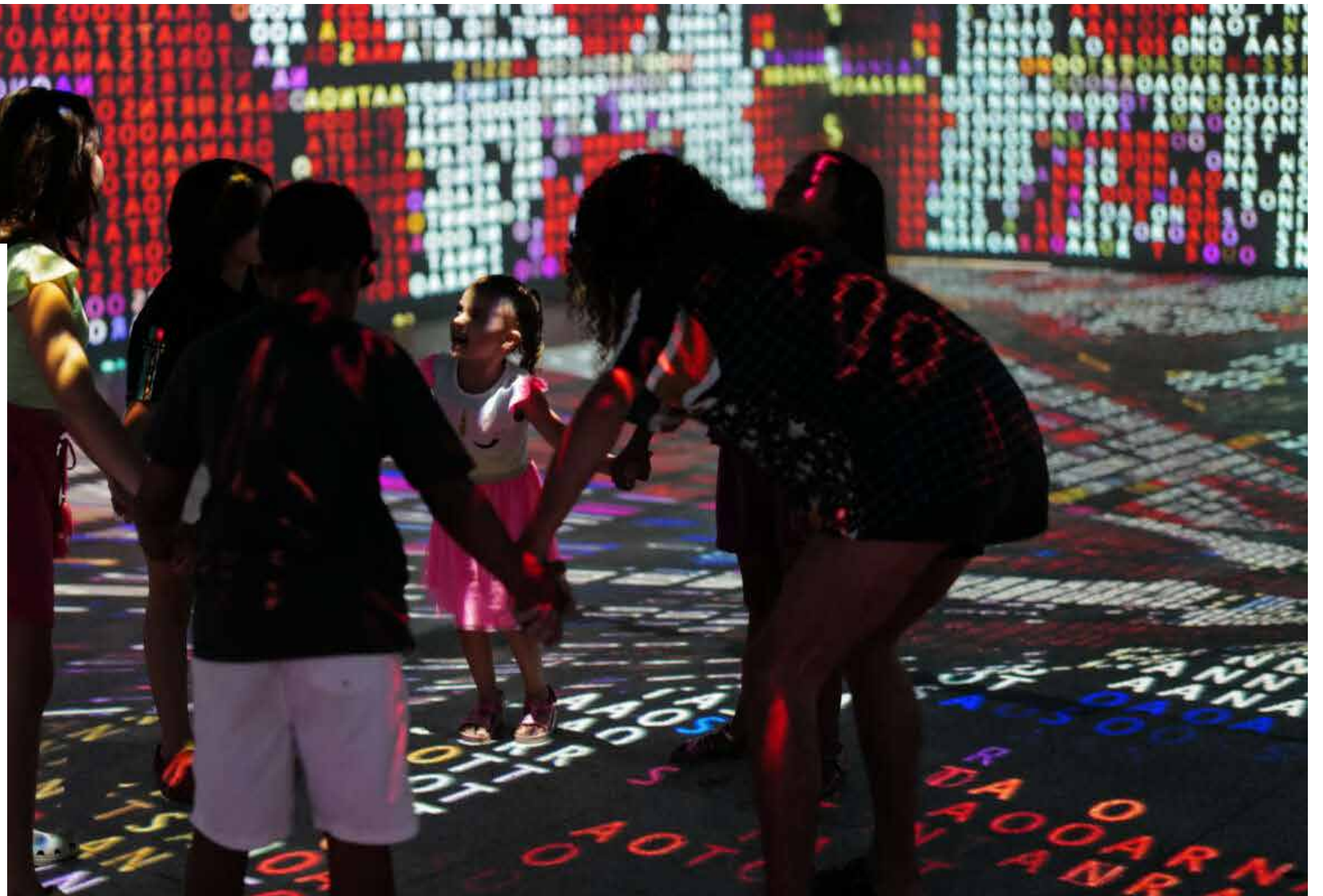
Sala do Museu da Imagem e do Som do Ceará.