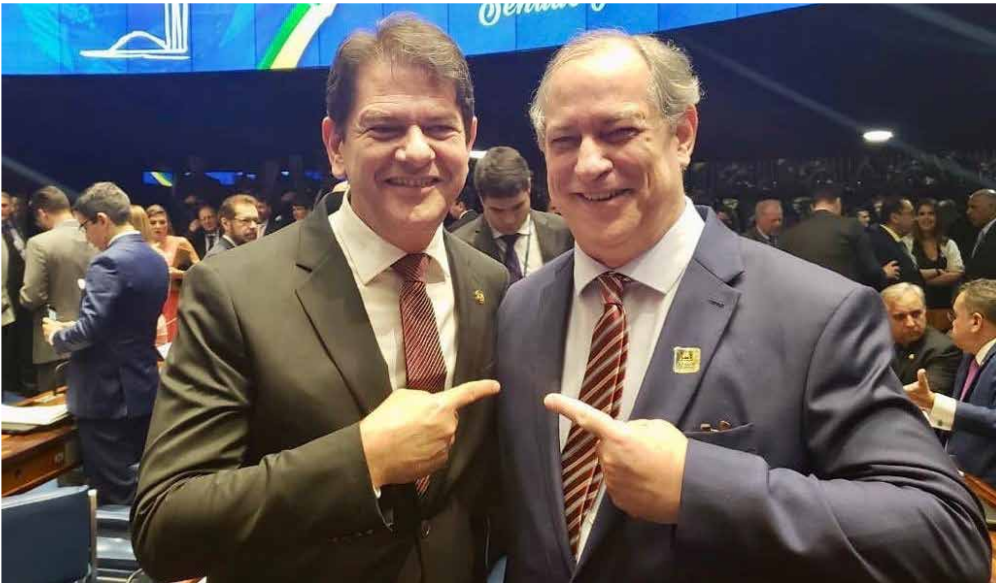
Cid Gomes e Ciro Gomes, respectivamente.

Ciro e Cid Gomes foram para lados opostos. Ciro candidato a presidente acabou derrotado. Cid Gomes ficou fora da campanha ao governo, apoiou Camilo Santana para o senado e votou em Ciro para presidente.