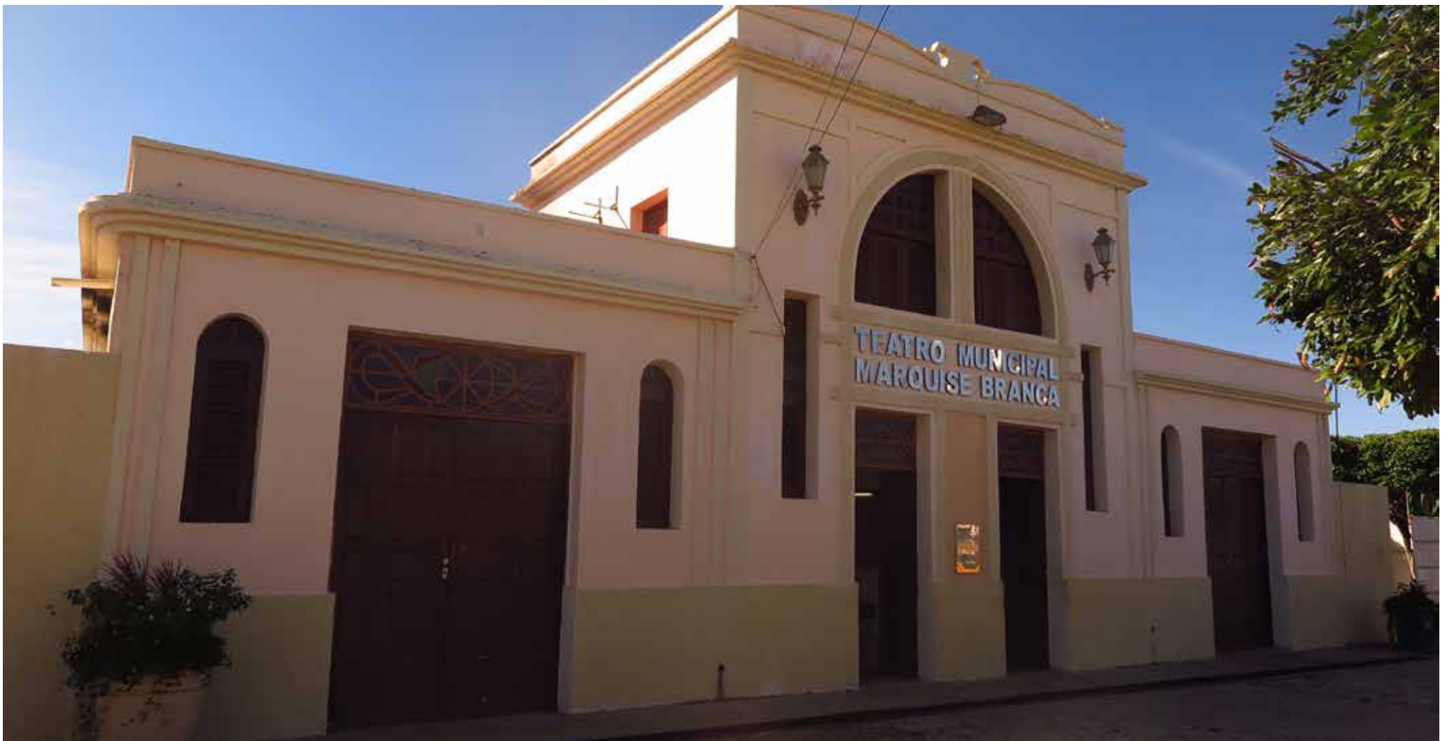
Teatro Marquise Branca, em Juazeiro do Norte.

O equipamento completará duas décadas daqui a um mês, mas segue fechado e sem expectativa de reabrir. O Município quer restaurá-lo.