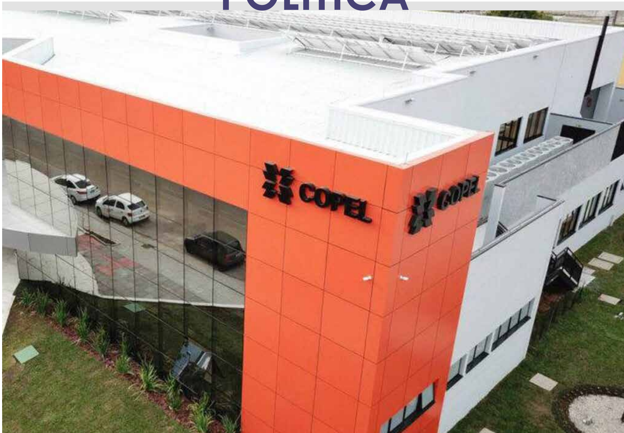
Prédio da Copel, em Curitiba, Paraná.