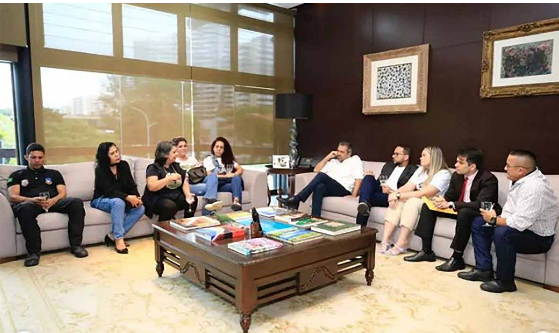
Reunião que criou a Secretaria da Proteção Animal.