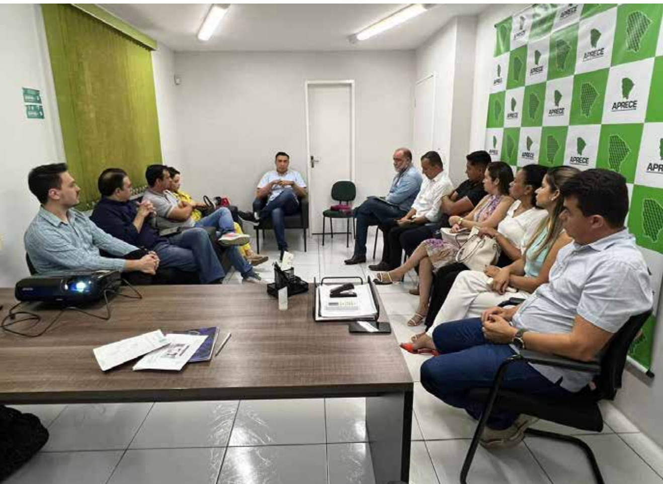
Reunião aconteceu entre sete gestores municipais, todos dirigentes de Consórcios.

A criação de consórcios é uma forma de otimizar recursos, compartilhar competências e potencializar o desenvolvimento regional