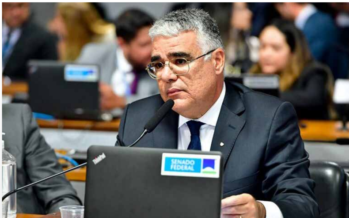
Eduardo Girão, senador cearense pelo Partido Novo (Novo).

O evento será interativo e os cidadãos podem enviar perguntas e comentários pelo telefone da Ouvidoria do Senado (0800 061 2211) ou pelo portal e-Cidadania, que podem ser lidos e respondidos pelos senadores e debatedores ao vivo. O Senado oferece uma declaração de participação, que pode ser usada como hora de atividade complementar em curso universitário, por exemplo. O portal e-Cidadania também recebe a opinião dos cidadãos sobre os projetos em tramitação no Senado, além de sugestões para novas leis.