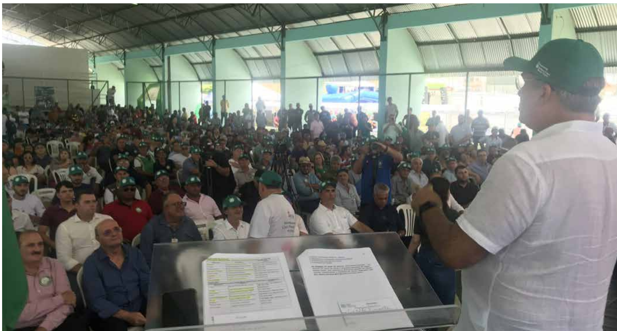
Este foi o primeiro evento de uma série que a Faec pretende realizar em outras regiões do Estado.

O evento, realizado em Quixeramobim no último sábado, 6, reuniu cerca de 2 mil pessoas