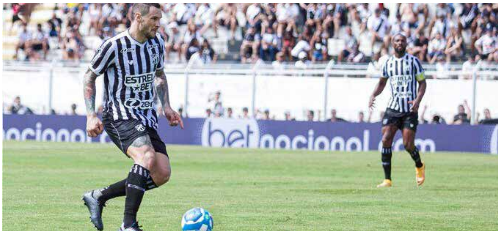
O Vozão pode entrar na zona de rebaixamento ainda nesta rodada.

Já o Ceará optava por tocar a bola no setor defensivo, com pouca eficiência na construção de jogadas de ataque. O time comandado por Barroca ainda puxou alguns contra-ataques com velocidade, mas viu Nicolas, sofrendo com a forte marcação e o calor – o jogo começou às 11h –, errar. Jean Carlos e Janderson também tentaram, mas sem sucesso. O primeiro