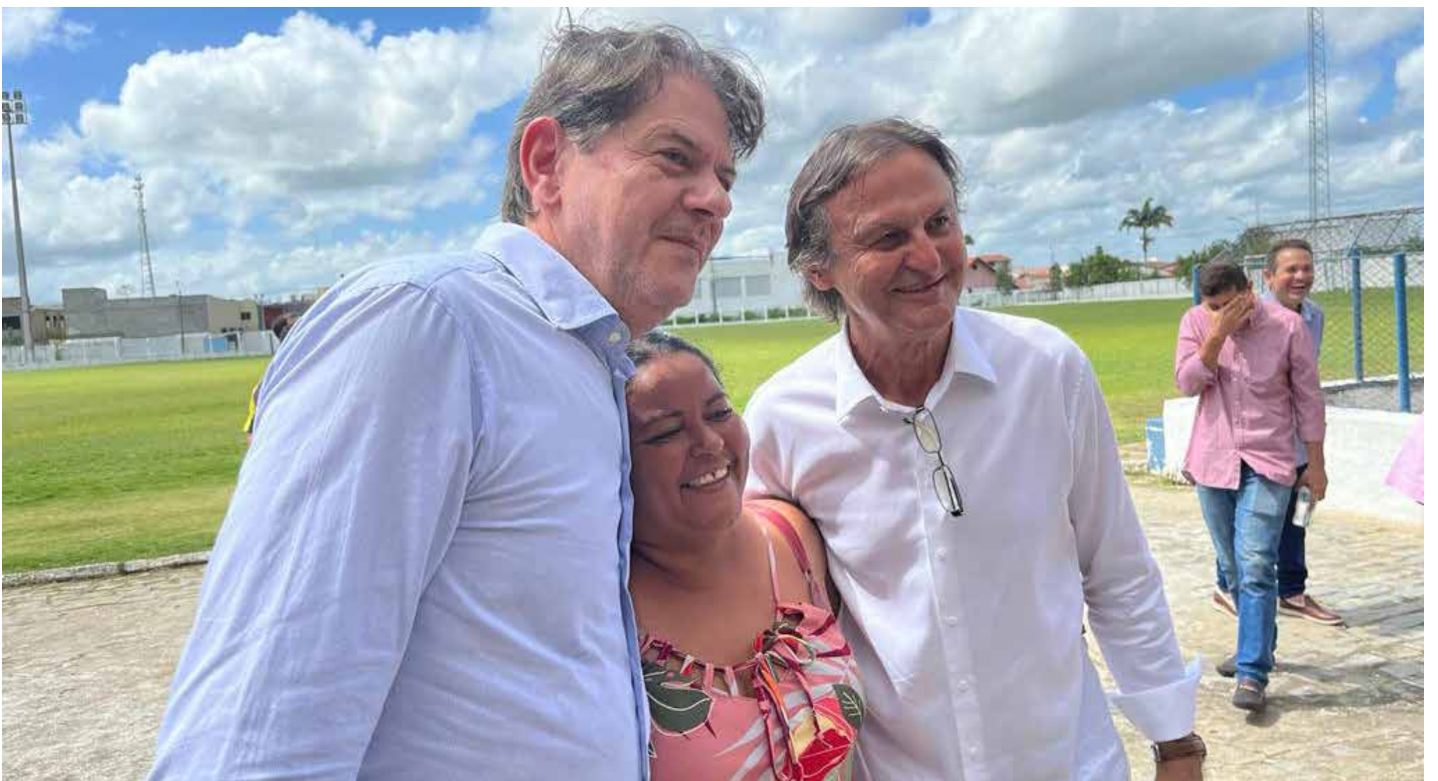
O senador Cid Gomes (PDT) disparou: "Papai dizia que a gente tende a prognosticar aquilo que a gente deseja.

Figuras centrais do PDT divergem sobre uma possível aliança entre as duas siglas nas eleições municipais