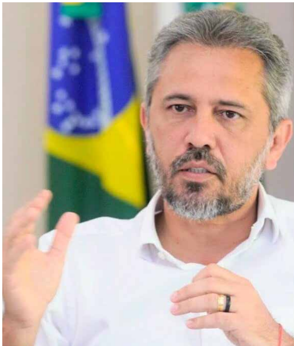
Cid Gomes (PDT) e Elmano de Freitas (PT), figuras importantes dos respectivos partidos.