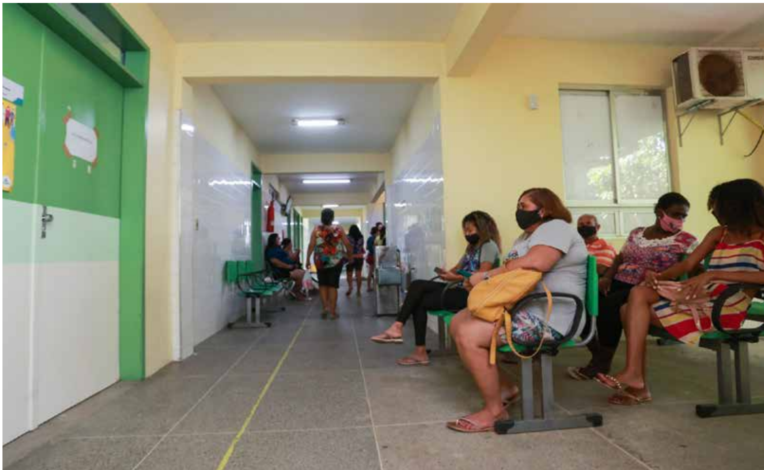
A proposta do Refis-Saúde visa contribuir com a regularização de débitos dos contribuintes.

A proposta visa possibilitar a regularização fiscal de contribuintes junto ao fisco municipal