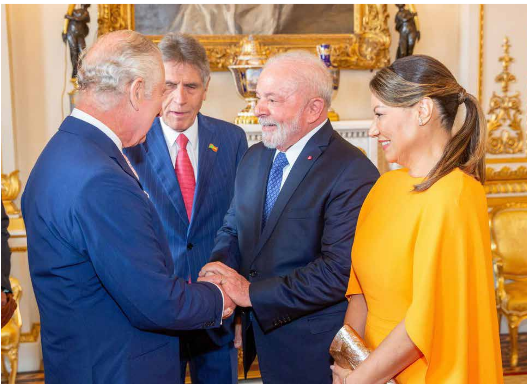
Lula convidou o primeiro-ministro do Reino Unido para visitar o Brasil.

Na sexta-feira, 5, o primeiro-ministro do Reino Unido, Rishi Sunak, anunciou que o país investirá no Fundo Amazônia