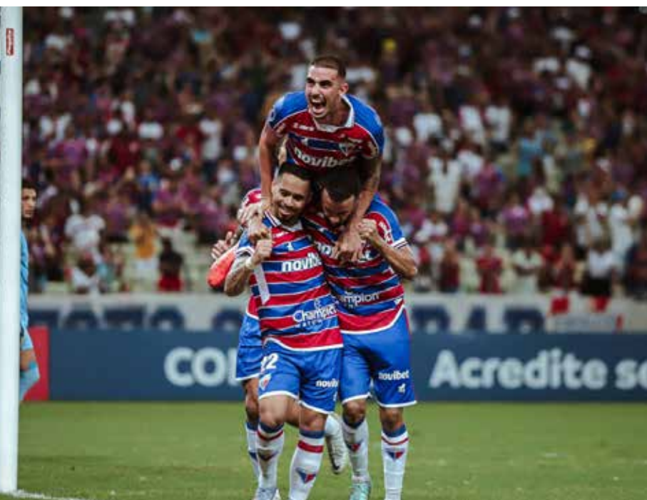
O confronto entre Corinthians e Fortaleza fecha a rodada da Série A.

O Leão vai até a Neo Química Arena para encarar o Corinthians nesta segunda-feira, 8, pela quarta rodada do Campeonato Brasileiro Série A. Com duelo marcado para às 20h, o Fortaleza busca manter a invencibilidade na competição e permanecer na parte de cima da tabela. Até aqui, foram duas vitórias e um empate. Já o Timão vive um momento complicado, com pressão nos arredores de Itaquera. O confronto entre Corinthians e Fortaleza fecha a rodada da Série A.