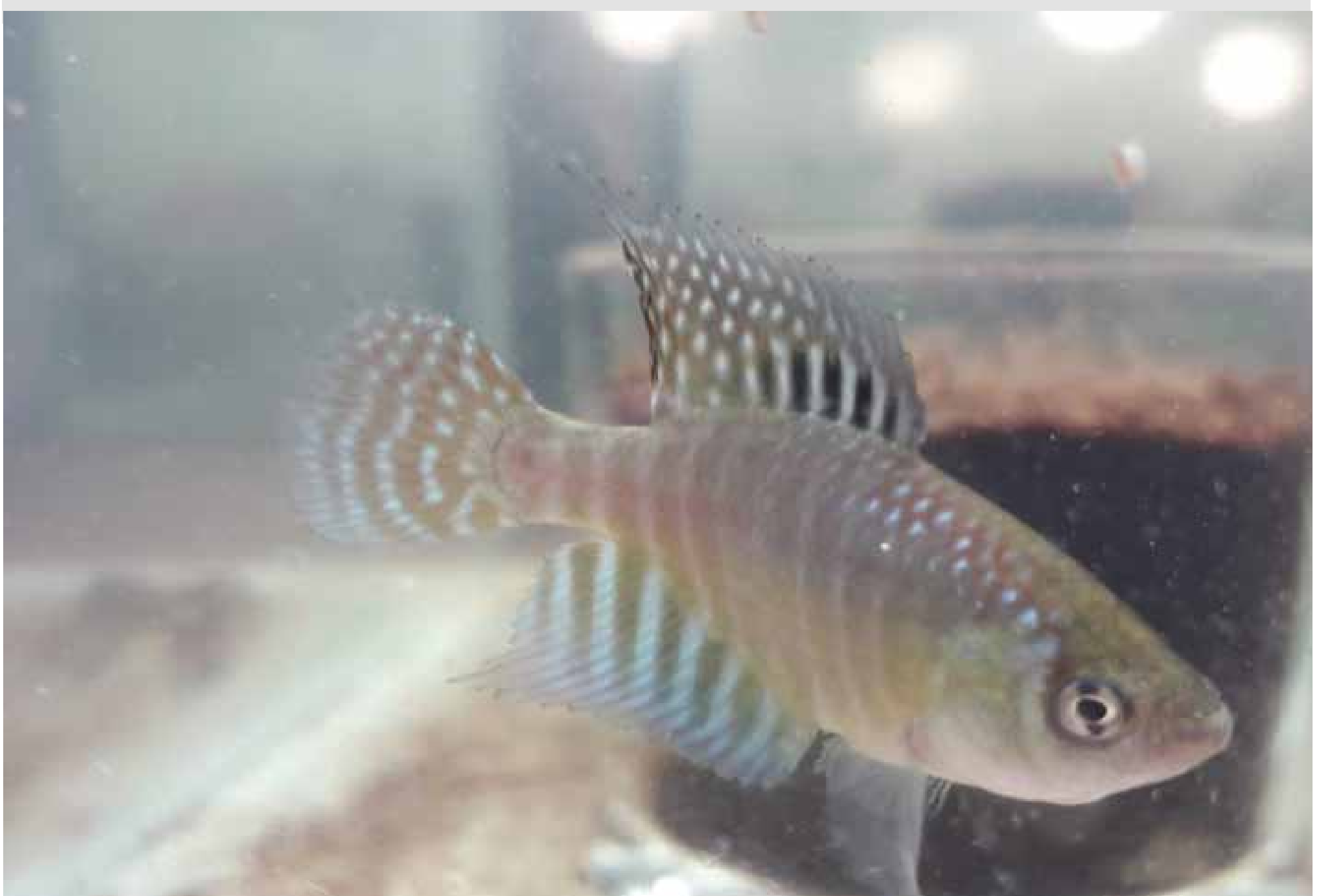
O Peixe-das-Nuvens só foi encontrado até agora no município de Aquiraz.