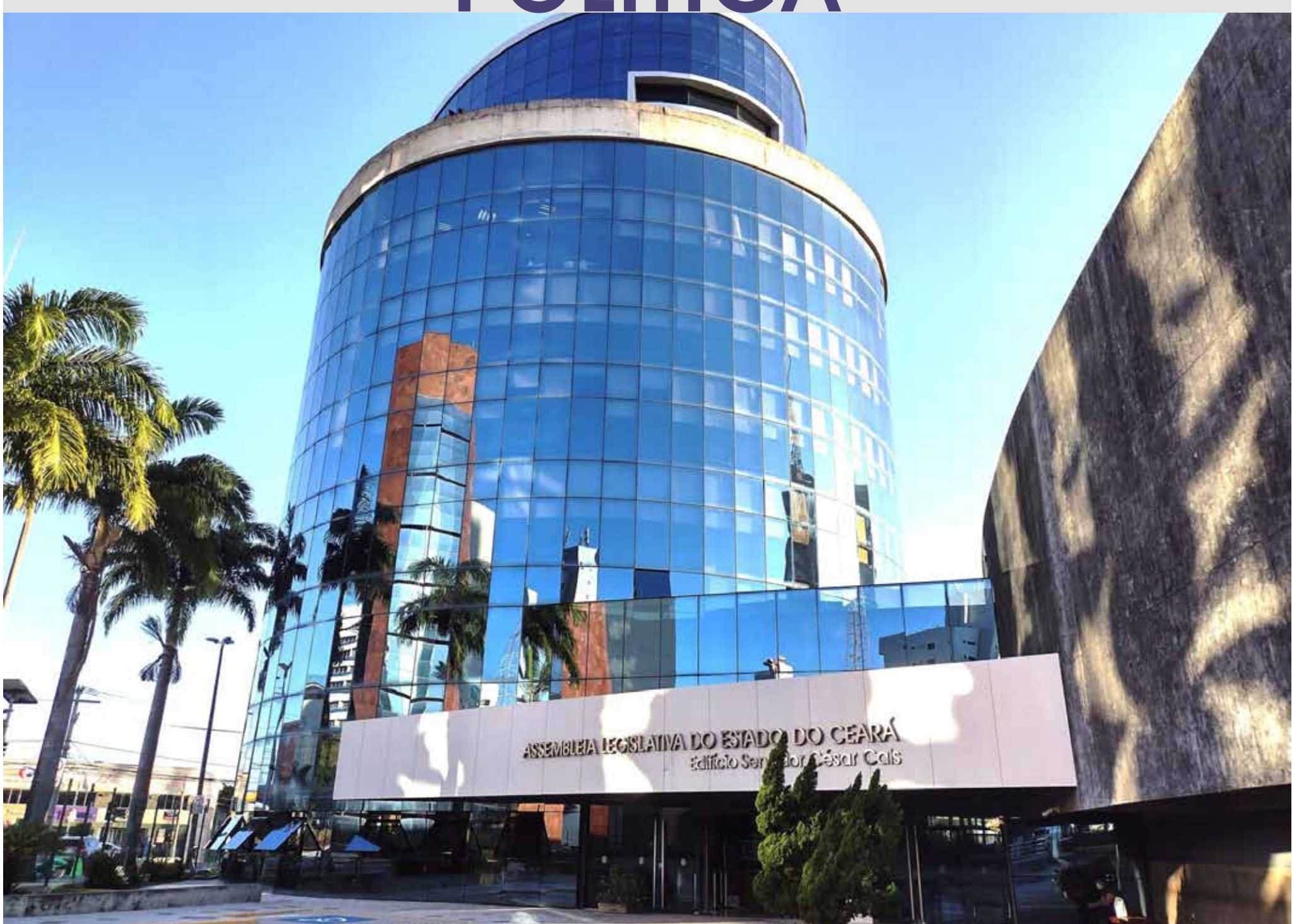
A reunião será realizada na Alece.