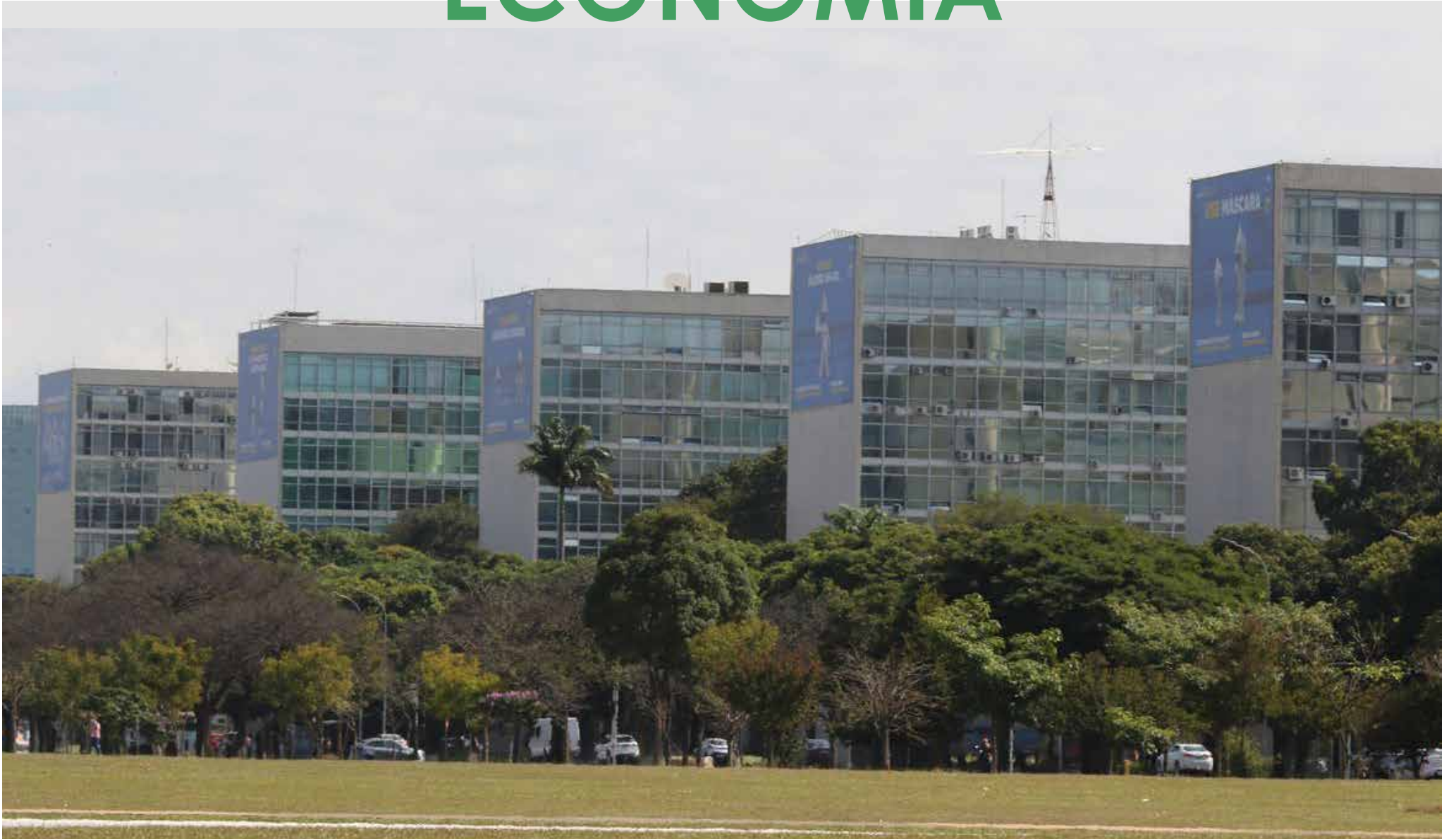
O Tesouro atribui o recuo ao ritmo variável no fluxo de obras públicas.