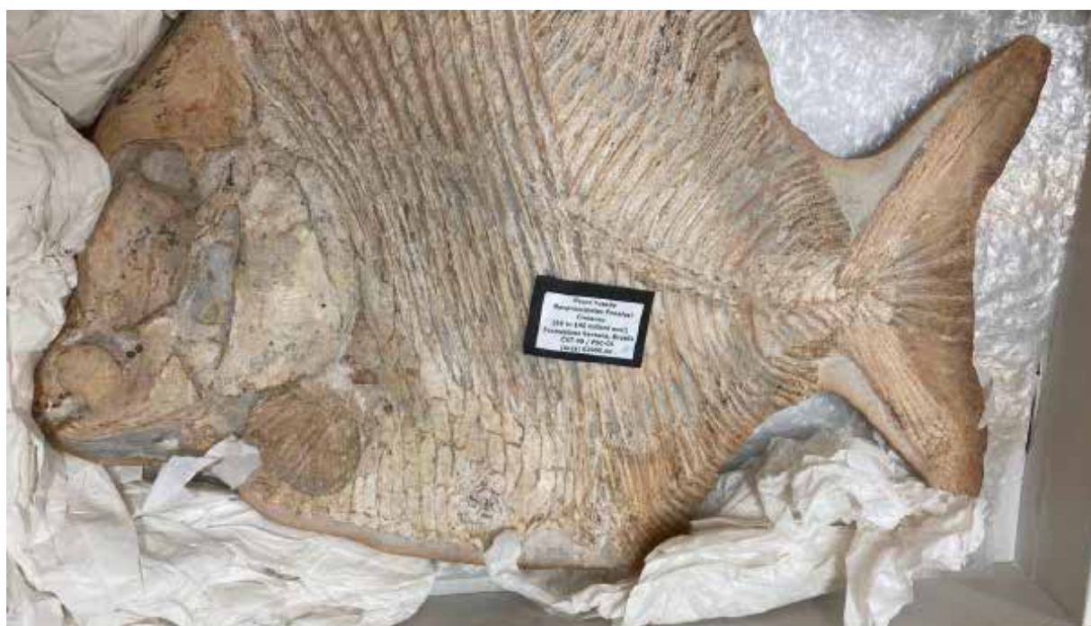
A apreensão ocorreu durante ações de fiscalização preventiva contra o tráfico de fósseis.

O material recolhido foi entregue ao Museu de Paleontologia de Santana do Cariri para estudos e posterior exposição