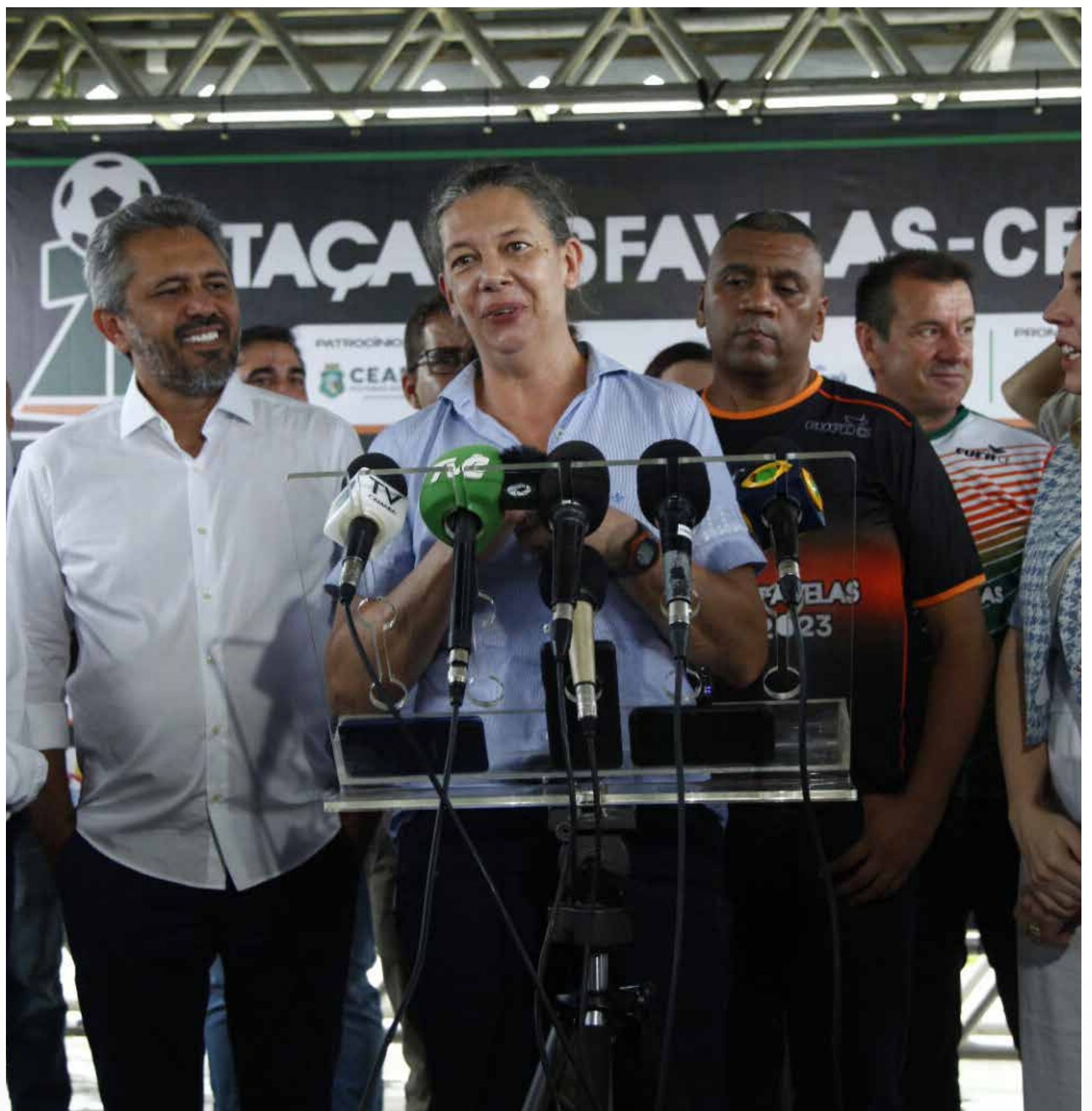
O evento aconteceu na Areninha do Dendê, no Parque Dom Aloísio Lorscheider.

Pela tarde, Elmano e a ministra Ana Moser estiveram no CFO para assinatura de um memorando visando investimentos na área esportiva no Ceará. O acordo prevê a implantação do projeto-piloto do programa Rede de Desenvolvimento do Esporte, um pacto com o Estado para levar o esporte com foco na periferia. O projeto mira a redu-