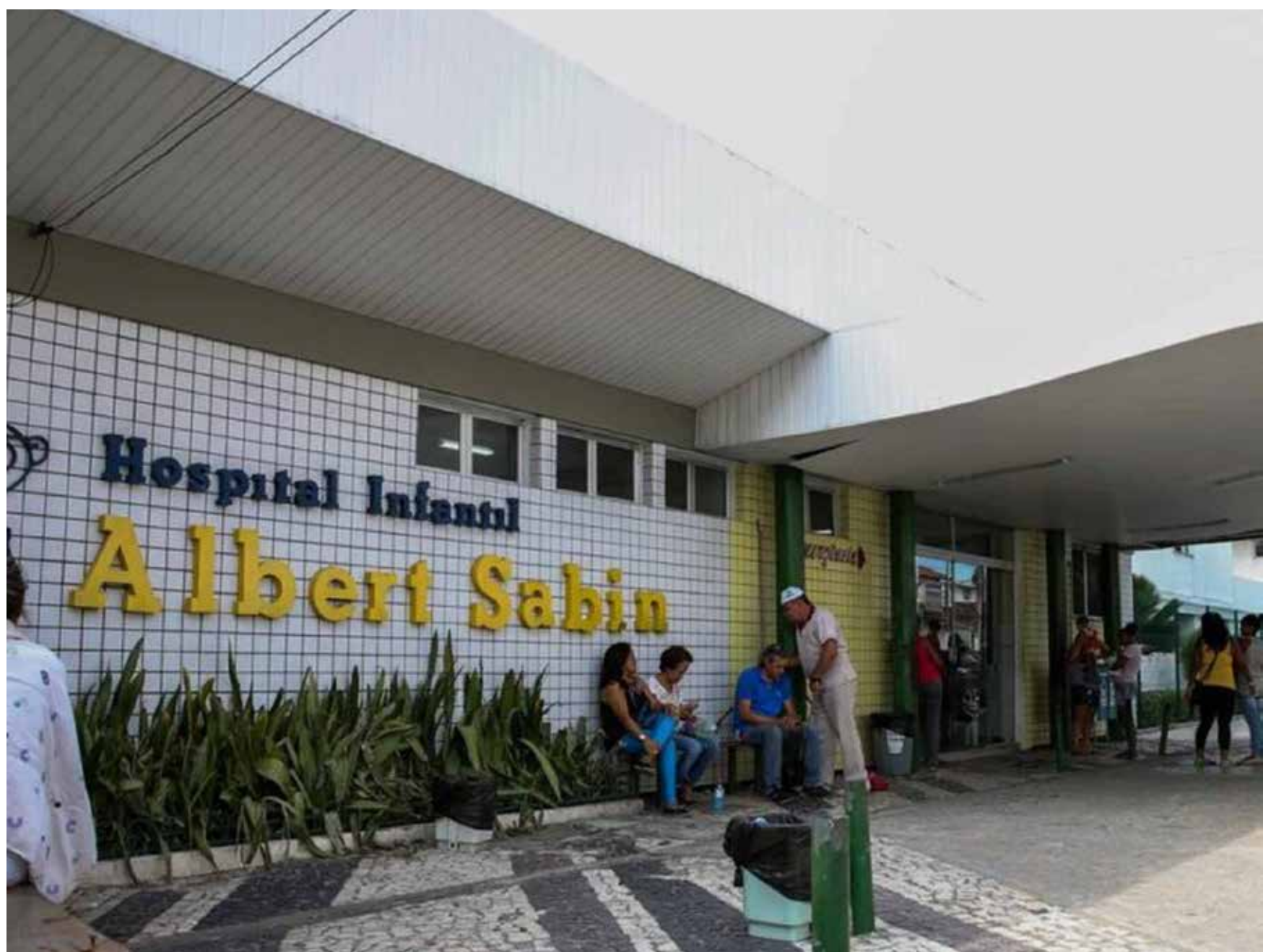
Albert Sabin: Sindicato dos Médicos reuniu denúncias de profissionais da categoria.

O Sindicato dos Médicos destaca que esta situação está refletindo, também, em sobrecarga aos médicos generalistas do Pro-