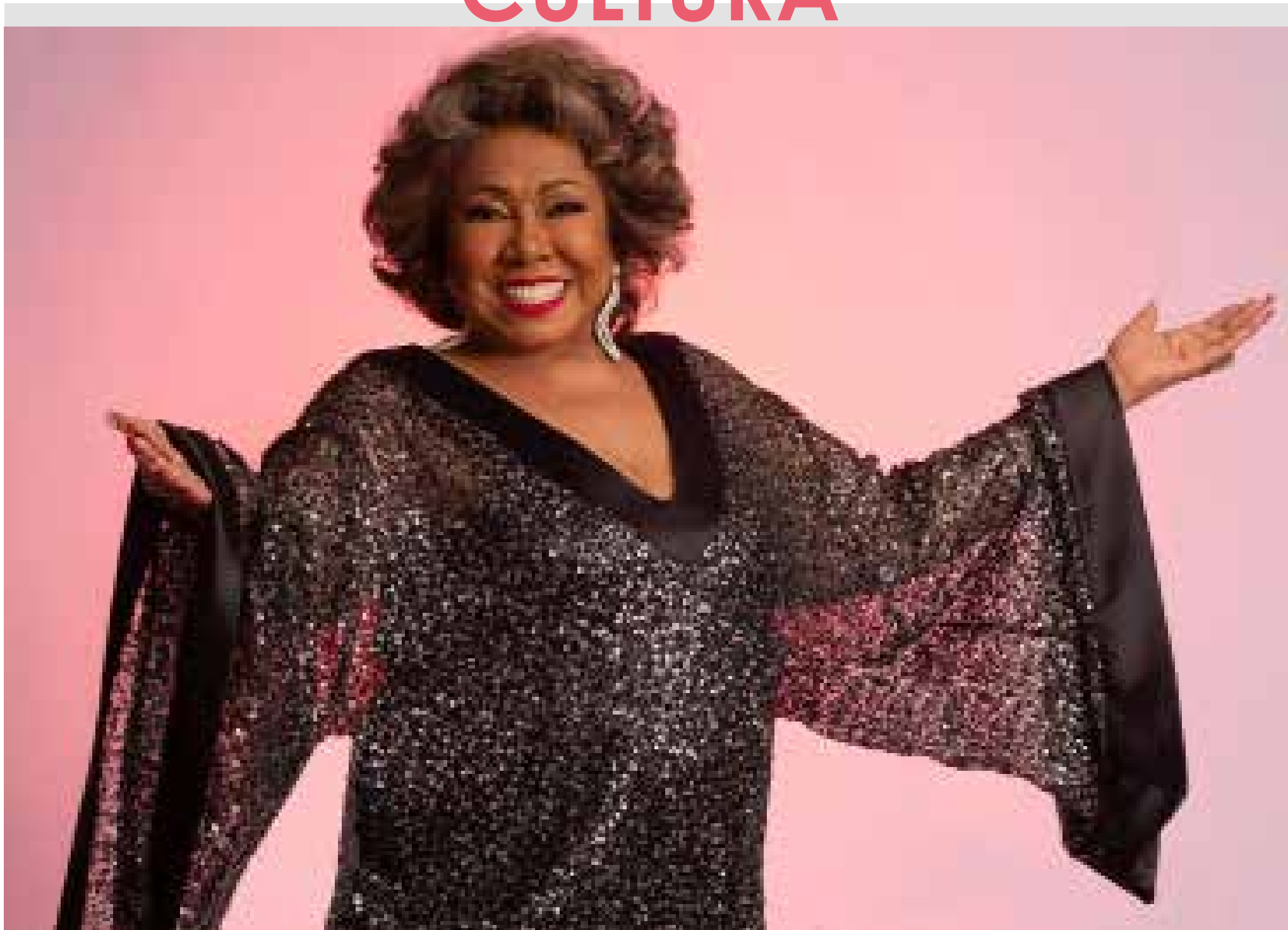
Na última visita à Capital, Alcione foi uma das atrações da virada do ano no aterro da Praia de Iracema.