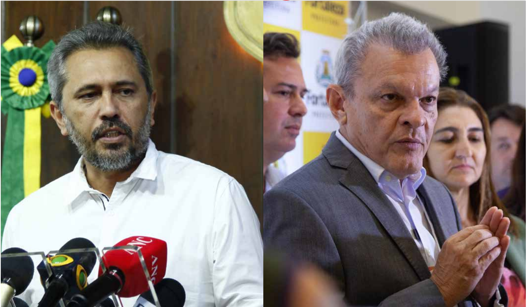
Trocas de farpas entre Sarto e Elmano se tornaram frequentes nos discursos dos dois gestores.