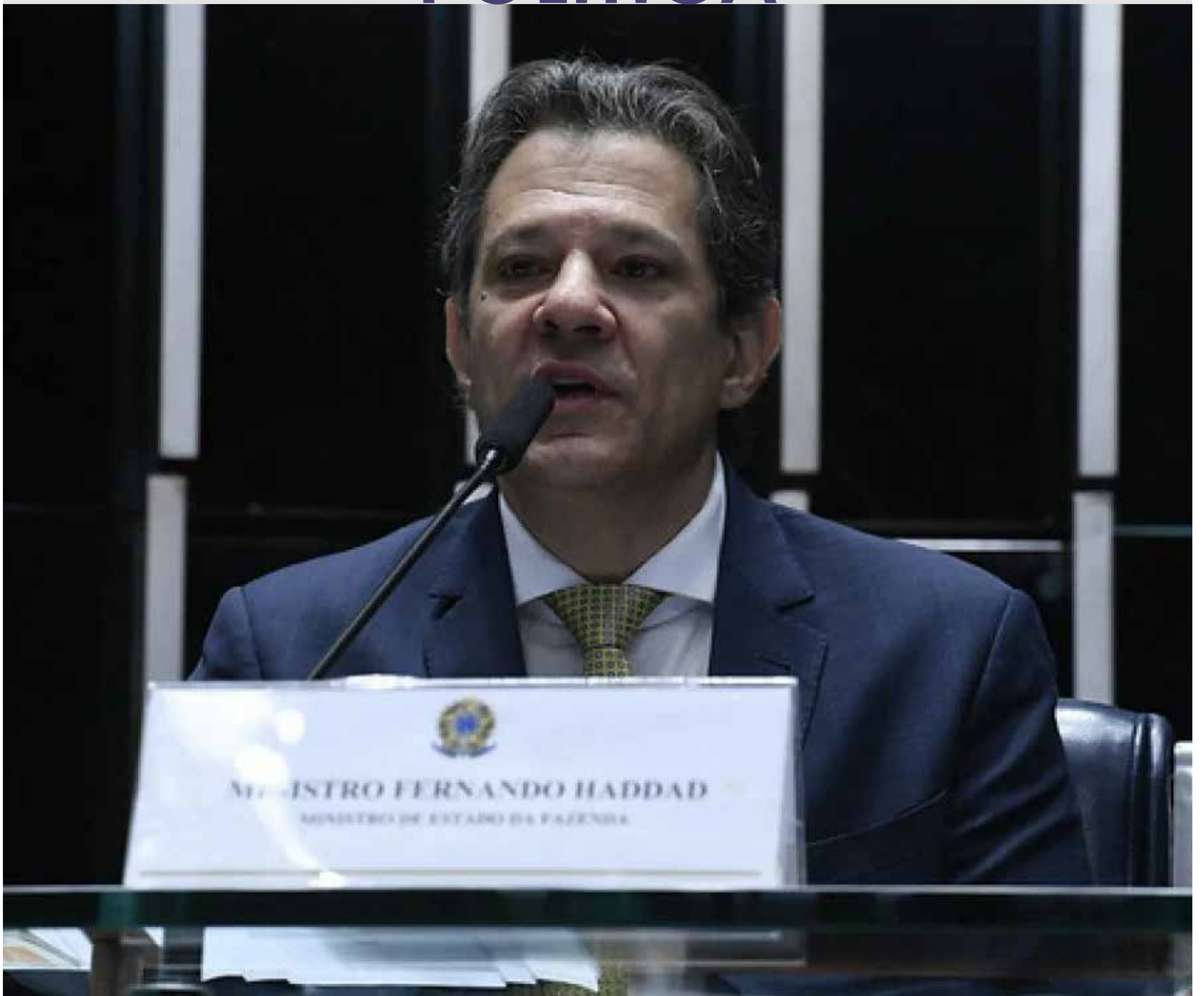
Ministro da Fazenda, Fernando Haddad, durante discurso.