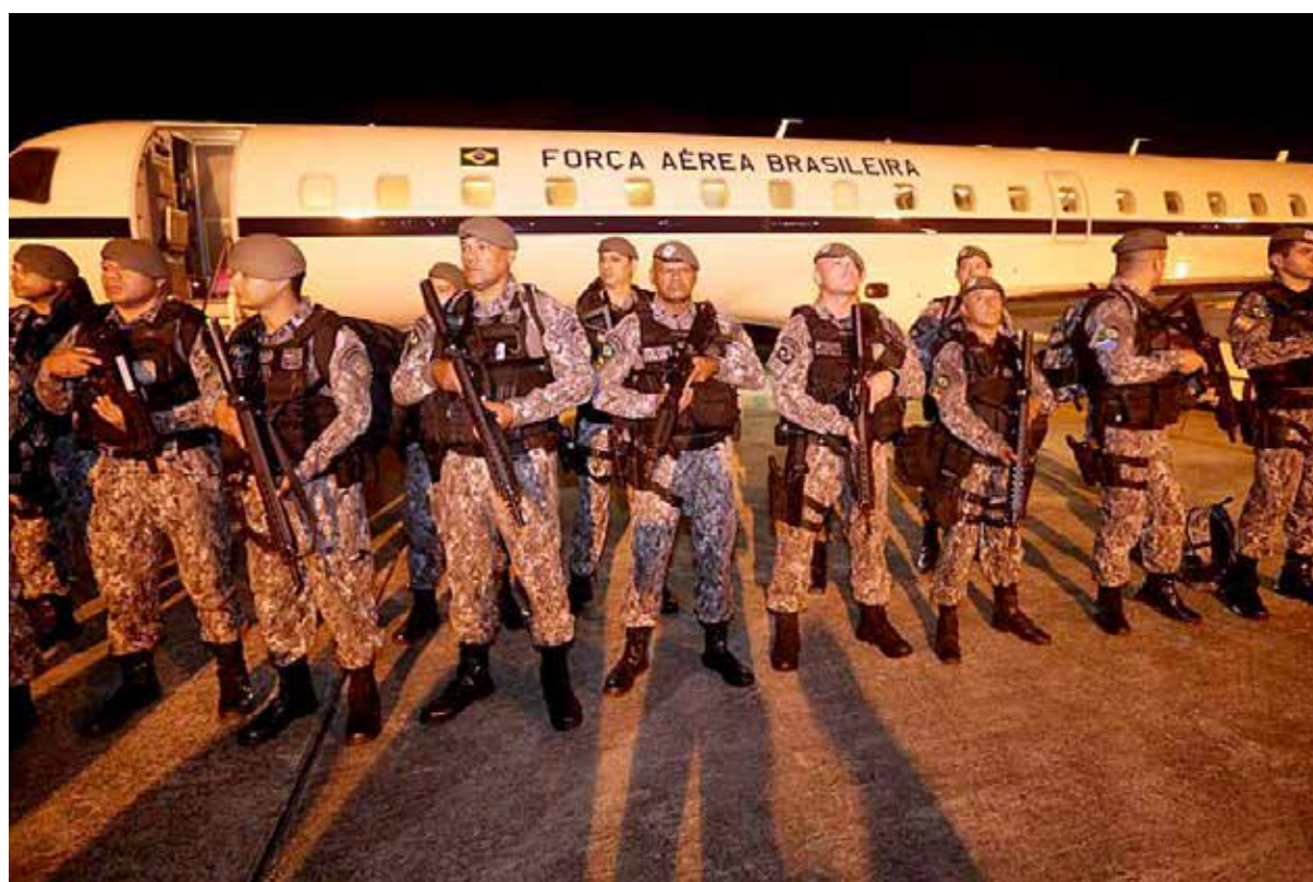
Envio de forças é para reforço da segurança no estado

Até a noite da terça-feira (14), segundo a Secretaria de Segurança Pública e Defesa Social (Sesed), ao menos 21 suspeitos de envolvimento nos ataques já tinham sido presos, sendo dois foragidos da Justiça e um adolescente apreendido. Também foram apreendidas: cinco armas de fogo, um simulacro, 18 artefatos explosivos, três galões de gasolina, quatro motos e um car-