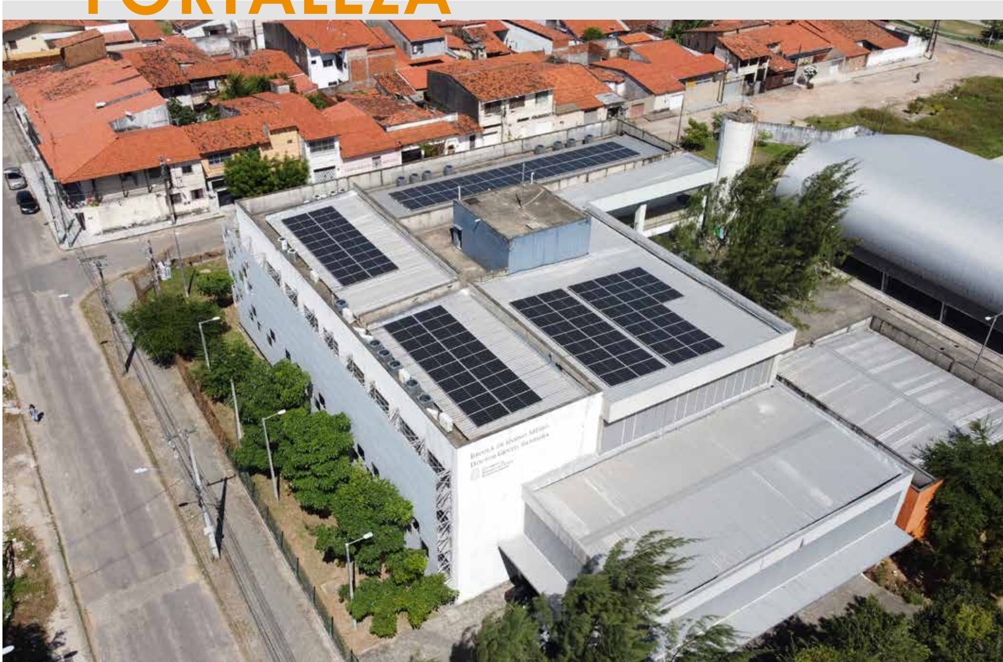
Governo mira a sustentabilidade ambiental