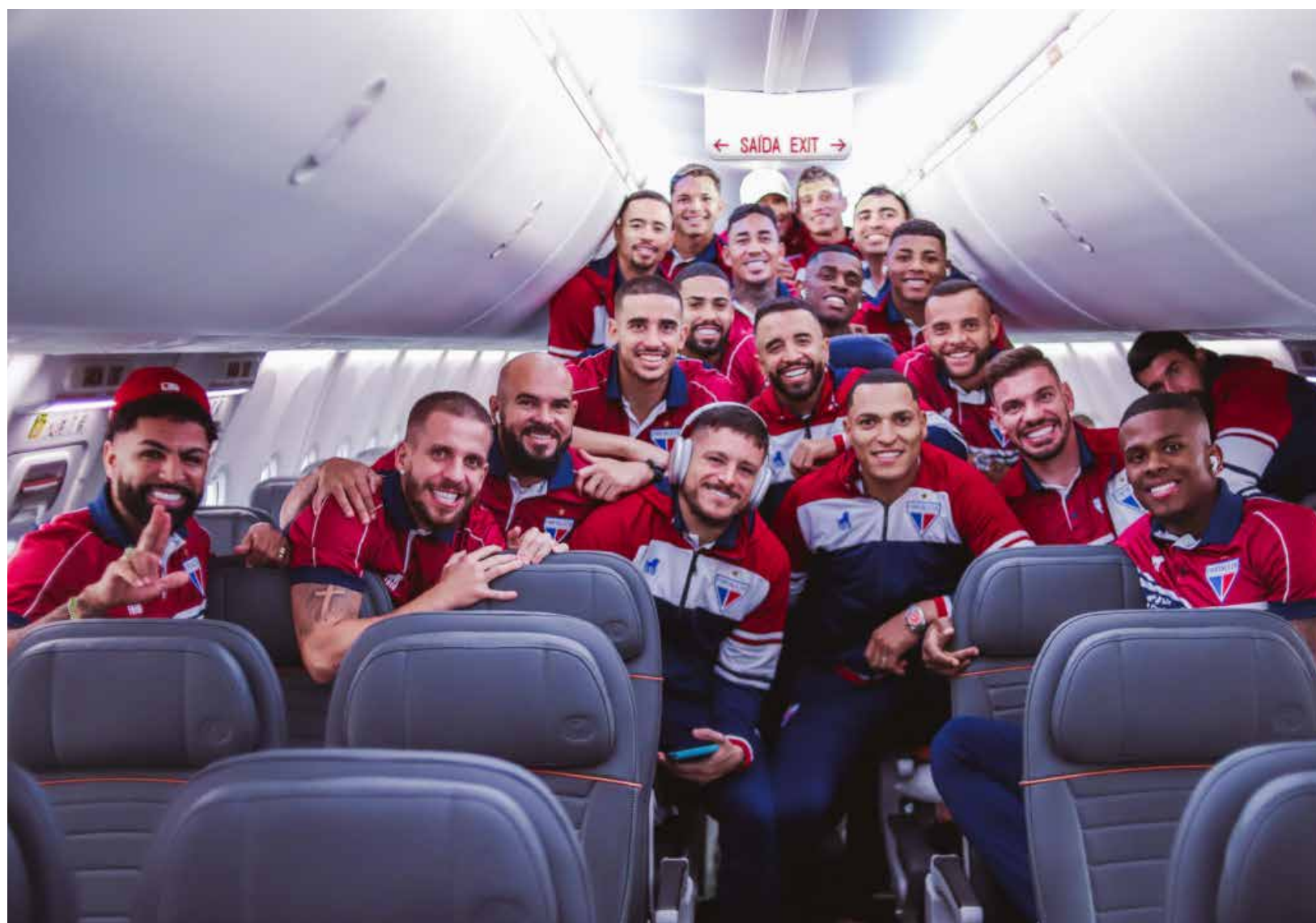
Delegação do Fortaleza está no Paraguai desde terça-feira, 14.

Após o final da última partida, contra o Ferroviário, em que o time empatou por 1 a 1, o técnico Vojvoda defendeu o time e falou da resiliência que o elenco possui. "O time perdeu duas partidas, estávamos perdendo a terceira, mas encontramos a resposta que fomos buscar. É um time que tem resiliência e que já mostrou que vai sair dessa situação", afirmou o treinador ao final dos 90 minutos do Clássico