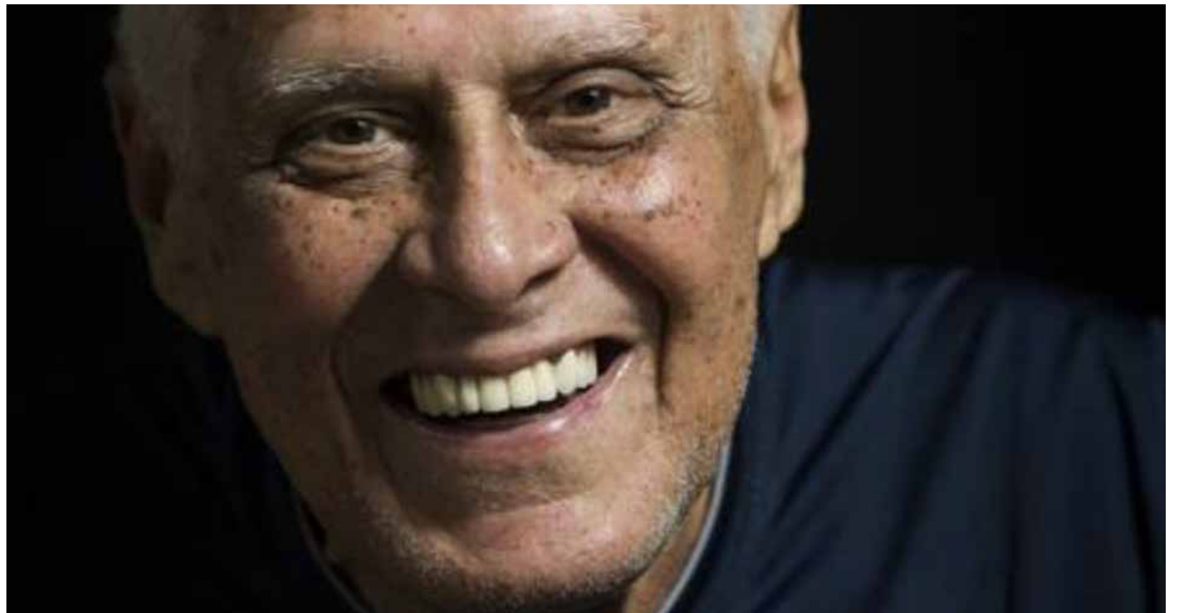
Craque morreu em decorrência de um câncer

Quem também se manifestou foi um dos grandes ídolos do Vasco, o ex-jogador Juninho Pernambucano. "Descanse em paz eterno gigante Roberto Dinamite. O futebol e todos nós te agradecemos por tudo. Você