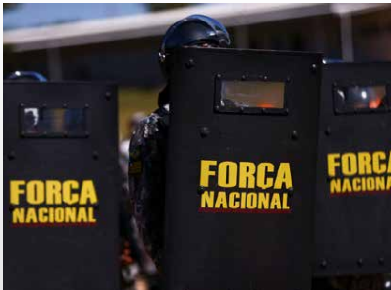
Decisão ocorre de maneira cautelar, sinaliza MJSP

O ministro da Justiça e Segurança Pública, Flávio Dino, autorizou o emprego da Força Nacional de Segurança Pública para atuar na capital federal, entre a Rodoviária do Plano Piloto e a Praça dos Três Poderes. Segundo a pasta, a medida foi adotada “em razão das manifestações políticas no centro da capital federal.”