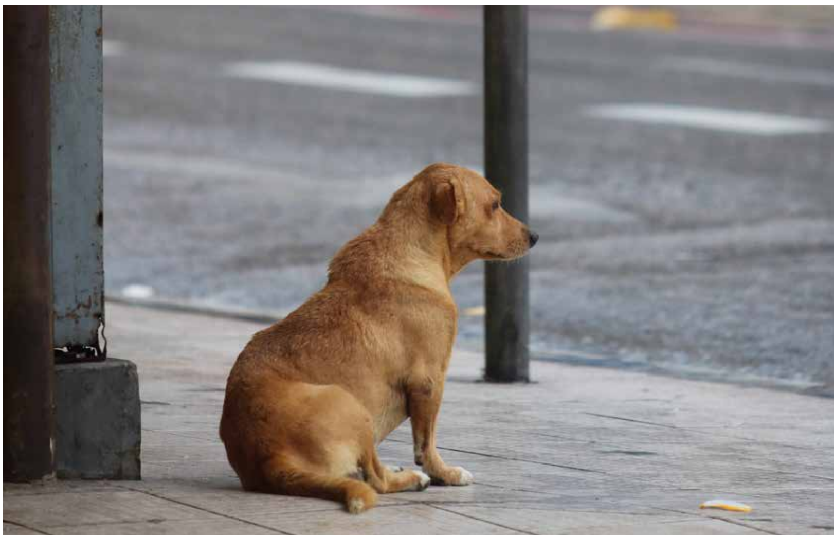
Atendimentos, voltados a cães e gatos, são gratuitos

Até quarta, serão entregues 25 fichas para consultas veterinárias, 20 fichas para vacinação e 20 para testes de triagem para leishmaniose