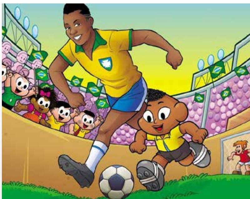
Rei do Futebol faleceu no último dia 29

Uma mostra virtual de trabalhos feitos por artistas brasileiros presta homenagem ao ex-jogador Edson Arantes do Nascimento, o Pelé, morto no último dia 29. Chamada de Exposição Love - Homenagem ao Rei Pelé, a mostra já está disponível no site e reúne mais de 100 cartuns feitos por artistas como Mauricio de Sousa, Aroeira, Ziraldo, Laerte e Jal, entre outros.