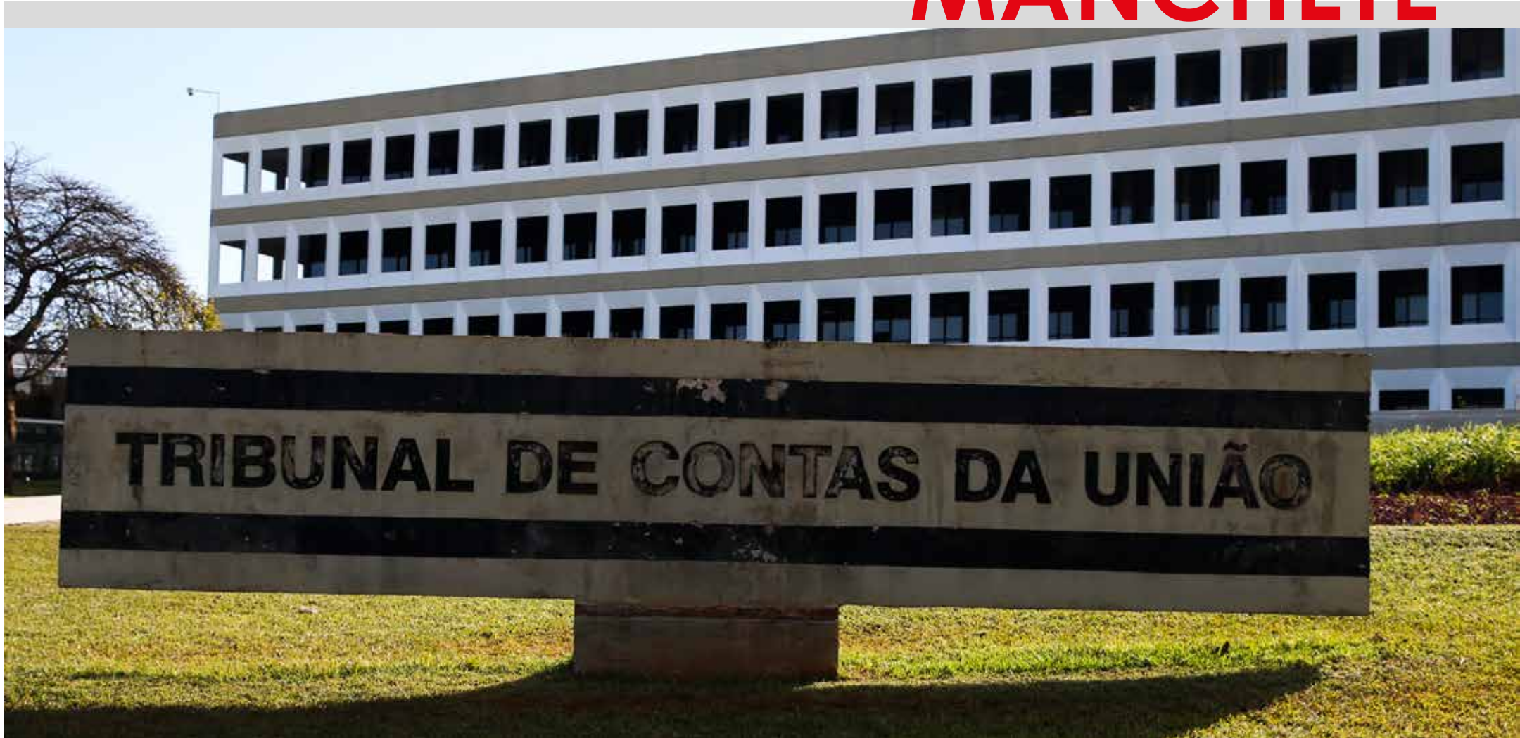
Sede do Tribunal de Contas da União (TCU), em Brasília