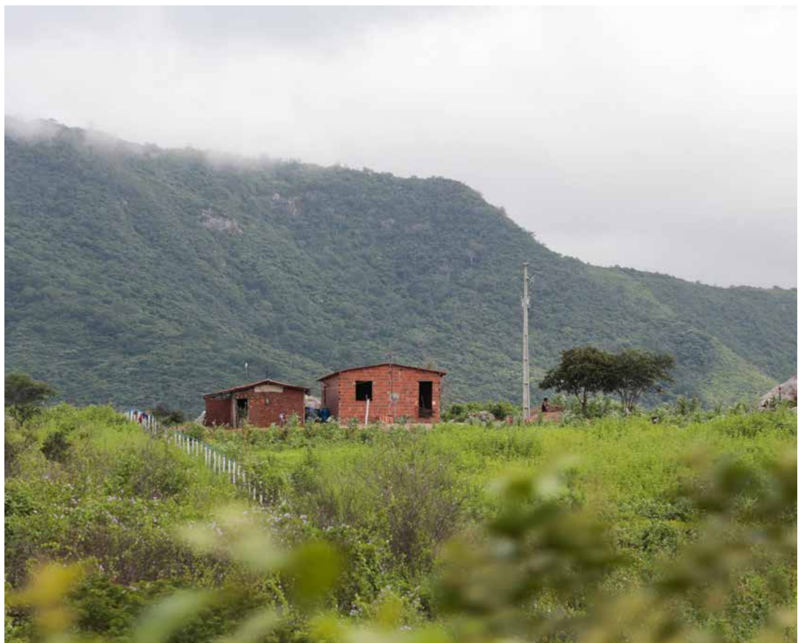
Dados do Ceará sobre chuvas são da Funceme

Também conforme a SRH, o panorama hídrico traz certa