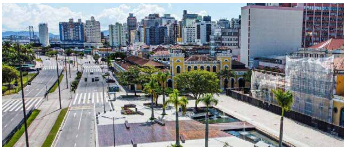
Surto em Florianópolis acontece há semanas

De acordo com a secretaria municipal, o agente causador do surto repentino ainda é desconhecido e os casos registrados