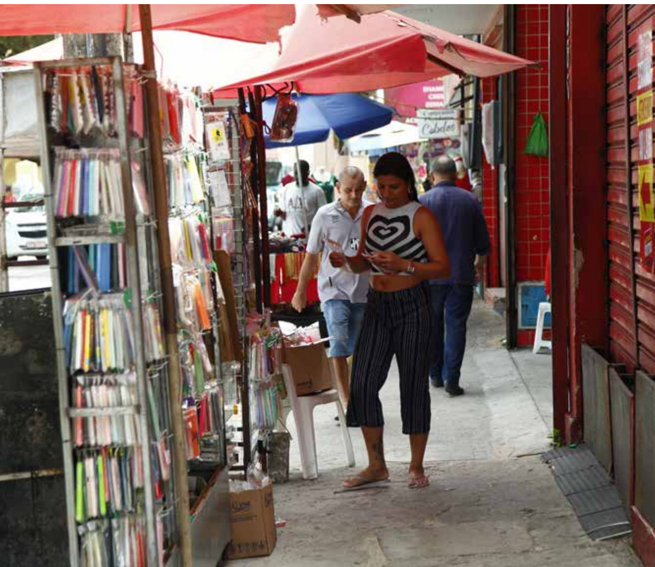
Cota será de R$ 66 para contribuição junto à Previdência Social

Aumento segue reajuste do salário mínimo, que passou de R$ 1.212 no ano passado para R$ 1.320 este ano, conforme estipulado pelo Orçamento