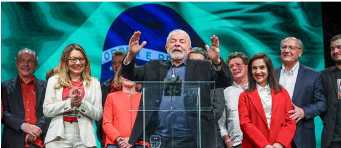
Lula, em fala a apoiadores

O candidato do PT à Presidência da República, Lula, disse na noite de ontem (2) a apoiadores na Avenida Paulista, que sua campanha "não vai ter folga". "Quero fazer um apelo aos partidos que nos apoiam que a gente não vai ter folga", disse. "Já a partir de amanhã (segunda-feira) vamos trabalhar muito em São Paulo para ajudar o (Fernando) Haddad (candidato do PT ao governo paulista) a derrotar o adversário dele", disse