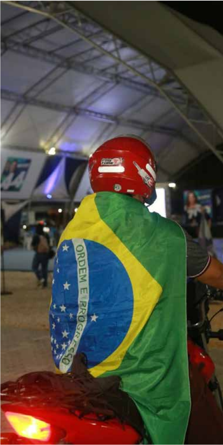
Eleitor de Wagner chegando ao comitê