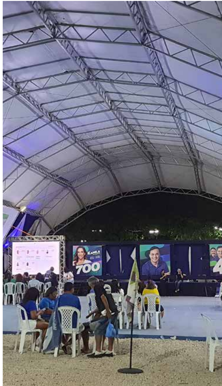
Capitão Wagner não foi ao comitê após o resultado

O “Quartel General – QG”, escritório de campanha do candidato ao governo do Ceará Capitão Wagner (União Brasil) foi invadido por um clima de tristeza e insatisfação na noite de ontem (2). Grande favorito no início da corrida eleitoral, o deputado federal assistiu o petista Elmano de Freitas vencer em primeiro turno com mais de 53% dos votos.