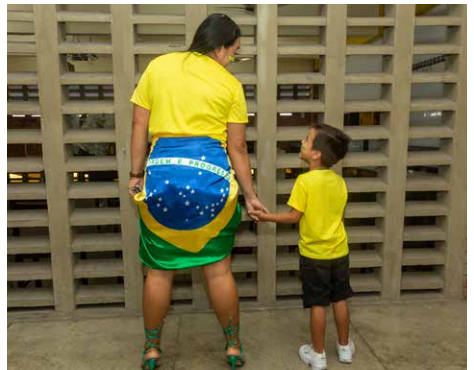
Eleitora de Jair Bolsonaro (PL) ao votar no Ari de Sá da Washington Soares