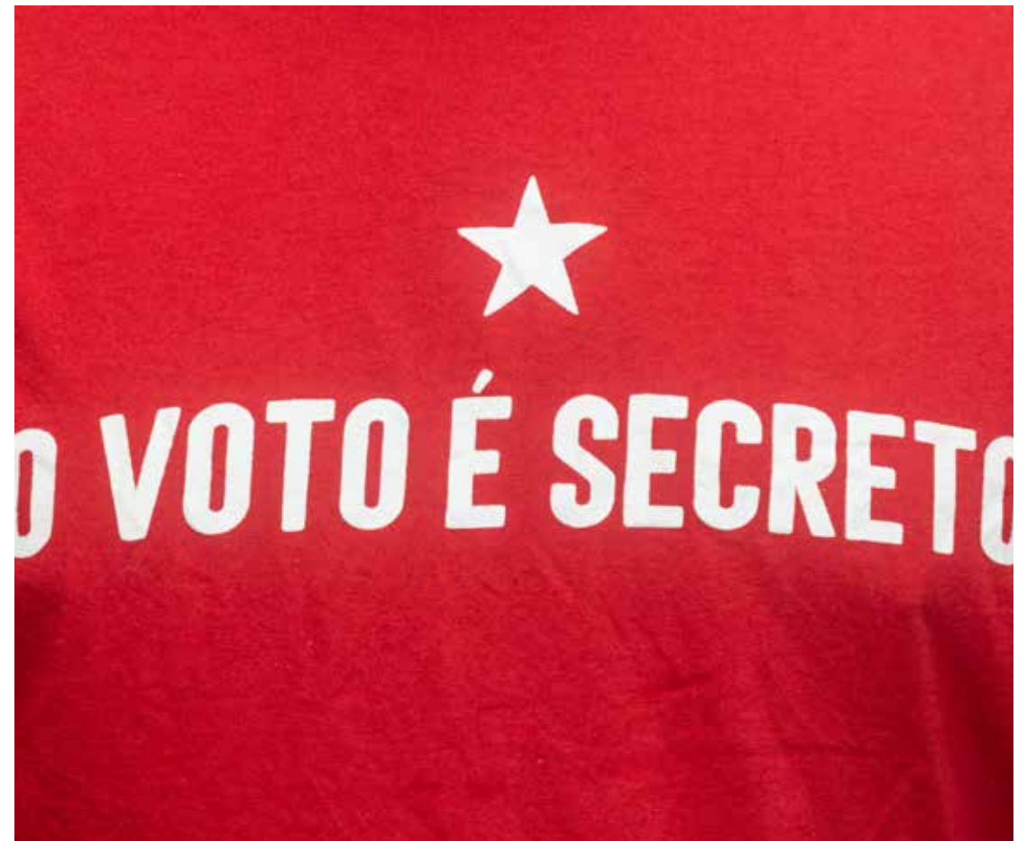
Eleitor vai com blusa em referência a Lula para a votação