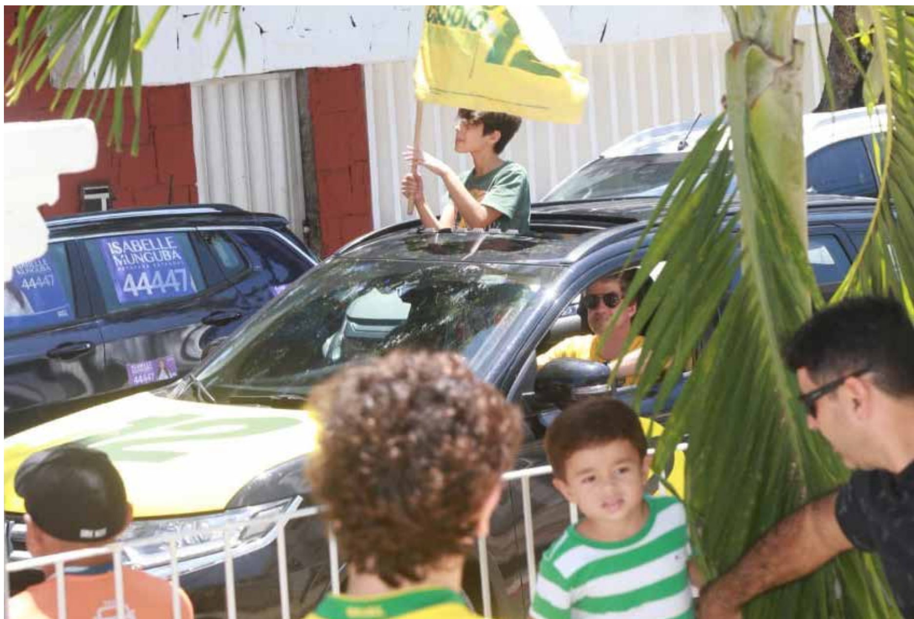
Clima foi de pacifismo em todo o Estado

A Polícia Militar do Ceará (PMCE) empregou 10.300 mulheres e homens durante o primeiro turno, resultado do reforço de sete mil policiais que se juntaram aos 3.300 do policiamento ordinário. A distribuição opera-