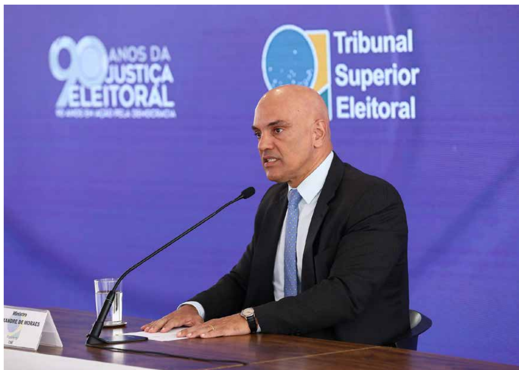
Alexandre de Moraes, presidente do TSE

O teste de integridade das urnas eletrônicas realizados pela Justiça Eleitoral ontem (20) indica correspondência entre os resultados dos equipamentos examinados e os votos depositados em ambiente controlado. Segundo servidores que acompanham o processo no Tribunal Superior Eleitoral (TSE), o teste não apontou incoerências, o que comprova a segurança do pleito e garantia de