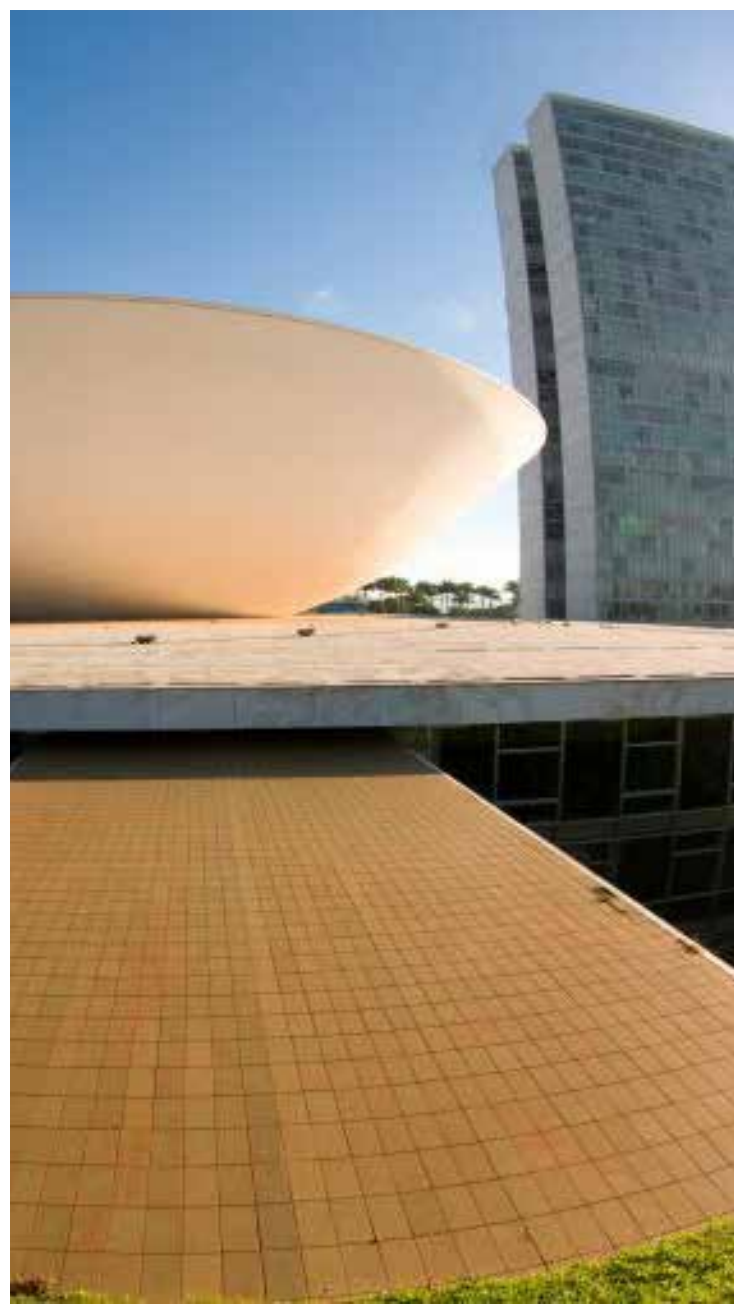
Câmara dos Deputados, em Brasília