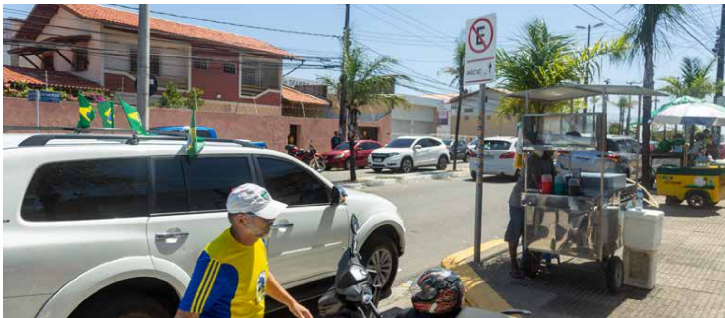
Ari de Sá Cavalcante da avenida Washington Soares, maior colégio eleitoral do Ceará

cional da tropa ocorreu conforme a necessidade de cada região, ampliando a área de cobertura na Capital, Região Metropolitana de Fortaleza e Interior do Estado. Os policiais militares atuaram de maneira integrada com órgãos parceiros, realizando trabalhos ostensivos para fiscalizar e coibir possíveis crimes durante o primeiro turno. Já a PCCE contou com 1.171 policiais civis e a ampliação do funcionamento das delegacias. Os municípios do Interior e da RMF,