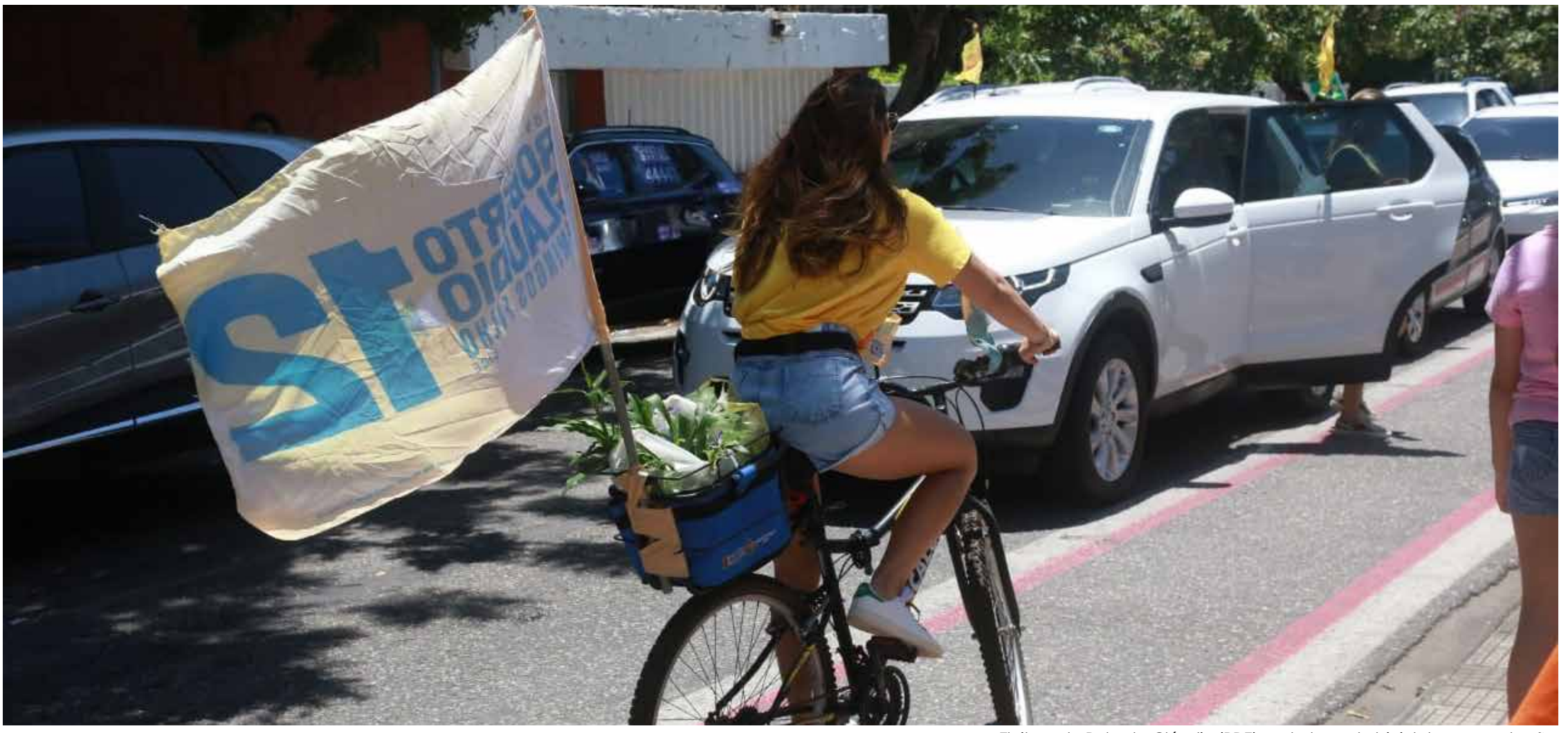
Eleitora de Roberto Cláudio (PDT) se desloca de bicicleta para votação