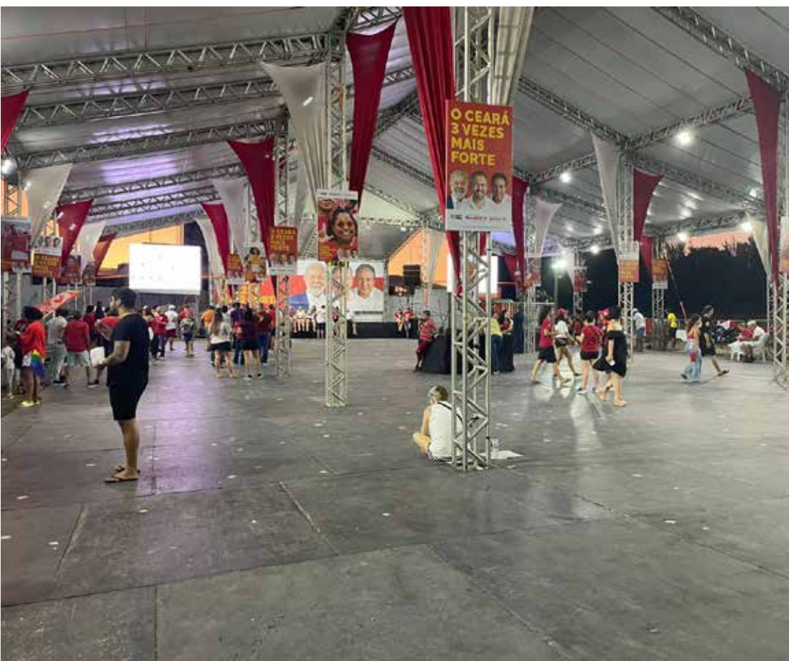
Comitê de Elmano de Freitas (PT) no começo da noite