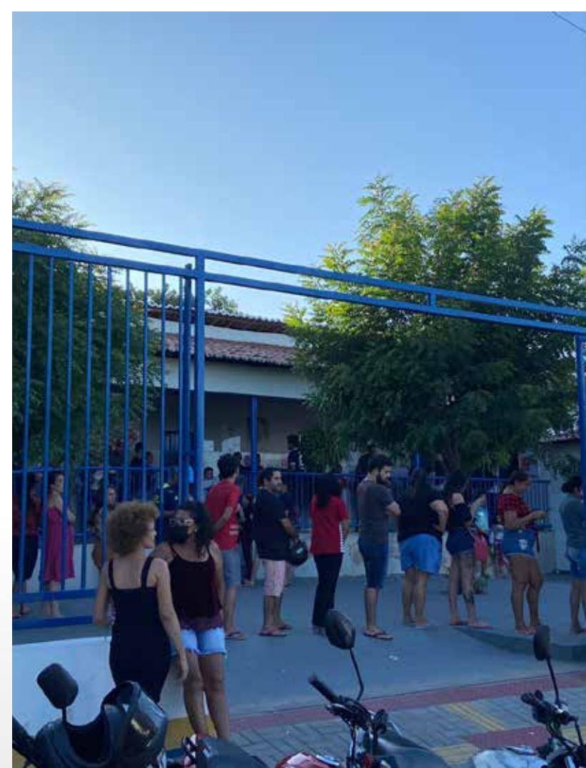
Escola Felipe Neri, bairro Limoeiro, Juazeiro do Norte