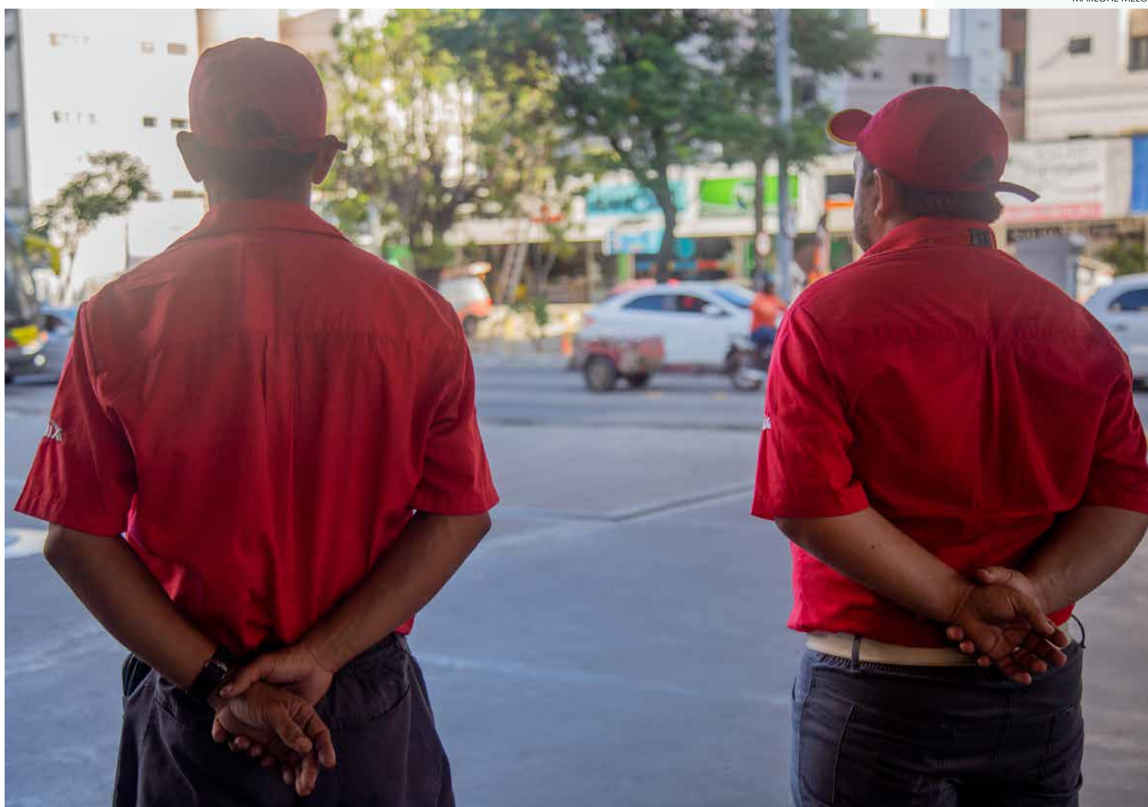
Redução dos preços de combustíveis ocorreu em meados de julho deste ano