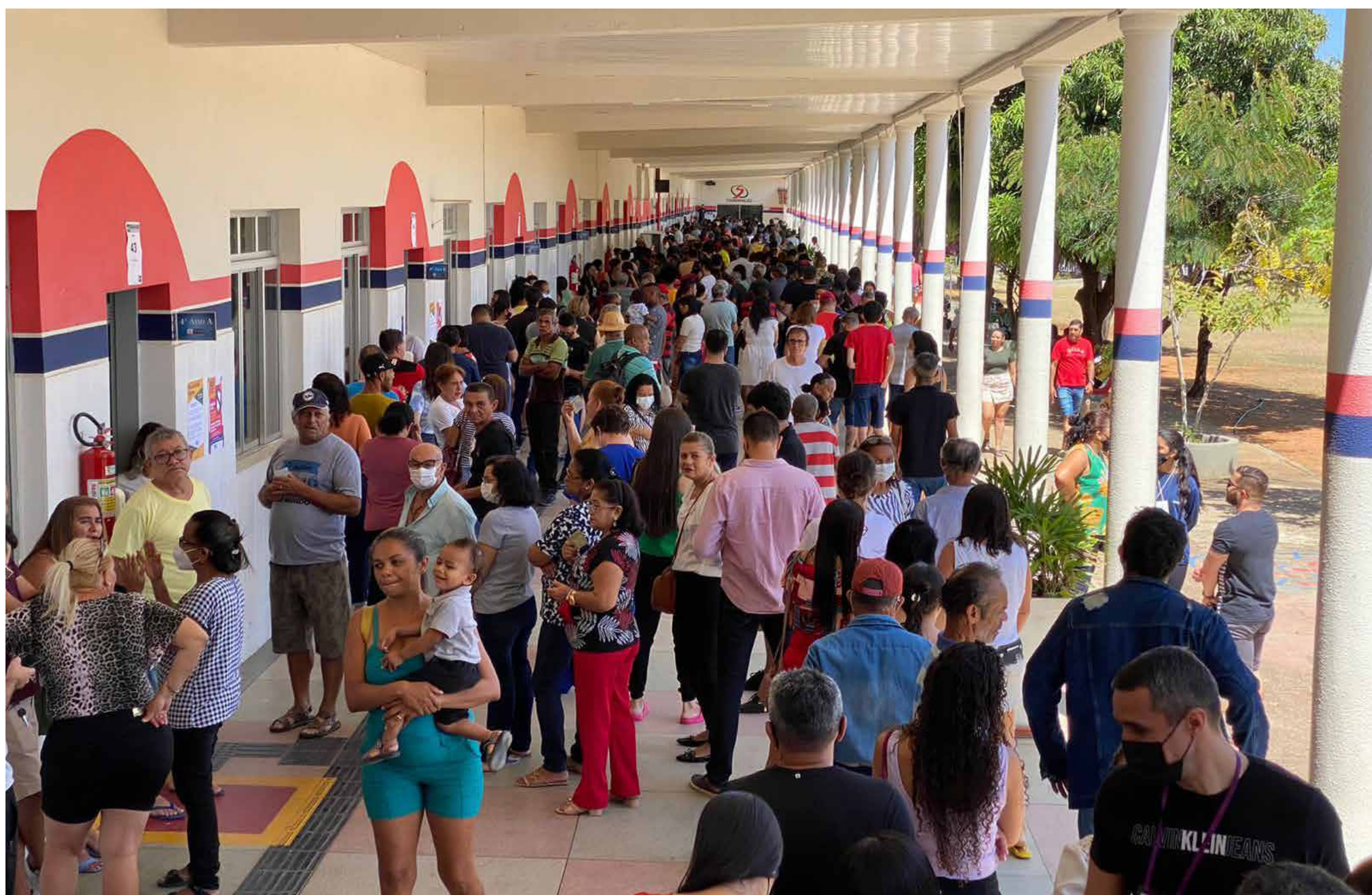
Universidade Regional do Cariri - Campus Pimenta

FERNANDA ALVES ESPECIAL PARA OPINIÃO CE contato.@opiniaoce.com.br