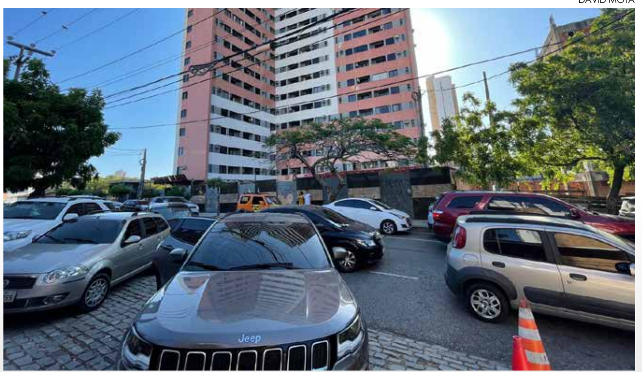
Fluxo de veículos intenso no Colégio Antares da Praia de Iracema