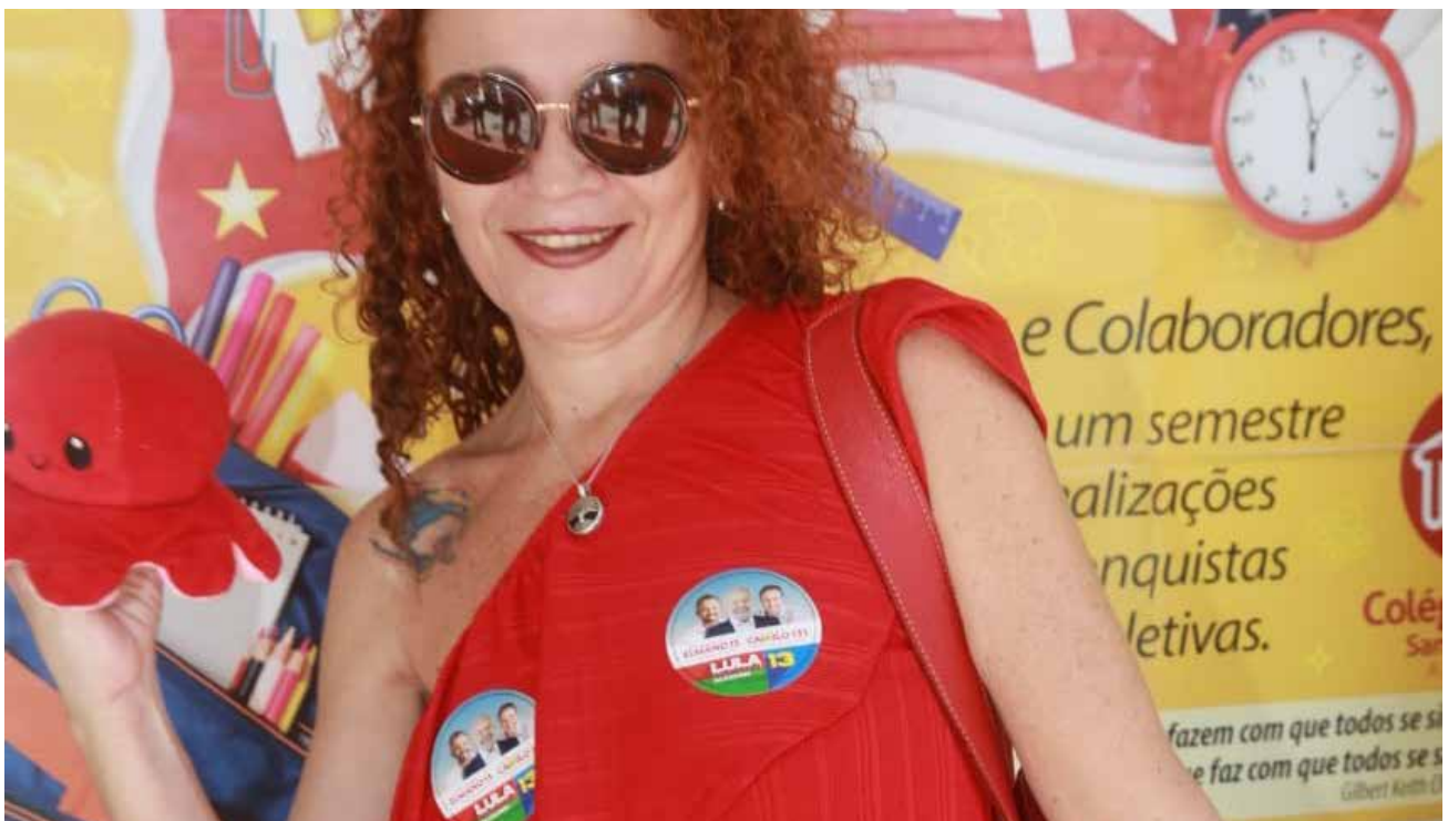
Eleitora de Lula, Elmano de Freitas e Camilo Santana, todos do PT