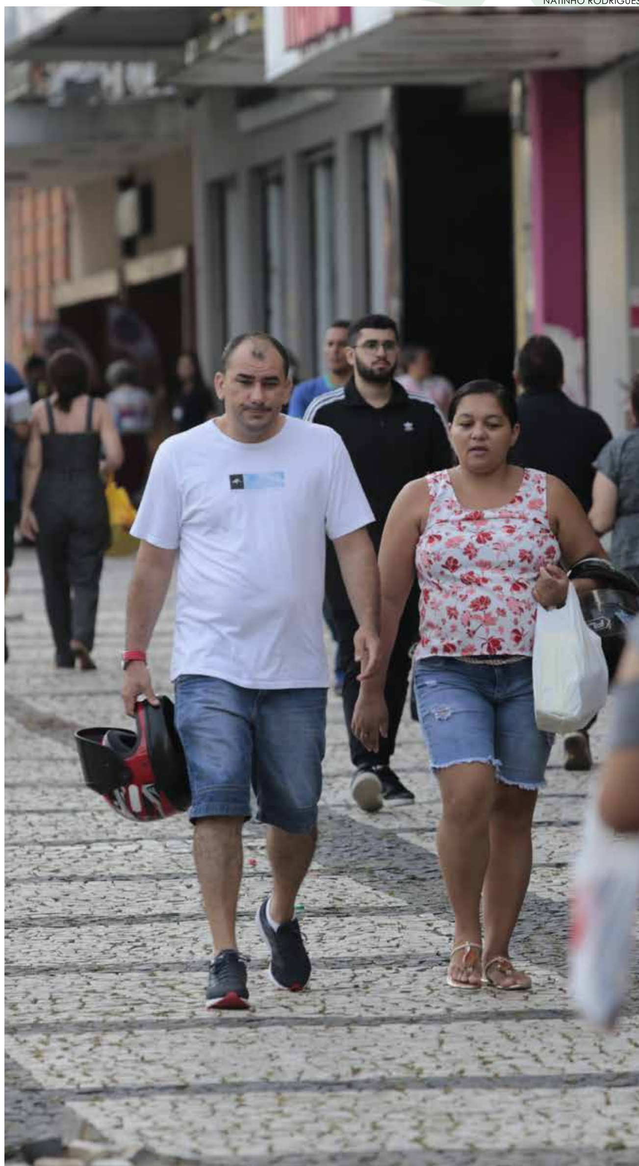
Centro foi um dos bairros avaliados

Procon optou por coletar preços de alguns produtos, tendo como especificação a marca, independentemente do modelo do item