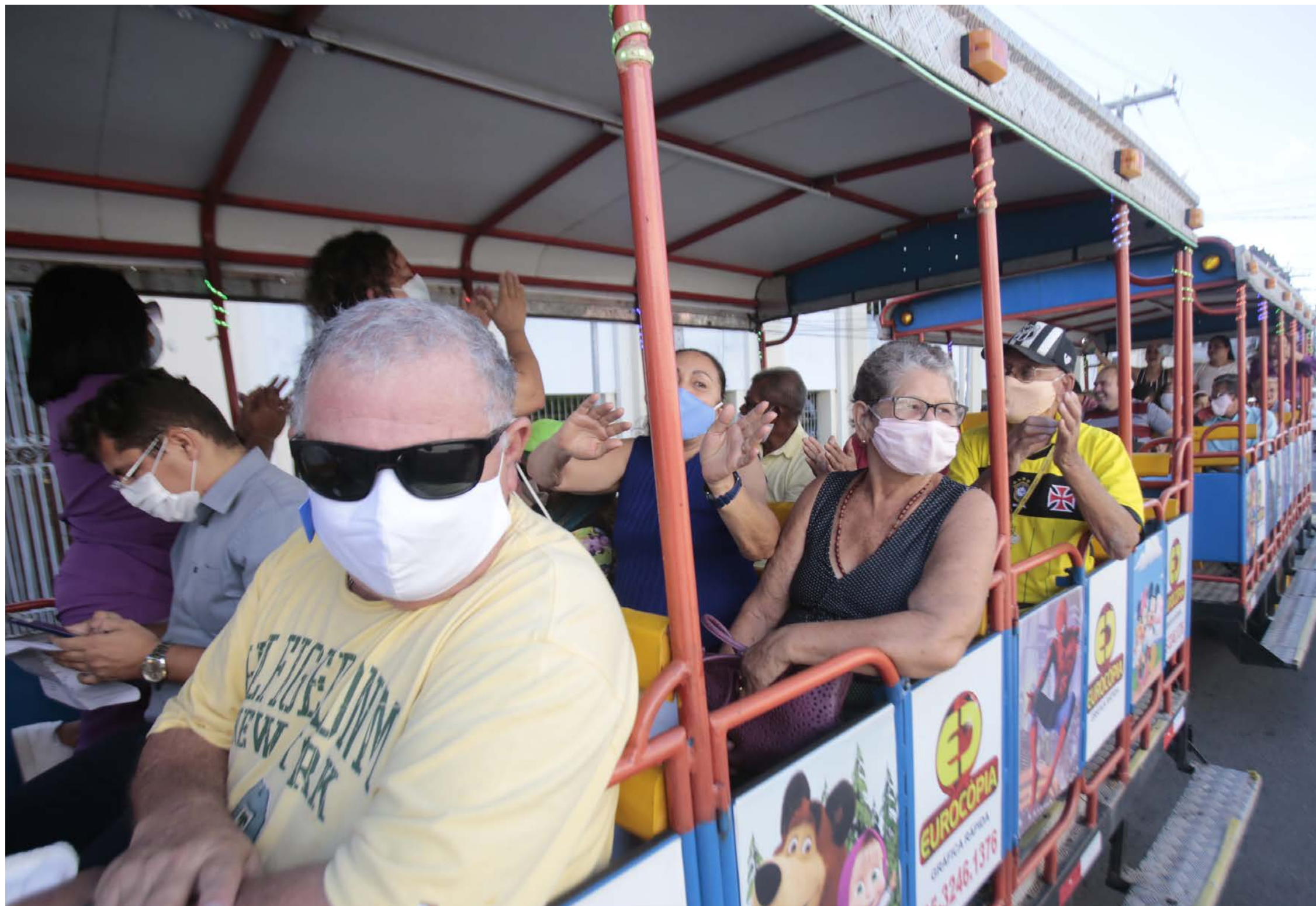
Atividade levou alegria a idosos do Lar Torres de Melo