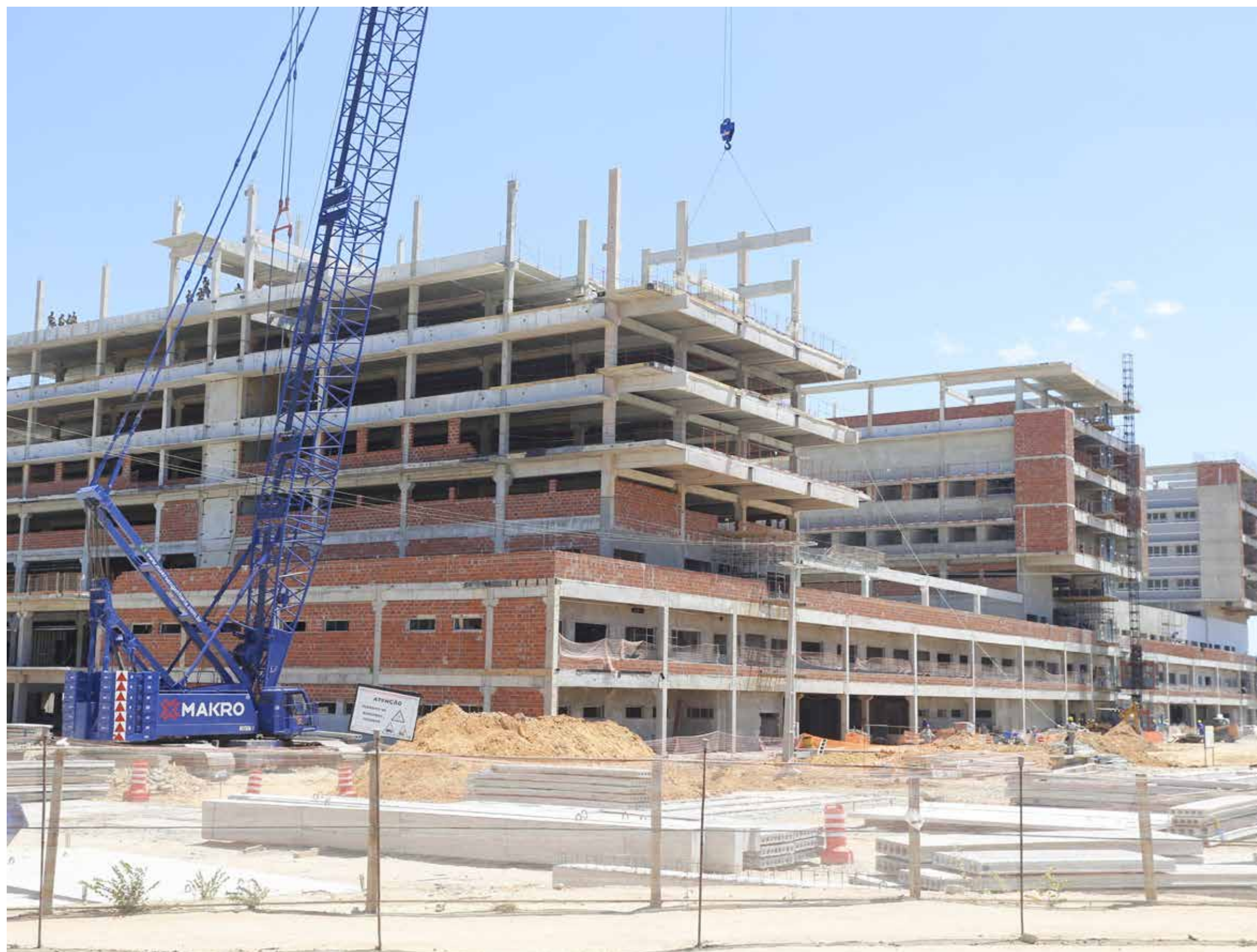
Unidade está localizada no campus do bairro Itaperi

Com aproximadamente R$ 300 milhões em investimento, a obra do Hospital Universitário do Ceará, localizado no bairro Itaperi, em Fortaleza, alcançou 72% de construção concluída. A previsão é de que a primeira das três torres do equipamento seja concluída até o fim deste ano, com todas as instalações ficando prontas até a segunda metade de 2023, afirma a gestão estadual.