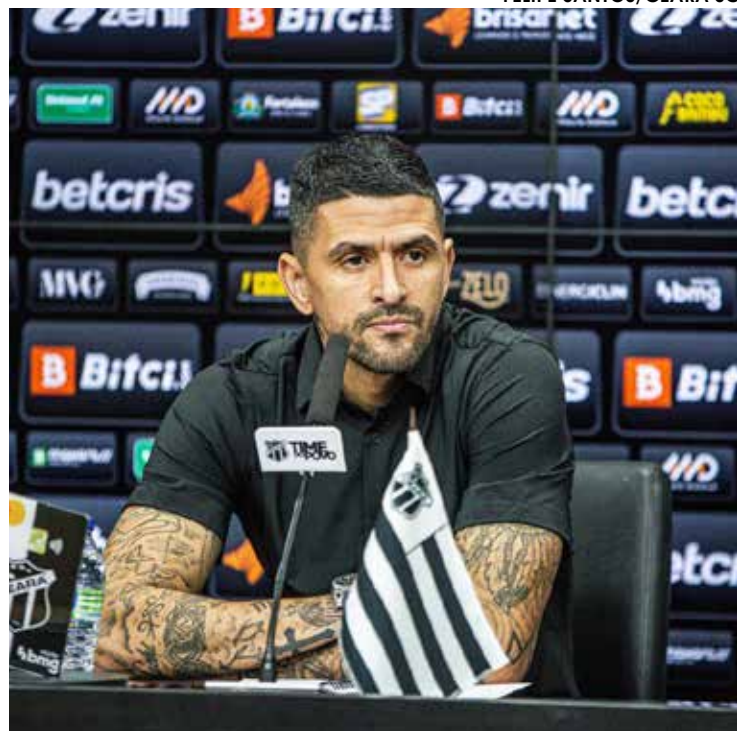
Coletiva do novo treinador do Vovô ocorreu ontem (29)