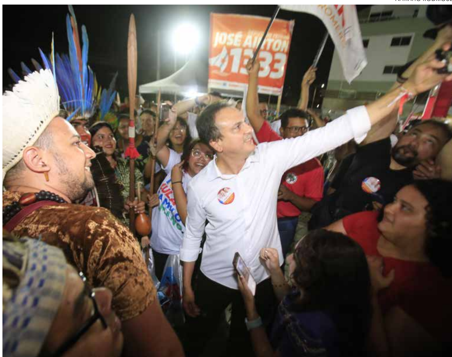
Camilo Santana (PT), ex-governador do Ceará

O ex-governador do Ceará e candidato ao Senado Federal Camilo Santana (PT) negou, em sabatina realizada ontem (29), que tenha recebido um suposto convite do ex-presidente Lula (PT) para assumir algum ministério em caso de vitória do petista nas eleições presidenciais deste ano. A informação de que Camilo teria a promessa foi divulgada semanas antes por um de seus principais ex-aliados, Ciro Gomes (PDT), que se disse "traído" pelo ex-gestor cearense.