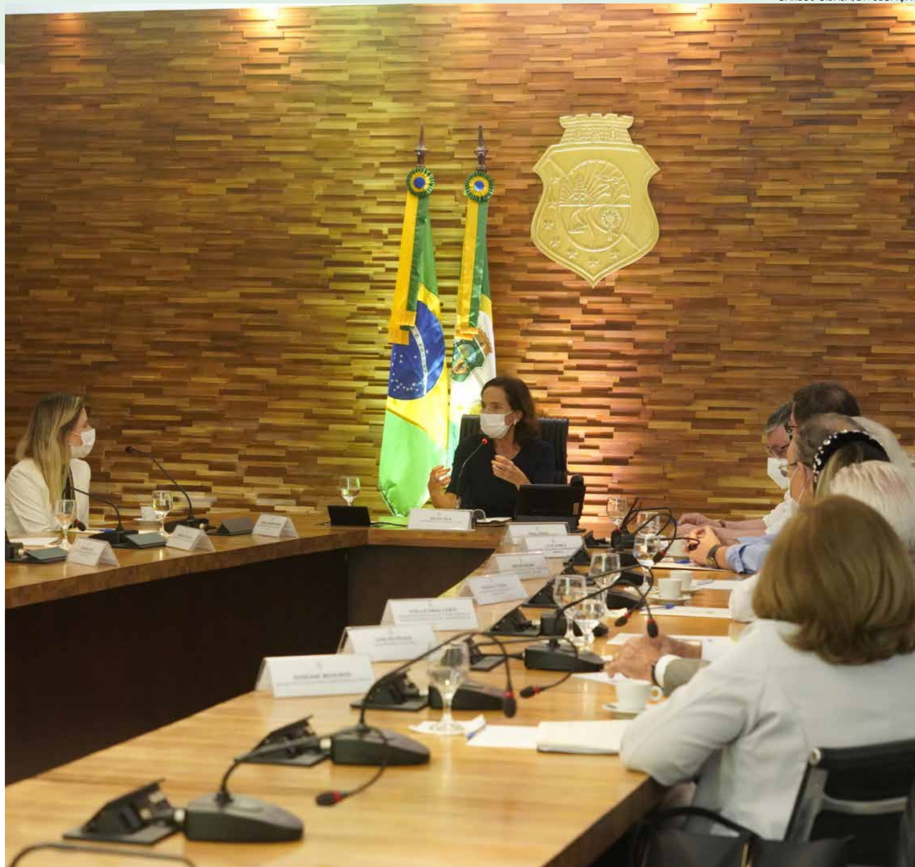
Reunião em que o documento foi assinado