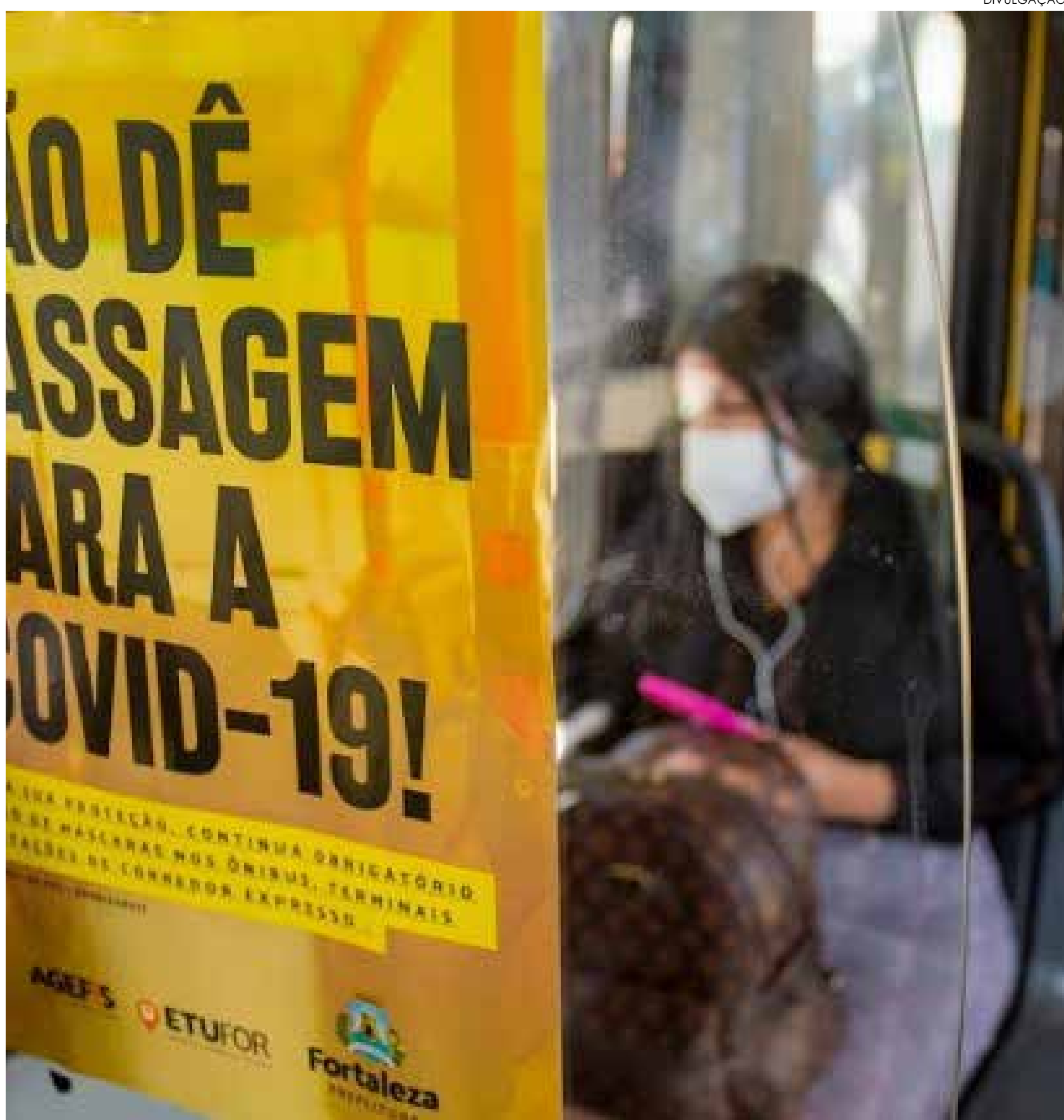
Uso do acessório é obrigatório no transporte coletivo