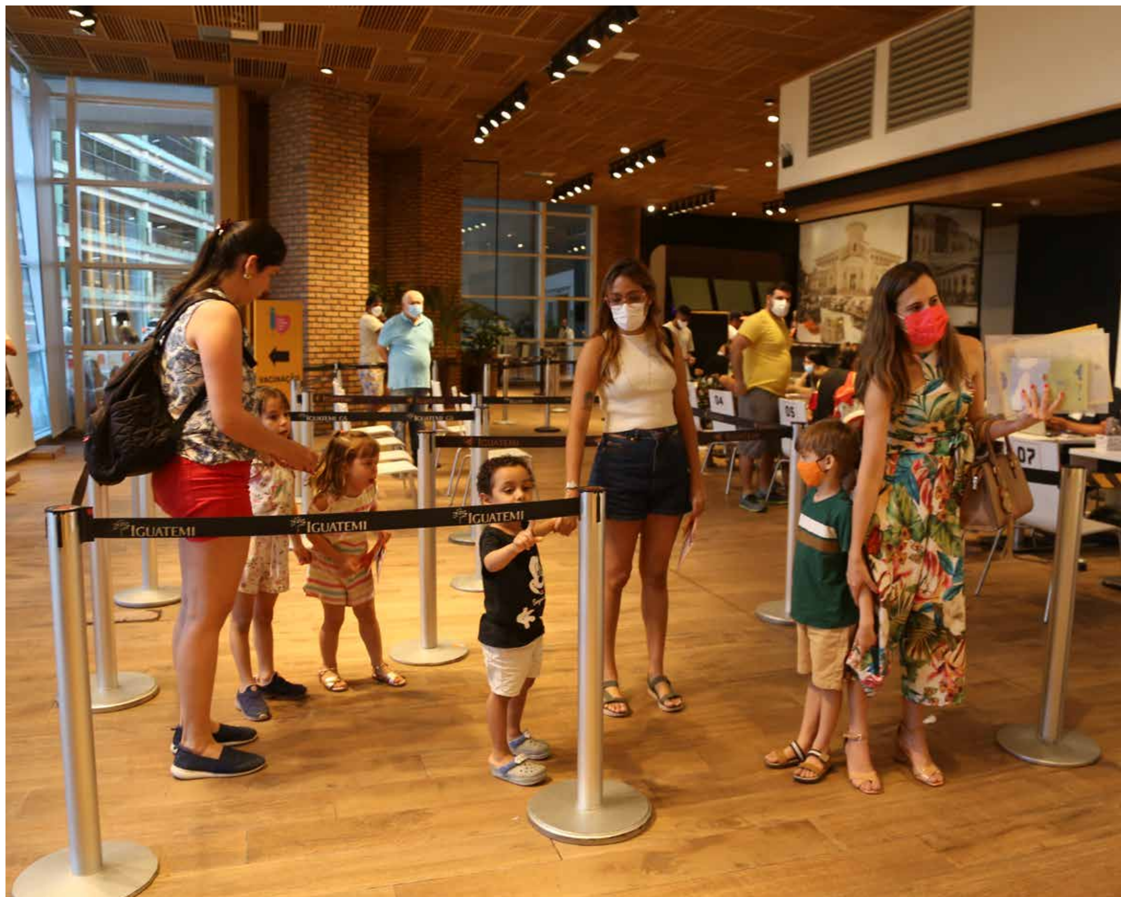
Vacinação infantil está ocorrendo em shoppings da Capital