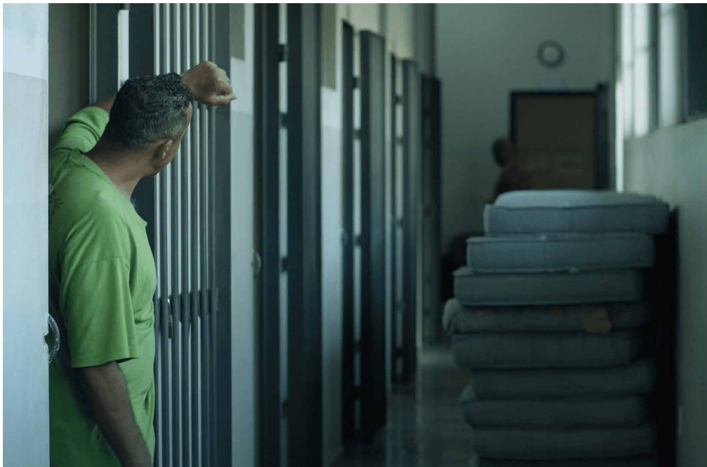
Documentário retrata recortes do sistema prisional