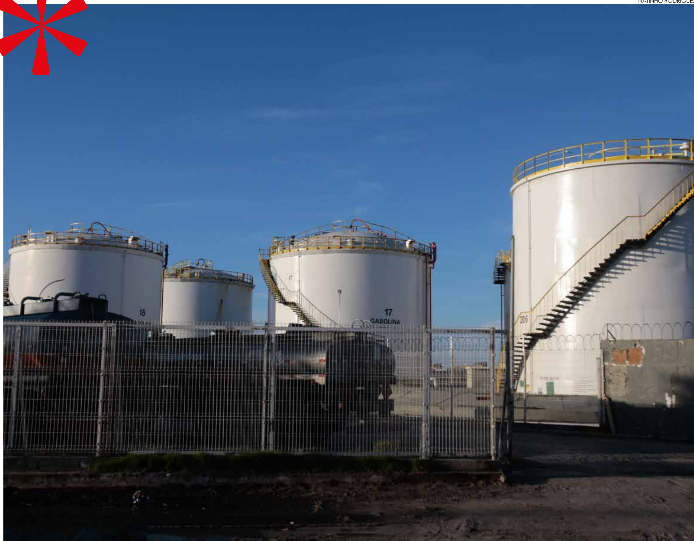
Venda da refinaria com sede em Fortaleza foi realizada ao fim do mês passado

No fim de maio último, Petrobras anunciou acordo com a Grepar Participações para a venda da Lubnor, refinaria com sede em Fortaleza, e de ativos de logística associados