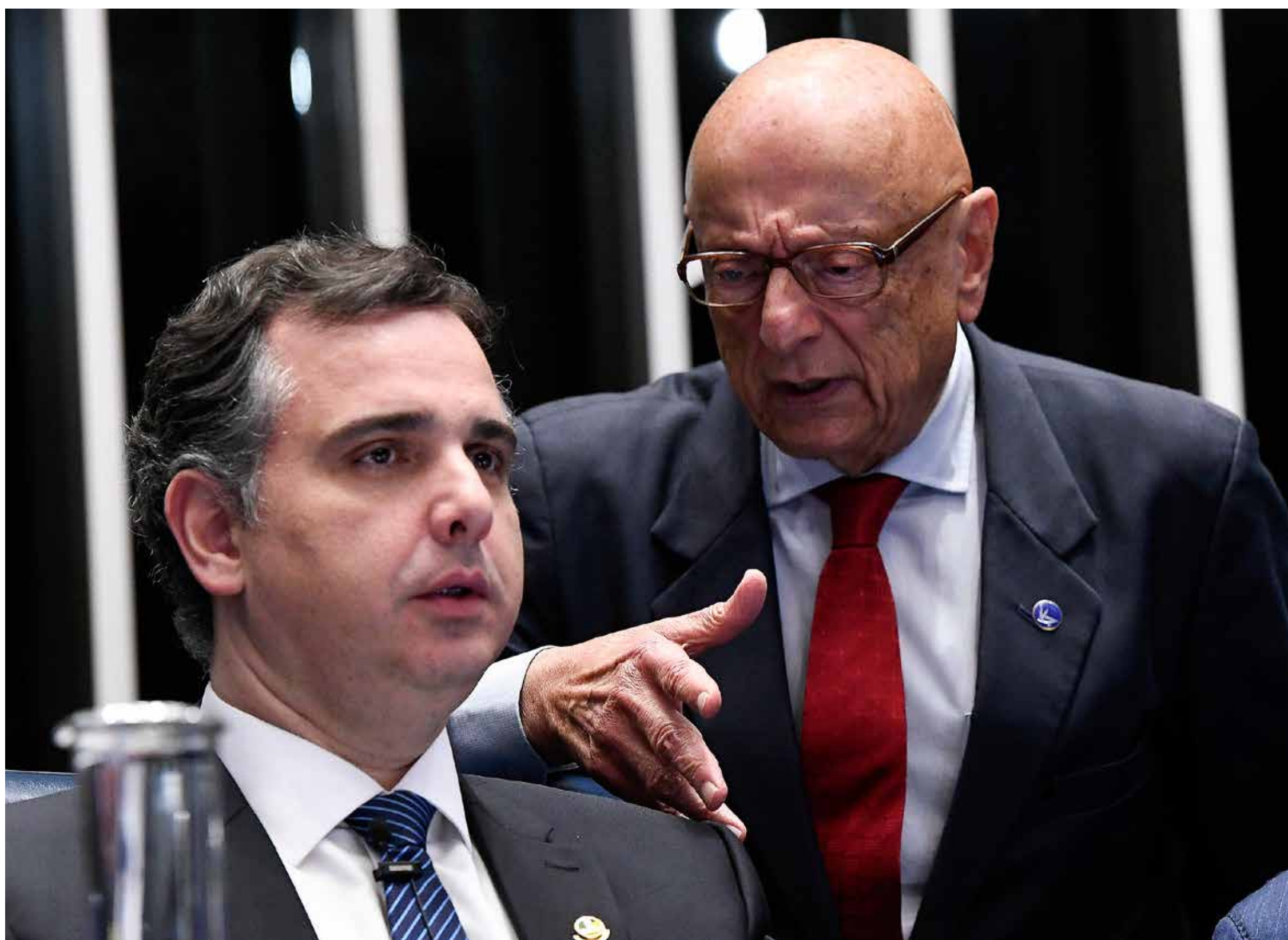
Decisão cabe a Rodrigo Pacheco (sentado), presidente do Senado Federal