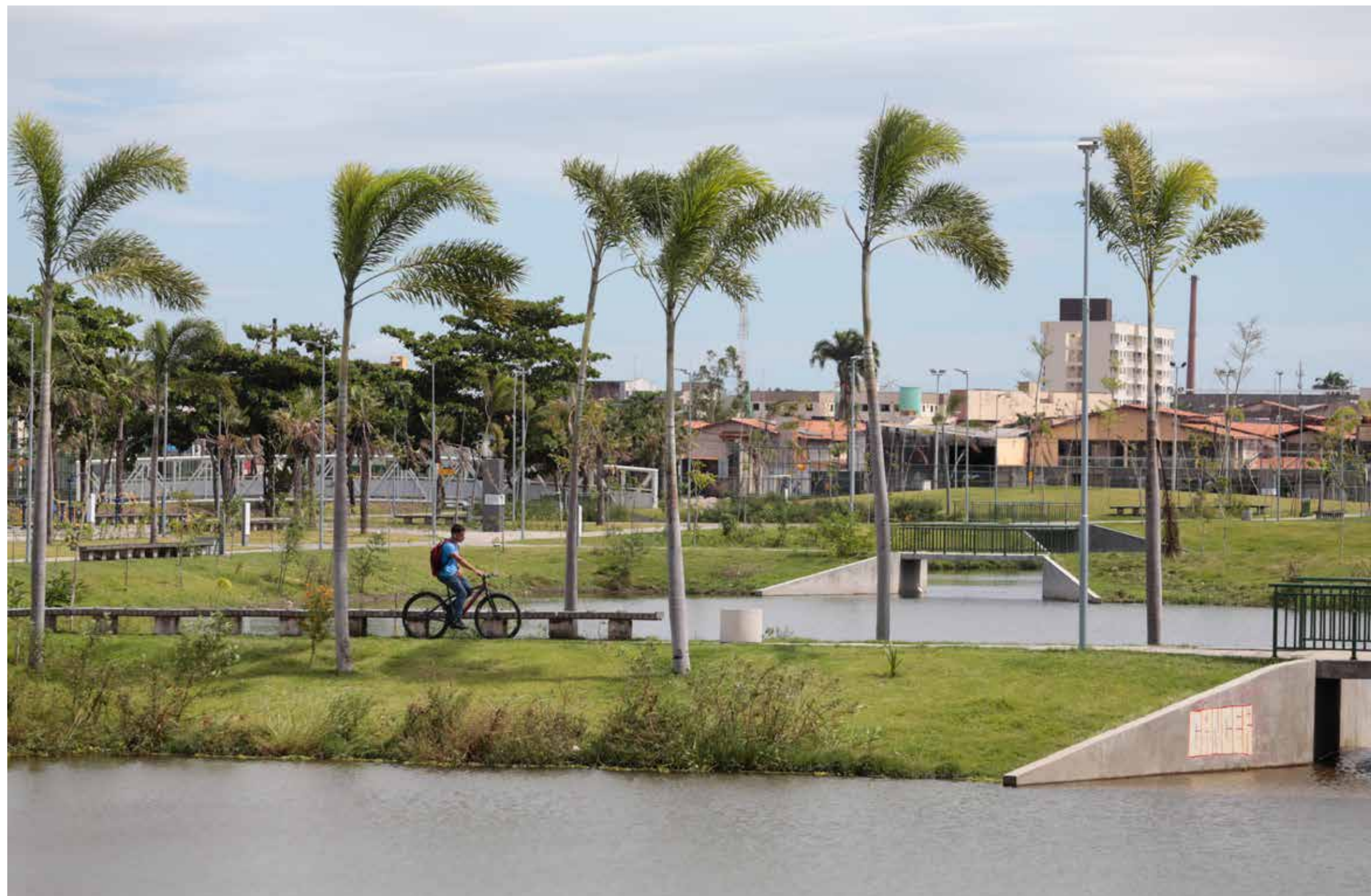
Parque Rachel de Queiroz é um dos 24 parques urbanos de Fortaleza

GIOVANA BRITO ESPECIAL PARA OPINIÃO CE giovana.brito@opinioce.com.br