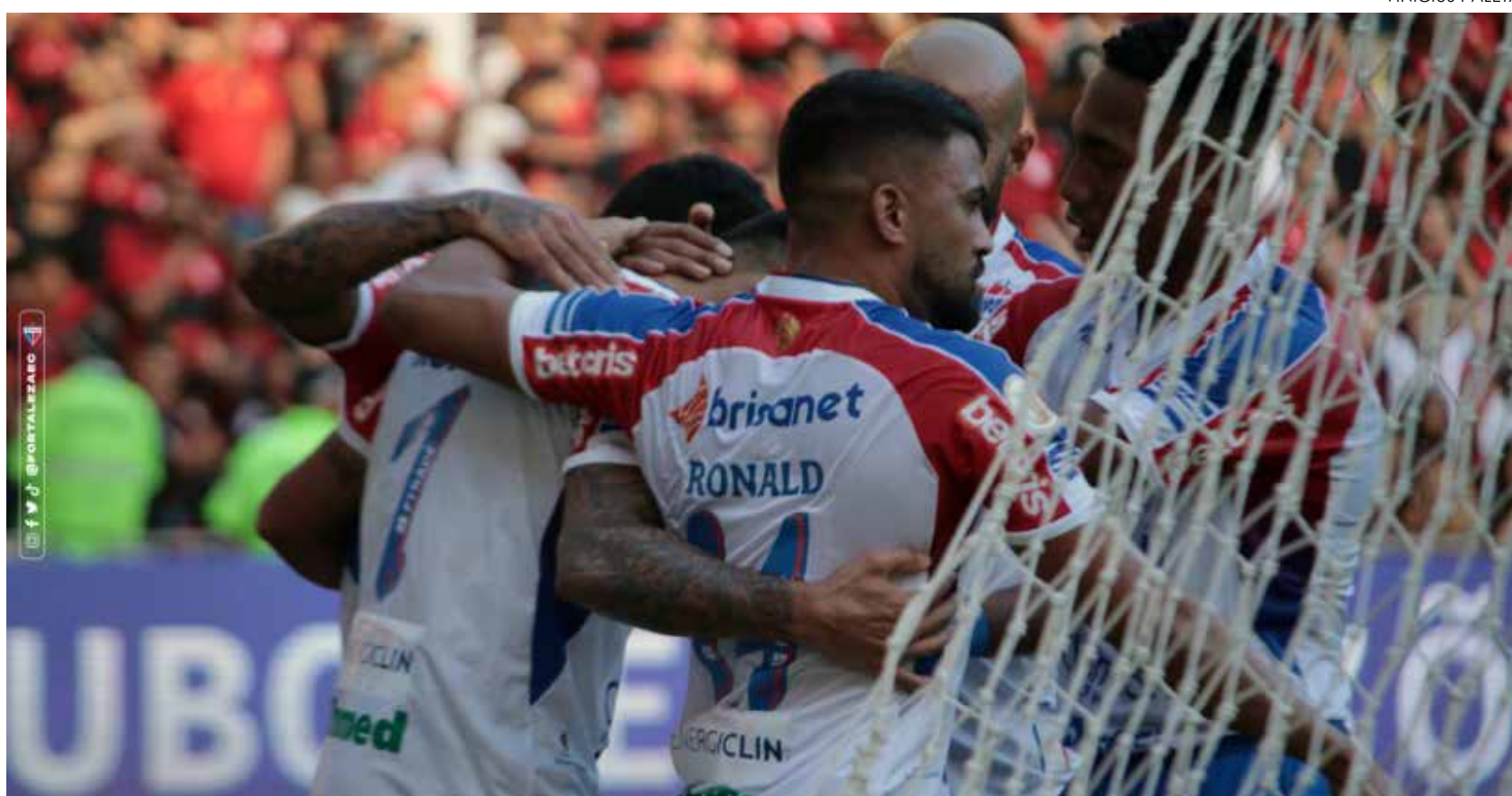
Equipe venceu o Flamengo por 2 a 1

Depois disso, as equipes seguiam com ataques nos dois lados, mas sem finalizações a gol.