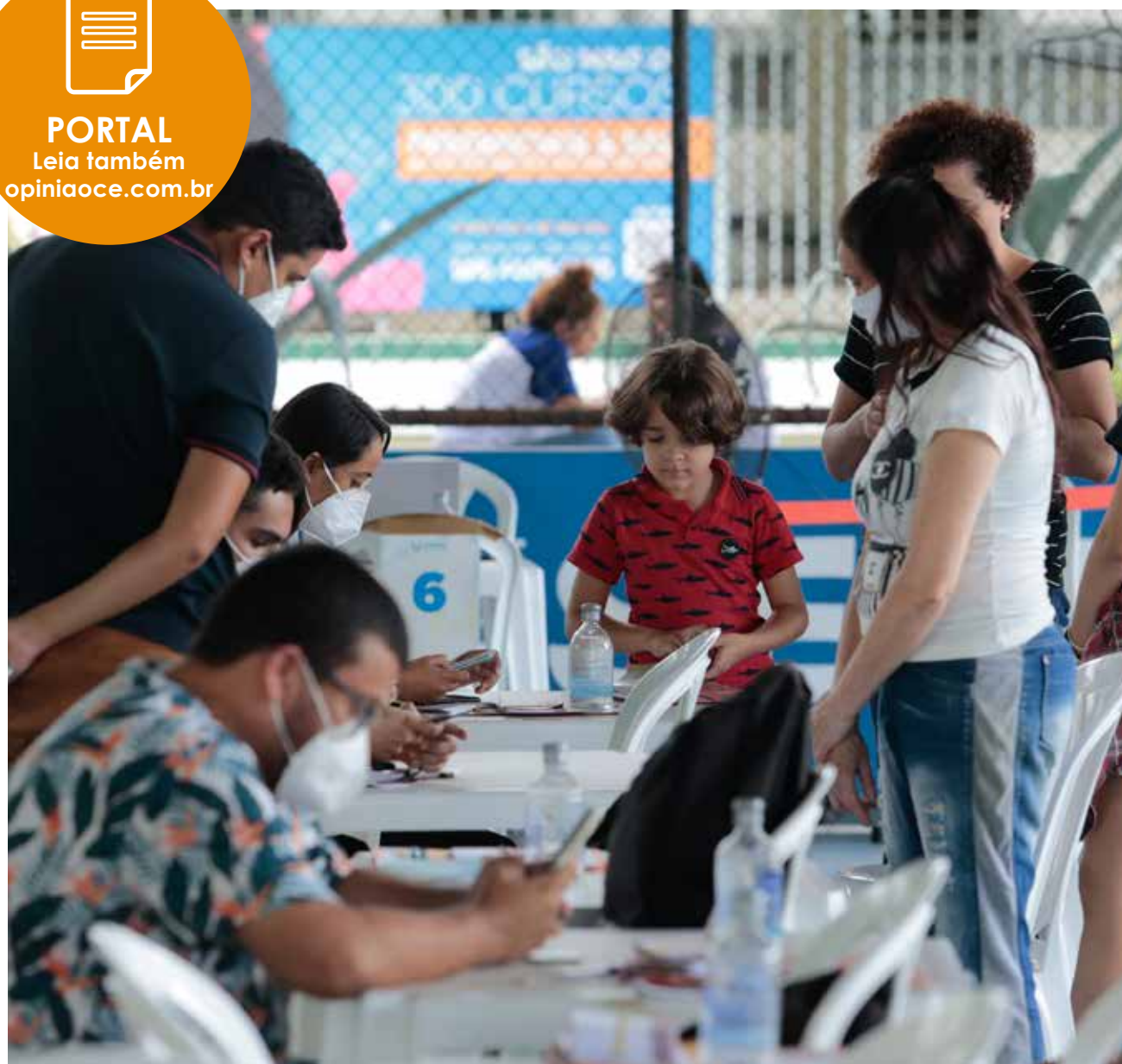
Vacinação será ofertada em diversos pontos de imunização, a exemplo do Sesi Parangaba

Uso de máscara em ambientes fechados continua valendo, na tentativa de conter novo surto de covid-19, registrado em todo Brasil