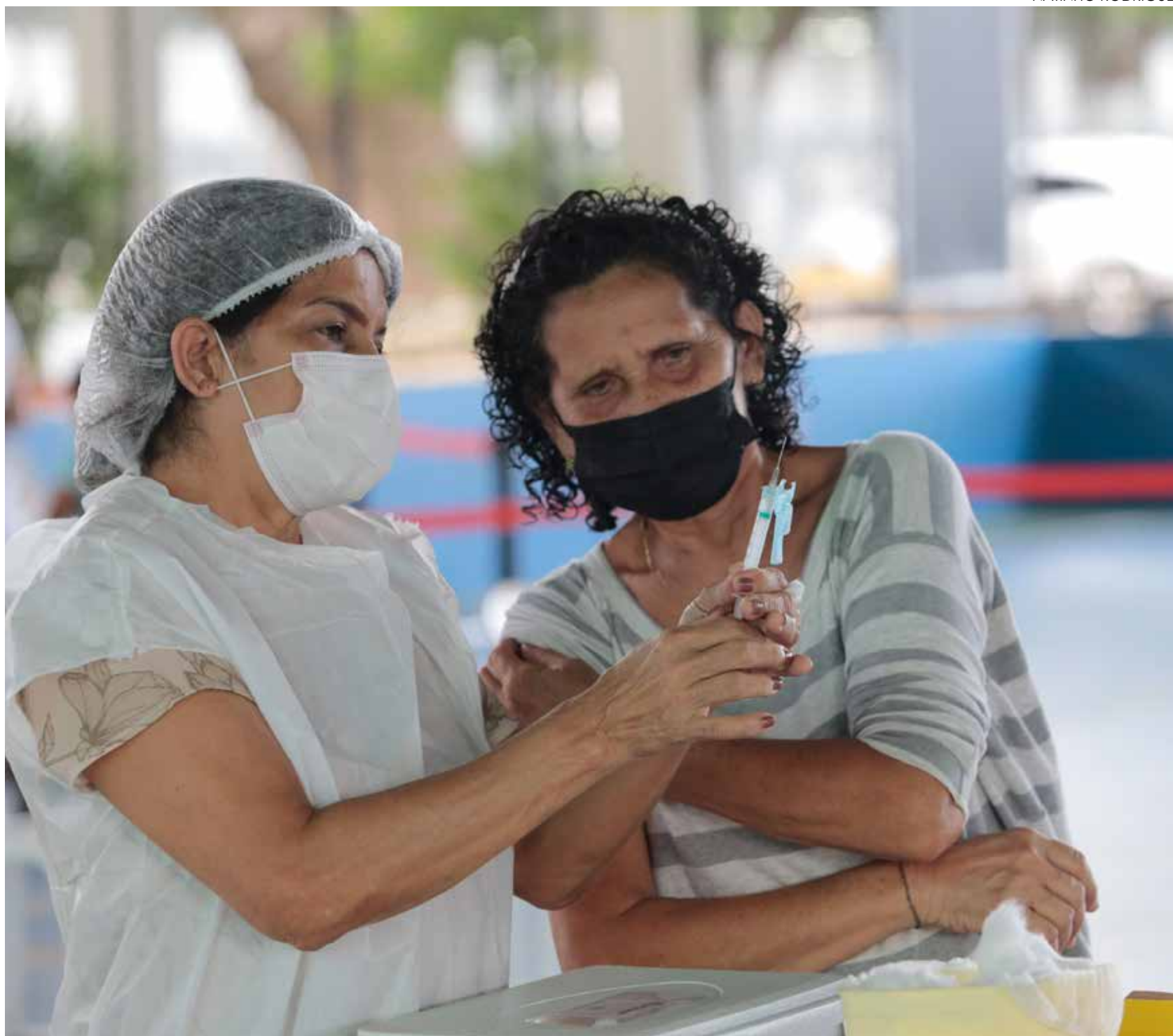
FORTALEZA INICIA HOJE AMPLIAÇÃO DA APLICAÇÃO DE D4 CONTRA COVID-19 P.6