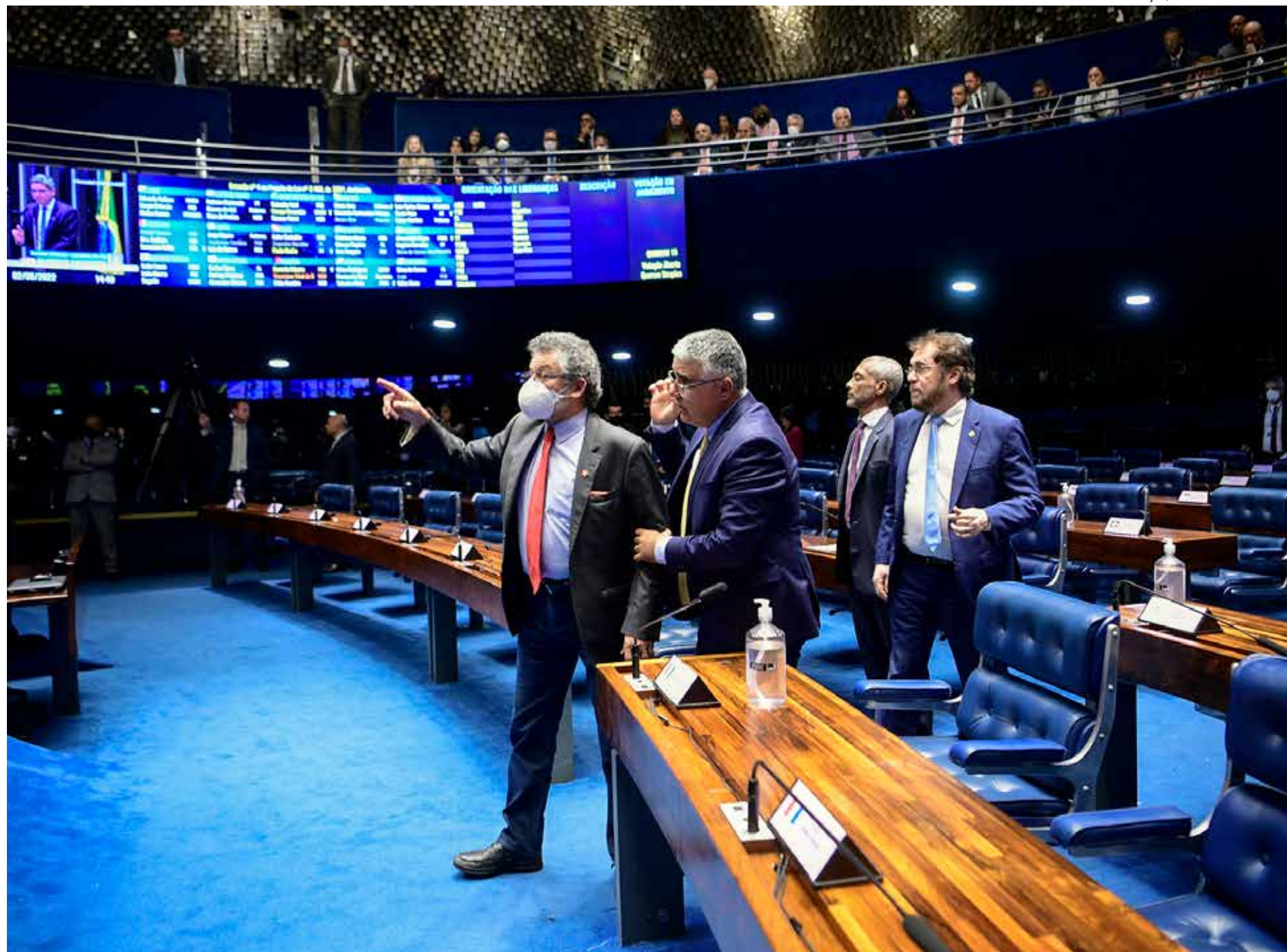
Propostas polêmicas, em geral, não ganham corpo entre senadores da República