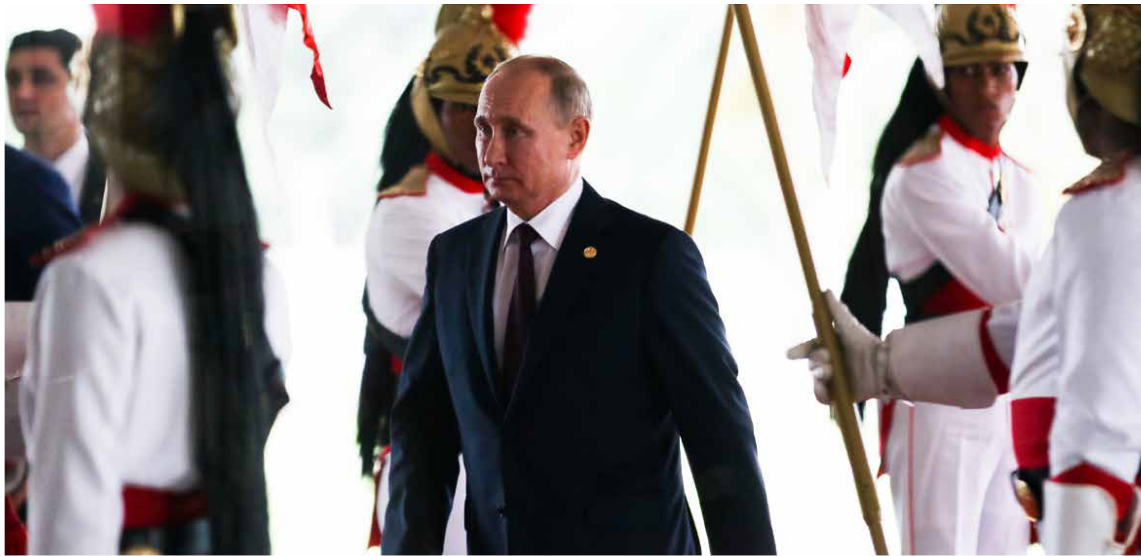
Presidente da Rússia, Vladimir Putin