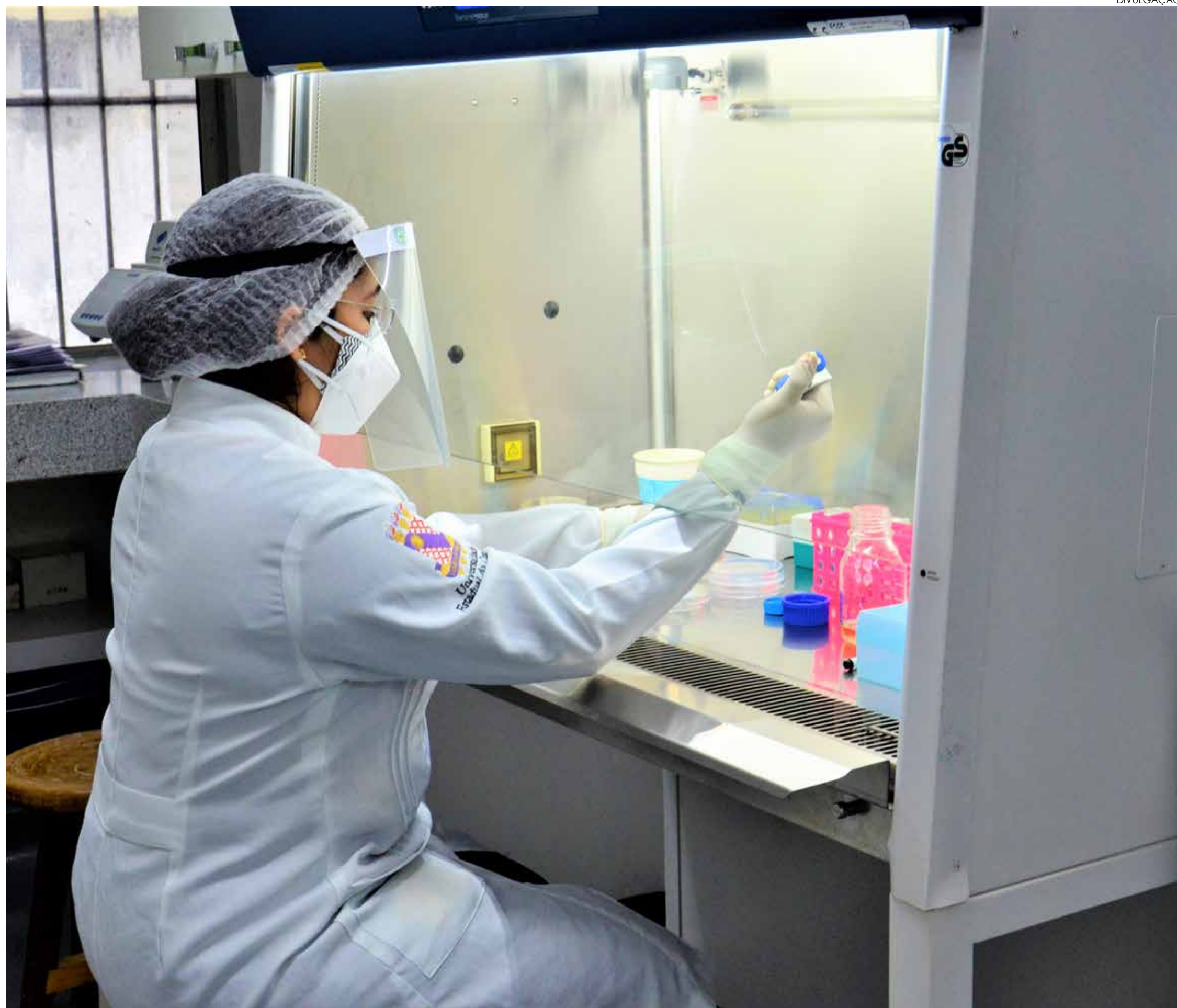
Laboratório da Universidade Estadual do Ceará