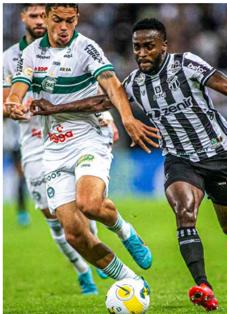
Time perdeu e terminou a noite em 15º

A vantagem, porém, durou só até aos 40 minutos. Após lançamento do campo de defesa do Coritiba, a defesa do Ceará não conseguiu afastar e Adrián Martínez ficou com a bola. Depois disso, o atacante do Coxa ainda contou com o escorregão de Messias para ficar de frente com João Ricardo e empatar a partida. O próximo jogo do Vovô está marcado para a próxima quarta-feira, 8, quando enfrenta o América-MG no Independência. Já o Coritiba joga um dia depois, na próxima quinta-feira (9), para enfrentar o São Paulo no estádio Couto Pereira. (Priscila Baima)