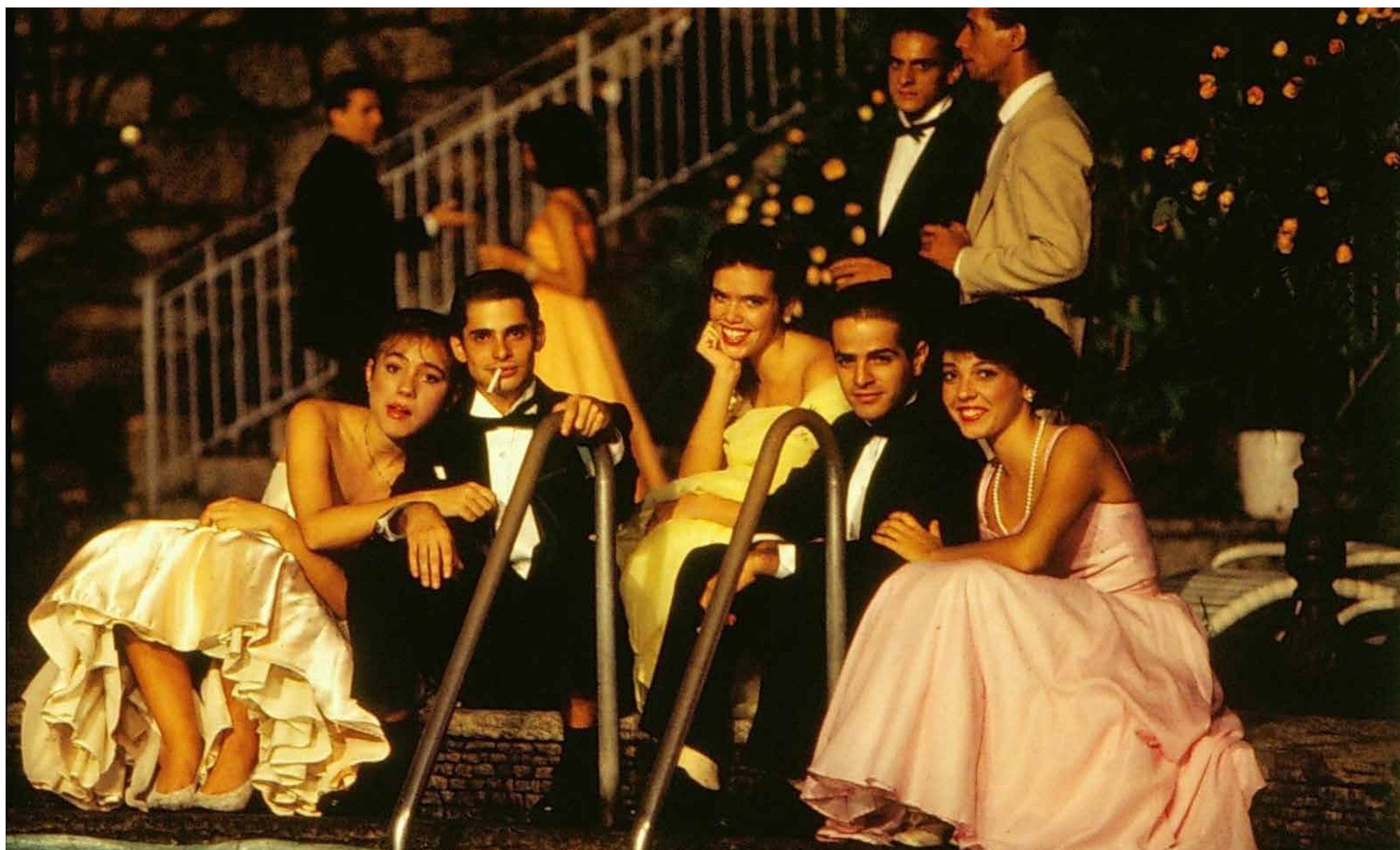
Minissérie está disponível na GloboPlay

Ambientada dos anos 1950 a 1960, “Anos Dourados”, minissérie da TV Globo, estreou na plataforma de streaming GloboPlay, acessível a assinantes