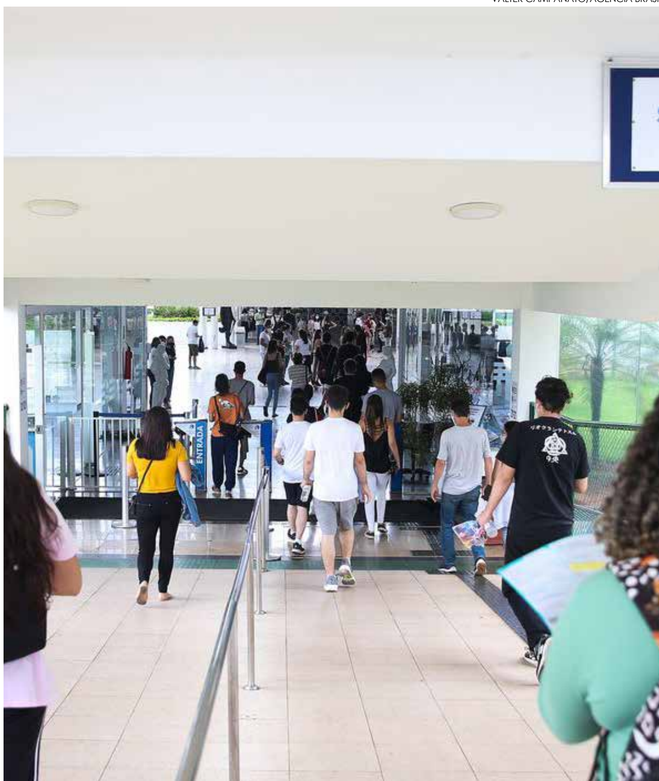
Enem é a principal porta de entrada do Ensino Médio no Brasil

Pagamento da taxa de inscrição também poderá ser feito por meio do tradicional boleto, que deve ser gerado na Página do Participante