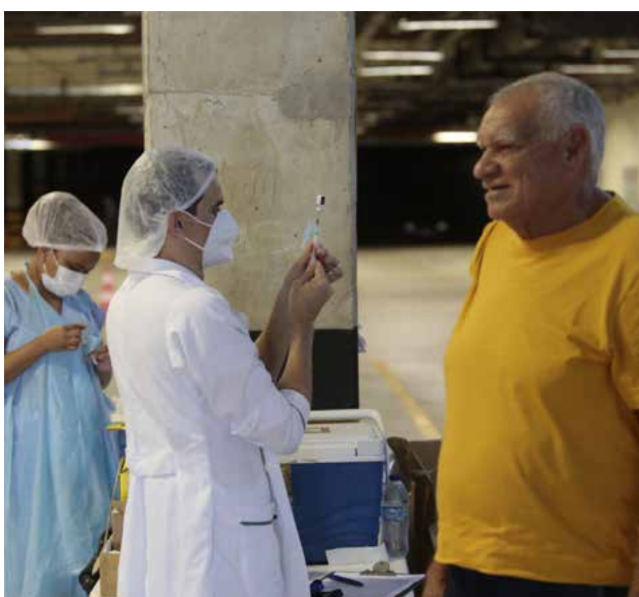
Idosos podem tomar no patio ou estacionamento

Ainda segundo o Ministério da Saúde, também podem ser usadas as vacinas desenvolvidas pela AstraZeneca ou Janssen, de maneira alternativa, independentemente da dose da aplicação anterior. Ainda conforme o órgão, estudos indicam que a estratégia aumenta em mais de cinco vezes a imunidade do paciente, uma semana após a aplicação.