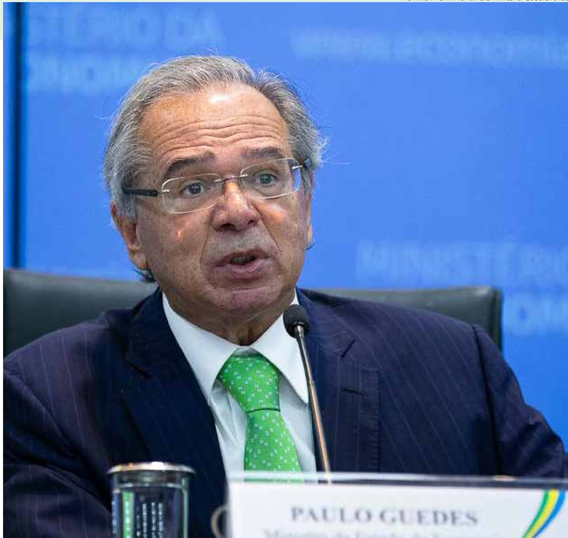
Ministro da Economia, Guedes participou de evento de apresentação de monitor de investimentos

ME NIMIL INVENIM AGNISINCTEM RATEST ET QUODIO. UNDES