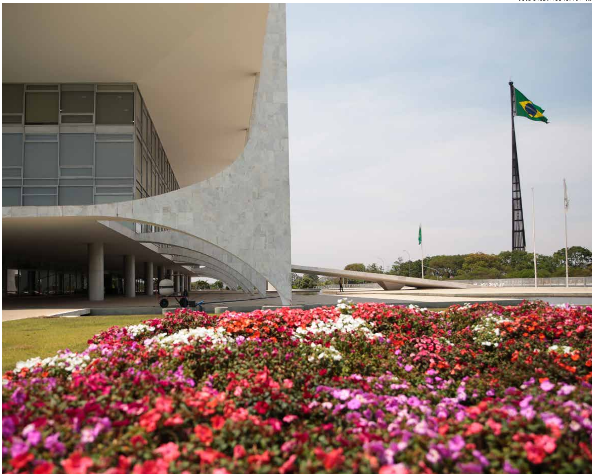
Disputa ocorre em torno da Presidência da República nas eleições deste ano