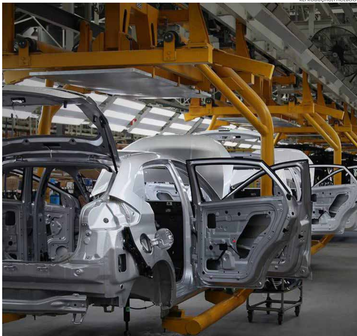
Liminar ainda pode ser questionada

Justiça do Trabalho concedeu decisão liminar que suspende demissões anunciadas pela montadora Caoa Chery no município de Jacareí, no interior paulista