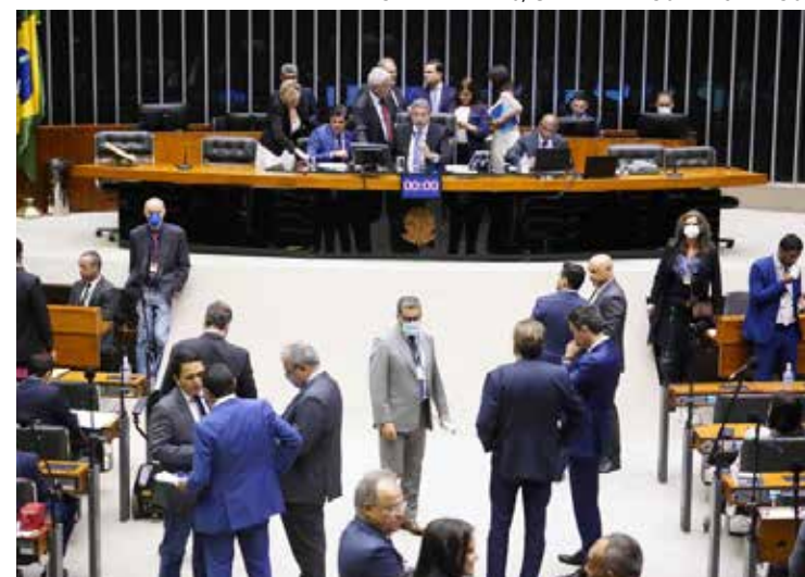
No mesmo dia, MP passou pela Câmara dos Deputados e pelo Senado Federal