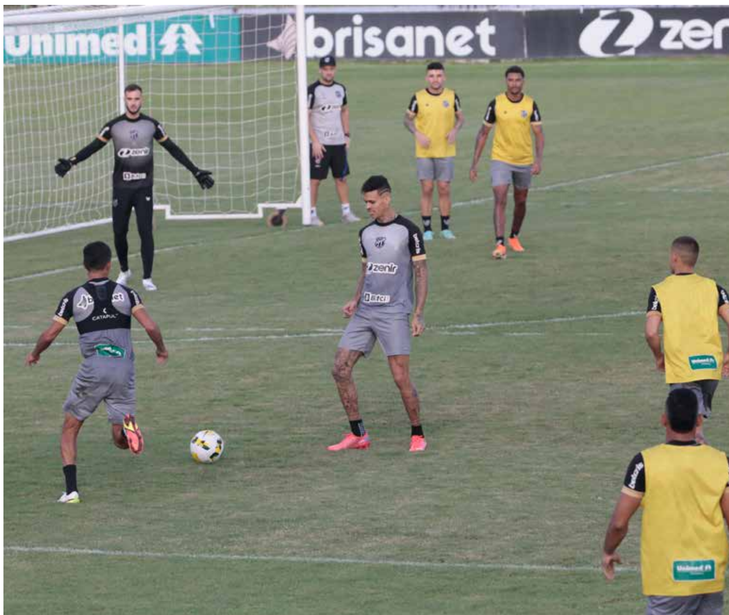
Ceará treinou ontem (31) para o jogo de logo mais; Fortaleza treinou também

DAVID MOTA ESPECIAL PARA OPINIÃO CE david.mota@opinioaoce.com.br