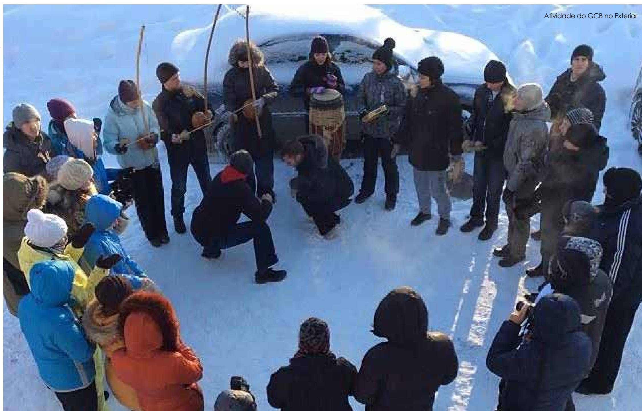
Atividade do GCB no Exterior

Intuito do Grupo Capoeira Brasil é levar o esporte além das fronteiras, educar integrantes, formar cidadãos e dar oportunidade a crianças e adolescentes em situação de vulnerabilidade