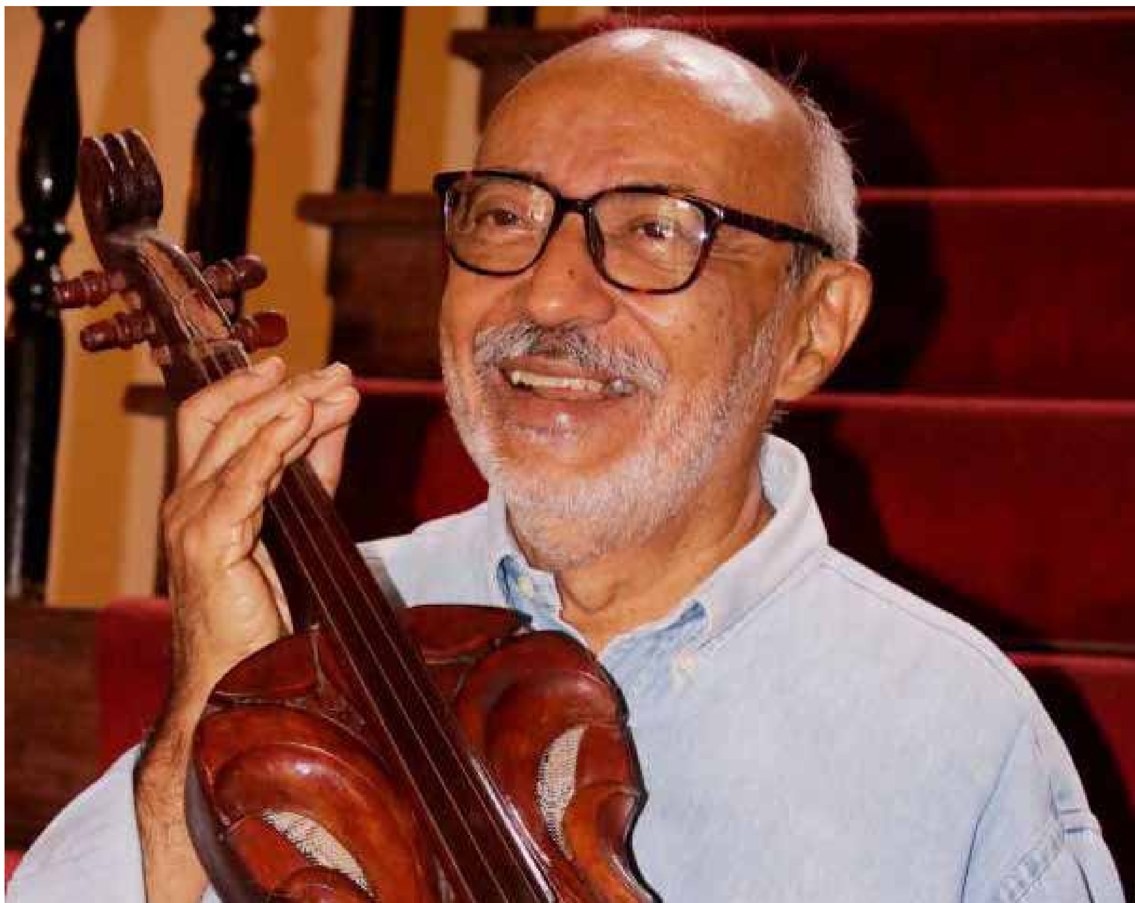
Professor faleceu em abril de 2021