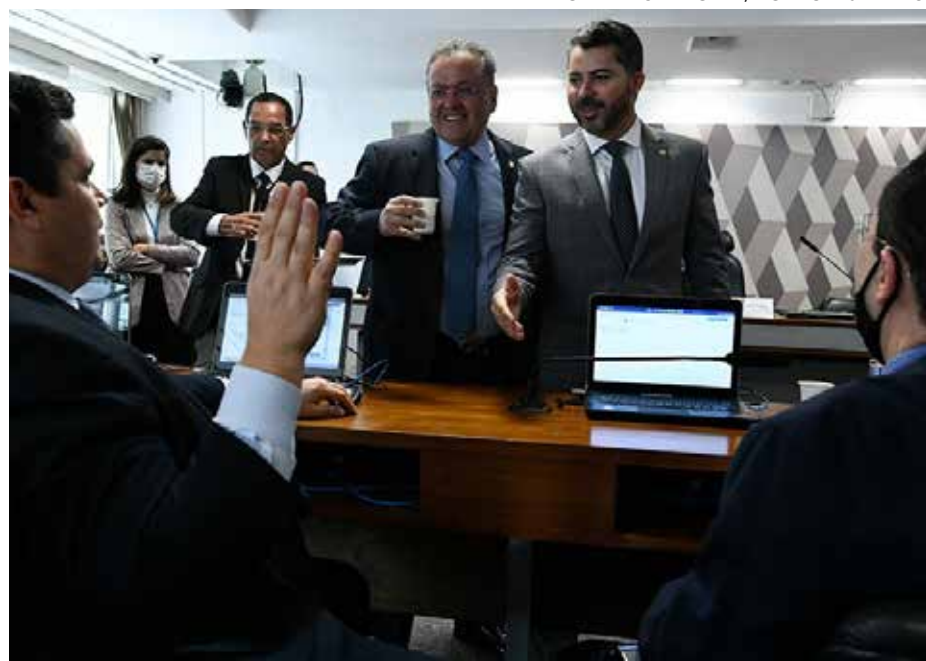
Pauta foi requisitada por Rodrigo Pacheco

A falta de quórum impossibilitou novamente a votação da Proposta de Emenda à Constituição (PEC) 110/2019, referente à Reforma Tributária, na Comissão de Constituição e Justiça (CCJ) ontem (31). Diante da presença de apenas 13 senadores - são necessários no mínimo 14 para deliberação, o presidente do colegiado, Davi Alcolumbre (União Brasil-AP), cancelou a reunião. Na segunda-feira (30), o presidente do Senado, Rodrigo Pacheco, disse que havia solicitado a Alcolumbre que pautasse a PEC.