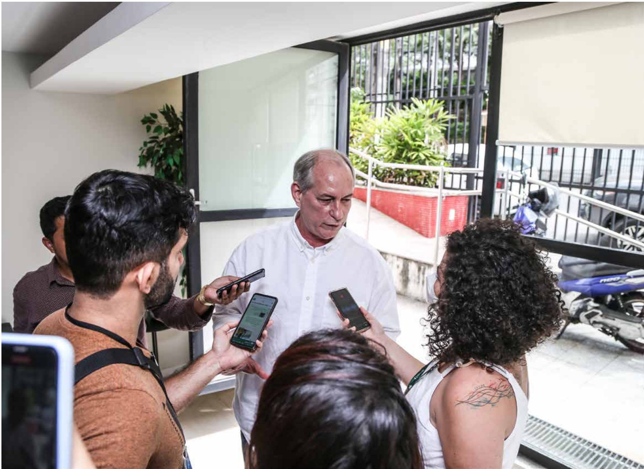
Encontro ocorreu na sede do PDT Ceará, no Meireles