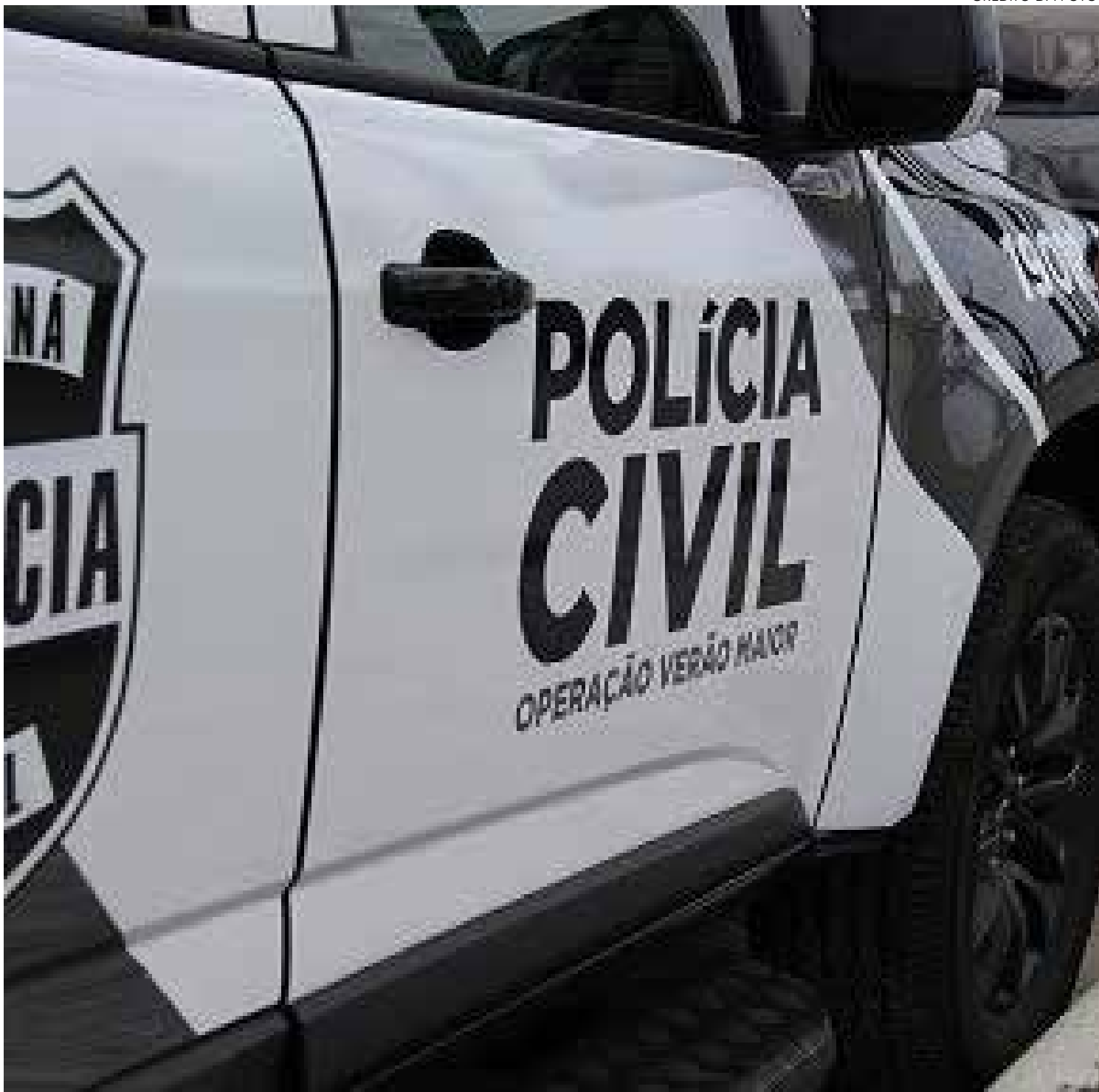
CRÉDITO DA FOTO