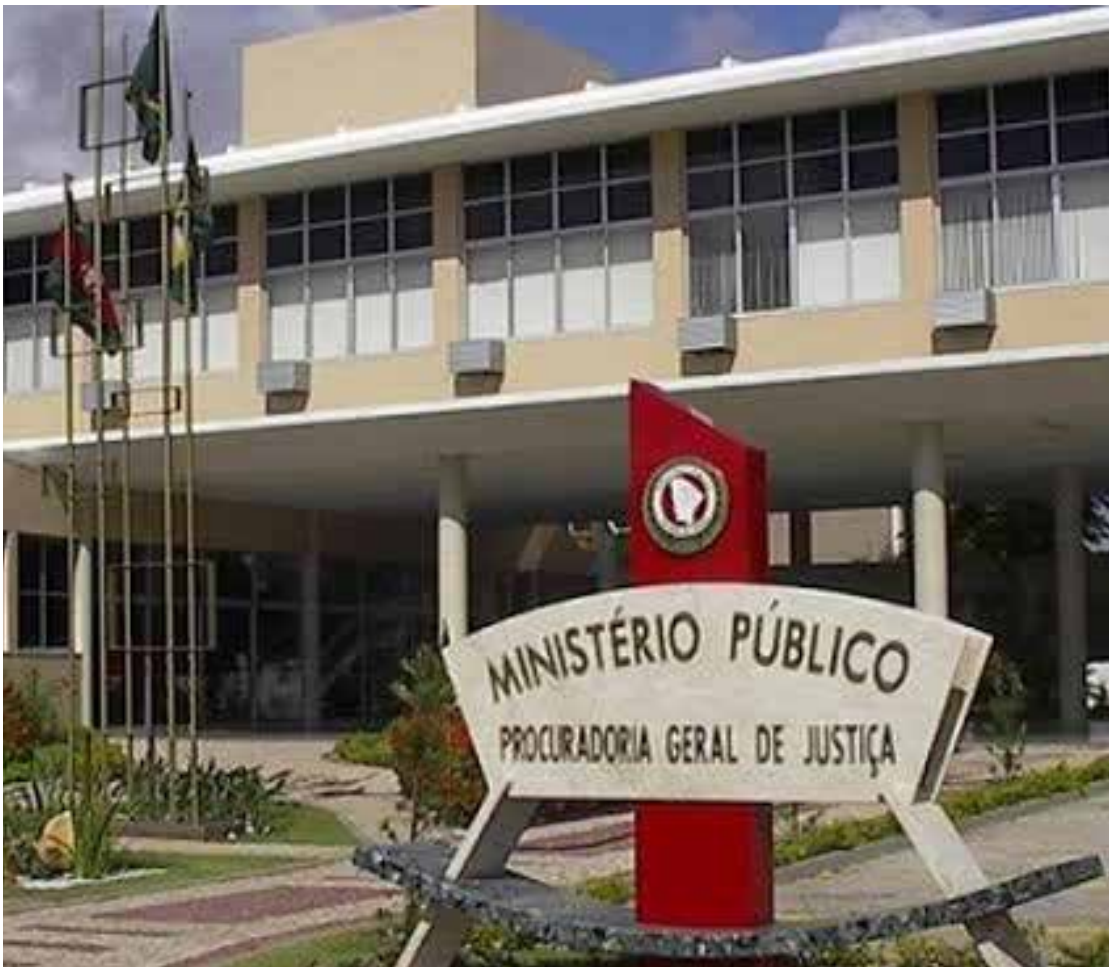
Afirmções são do Ministério Público do Ceará

“O município de Forquilha reafirma seu compromisso com a hígidez das contas municipais, com o respeito ao Poder Judiciário e Ministério Público, tendo colaborado de forma responsável e diligente com todos os requerimentos ministeriais até o momento realizados. Os procedimentos legais para as contratações necessárias à realização do evento foram também seguidos atentamente. Por fim, todos os esclarecimentos serão prestados ao poder judiciário dentro do prazo fixado na intimação recebida na última sexta-feira, dia 8 de julho”, finaliza a nota.