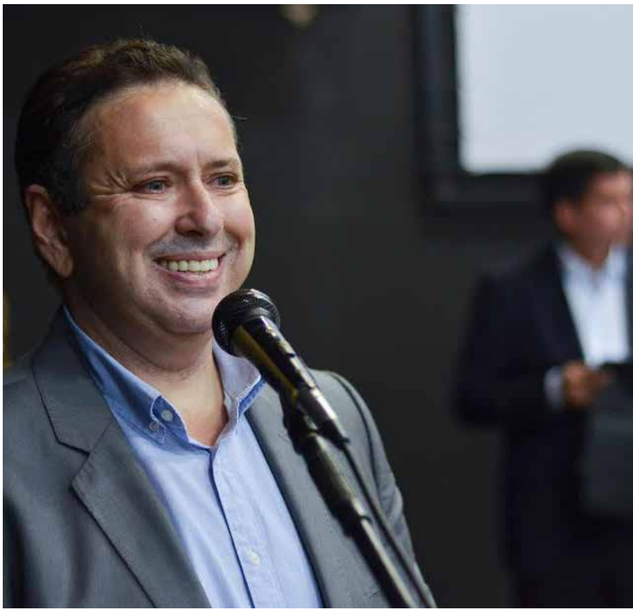
Domingos Filho é presidente estadual do PSD