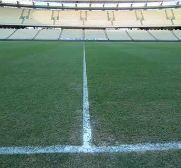
Problema ocorreu no domingo

O Ministério Público do Estado do Ceará (MPCE), por meio do Núcleo do Desporto e Defesa do Torcedor (Nudtor), oficiou ontem (11) a Federação Cearense de Futebol (FCF), a Secretaria de Esporte e Juventude (Sejuv) e a própria Arena Castelão para que, em até 24 horas, seja regularizada a situação dos geradores de energia do estádio. Caso não seja comprovado que o problema foi sanado, o Nudtor poderá recomendar que a praça esportiva não receba jogos, visando garantir a segurança do torcedor. Até o fechamento deste conteúdo, a falha seguia. Durante a partida entre Fortaleza e Palmeiras, na noite deste