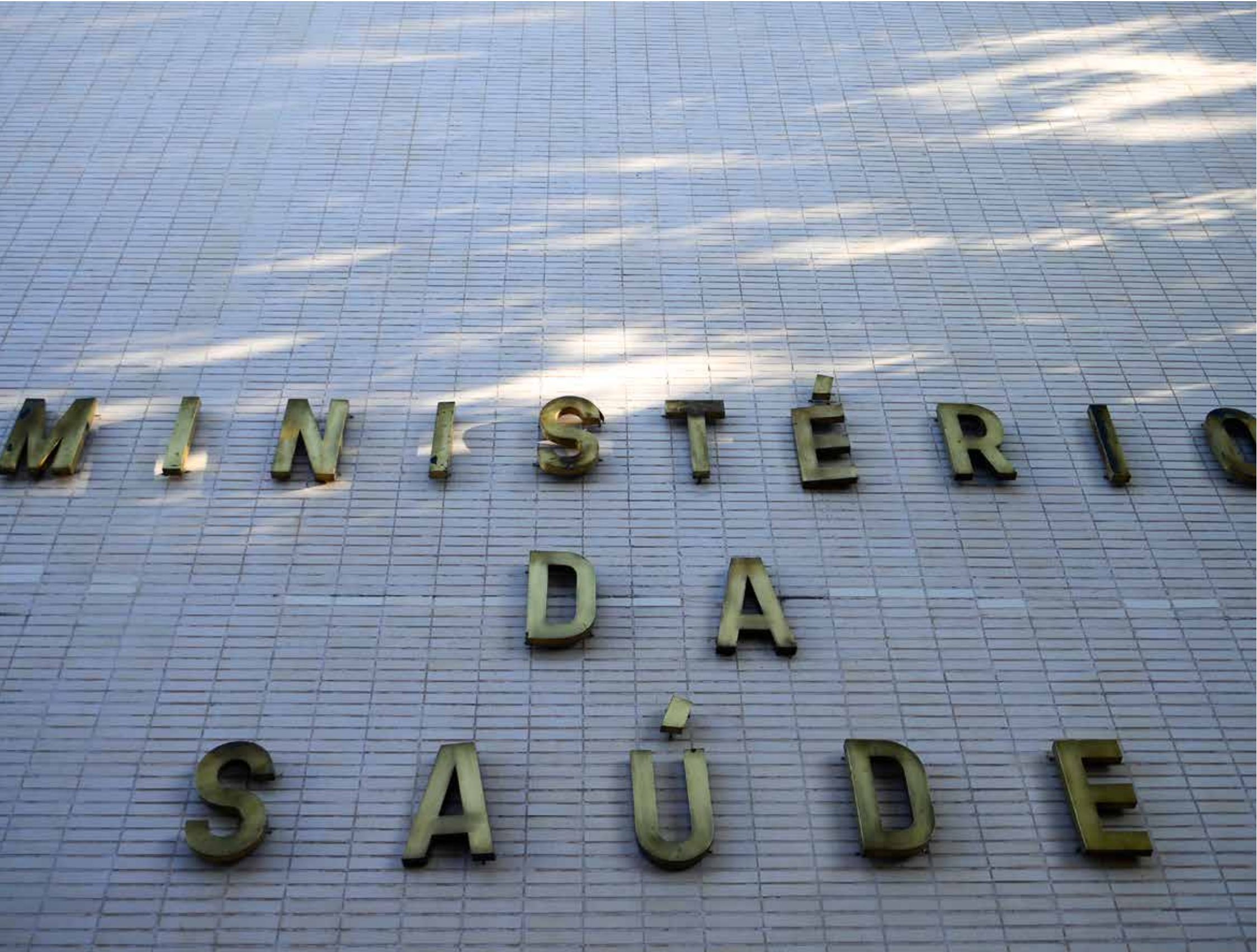
Dados nacionais ficam a cargo do Ministério da Saúde