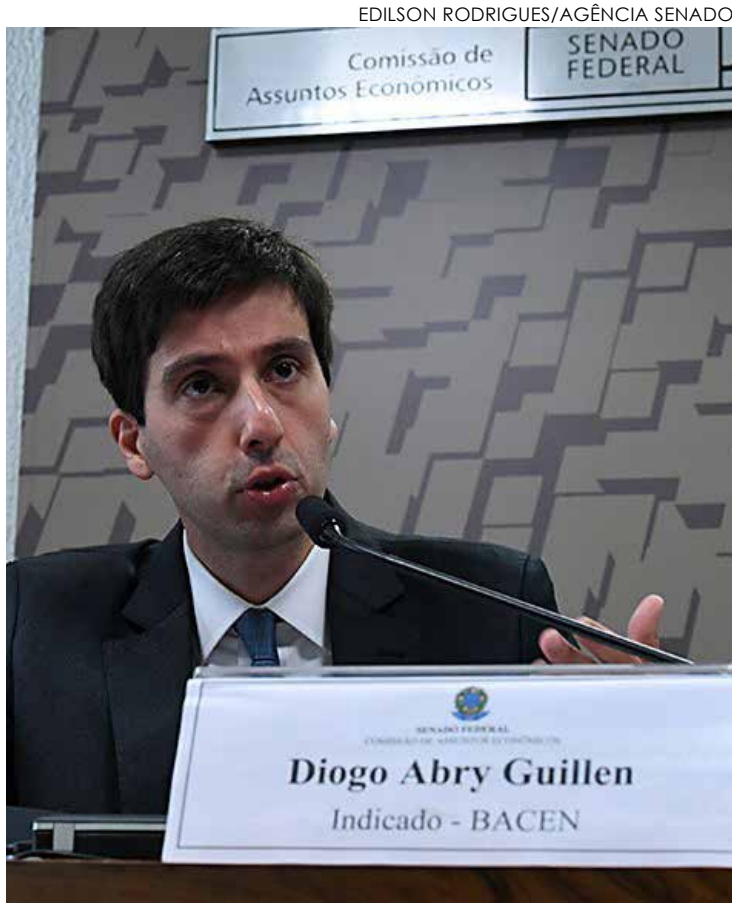
Gestor participou de um webinar organizado pelo Credit Suisse